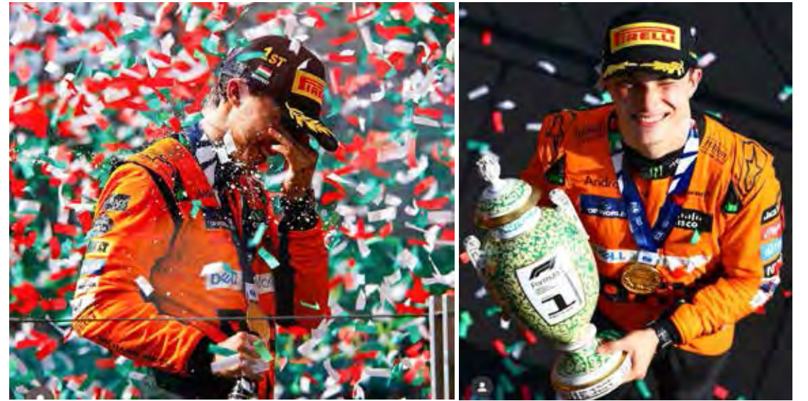
Oscar Piastri venceu GP da Hungria; foi sua primeira vitória na F1