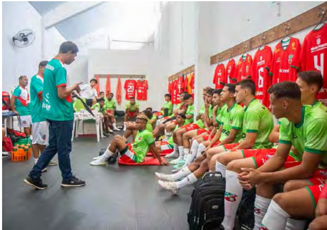
Reabilitação é palavra de ordem para o Sub-20 do Velo Clube