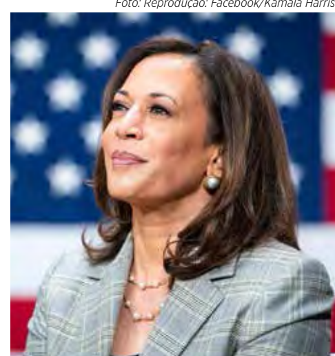
A vice-presidente, Kamala Harris, vai concorrer à presidência dos EUA após desistência de Joe Biden

“Foi a maior honra da minha vida servir como seu presidente. E, embora tenha sido minha intenção buscar a reeleição, acredito que seja do melhor interesse do meu partido e do país que eu me afaste e me concentre apenas no cumprimento de meus deveres como presidente pelo restante do meu mandato”, escreveu Biden em uma carta publicada na rede social.