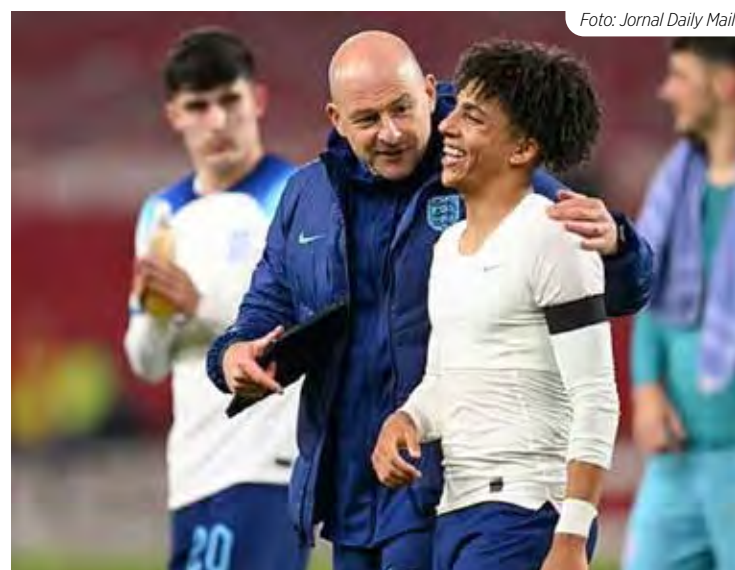
O zagueiro do Man City elogiou o técnico da seleção inglesa sub-21 por suas habilidades de gerenciamento de pessoas

uma seleção bastante nova e talentosa, certamente este cargo é um dos mais cobiçados do mundo.