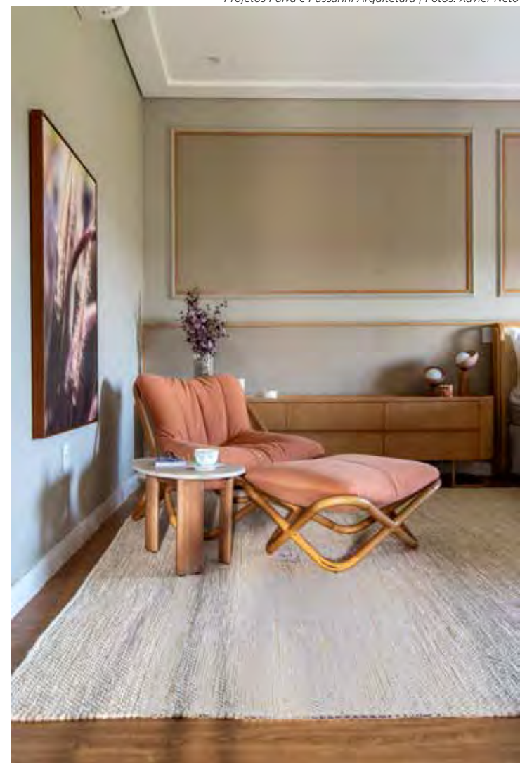
A poltrona disposta na espécie de sala íntima do dormitório também é benéfica para os momentos de pausa para refletir antes de uma decisão

A ausência, o excesso ou a luz errada incorre em desconforto visual, fadiga e o prejuízo na produtividade. A luz natural é a mais indicada, uma vez que contribui para o aumento da concentração e redução