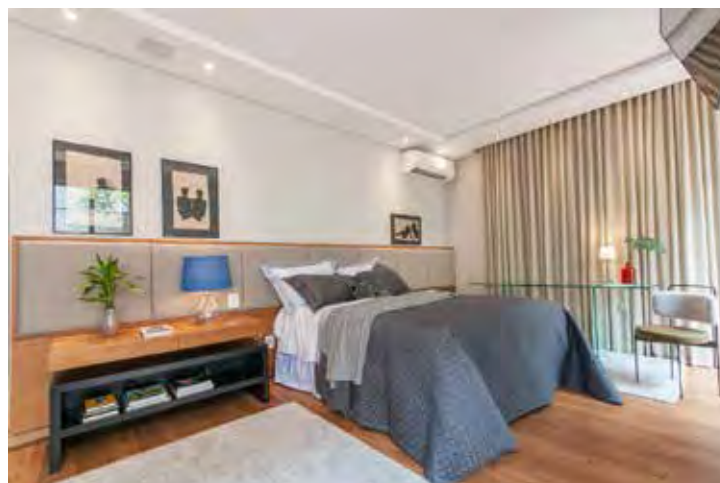
Nesse dormitório, a mesa de vidro foi escolhida para trazer modernidade e leveza ao ambiente. Com um design clean e contemporâneo, ela se integra perfeitamente ao espaço