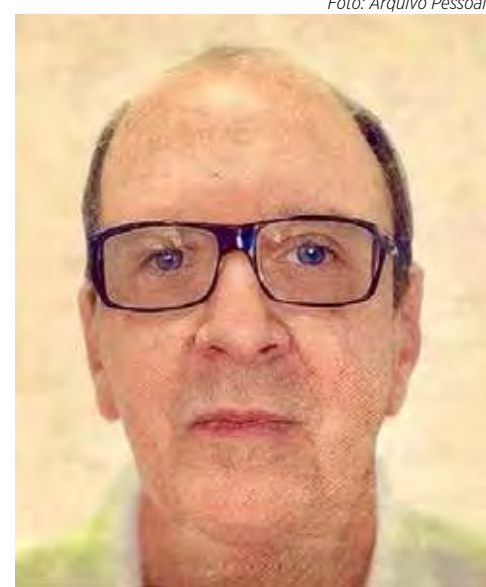
Comerciante morreu aos 82 anos no último domingo em Rio Claro