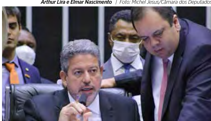
Arthur Lira e Elmar Nascimento | Foto: Michel Jesus/Câmara dos Deputados

• A sucessão de Lira mobiliza até mesmo quem está fora da disputa. Ontem, Arthur Lira voltou a se reunir com o ex-presidente Jair Bolsonaro (PL) e esse foi um dos temas discutidos, além da regulamentação da reforma tributária. É