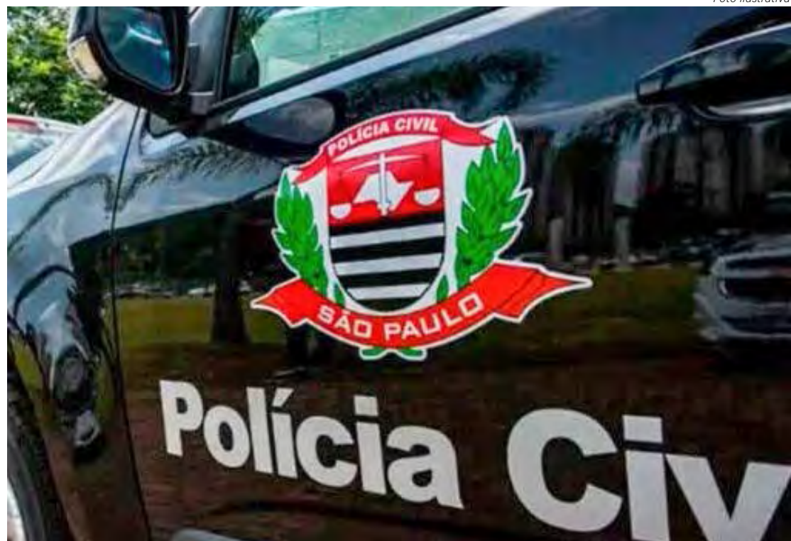
Caso será investigado pela Polícia Civil e haverá realização de perícias

Vale ressaltar que em fevereiro do ano passado um crânio humano foi encontrado no Horto Florestal de Rio Claro. E em abril do mesmo ano, outro crânio foi