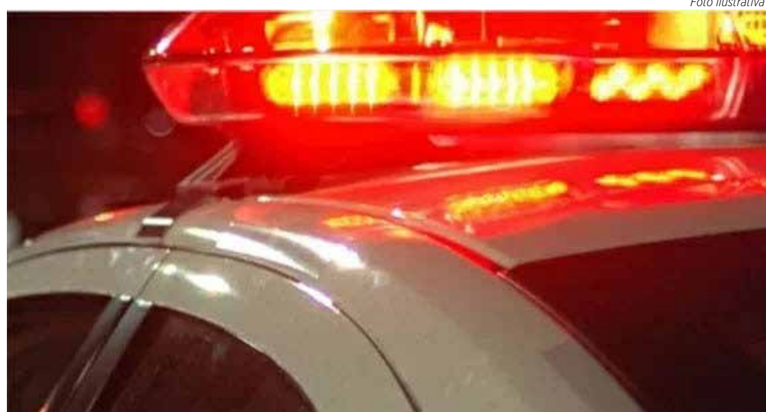
A policial foi encaminhada para atendimento e exames médicos

Segundo o registro policial do caso, a ocorrência foi por volta de 20h40 na Estrada Municipal do Sobrado, na zona rural do município, onde o efetivo do 10º BAEP (Batalhão de Ações Especiais da Polícia) estava realizando uma