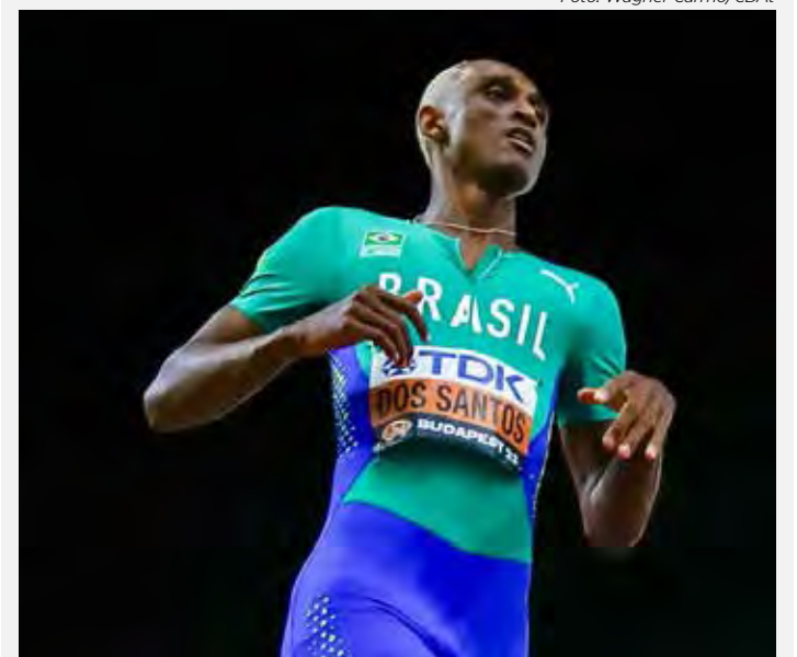
Alison dos Santos compete na prova dos 400m com barreiras