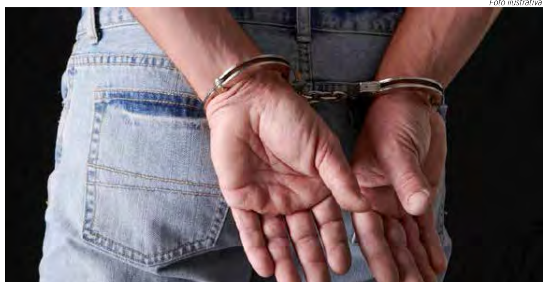
A vítima poderá solicitar medida protetiva contra o agressor

A senhora contou aos policiais que ele teria chegado em casa sob efeito de bebidas alcoólicas, passando a quebrar móveis