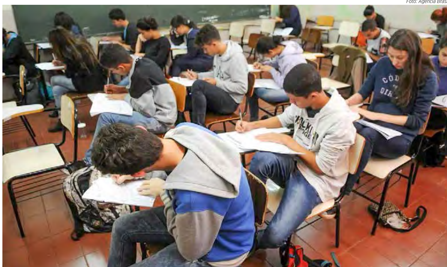
Estudantes fazem atividade em sala de aula

Outra mudança no novo Ensino Médio, proposta pelo Senado e mantida na Câmara, prevê menos liberdade nos itinerários formativos, que agora deverão seguir diretrizes nacionais, a serem elaboradas pelo Conselho Nacional de Educação (CNE), colegiado formado por representantes da sociedade ci-