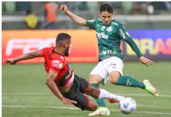
Palmeiras, de Raphael Veiga enfrenta Atlético-GO, no Allianz Parque