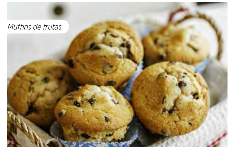
Muffins de frutas