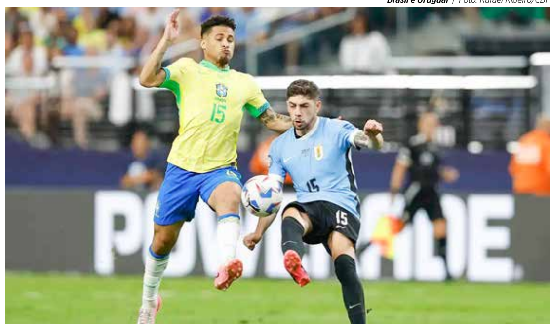
Brasil e Uruguai

ção da seleção brasileira, Vini Jr., ainda pode perder a Bola de Ouro 2024, entregue ao melhor jogador de futebol do mundo no ano. Antes da Copa América, ele era candidato ao prêmio e o título da competição iria carimbar de vez sua conquista ao troféu. Com a eliminação precoce do Brasil, a imprensa internacional já questiona a escolha de Vini Jr. como Bola de Ouro 2024. Melhor para o inglês Jude Bellingham e o francês Kylian Mbappé que voltaram para a disputa do prêmio. Ambos seguem vivos na Eurocopa e, mesmo sem grande brilho, podem superar o brasileiro na corrida pela premiação. Vini Jr. deve estar lamentando esse fiasco da seleção que pode lhe tirar um prêmio que já estava praticamente em suas mãos.