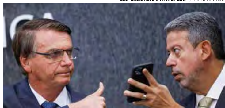
Jair Bolsonaro e Arthur Lira

dos impostos está sendo bem utilizado pelo tribunal. Ironias à parte, o que chama a atenção é que no dia seguinte ao curso ministrado em 26 de junho, foi proferida uma palestra (“O juiz e a sociedade”), também de duas horas de duração, que custou R$ 516,00. Por que a discrepância de valor? Imagina só os casos similares, em que a verba pública é destinada para fins de necessidade duvidosa, que não são divulgados e não chegam ao conhecimento da sociedade? Que tal um curso aos juízes sobre como administrar bem o dinheiro público e quais gastos podem ou não ser feitos? Fica a dica.