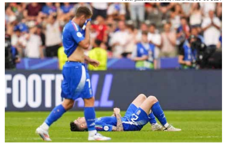
Itália cai diante da Suíça

Aos 38, Dani Olmo dá o golpe de misericórdia e amplia a vantagem