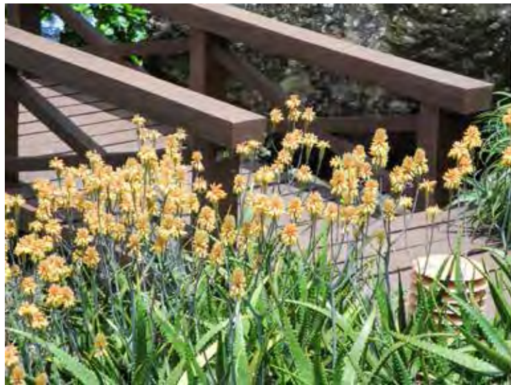
A Aloe Vera, conhecida popularmente como Babosa, é uma planta suculenta resistente, que pode suportar temperaturas até 5°C