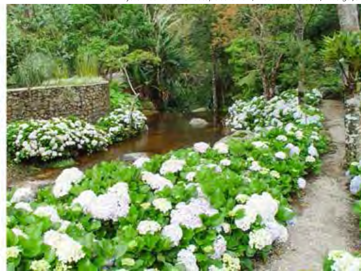
Projeto: Escritório Landscape Jardins | Foto: MCA Studio/Divulgação