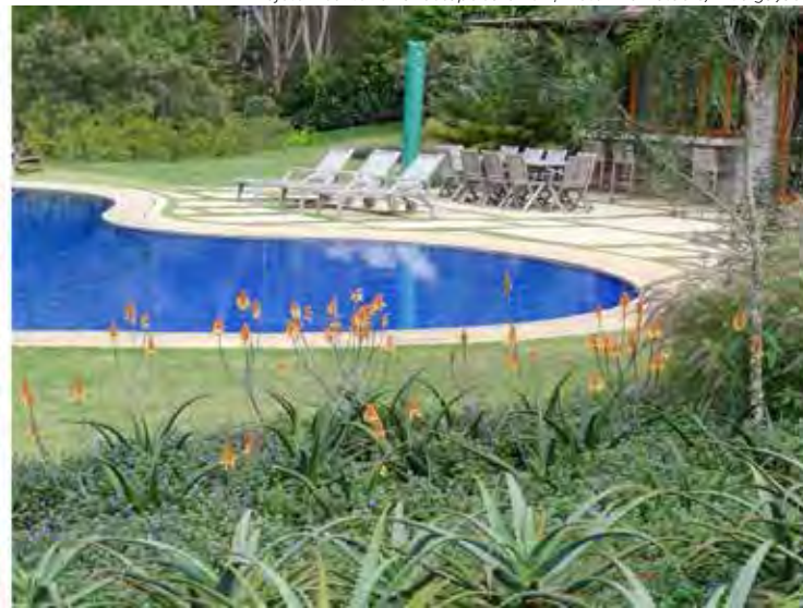
Projeto: Escritório Landscape Jardins | Foto: MCA Studio/Divulgação