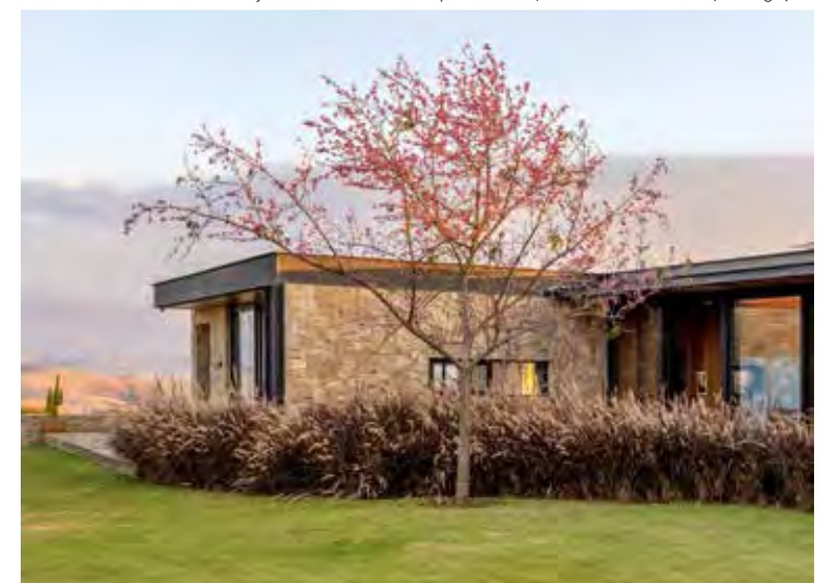
As florações de cerejeiras são um dos presentes proporcionados pelo Inverno em regiões como o Sudeste e Sul do país