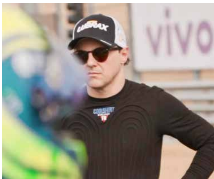
Massa agora está em quarto lugar na classificação do campeonato

A Stock Car volta a acelerar em Goiânia entre os dias 26 e 28 de julho. A categoria conta com transmissão da Band, canais Sportv e em seu canal oficial no Youtube.