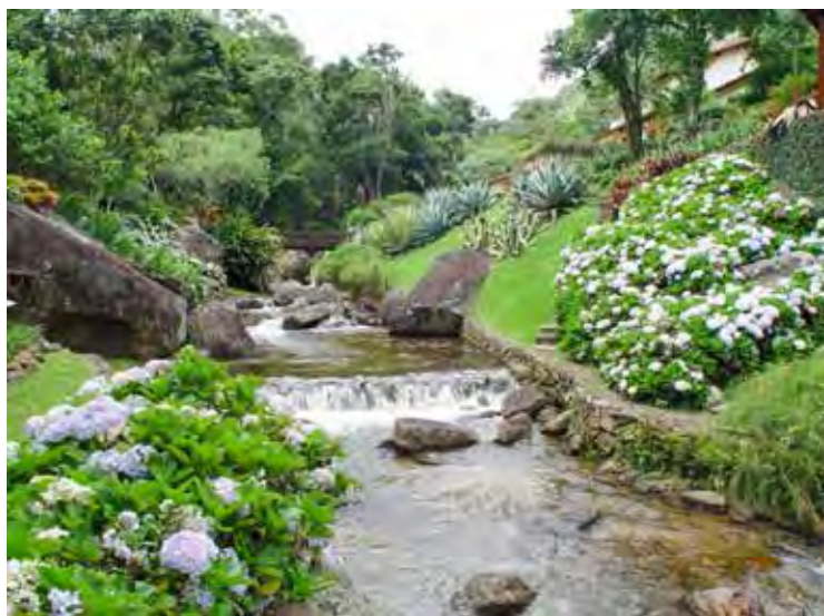
A beleza das hortênsias especialmente em regiões mais frias