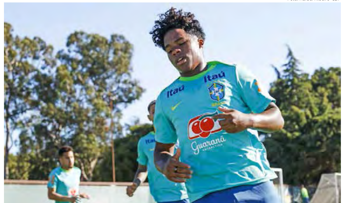
Endrick vive a expectativa de estreiar na Copa América

Colômbia: Vargas; Munoz, Mina, Sanchez, Mojica; Lerma, Uribe, J. Rodriguez; Jhon Arias, Borre e Luis Diaz. Treinador: Nestor Lorenzo.