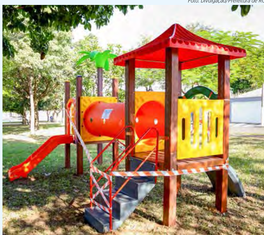
Playground instalado em praça no bairro Jardim Portugal