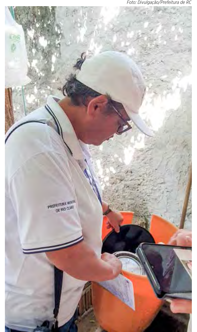
Agente de endemias faz vistoria durante mutirão no Jardim Guanabara

No estado de São Paulo, o painel aponta 1.910.560 casos prováveis de dengue e 1.265 óbitos, tendo ainda 1.256 em investigação. A taxa de incidência era de 4.301 casos para cada 100 mil habitantes.