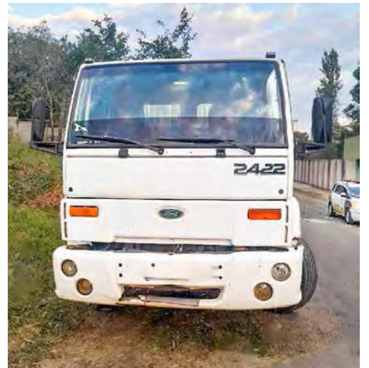
Caso aconteceu na quinta-feira, em Rio Claro

O caminhão foi encaminhado ao pátio credenciado para que fossem tomadas as medidas cabíveis. A Guarda Civil e a empresa de rastreamento seguem acompanhando o caso para garantir a segurança e a devolução do bem ao proprietário.