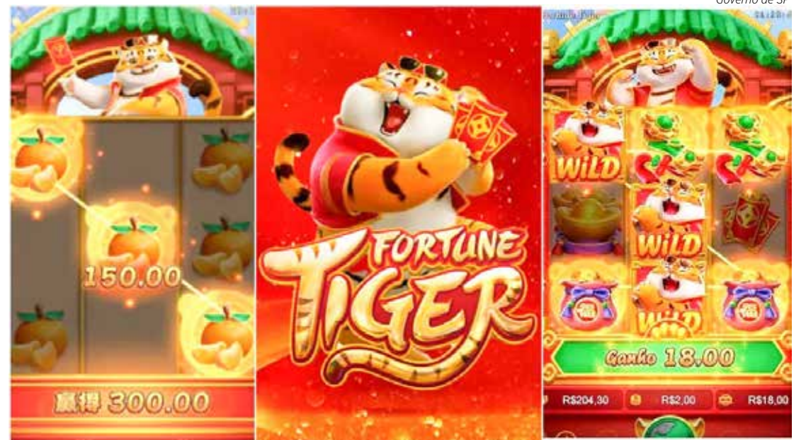
Game simula uma espécie de caça-níquel, no qual o jogador faz uma aposta e aciona uma roleta em busca de sequências de figuras repetidas para recompensas em dinheiro

Com o alto volume de denúncias, a Polícia Civil tem realizado operações e feito indiciamentos contra os golpistas. Veículos e imóveis também já foram apreendidos. Além da contravenção penal devido ao jogo de azar, os envolvidos podem responder por estelionato, crime contra a economia popular, associação criminosa e lavagem de dinheiro.