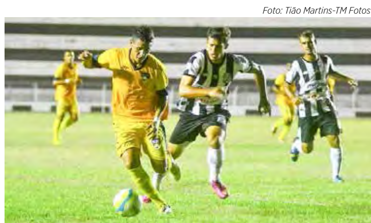
Inter e São José se enfrentam em Limeira