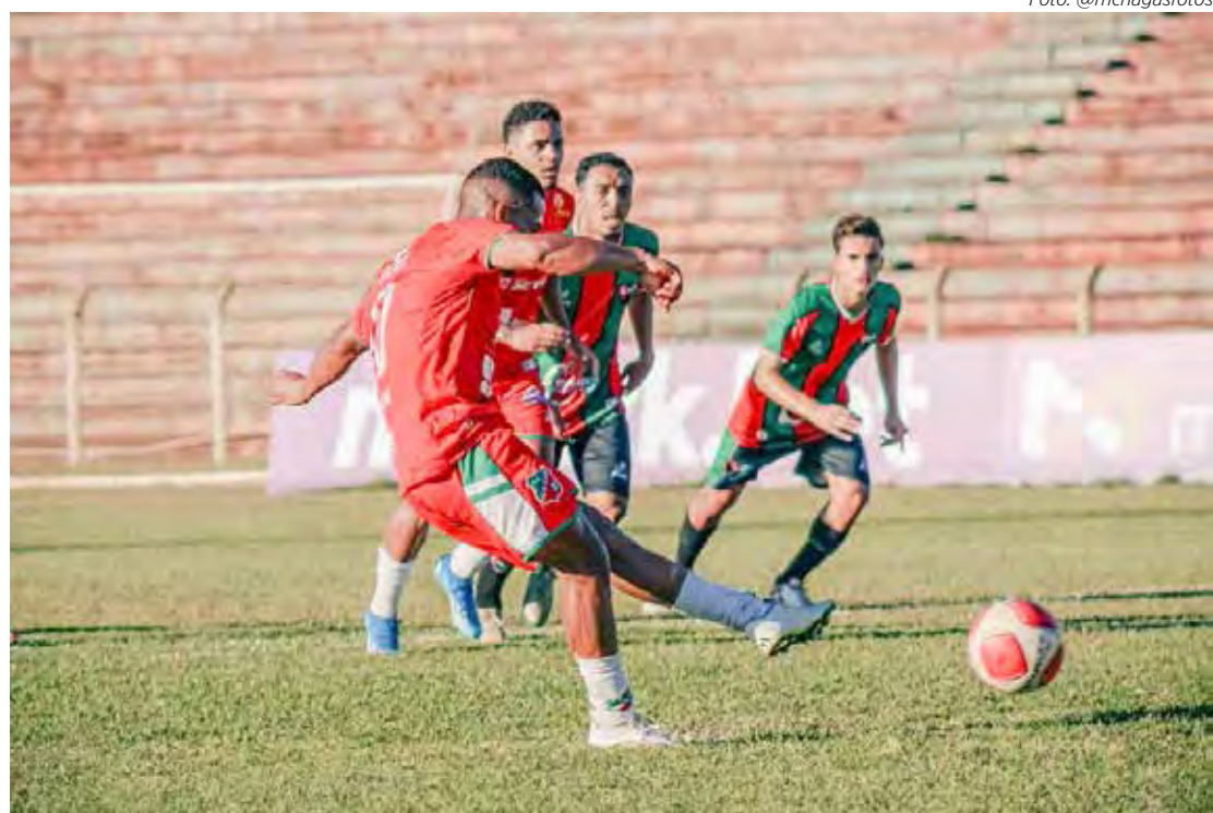
Velo volta a jogar no dia 20 pelo Paulista Sub-20