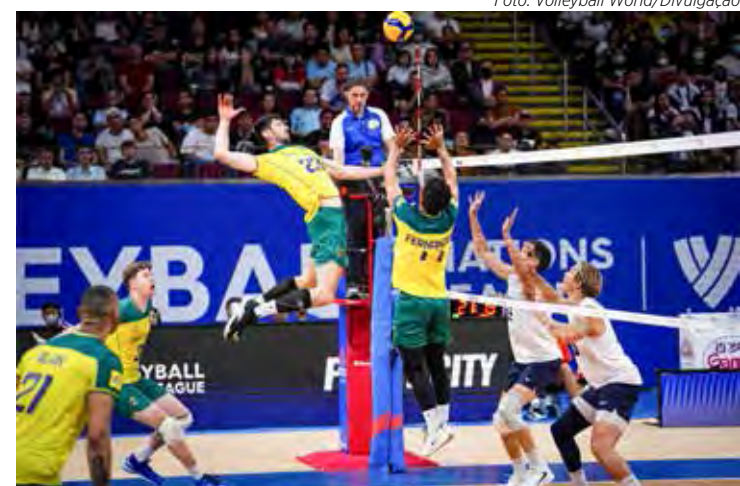
Brasil perdeu para os Estados Unidos no tie-break