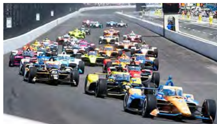
Corrida em Laguna Seca será no espetacular circuito de uma das curvas mais difíceis do mundo: a SACA-ROLHAS

Siegel, da Califórnia, inclusive venceu as 24 Horas de Le Mans na classe LMP2 com a equipe United Autosports, que é de propriedade do