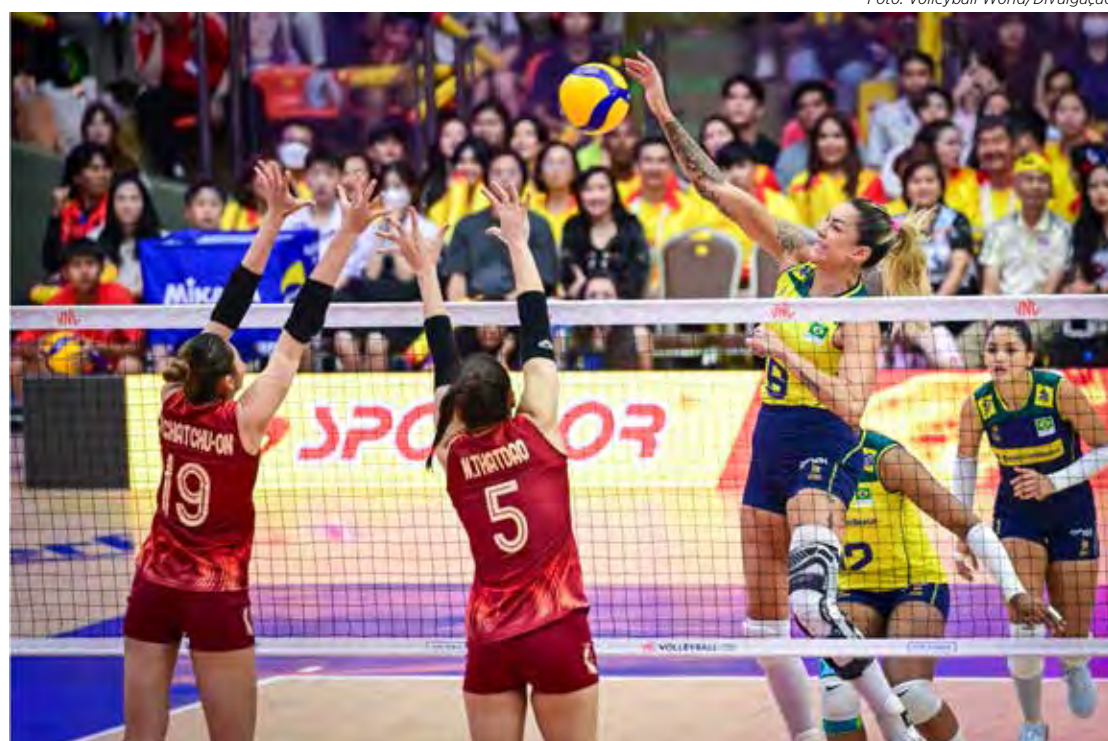
Brasil venceu a Tailândia e avançou para a semifinal da VNL