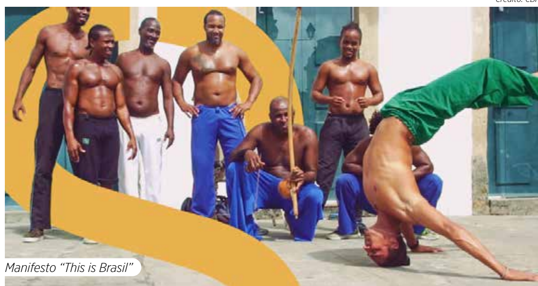
Manifesto "This is Brasil"

A campanha estreou nas redes sociais e na TV nesta quinta-feira, dia 20 de junho. Preparem-se para vibrar com "This is Brasil" e torcer pela amarelinha com ainda mais paixão e orgulho.