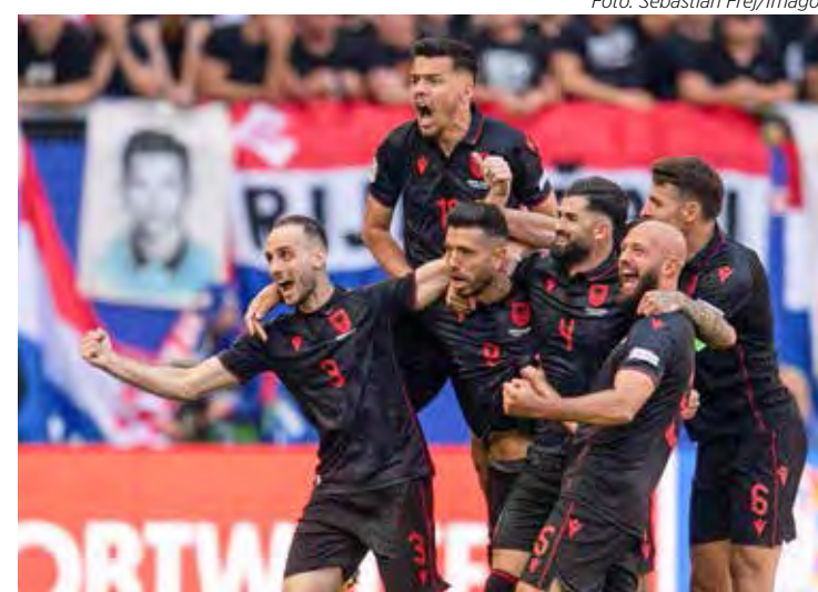
Equipe albanesa comemora o segundo gol da equipe no jogo contra a Croácia

A equipe portuguesa que se atrasou para ir à Alemanha, chegaram no dia anterior, de madrugada e o desgaste foi muito grande, com apenas um treino antes do jogo contra a República Tcheca.