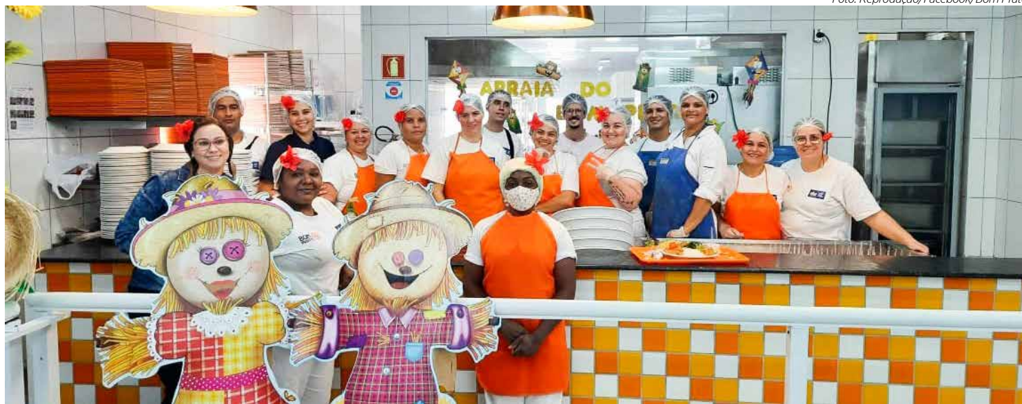
Equipe do Bom Prato no Arraial Junino de 2022