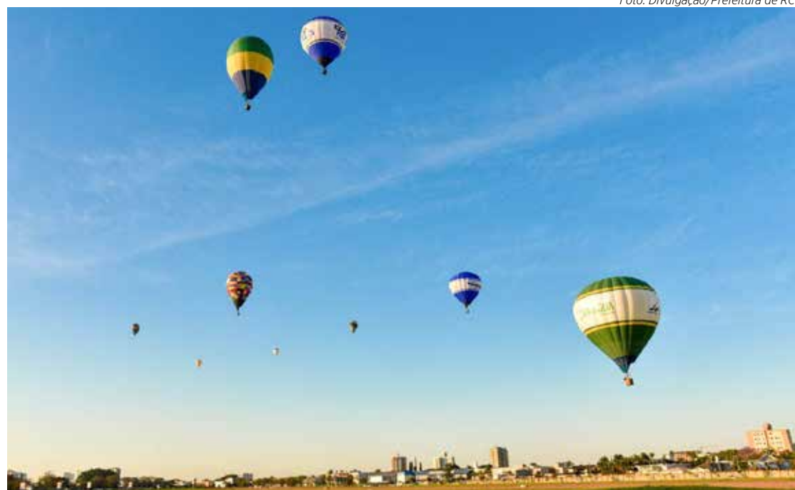
Campeonato de balonismo terá participação de mais de 30 balões