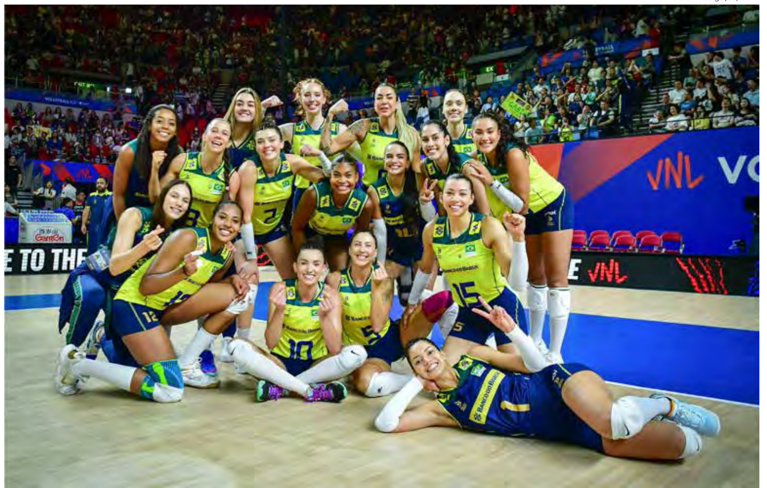
Seleção feminina terminou invicta a fase de classificação da Liga das Nações

Atualmente, o Brasil é líder do ranking mundial de vôlei feminino e por isso será cabeça de chave dos grupos para as Olimpíadas de Paris