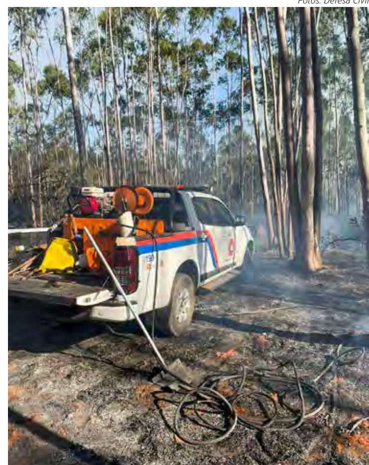
Defesa Civil do estado de São Paulo emitiu alerta para alto risco de incêndios