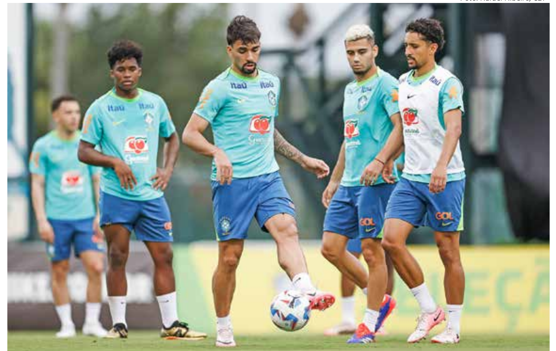
Seleção Brasileira treina no ESPN World Wide Complex em Orlando