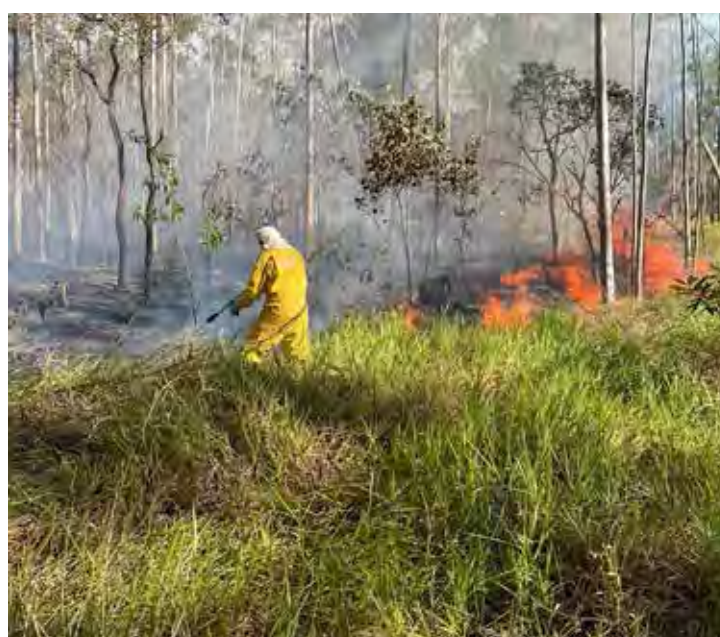
Fogo atingiu área próxima à Vila Industrial, antiga estrada de Araras

Atitudes como queimar lixo, promover limpeza de terrenos baldios com fogo, jogar bitucas de cigarros em acostamentos de rodovias, e mesmo a soltura de balões (que é crime) agravam ainda mais os riscos de incêndios que causam danos à saúde, além de poderem provocar acidentes em rodovias, e levar a prejuízos ambientais e patrimoniais.