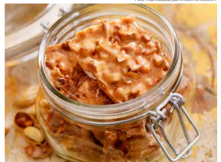
Pé de moleque Fit