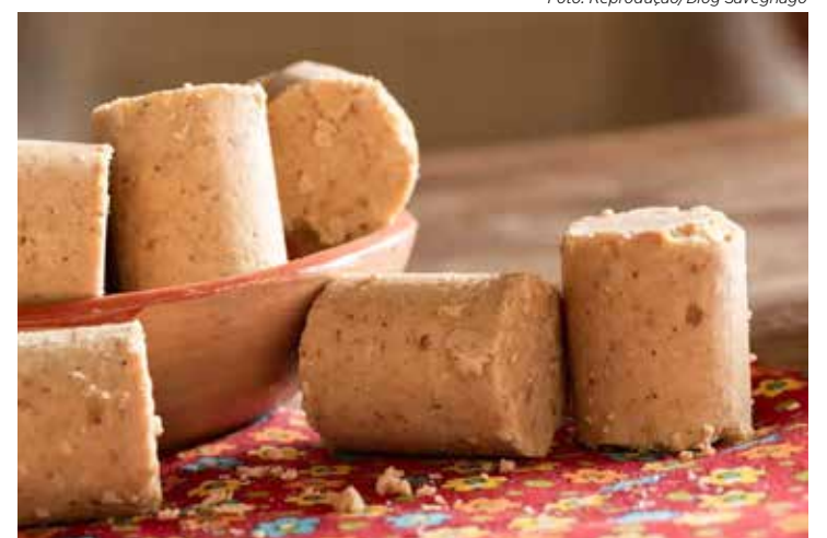
Paçoca low carb