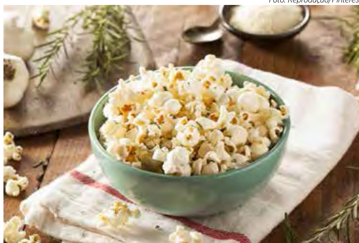
Pipoca funcional com alecrim e açafrão