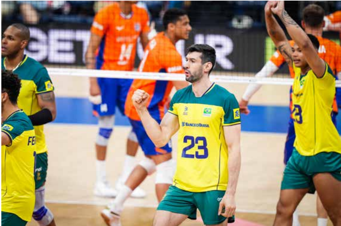
O Brasil vem de vitória sobre a Holanda por 3 sets a 1

A partida será nesta quinta-feira (20), às 8 horas (horário de Brasília), em Manila, nas Filipinas