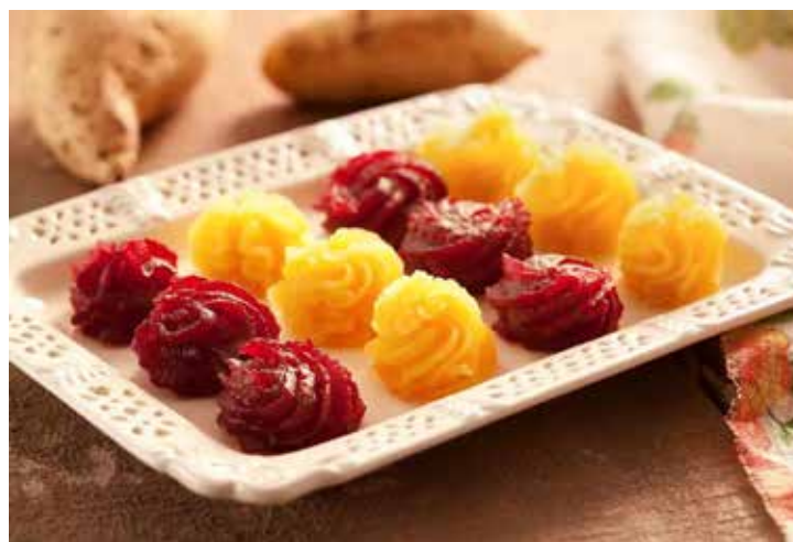
Doce de batata-doce vegano