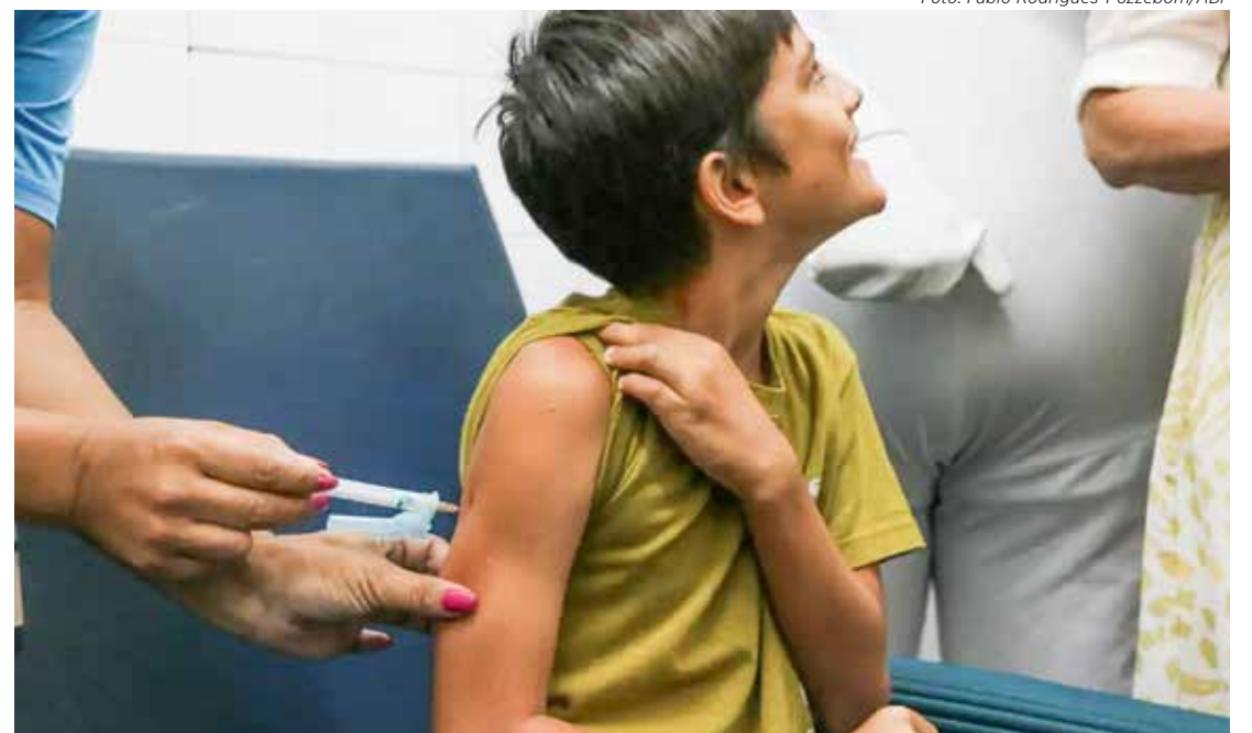
Menino toma a vacina contra a dengue em unidade de saúde

A vacina está disponível em cinco locais: Margarida Polak, de segunda a sexta-feira, das 8h30 às 10h; PSF Antonio Zonta (Bom Sucesso), de segunda a sexta-feira, das 8h30 às 10h, e de terça-feira, das 13h às 14h30; João Buschinelli, de segunda a sexta-feira, das 8h30 às 10h, e de terça e quinta-feira, das 13h às 14h30; Catarina Caetano Demarchi (Je-