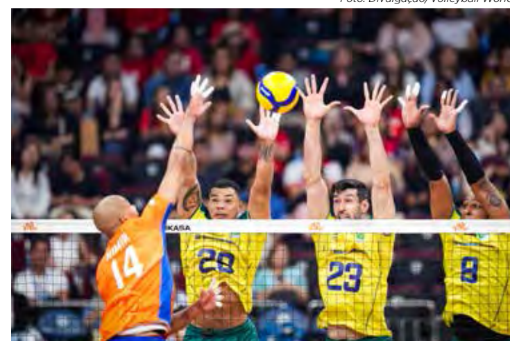
A seleção masculina de vôlei ganhou da Holanda por 3 sets a 1