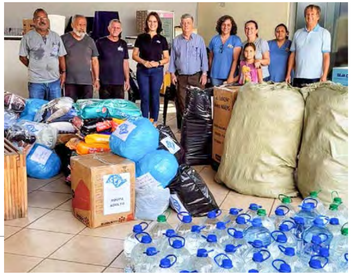
CPP arrecadou donativos para ajudar as vítimas das enchentes no RS

O CPP continua recebendo doações, que podem ser entregues na secretaria do clube, localizada na Rua 16-Be, 441, no Bairro do Estádio. O horário de funcionamento é das 8 às 18 horas, de segunda a sábado. A campanha aceita uma variedade de itens que são de extrema necessidade para os desabrigados e vítimas das enchentes, mas priorizando a doação de água. Para mais informações, entre em contato com a secretaria do clube pelo telefone (19) 3524-4563 ou pelo WhatsApp (19) 99347-1393.