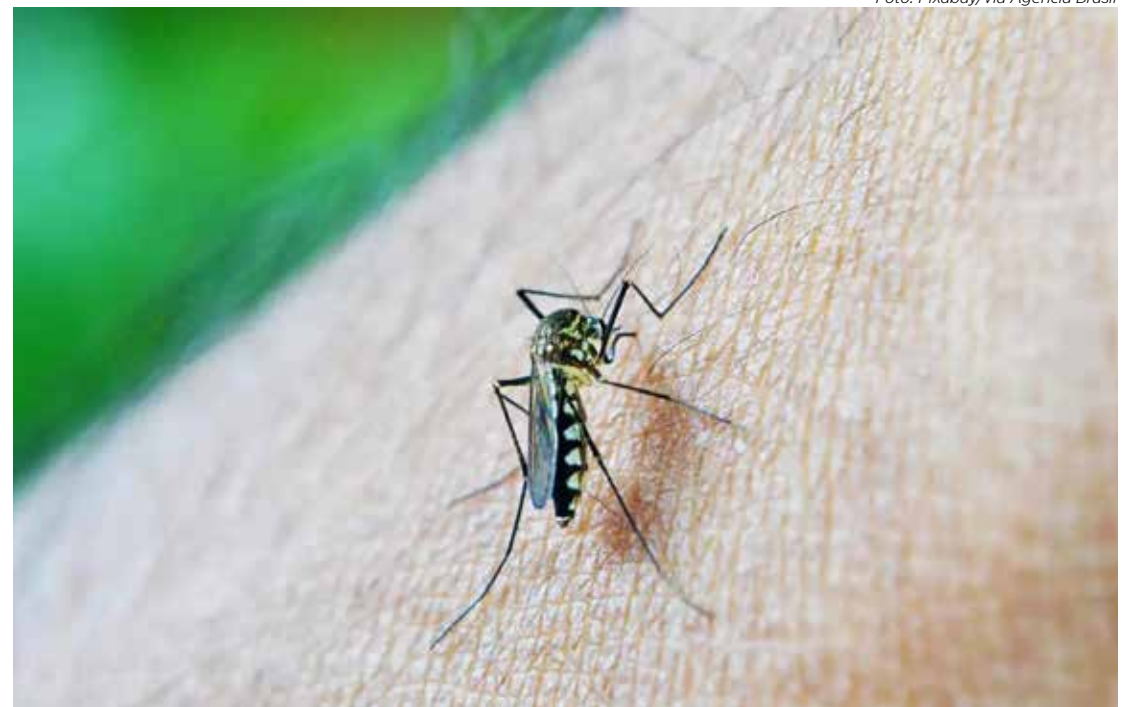
População deve eliminar os criadouros do mosquito Aedes aegypti