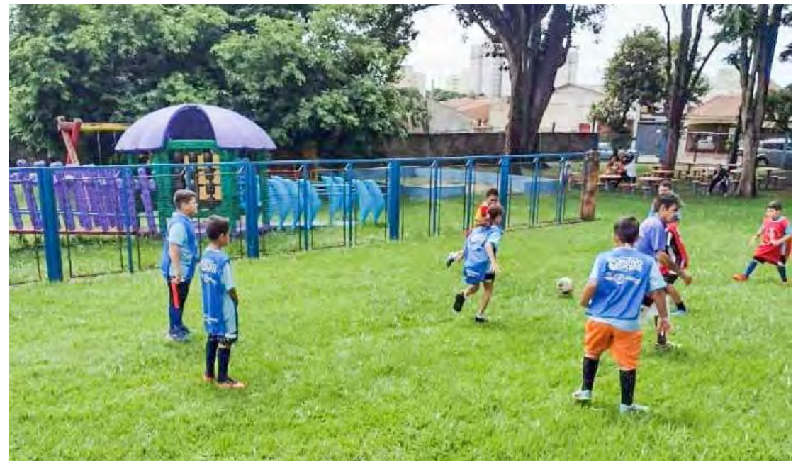
As aulas de futebol estão entre as modalidades esportivas ensinadas pelo projeto