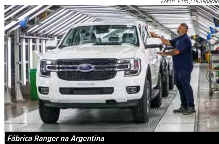
Fábrica Ranger na Argentina

“No Brasil, a Ranger foi a picape que mais cresceu em 2023, com um avanço de 42,5% e mais de 20.000 unidades. E este ano, até maio, as vendas subiram 41%, somando mais de 9.700 unidades”, afirma Pedro Resende, diretor de Vendas e Rede da Ford.