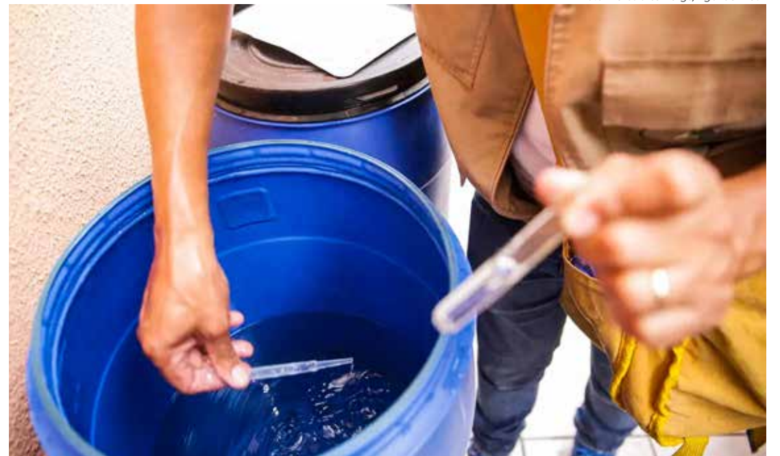
População deve eliminar os recipientes que possam acumular água parada