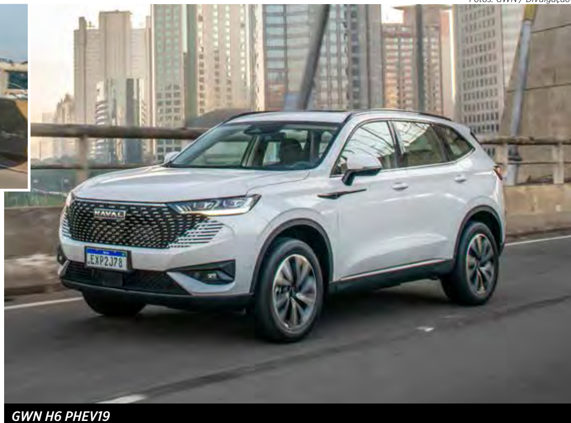
GWM H6 PHEV19

Os concorrentes mais próximos são o BYD Song Plus e o Caoa Chery Tiggo 8, ambos híbridos plug-in. Mas a GWM também considera que o PHEV19 vai brigar com modelos a combustão como Jeep Compass e Commander, Volkswagen Tiguan e Toyota RAV4 (plug-in).