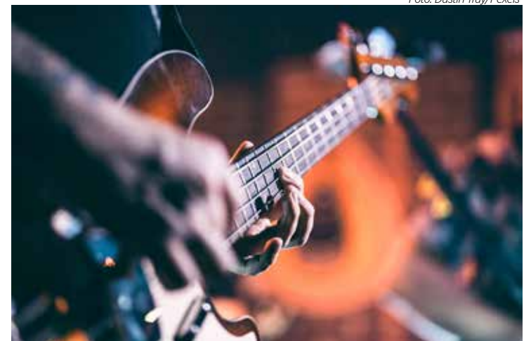
Bandas de rock podem se inscrever para festival em Santa Gertrudes

As inscrições podem ser feitas até sexta-feira, dia 21 de junho, por meio do link: https://forms.gle/TjSLoam4Hwd5mcNv8 . Terminadas as inscrições, uma reunião será realizada no dia 24/06, às 19h, no Centro Cultural “Isidoro Demarchi”, para definir como será feito o evento.