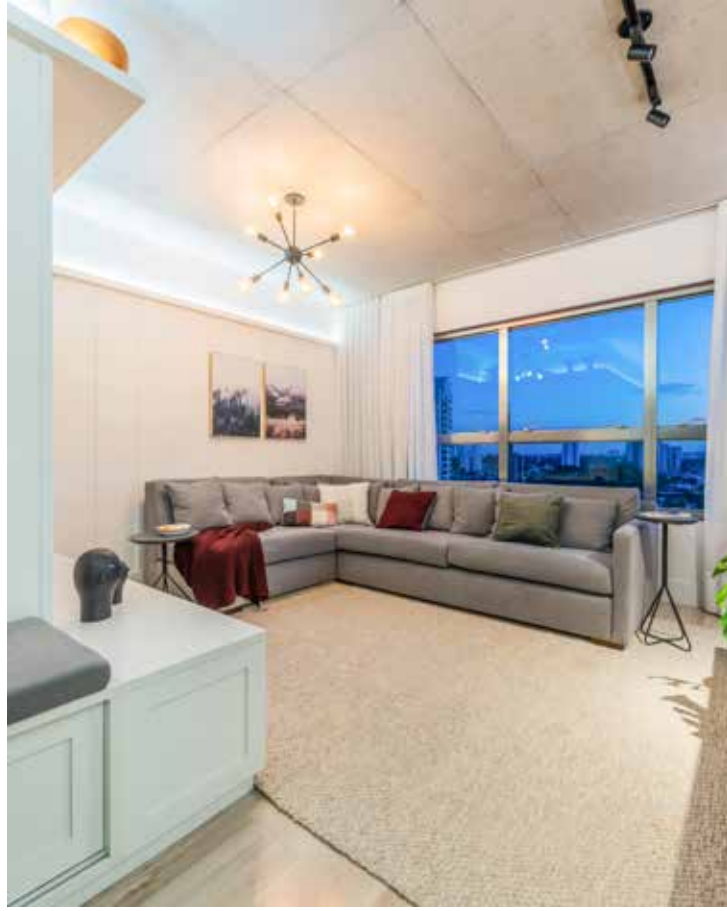
Nesta sala de estar, iluminação, cores suaves e móveis resultam em um lugar aprazível para os moradores

“Principalmente à noite, gosto de luzes indiretas, que realçam detalhes e texturas e que,