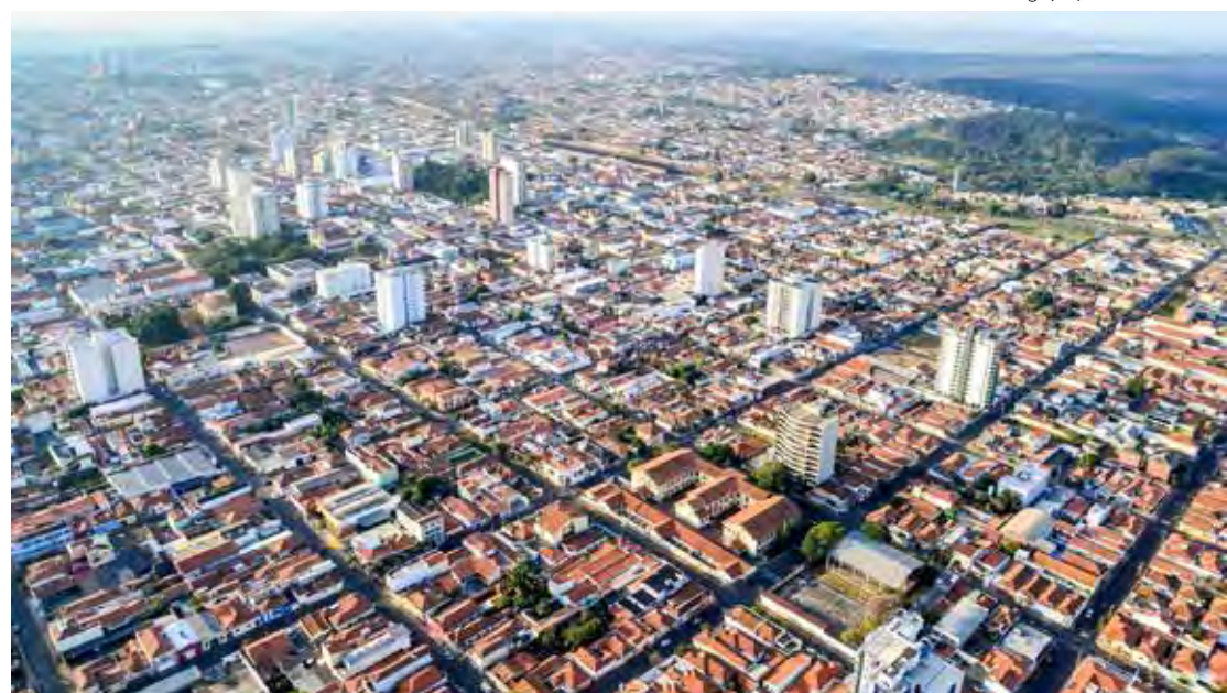
Rio Claro está atualizando o Plano Diretor de Desenvolvimento

6 - 1ª discussão do Projeto de Lei Complementar nº 043/2024