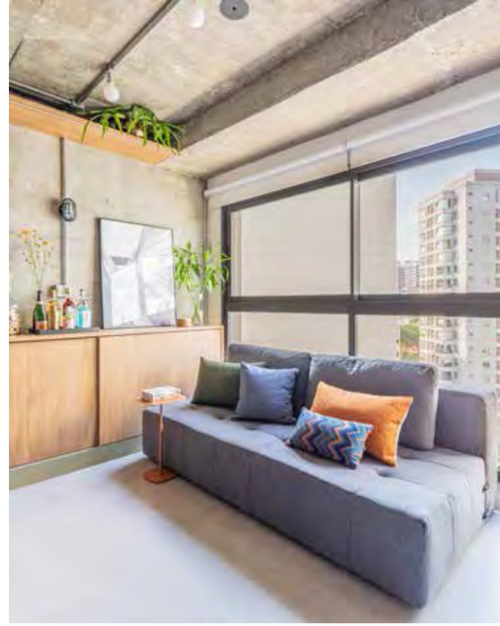
No canto da sala, o sofá cinza e a proximidade com o cantinho do bar

As paletas de cores suaves e terrosas são frequentemente adotadas como mais um componente essencial para esse propósito. Tonalidades como o nude, terracota e verde-oliva, são favoráveis ao mood intimista e podem ser mesclados com cores