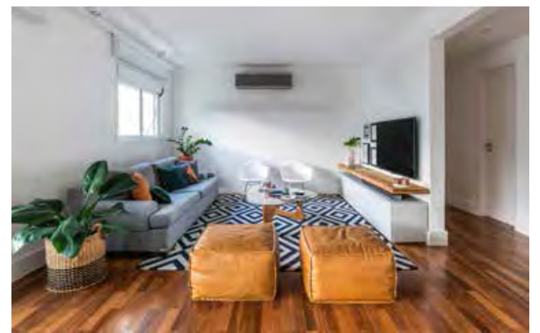
Nesta sala de estar, tapete, móveis e objetos decorativos não possuem cores saturadas e foram escolhidos justamente com o intuito de inspirar calma e acolhimento

Para a arquiteta, o objetivo é sempre o de criar espaços vol-