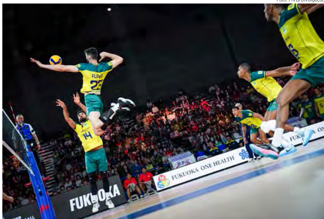
Seleção brasileira tem 16 pontos e está em sexto lugar na tabela

classificação geral, com cinco vitórias em oito partidas disputadas na competição. No último jogo da segunda semana da VNL, o Brasil venceu a Polônia por 3 sets a 1. Por outro lado, os holandeses têm apenas três vitórias no torneio e ocupam a 13ª posição na tabela com nove pontos. A Holanda precisa vencer para se manter na disputa por uma vaga nos playoffs.