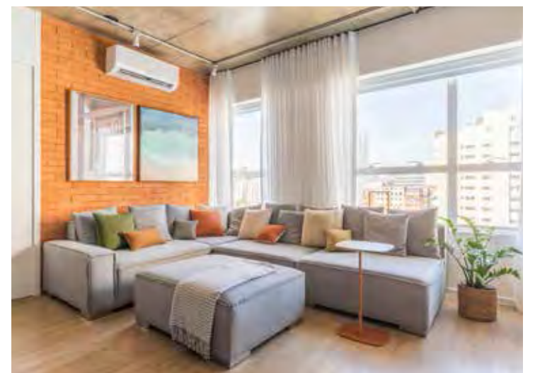
A arquiteta Júlia Guadix fez da sala de estar desse apartamento um espaço receptivo tanto para os moradores, como para as oportunidades em que recebem amigos em casa