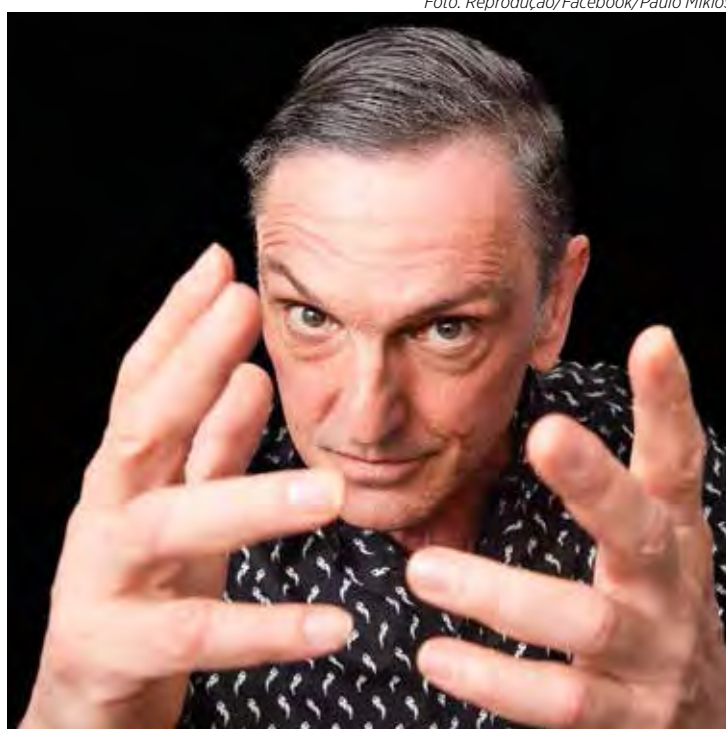
O cantor e ator Paulo Miklos será destaque no Festival Rango e Rock

O Festival Rango e Rock é uma realização da Secretaria de Cultura em parceria com a Orquestra Filarmônica de Rio Claro e a Baum Produtora Cultural. Os patrocinadores do evento incluem Whirpool, Casa do Construtor, Cervejaria Frederícia, MyPub, Sapataria Lago Azul, Xavier Camargo Imobiliária, Barbo Empreendimentos, Estrutura Dinâmica e SE Eventos.