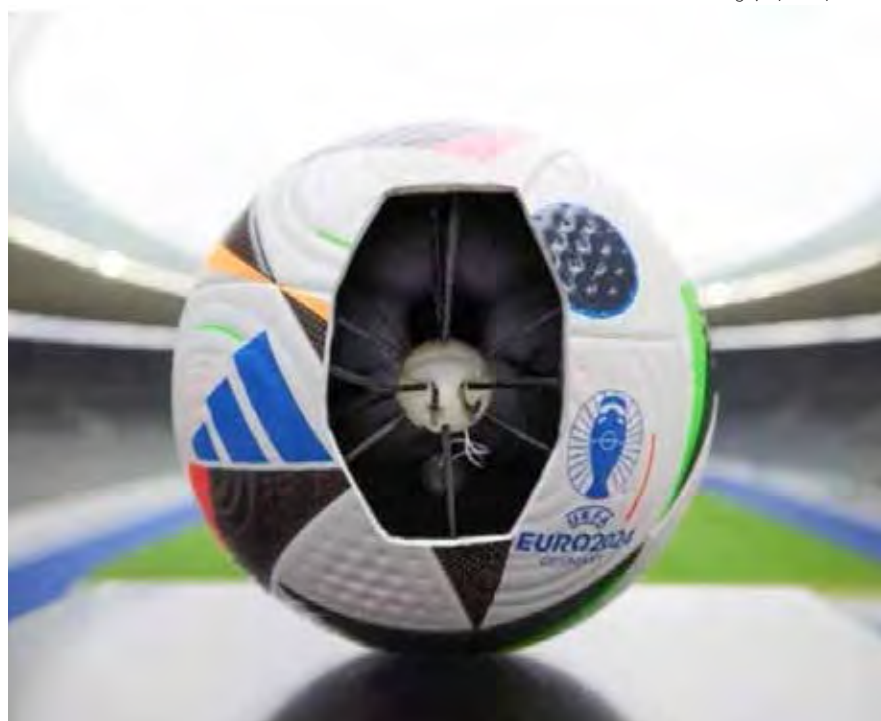
Bola inteligente da Adidas, promete revolucionar a Arbitragem de Vídeo no futebol mundial