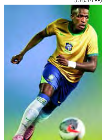
Vini Junior, craque do Brasil e do Real Madrid

Não por acaso só a Globo, sem ter exclusividade, se interessou até agora pela sua transmissão entre as TVs abertas, isto porque, também para o “calendário” da televisão ou organização de uma grade de programação, tamanha quantidade, por tanto tempo, será um problema a ser administrado. Quantos desses jogos efetivamente poderão ser acompanhados ou irão interessar ao grande público? No mundo do futebol, o que se vê, fora das quatro linhas, é só uma vontade de faturar cada vez mais, sem nada se importar com as consequências, a vida ou dificuldades dos outros.