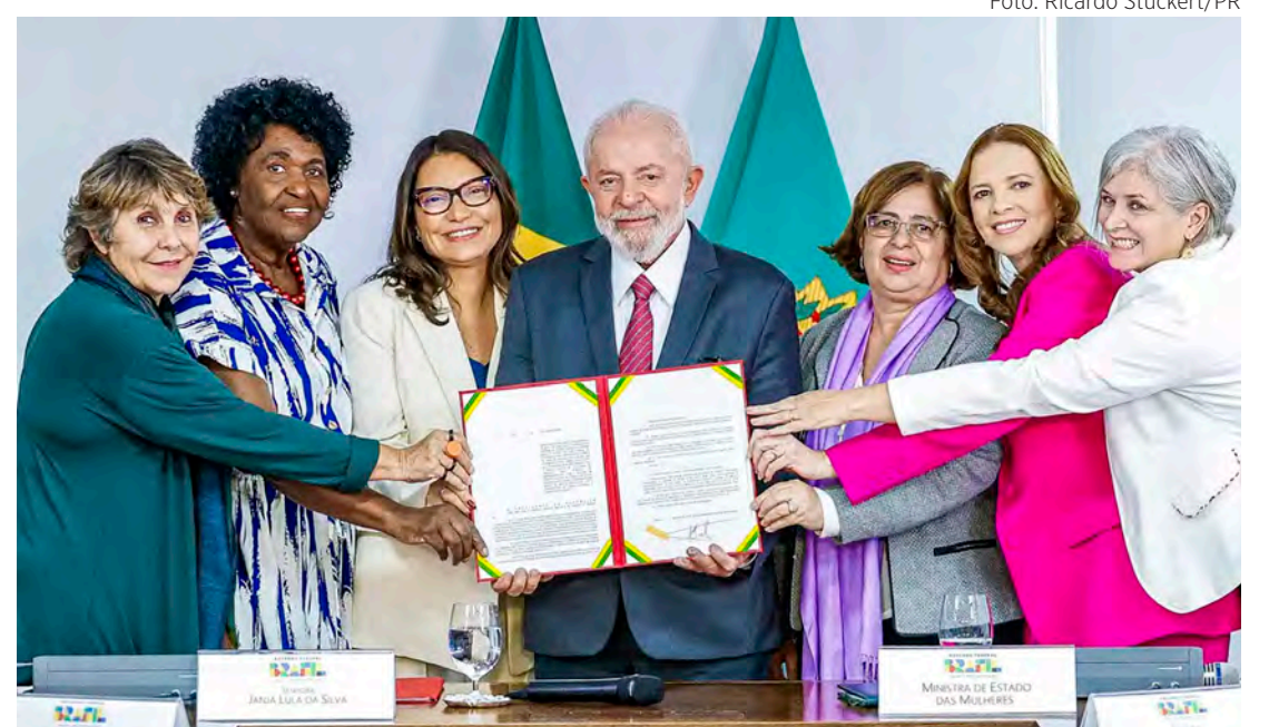
O presidente Lula sancionou a nova lei nesta segunda-feira, da 17 de junho

Segundo o presidente, se as mulheres souberem que existe a lei e que ali há uma certa garantia para elas, começam a ter coragem de fazer a denúncia. “Nós temos que divulgar, a pessoa tem que saber que tem uma lei, porque, se deixar apenas com as pessoas que têm uma certa formação, que podem procurar o advogado, as mulheres vão continuar sendo vítimas do