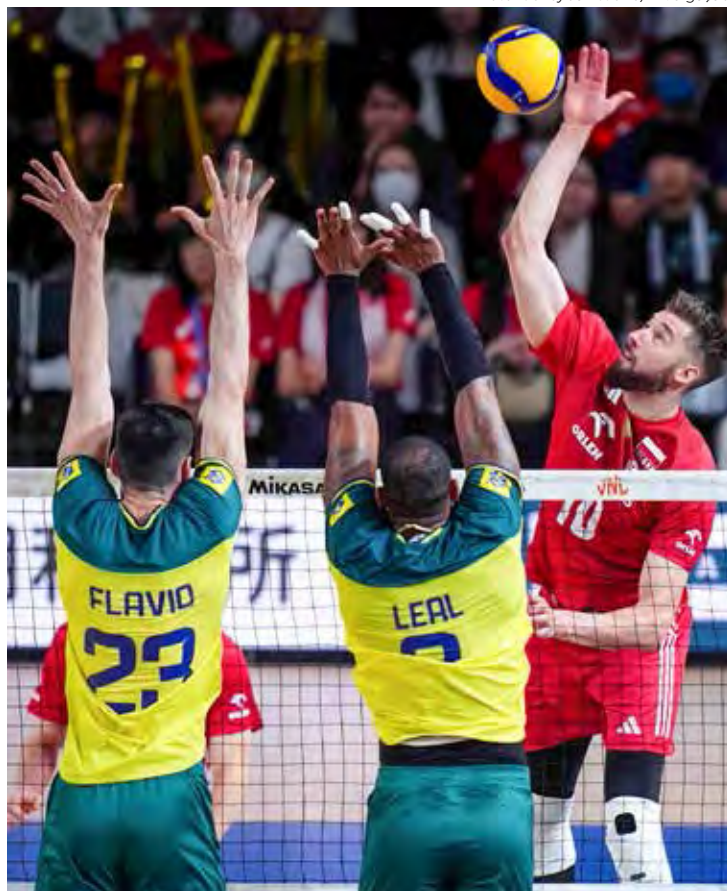
No último jogo da segunda semana da VNL, o Brasil venceu a Polônia por 3 sets a 1