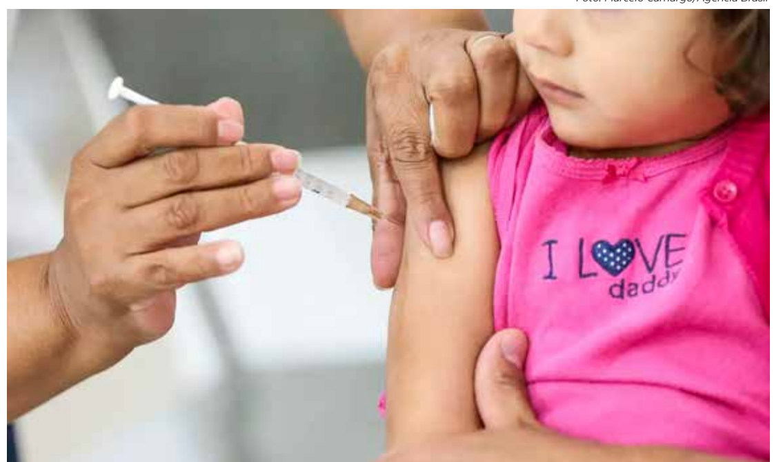
A vacinação contra a poliomielite também inclui doses injetáveis

Dados do ministério indicam que, desde 1989, não há notificação de casos de pólio no Brasil. As coberturas vacinais contra a doença, entretanto, sofreram quedas sucessivas ao longo dos últimos anos. Em 2022, por exemplo, a cobertura ficou em 77,19%, longe da meta de 95%.