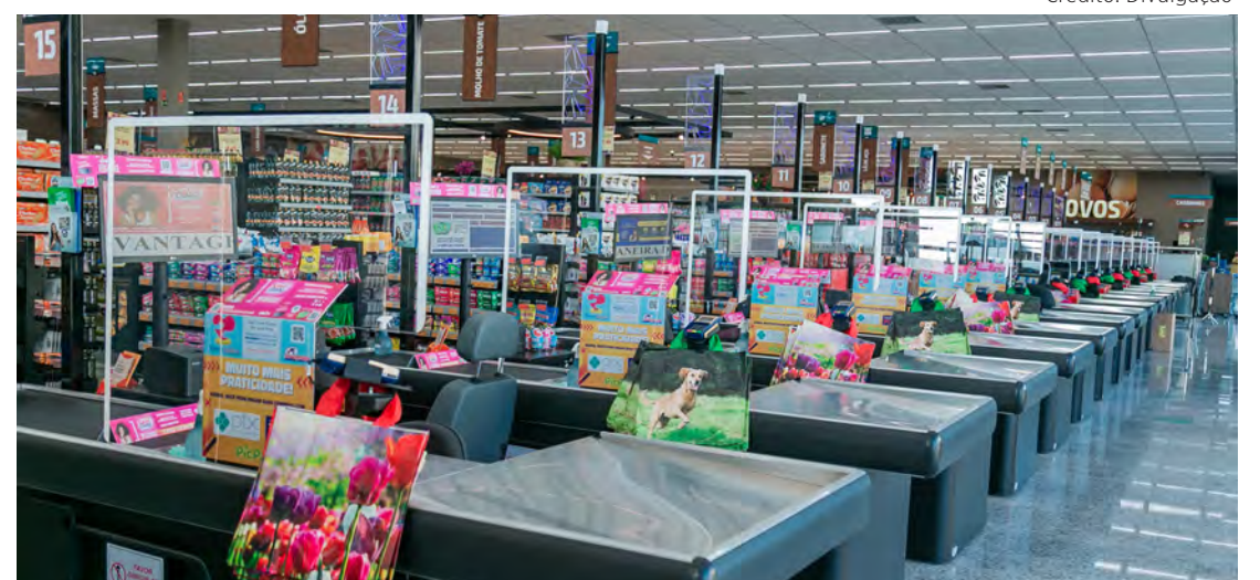
As oportunidades contemplam as lojas do Savegnago, do Paulistão e outros setores do grupo

“Nesses sites, os profissionais vão encontrar um banco de talentos com diversas oportunidades. Depois, também teremos vagas afirmativas que serão exclusivas para esse público. Para os cargos operacionais e alguns técnicos, não exigimos experiência, pois vamos oferecer toda a capacitação técnica internamente”, explica.