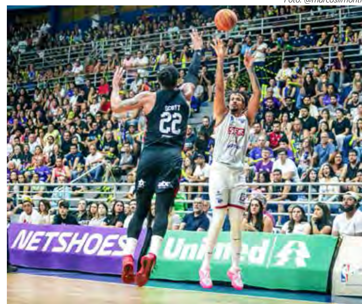
Sesi Franca encara o Flamengo, no Rio

Até o momento, a série melhor de 5 jogos das finais do NBB-16 tem a vantagem do Sesi Franca, que já soma 2 vitórias contra 1 do adversário. A partida desta noite acontece no ginásio Maracanzinho, às 18 horas, com transmissão ao vivo dos canais TV Cultura, ESPN, Sportv e NBB Basquete Pass.