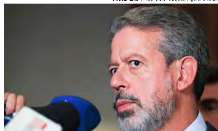
Arthur Lira | Foto: Lula Marques/Agência Brasil

• Enquanto isso, o governo do presidente Lula enfrenta uma “saída justa” com o escândalo da importa-