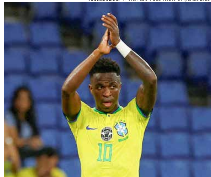
Vinicius Júnior

cius Júnior, o Vini Jr. Ele conseguiu a condenação de três torcedores de Valência, na Espanha, à prisão por insultos racistas proferidos contra ele. A decisão é inédita na Justiça espanhola. Os réus foram considerados culpados por crime não a integridade moral com agravante de discriminação por motivos racistas. Os torcedores foram condenados a oito meses de prisão e pagamento dos custos do processo, além de serem banidos por dois anos dos estádios. O atleta Vini Jr. comemorou a sentença. “Como sempre disse, não sou vítima de racismo. Eu sou algoz de racistas. Essa primeira condenação penal da história da Espanha não é por mim. É por todos os pretos. Que os outros racistas tenham medo, vergonha e se escondam nas sombras. Caso contrário, estarei aqui para cobrar”, postou o jogador em rede social. Parabéns ao Vini Jr. pela conquista, e por sua avaliação da vitória judicial. Exemplo a ser seguido.