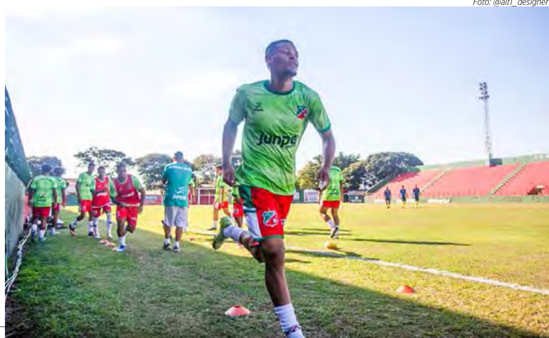
Treinos puxados no Benitão para jogo importante de sexta-feira, fora de casa