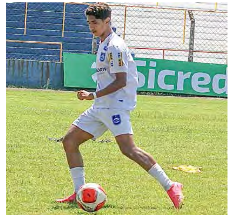
Rio Claro FC joga em Jaú pelo Paulista Sub-15 e Sub-17

A 10ª, e última rodada do Paulista Sub-15 e Sub-17 está marcada para o dia 8 de junho, quando o Rio Claro FC estará enfrentando no estádio Schmidtão, a Internacional de Limeira, nas duas categorias.