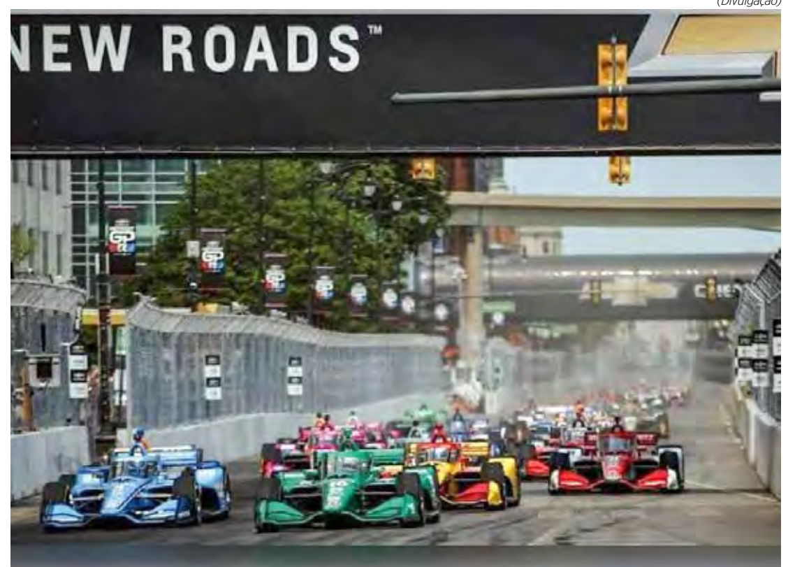
Blomqvist é substituído por Hélio Castroneves, um dos destaques do GP da Indy em Detroit