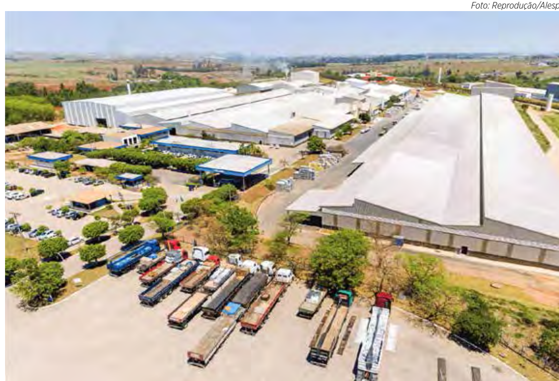
Título reconhece a importância do polo cerâmico de Santa Gertrudes