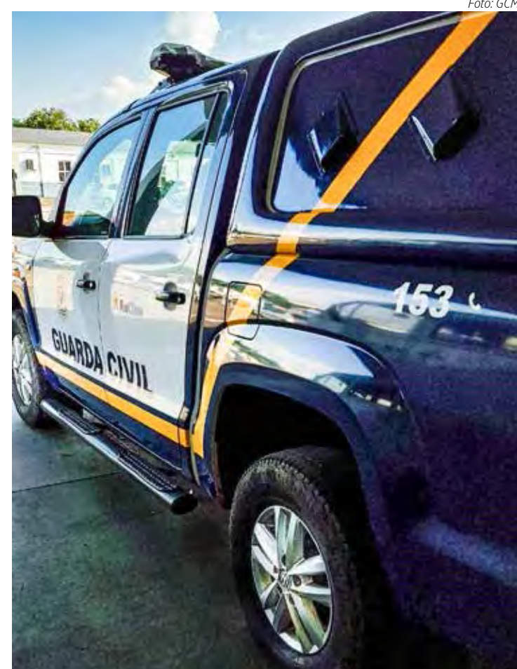
Recusa levou à aplicação da Lei Municipal 5291/2019, que estipula obrigações para tutores de animais em situações de fiscalização

Diante das infrações, foram aplicados 14 autos de infração no total: sete por não apresentar a carteira de vacinação e sete por obstrução à fiscalização. Cada auto de infração resultou em uma sanção pecuniária, acumulando um valor de 2.170 UFMRC, o que equivale aproximadamente a R$ 9.748,94.