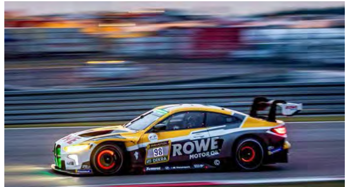
Augusto Farfus representa o Brasil na extenuante prova de 24 horas de duração