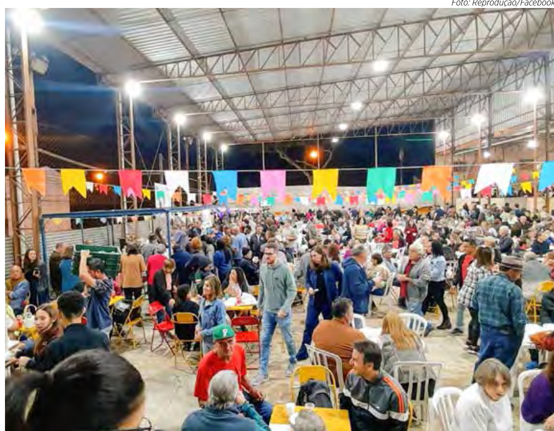
Grande público costuma prestigiar a quermesse promovida pela Capela Santo Antônio

A Capela de Santo Antônio fica na Rua P-4, entre as avenidas P-23 e P-25, no bairro Vila Paulista em Rio Claro. A Paróquia Nossa Senhora da Saúde está localizada à Avenida 4-A, 244, no bairro Cidade Nova.