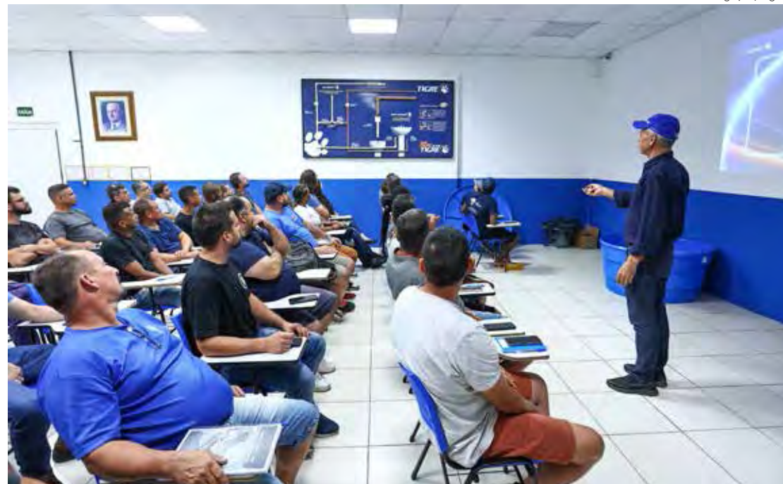
O Clube oferece uma série de benefícios, incluindo a participação nos treinamentos da Tigre