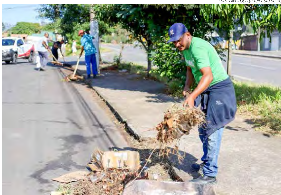
Combate à dengue é um dos focos do mutirão de limpeza

ciais criadouros. A prefeitura fez orientações aos moradores sobre o combate à dengue e limpou terrenos. A prefeitura reforça que é essencial a população colaborar, mantendo seus imóveis sempre limpos e fazendo o descarte correto de materiais.