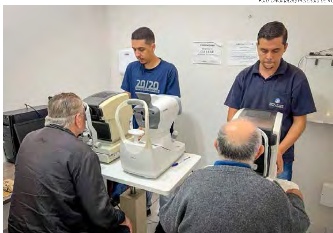
A avaliação pré-cirúrgica foi feita em 18 de maio

Esse mutirão de cirurgias de catarata é resultado de parceria entre a Fundação Municipal de Saúde e governo estadual e conta com emendas parlamentares do deputado estadual Delegado Olim e deputado federal Maurício Neves, com articulação do vereador Julinho Lopes.