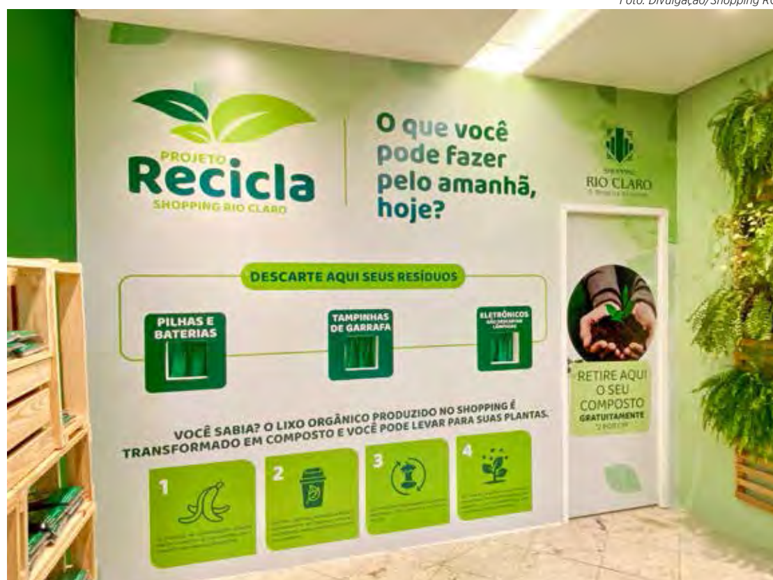
Inaugurado em 5 de junho de 2023, o Projeto Recicla visa o uso sustentável das sobras de alimentos

Desde sua fundação, em 1976, a Abrasce tem atuado no fortalecimento e desenvolvimento do setor, defendendo os interesses dos shopping centers