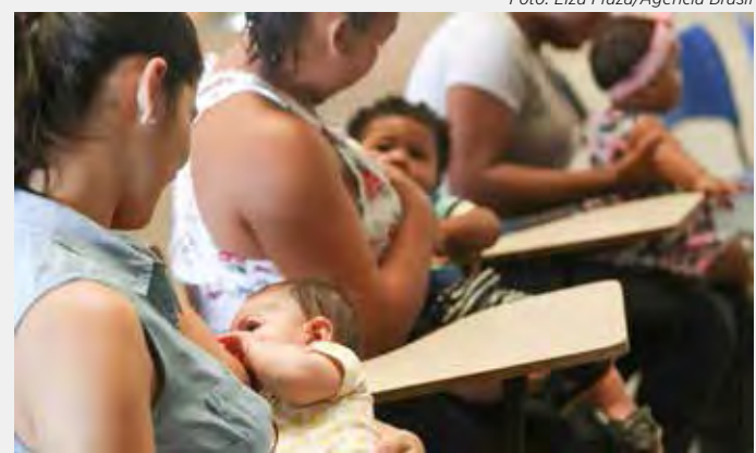
Leite materno é essencial para a saúde dos bebês