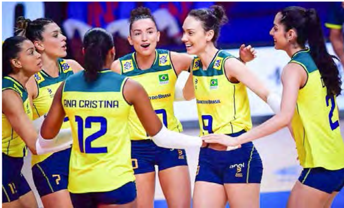
Brasil enfrenta a Itália pela Liga das Nações de Vôlei Feminino