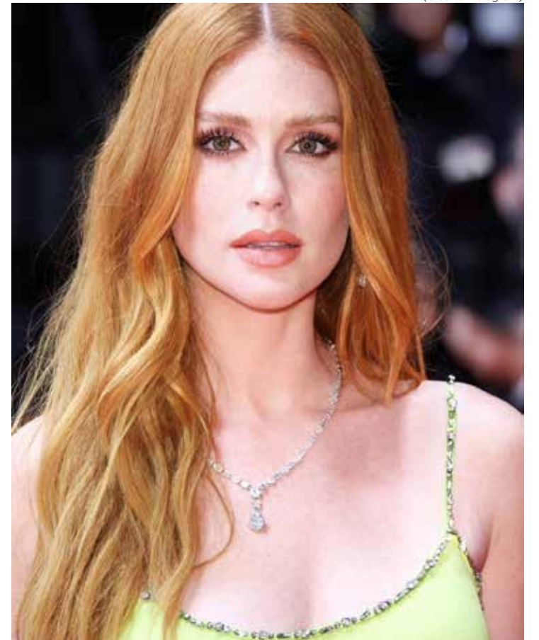
Marina Ruy Barbosa