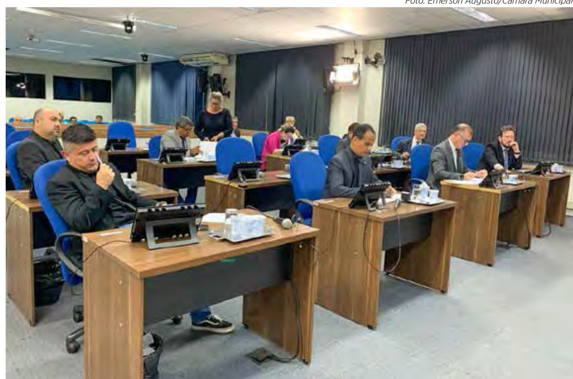
Parlamentares no plenário durante a sessão ordinária desta segunda