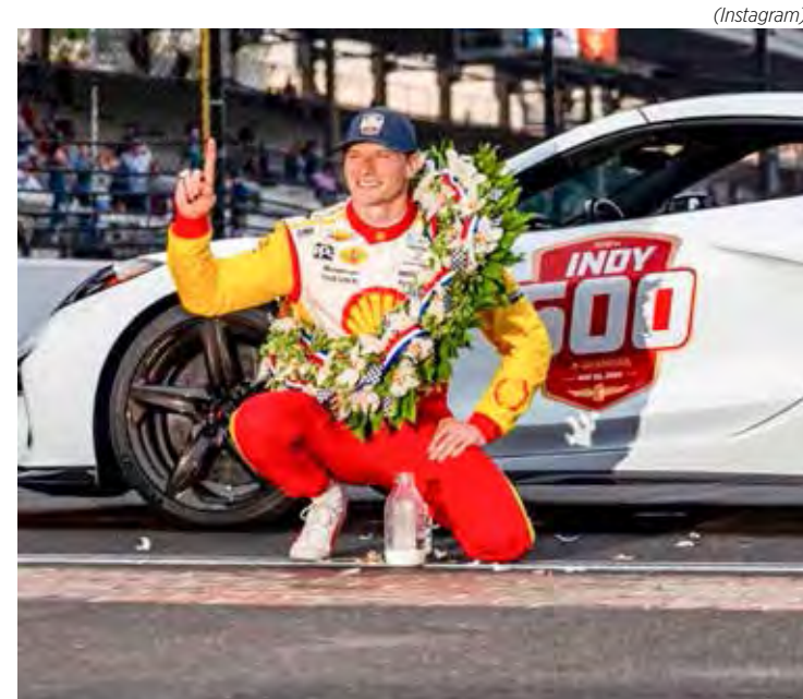
Josef Newgarden venceu as 500 Milhas de Indianápolis pelo segundo ano consecutivo

A Indy retorna já no fim da semana, com o GP de Detroit, no dia 2, em circuito de rua montado no centro da principal cidade do Michigan.