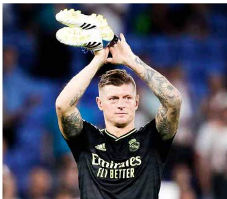
Toni Kroos, lenda do Real Madrid, anuncia aposentadoria após a Eurocopa 2024

21h30: Coquimbo Unido-CHI x RB Bragantino