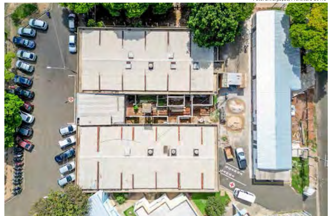
Vista aérea do complexo de saúde da região sul de Rio Claro

No novo local de funcionamento, a farmácia oferece mais conforto ao público e melhores condições de atendimento. O espaço possui sala de espera que acomoda 60 pessoas sentadas, em ambiente climatizado, e também sala para farmacêutico. Já a nova lavanderia foi cons-