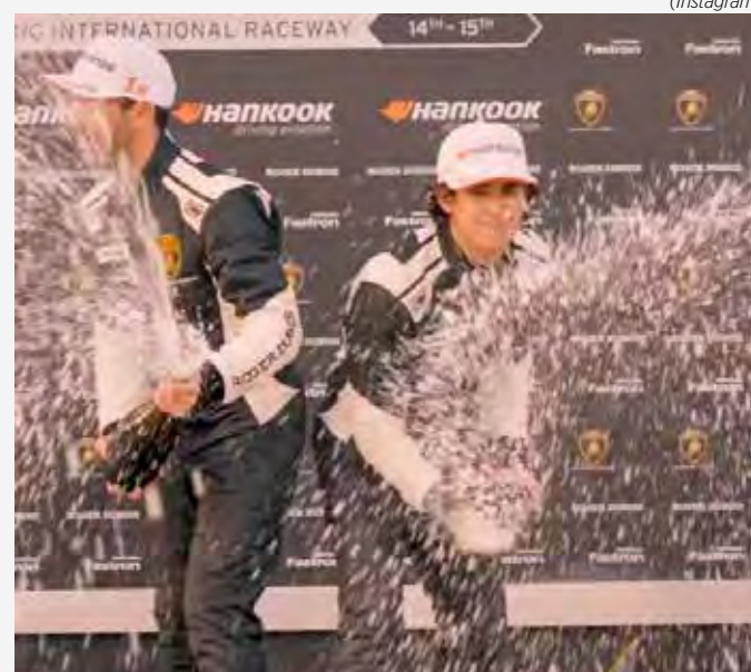
Brasileiro comemorou duas vitórias e parte rumo à liderança do campeonato

O Lamborghini Super Trofeo USA prossegue de 21 a 23 de junho em Watkins Glen, sempre ao lado da IMSA WeatherTech.