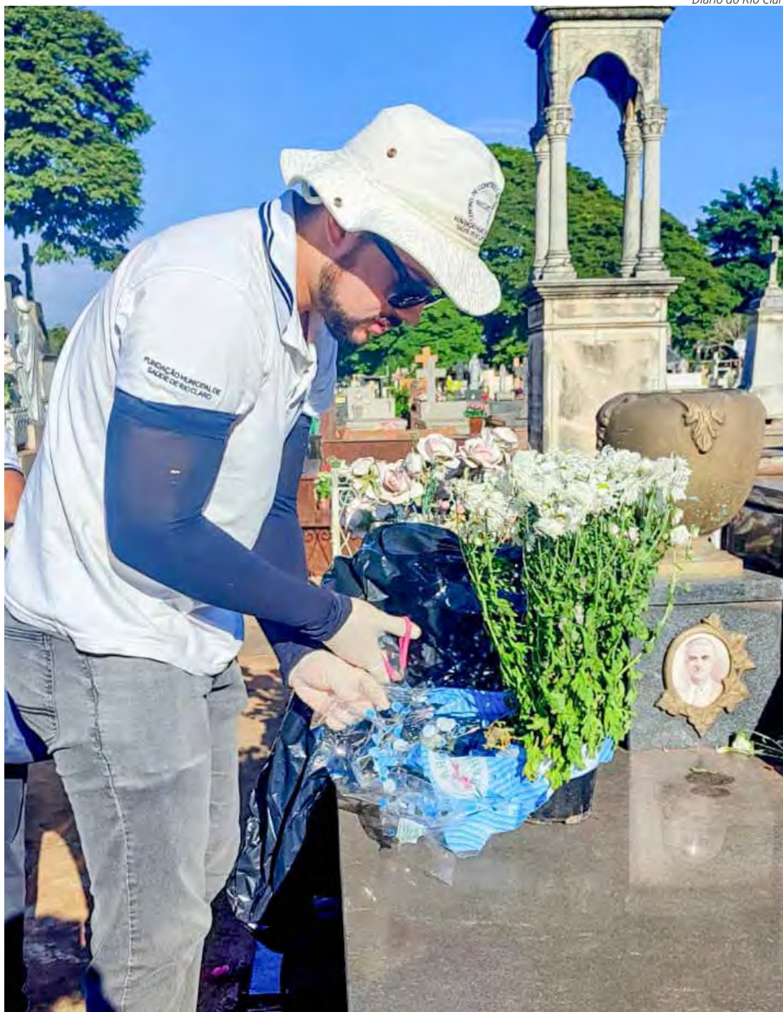
Diário do Rio Claro

A Vigilância Epidemiológica de Rio Claro divulgou boletim nesta terça-feira (14) em que aponta que o total de óbitos por dengue passou de oito para dez neste ano no município. Rio Claro também tem sete óbitos em investigação e um total de 2.321 casos, sendo 234 casos confirmados nos últimos cinco dias. Página 3