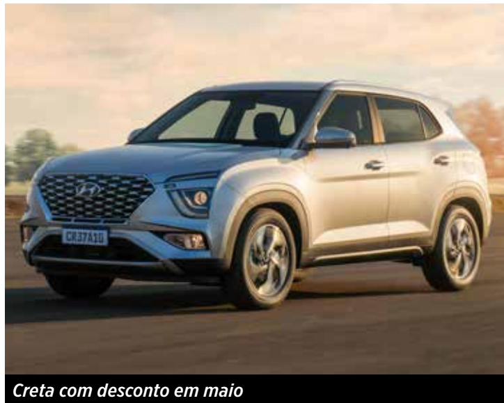
Creta com desconto em maio