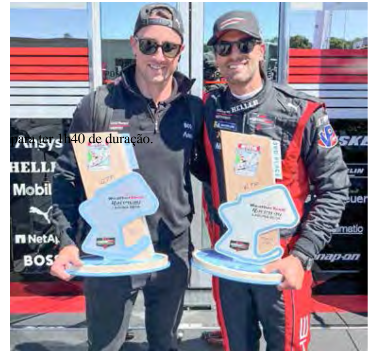
A etapa de 140 de duração.