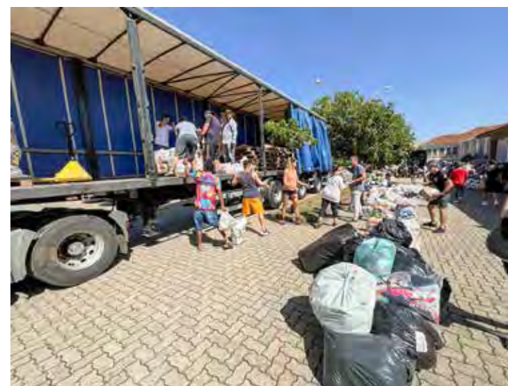
Diocese enviou 92 toneladas de donativos para o Rio Grande do Sul

Os produtos partiram em três carretas e um caminhão truck que foram carregados por uma legião de voluntários que se mobilizaram para ajudar milhares de famílias gaúchas neste momento de necessidade. Uma das carretas, com 32 toneladas de doações, foi para a região de Venâncio Aires e Marriante. Outras duas seguiram com destino às cidades da Arquidiocese de Porto Alegre (25 toneladas) e São Sebastião do Caí (20 toneladas). O