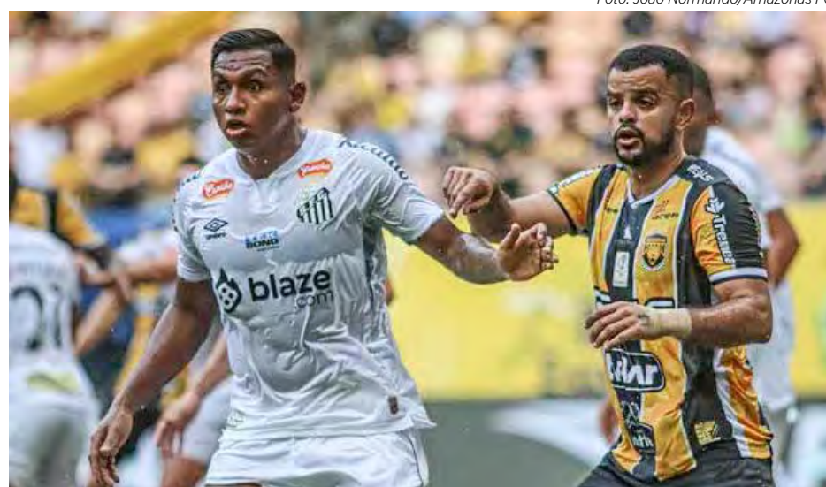
Santos sofreu primeira derrota na Série B diante do Amazonas, em Manaus