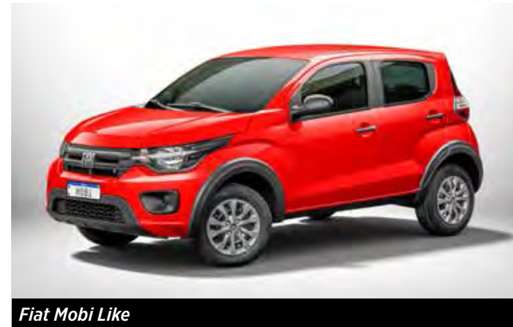
Fiat Mobi Like

O maior reajuste do Polo, de R$ 2.700, foi para a versão Comfortline, que sai por R$ 113.690, depois vem Highline, que custa R$ 120.790, e a GTS, R$ 153.790.