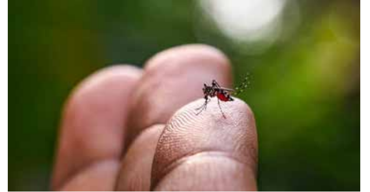
A população deve fazer a sua parte para combater o mosquito da dengue