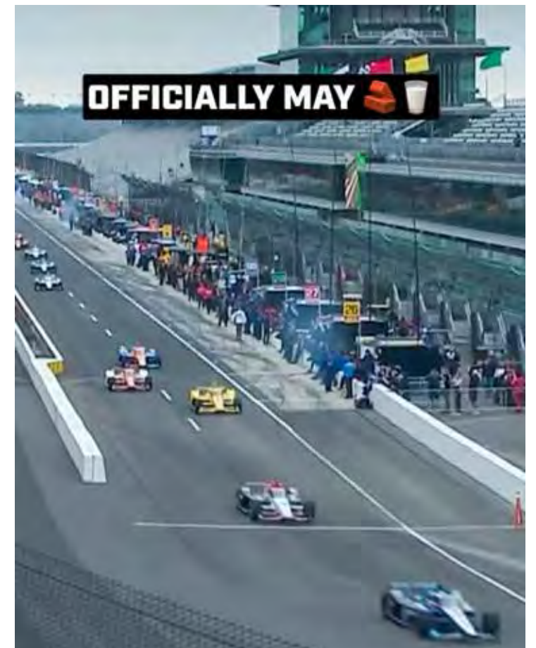
A terça-feira (14) marcou a bandeira verde para a programação oficial da 108ª edição das 500 Milhas de Indianápolis

Terça-feira (14) de movimentação no Indianápolis Motor Speedway para a 108ª edição das 500 Milhas de Indianápolis, etapa mais importante do calendário 2024 da Indy e parte integrante da Tríplice Coroa do Automobilismo Mundial.