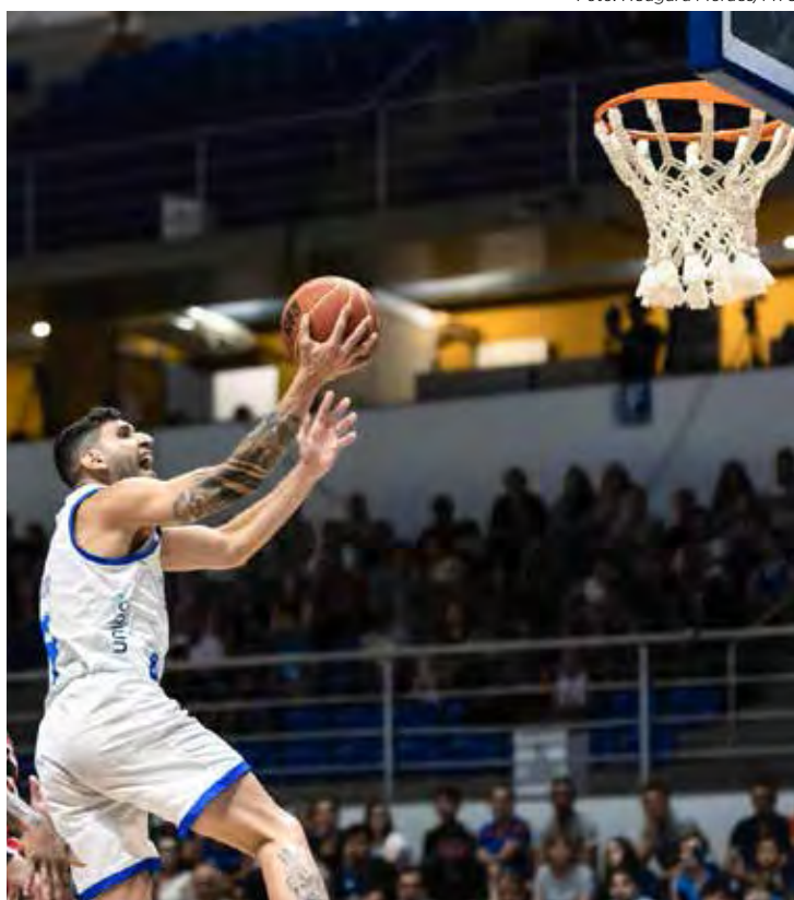
Minas fechou em 3x2 sobre o São Paulo e vai à semifinal contra Franca