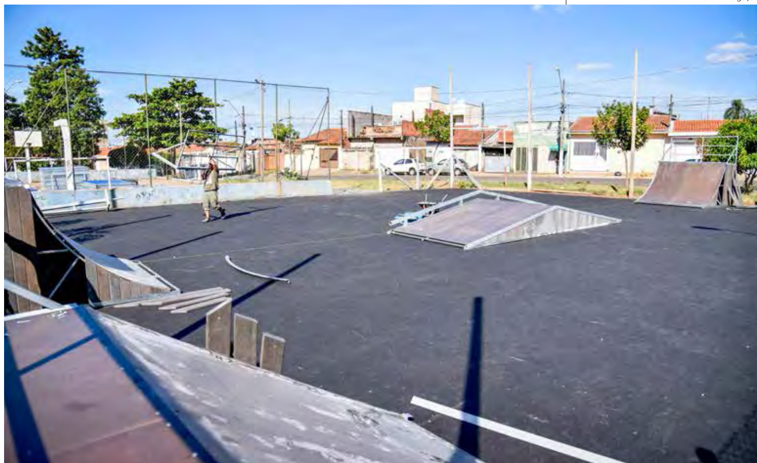
Arena também terá quadra de basquete e área para futebol Society

A prefeitura entregou recentemente arenas esportivas na Rua 3-A, no Jardim América, Jardim Novo e Bairro do Estádio, entre outras obras na área de esportes.