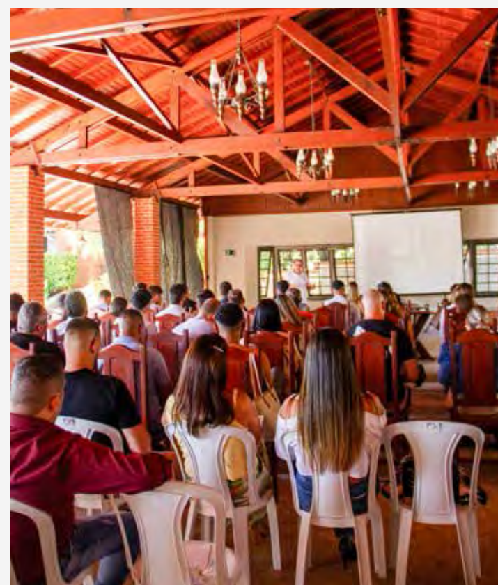
Mais de 60 corretores compareceram ao meeting de vendas do bairro Recanto das Flores