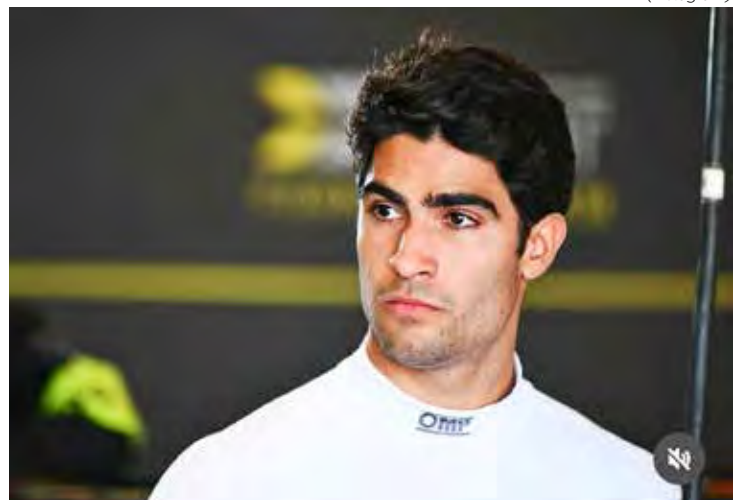
Piloto brasileiro otimista para mais uma performance destacada nas ruas de Monte Carlo