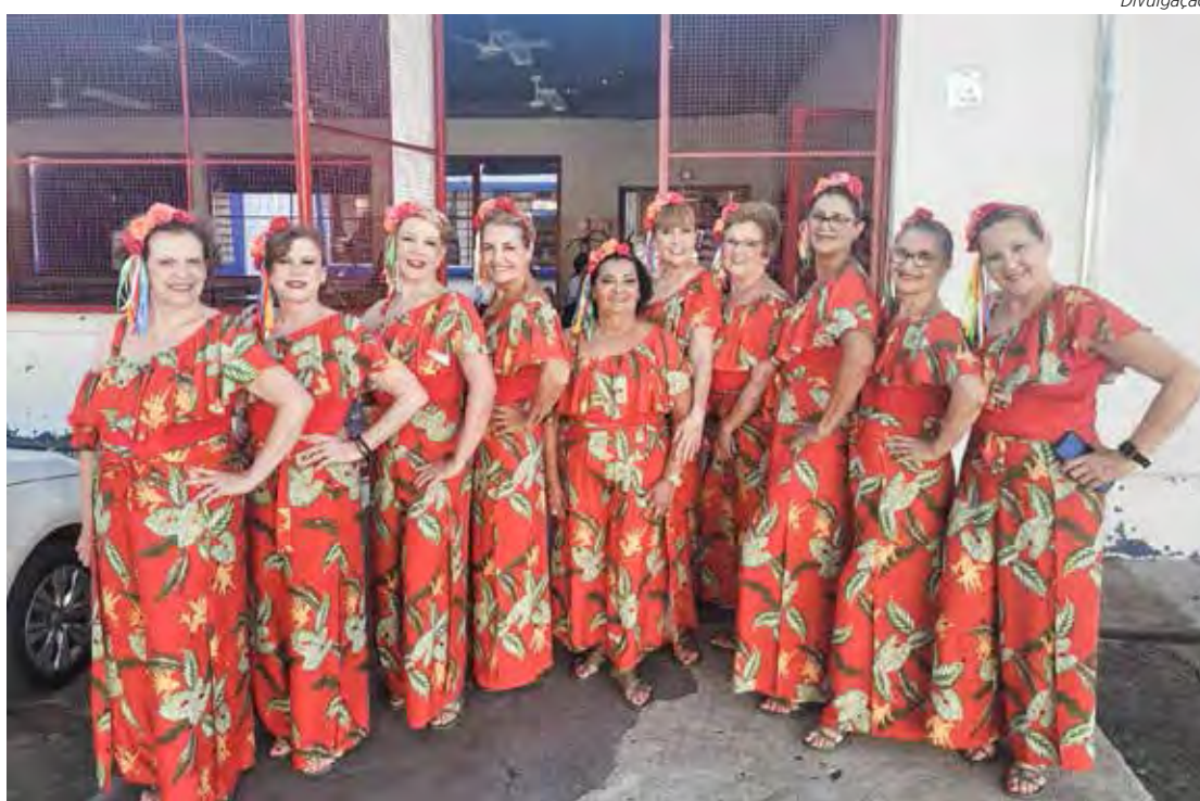
Equipe de Coreografia de Rio Claro

pes que se destacaram. A xadrez ficou em segundo lugar no xadrez feminino e em terceiro lugar no masculino. Outro destaque rio-clarense foi a equipe de tênis de mesa feminino A, vice-campeã. Na categoria tê-