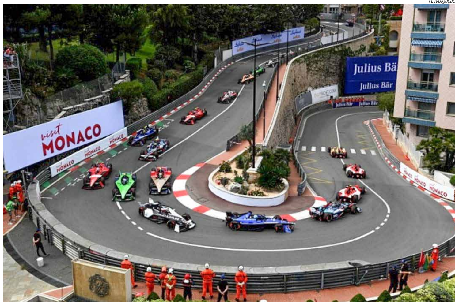
Fórmula E: eP de Mônaco tem todas as atividades neste sábado

Oliver Rowland (80), Nick Cassidy (76) e Max Günther fechando o Top 5, com 63 pontos.