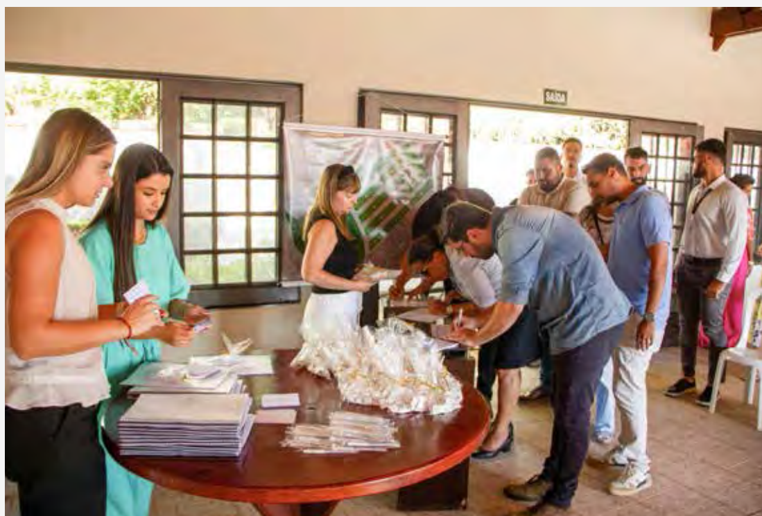
Para os corretores presentes, o bairro já é um grande sucesso