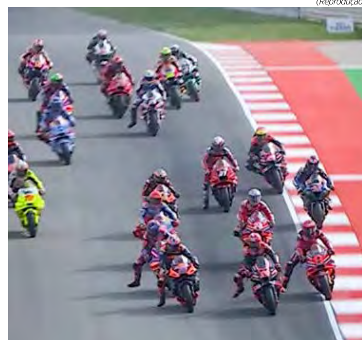
Principal categoria da motovelocidade mundial inicia percurso nos circuitos mais tradicionais da Europa

Corrida principal - Domingo 09h (ESPN e Star+)