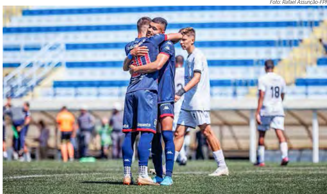
Copa Sementes do Amanhã foi realizada em Rio Claro