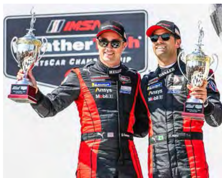
Felipe Nasr e Dane Cameron (Porsche Penske Motorsport) lideram o campeonato, ao conquistarem a 3ª posição

A próxima etapa do IMSA acontecerá no dia 12 de maio, em Laguna Seca.