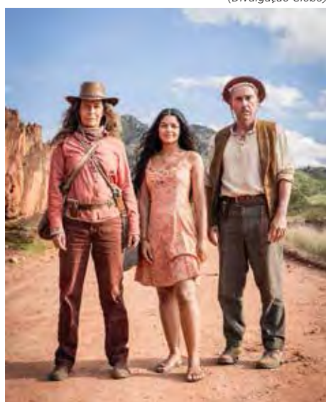
Andréa Beltrão, Larissa Bocchino e Alexandre Nero