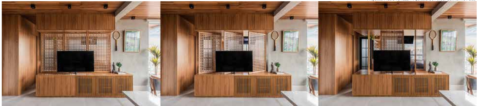
Neste apartamento, o que seria um painel simples ganhou o contorno de três folhas com o treliçado do muxarabi e que podem ser movimentados conforme o gosto do morador

Surgido no século XIV dentro da arquitetura árabe em países do Oriente Médio e Ásia, o Muxarabi segue com suas premissas originais. Primordialmente de madeira, sua forma é resultado dos desenhos geométricos obtidos por ripas de madeira sobrepostas e esse aspecto