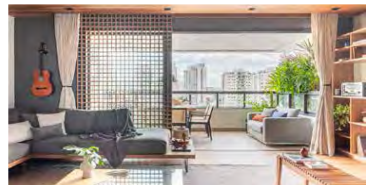
Neste living realizado, o muxarabi camufla as folhas da porta de vidro instaladas entre o living e a varanda do apartamento

mais ornamentado e orgânico entrega um visual impotente, sofisticado e aconchegante.