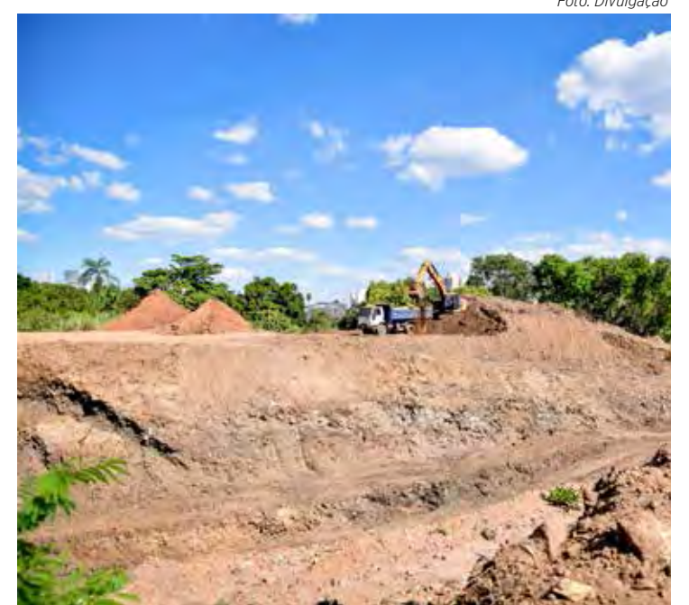
Trabalhos nessa fase estão em estágio inicial

No ano passado o prefeito Gustavo também lançou o programa Rio Claro em Ação, para intensificar os cuidados com a cidade. O "Rio Claro em Ação", inclui recapamento – que já atendeu 50% dos bairros –, asfaltamento de trechos não pavimentados em vários bairros e pavimentação integral de bairros que há anos esperavam pela melhoria, suavização de valetas em vários cruzamentos, melhoria e ampliação da sinalização de trânsito, ações de limpeza pública e muito mais.