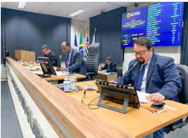
Parlamentares da mesa conduzem os trabalhos da sessão

põem sobre desafetação de área, ou seja, autorizam a prefeitura a mudar a destinação original dos terrenos para posterior venda ou execução de obras e melhorias. Uma dessas áreas desafetadas destina-se à abertura da Avenida Marginal no Jardim Anhanguera. Outro tem a finalidade de implantar o anel viário interligando o Jardim Progresso ao Distrito Industrial.