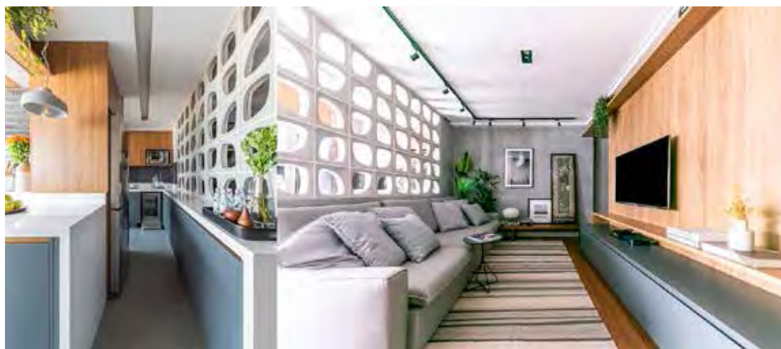
Nesse apto, destaque para a meia parede em cobogó que segmenta a sala de estar e a cozinha