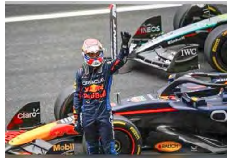
Verstappen amplia liderança após dupla vitória na China