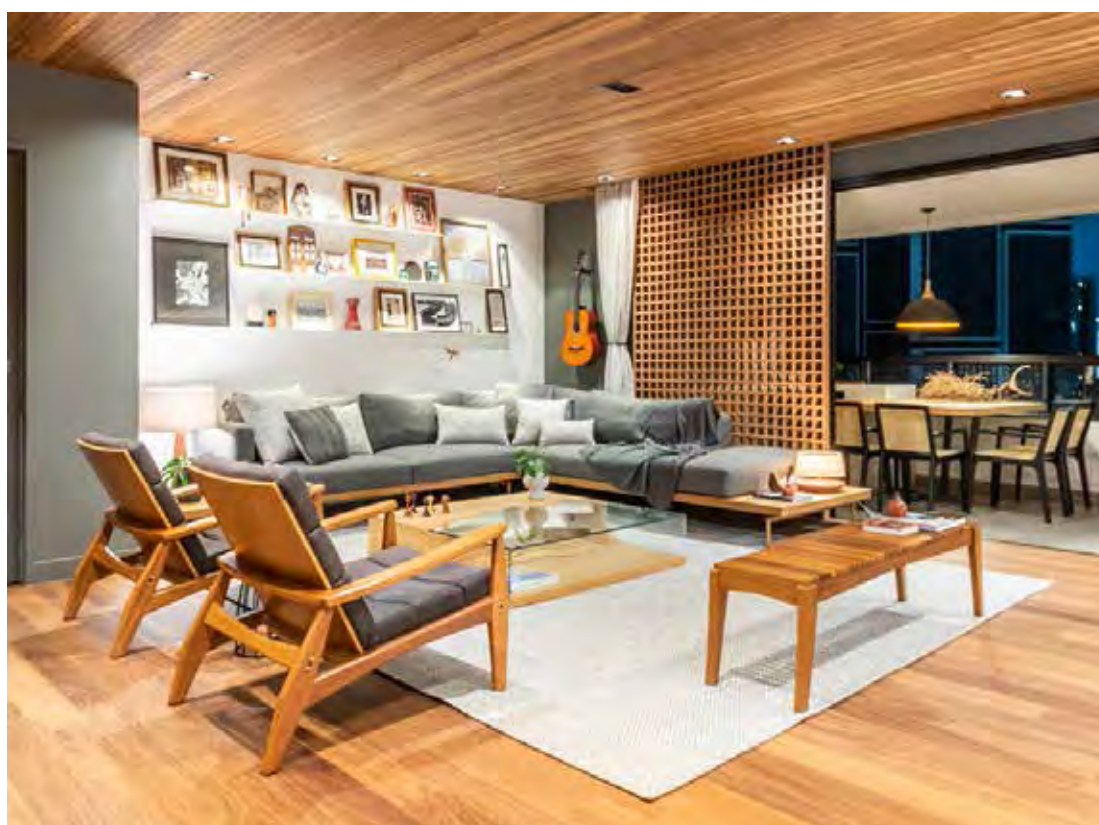
Muxarabis e cobogós não apenas adornam, como transformam ambientes por meio do design e a harmonia obtida por meio da iluminação e ventilação