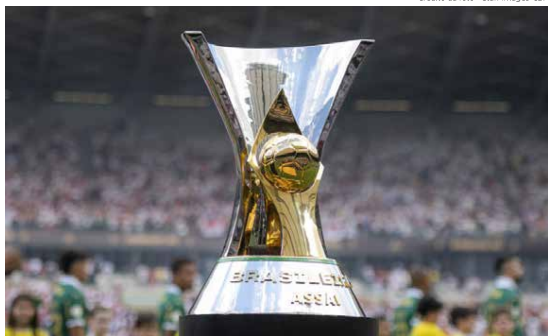
A cobiçada taça de campeão do Brasileirão

16h00: Atlético x Flamengo 16h00: Vasco da Gama x Grêmio 16h00: Corinthians x Atlético 16h00: Athletico x Cuiabá 17h00: Cruzeiro x Botafogo 18h30: Vitória x Palmeiras