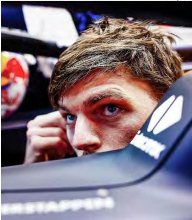
Max Verstappen chega ao Japão na liderança do campeonato