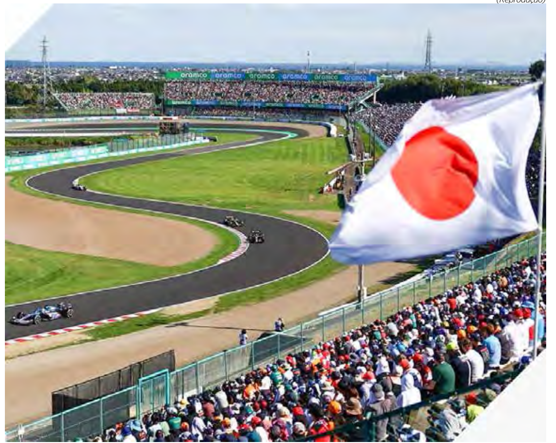
Pilotos vão acelerar no icônico circuito de Suzuka. Treinos, classificação e corrida serão mais uma vez na madrugada brasileira