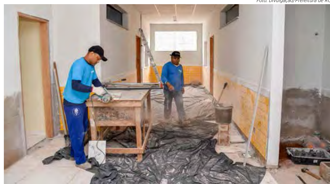
Nova unidade educacional deverá entrar em funcionamento neste ano

Além de escolas e creches, a rede municipal de ensino de Rio Claro