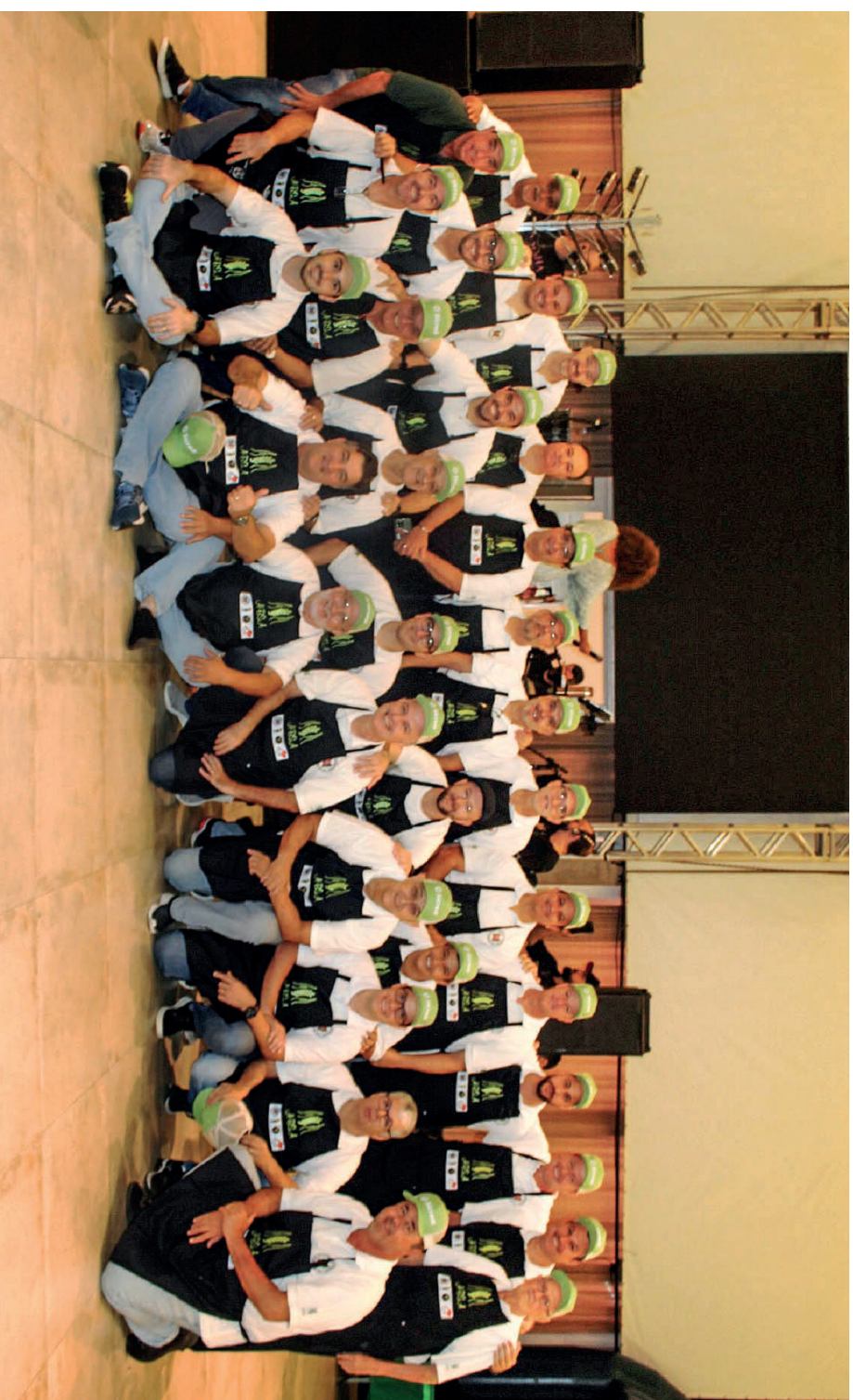
Equipe da ABSA - Associação Beneficente Solidária das Acácias