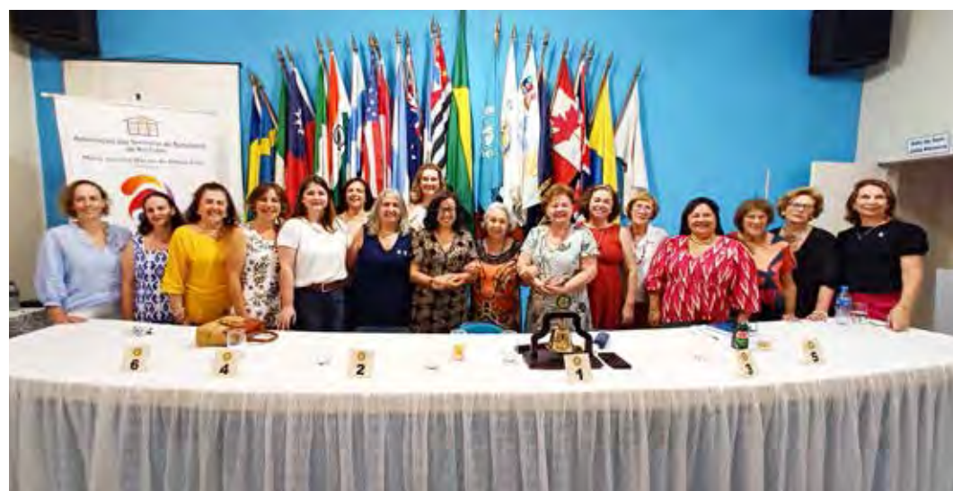
As voluntárias que trabalham para o bem da comunidade por intermédio do clube pertencente à Fundação Rotariana