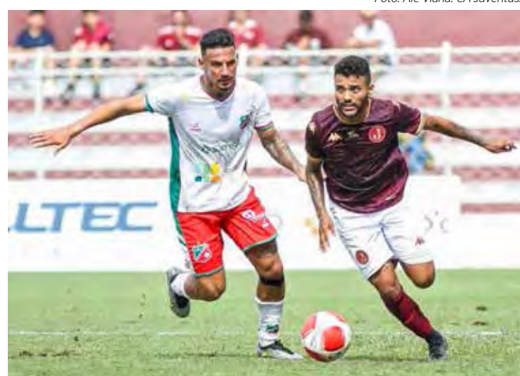
Juventus x Velo Clube, se enfrentam na Rua Javari