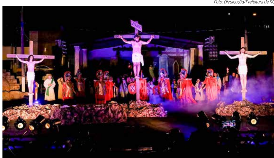
Na edição de 2023, mais de três mil pessoas assistiram ao espetáculo

Na edição de 2023, mais de três mil pessoas assistiram ao espetáculo realizado no espaço livre da Avenida Visconde do Rio Claro. Neste ano, a expectativa dos organizadores é também receber um grande público.