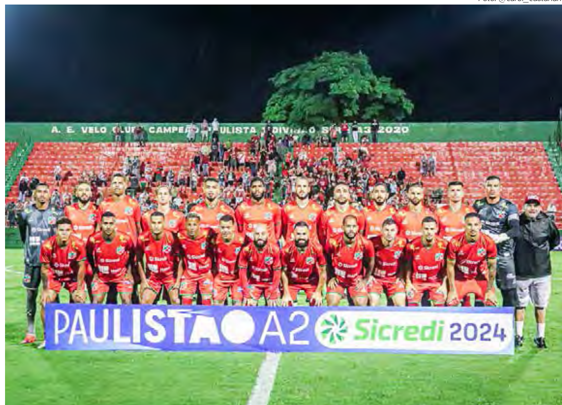
Velo Clube disputa o acesso no Paulistão Série A2.

A equipe de arbitragem escalada pela Federação Paulista de Futebol para apitar Juventus x Velo Clube é formada por: Salim Fende Chavez, árbitro principal, que terá