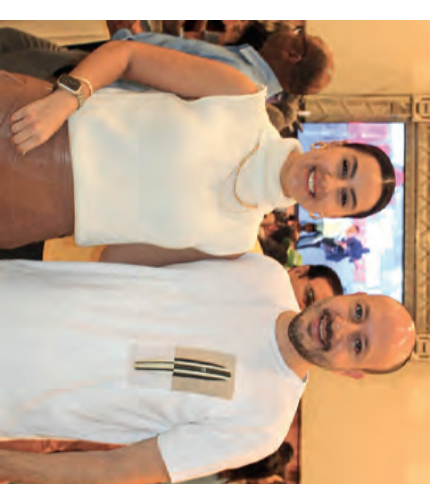
Bruna e Gustavo Perissinotto - Prefeito RC