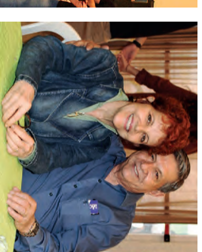
Rosália e Gino - Prefeito de Santa Gertrudes