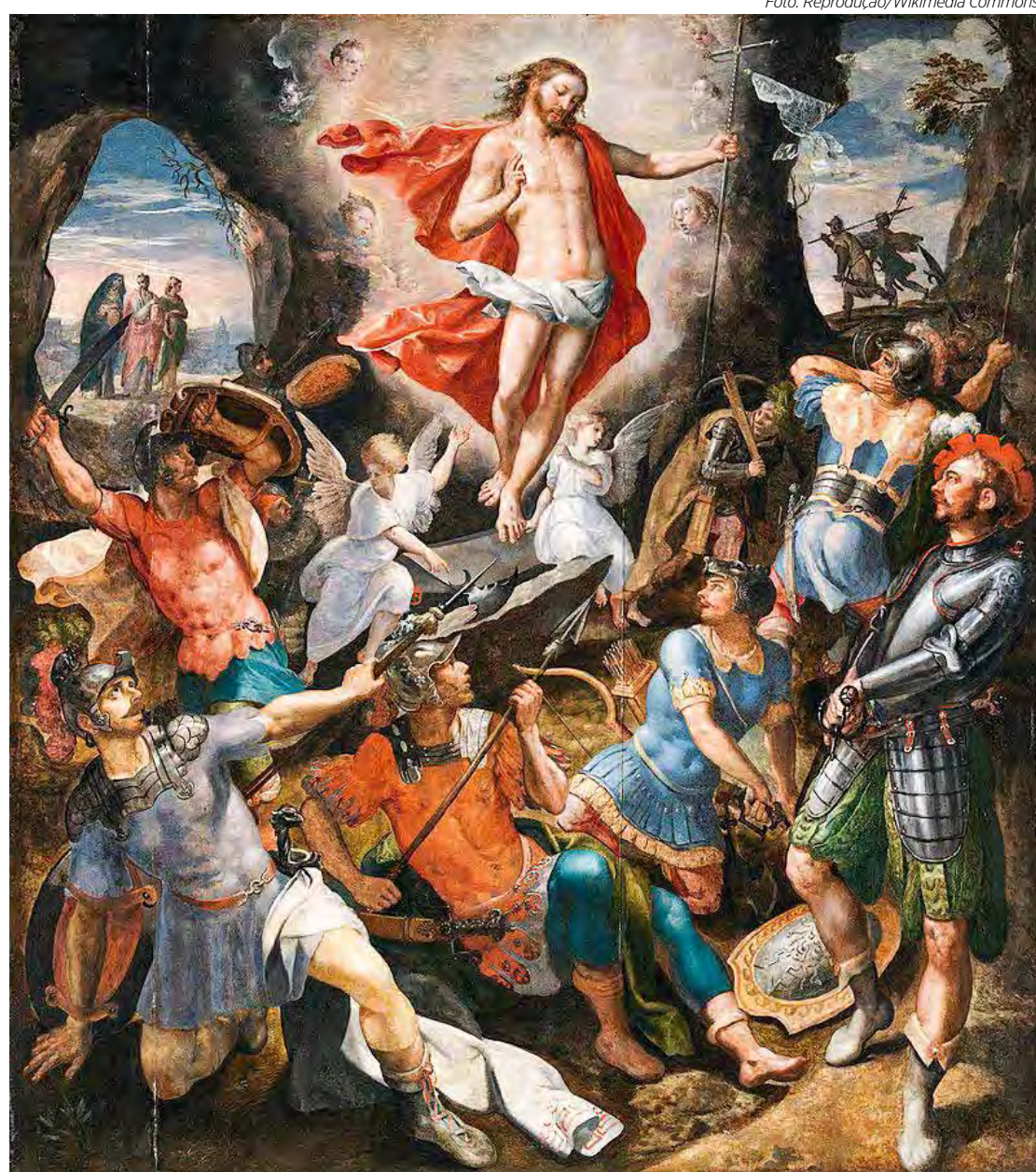
A Ressurreição de Cristo - Maerten de Vos (1532-1603)

O ovo também é um símbolo da Páscoa, pois representa o começo da vida. Vários povos costumavam presentear os amigos com ovos, desejando-lhes a passagem para uma vida feliz. A partir deste costume, surgiram os primeiros Ovos de Páscoa. (Fonte: www.significados.com.br)