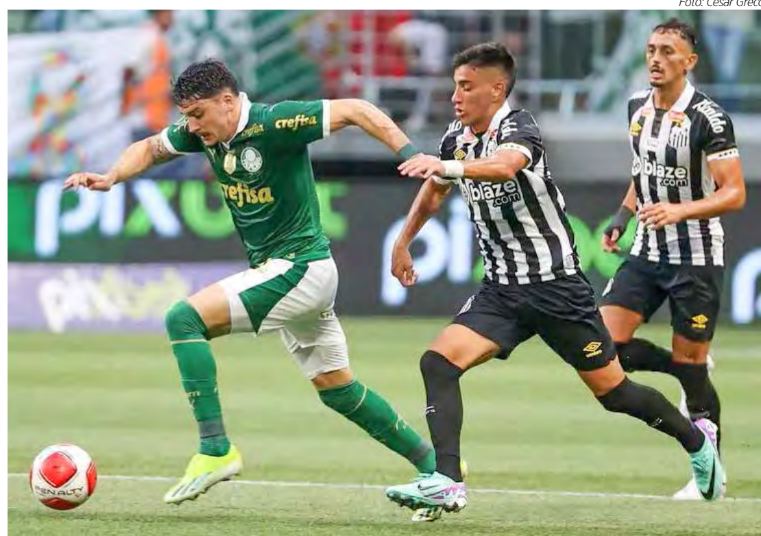
Santos x Palmeiras começam a decisão do título Paulista