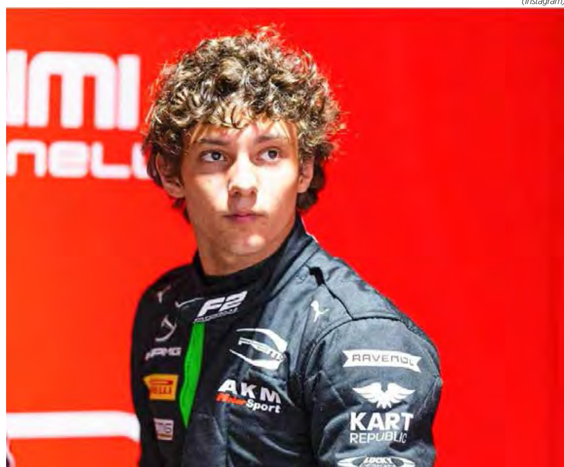
Na Fórmula 2, Kimi Antonelli ocupa a nona colocação na tabela dos pilotos

Kimi Antonelli, piloto júnior da Mercedes que atualmente corre na Fórmula 2 e é apontado como possível substituto de Lewis Hamilton em 2025, pode ter sua entrada na Fórmula 1 antecipada.