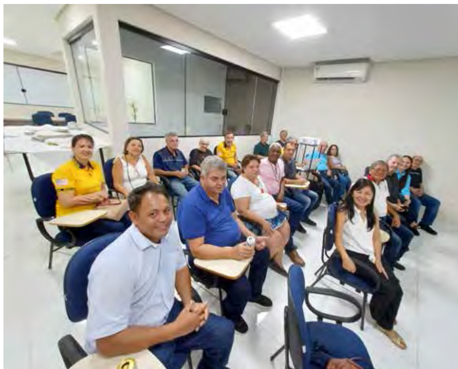
Companheiros do Clube Rio Claro Sul.