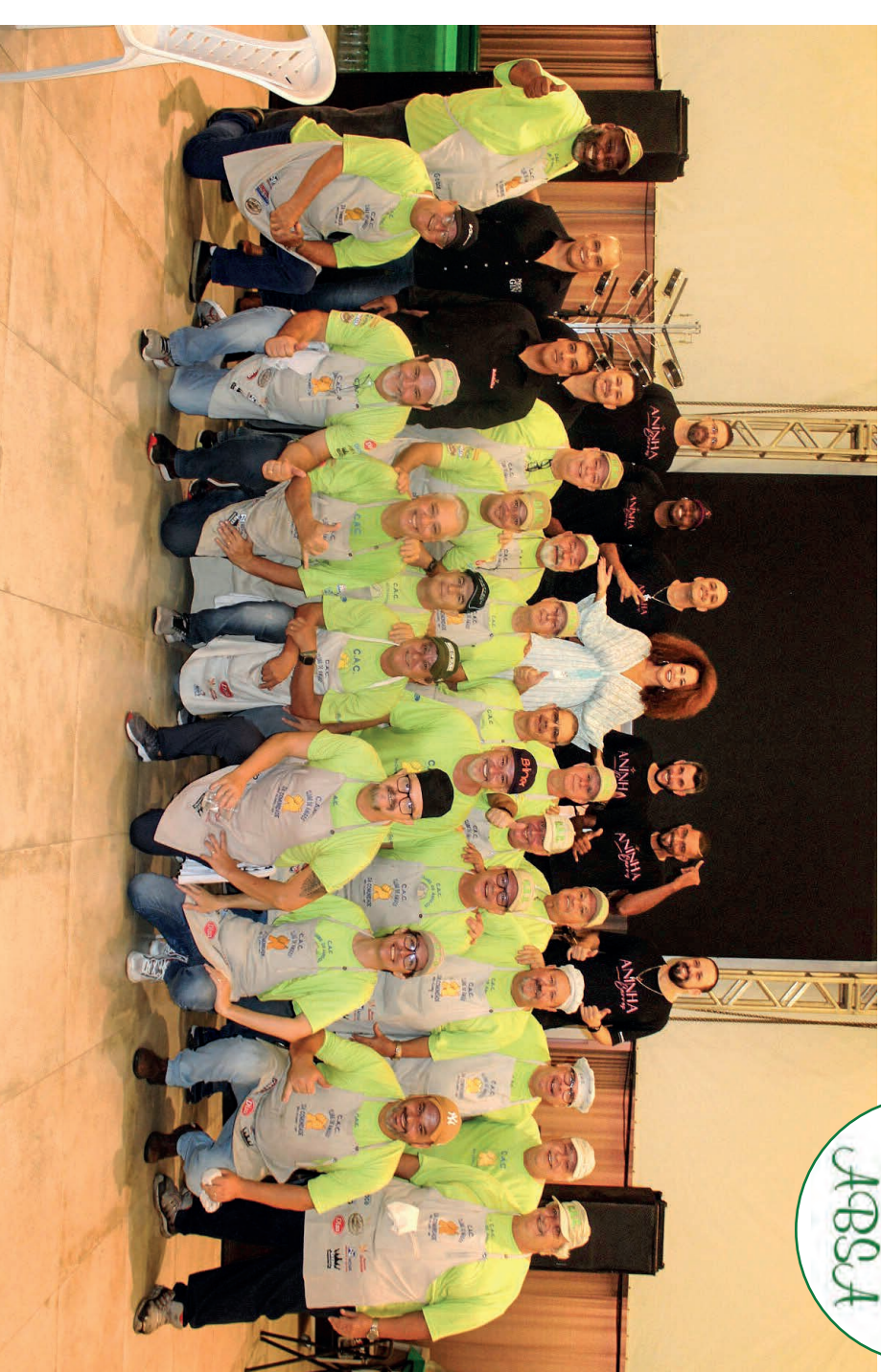
Samba D'Aninha e Equipe que do CAC - Clube Amigos da Comunidade