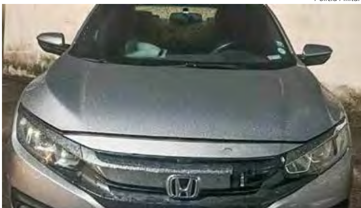
Carro tinha placas adulteradas com fita adesiva preta

Os policiais tentaram fazer a abordagem, mas o motorista optou por se evadir, sendo perseguido e abordado finalmente nas proximidades do pedágio de Rio Claro. Com ele havia um adolescente.