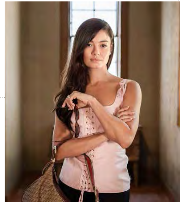
Sophie Charlotte vive Eliana em “Renascença”