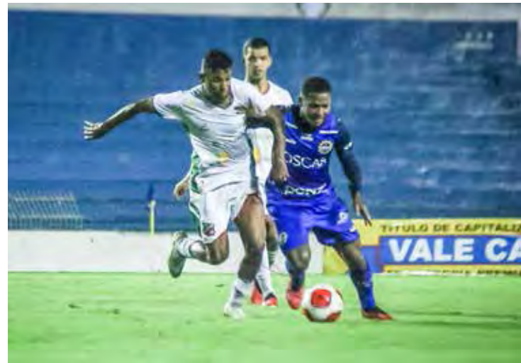
Garra velista foi determinante para vitória e classificação

3x1 na disputa de pênaltis. O primeiro jogo entre as equipes grenás disputado em São Paulo no último domingo, acabou empatado de 1x1.