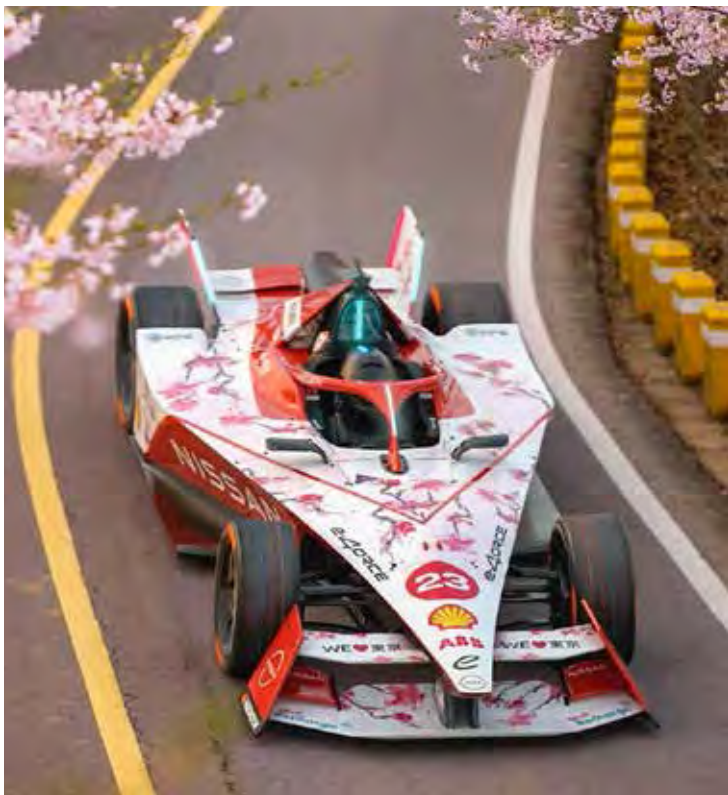
Nissan tem pintura especial para celebrar a primeira oportunidade da história de correr no Japão pela Fórmula E