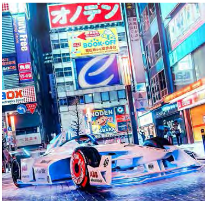
A Fórmula E vai correr pela primeira vez na história no Japão

Já os brasileiros não vivem um bom começo de ano. Desclassificado em São Paulo, Sérgio Sette Câmara é o 16º com dois pontos, enquanto Lucas di Grassi, que foi o 13º na última etapa, segue sem pontuar e está em 19º no Mundial.