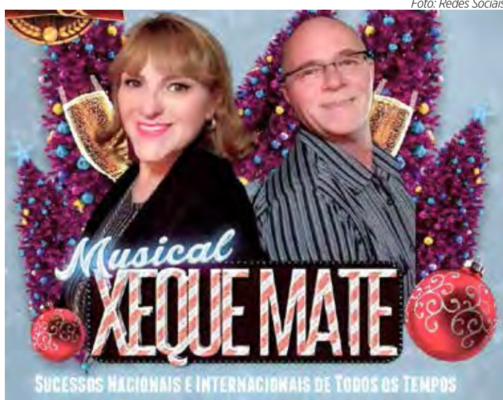
Musical Xequê Mate no Chopp & Cia.