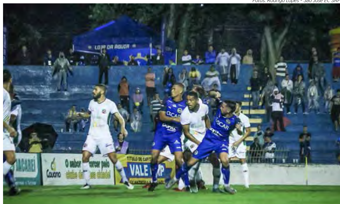
Velo Clube derrota São José, fora de casa

A renda do jogo São José 1 x 2 Velo Clube foi de R$115.325,00 para um público pagante de 4.557 torcedores.