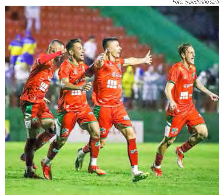
Velo Clube decide em casa o acesso à Série A1.

Jogos de Ida: 30/3 (Sábado) 15h00: Noroeste x Portuguesa Santista