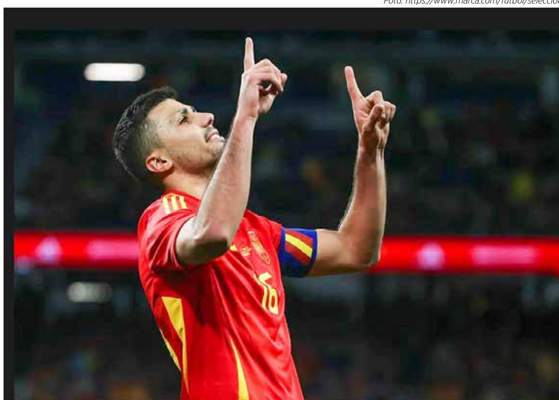
Rodri, assim como todo o time espanhol, não entendeu a vontade do time brasileiro durante o “amistoso”.

“Não entendi muito os argumentos. Estamos jogando muito no final da temporada, pode haver lesões... Os resultados valem muito pouco, importam quando chega a Eurocopa e a imagem que a equipe apresenta é crescimento e solidez, foi isso que levamos conosco para a Eu-