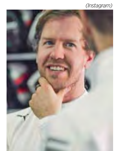
Vettel impressiona Porsche e pode participar das 24 Horas de Le Mans

As 24 Horas de Le Mans estão marcadas para acontecer entre os dias 15 e 16 de junho, no Circuit de la Sarthe, na França.