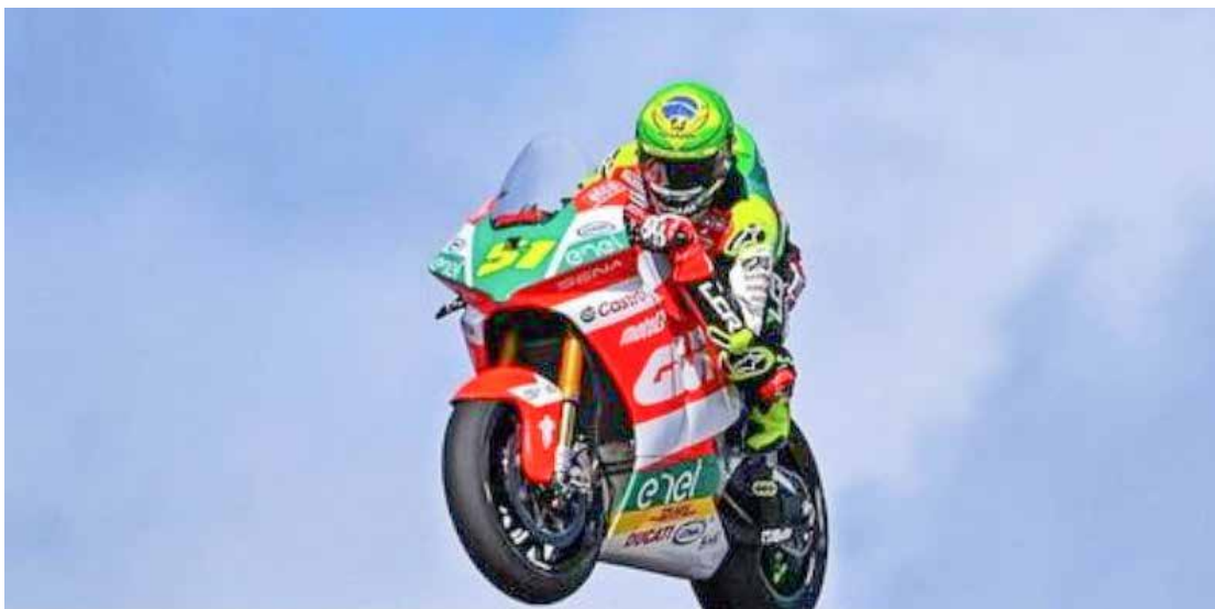
Brasileiro satisfeito com o resultado dos treinos de pré temporada da MotoE