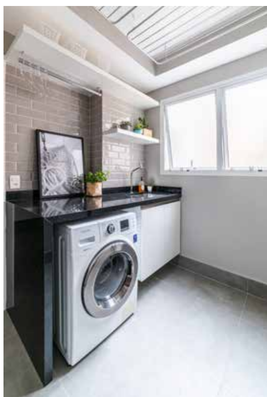
Neste projeto, prateleiras atendem as necessidades dos moradores no dia a dia. Ao lado da lava e seca, o armário abriga produtos de limpeza e outros objetos

Para receber vassouras, rodos, pás e outros utensílios de limpeza,