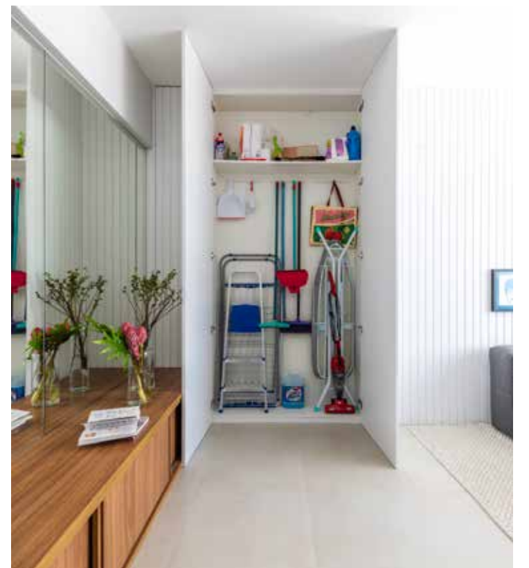
Nem sempre a área de serviço apresenta espaço suficiente para armazenar tudo o que se precisa. Sendo assim, a alternativa é recorrer a outros cômodos, como na sala de estar deste apartamento

"Vale lembrar que em residências com crianças, idosos e pets, produtos de limpeza devem ficar longe do seu alcance, seja em prateleiras mais altas ou em armários com travas", finaliza Júlia.