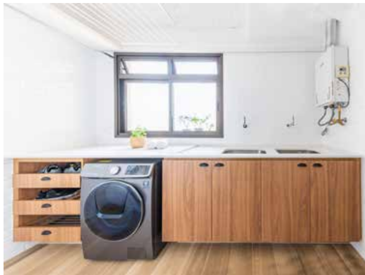
Neste apartamento, a marcenaria planejada da área de serviço possibilitou que tudo ficasse organizado no ambiente