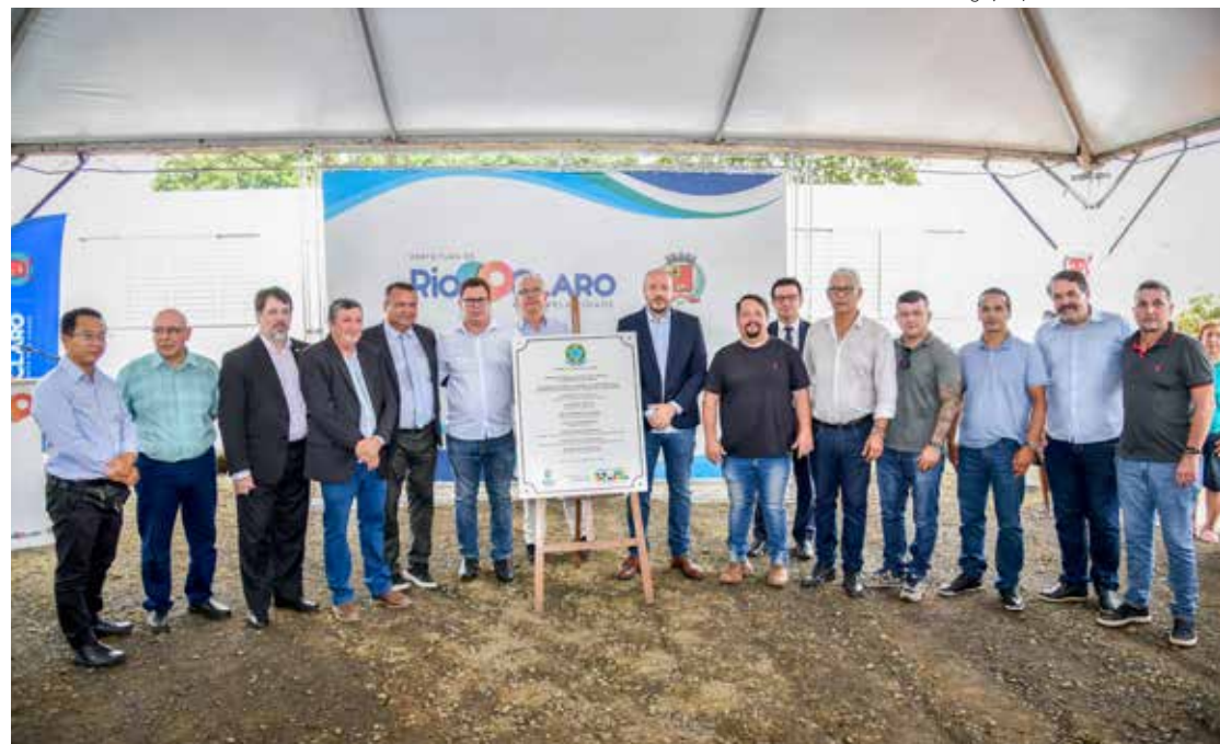
O lançamento oficial das obras do IFSP foi realizado nesta segunda-feira, dia 26

A portaria que autorizou o funcionamento do IFSP em Rio Claro permite que o campus tenha até 40 docentes e 26 técnicos administrativos, além de 800 alunos matricu-