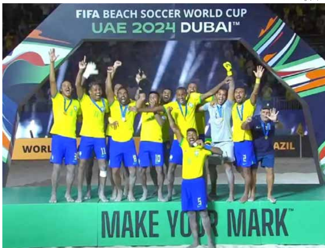
Os atletas brasileiros comemoraram a volta ao lugar mais alto do pódio