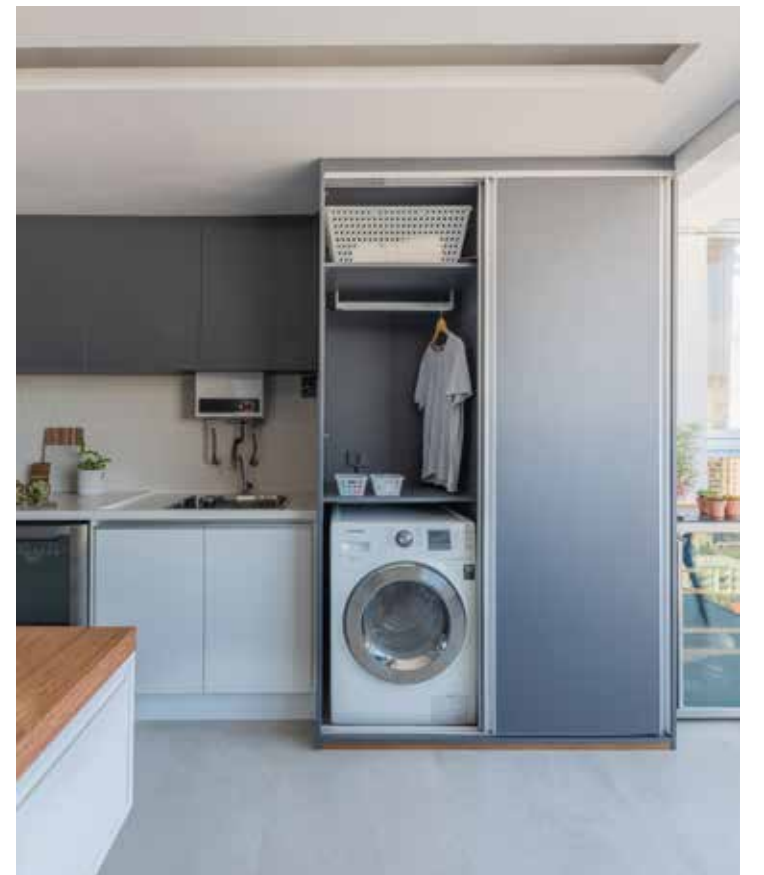
Neste projeto, um móvel armazena produtos e itens de limpeza, e também abriga a máquina lava e seca, economizando espaço no ambiente

60 cm de frente é um bom tamanho, cabe até um varal dobrável. E considerando que a área de serviço em geral é um cômodo reduzido, entre 40 e 45cm de profundidade já é o suficiente.