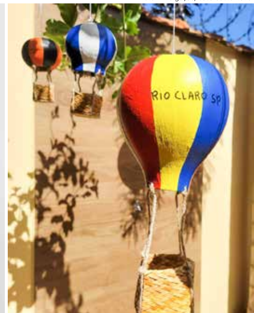
Exemplos de souvenirs produzidos pelas artesãs da Casa Sustentável do Shopping Rio Claro

podem proporcionar uma sensação de conforto e familiaridade, especialmente para aqueles que sentem saudades de casa ou se sentem deslocados durante uma viagem".