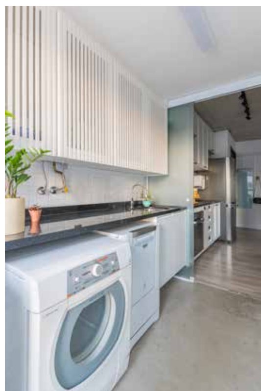
Nessa área de serviço, a arquiteta Júlia Guadix instalou um armário que acompanha o perímetro do cômodo