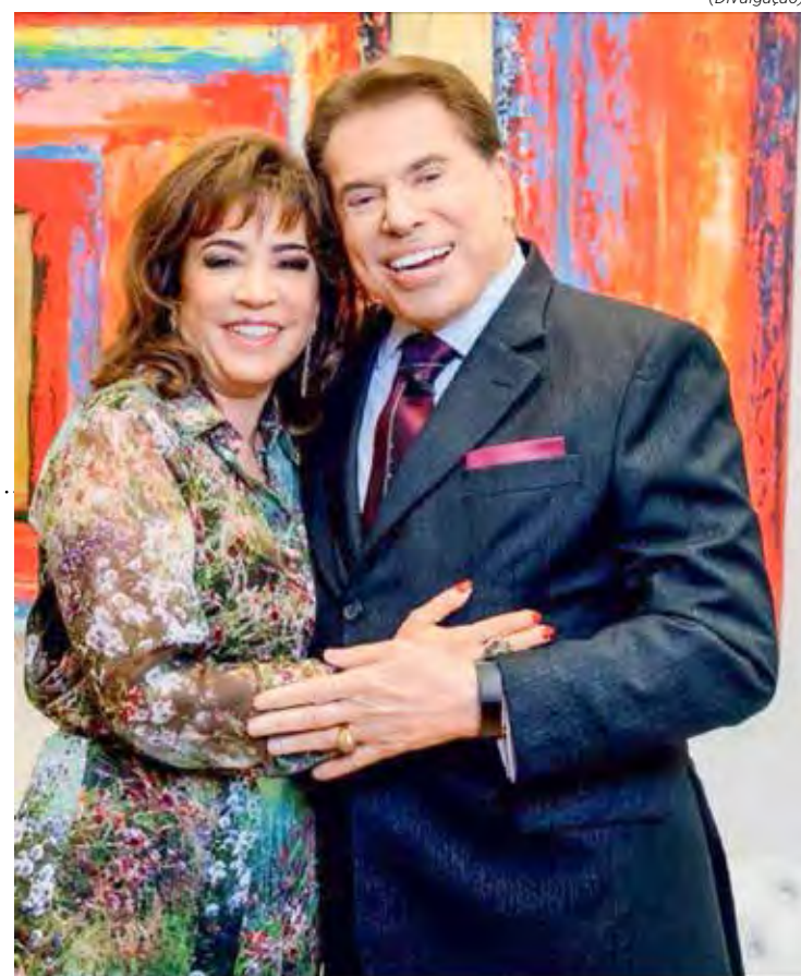
Iris Abravanel, dona das novelas, e Silvio Santos, dono de tudo