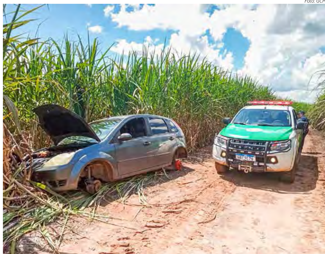
Caso aconteceu essa semana

Uma equipe da Polícia Científica foi acionada para realizar os procedimentos necessários no local. Posteriormente, o veículo