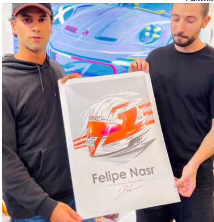
Obra limitada é autografada pelo piloto Felipe Nasr, campeão das 24 Horas de Daytona

Para adquirir a obra ao preço de R$ 1.999,00, basta acessar o link https://www.linkedin.com/posts/adonisallici_only-24-prints-for-the-24h-win-activity-7166105293787938817-IP74