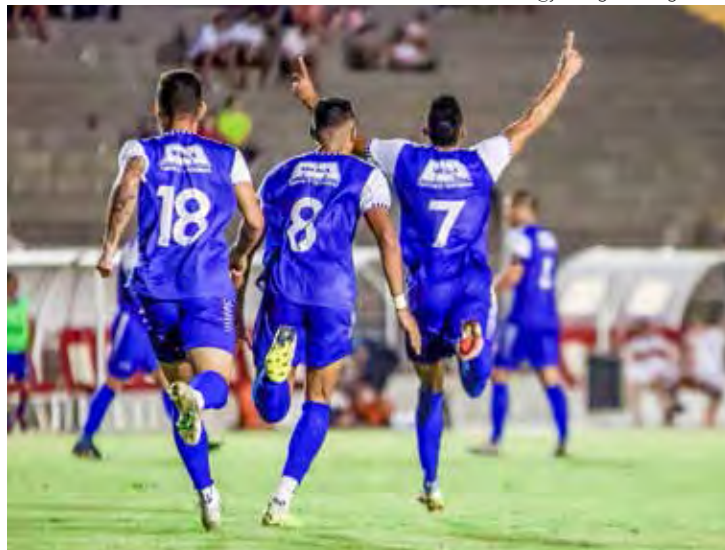
Rio Claro quer os três pontos no Benitão