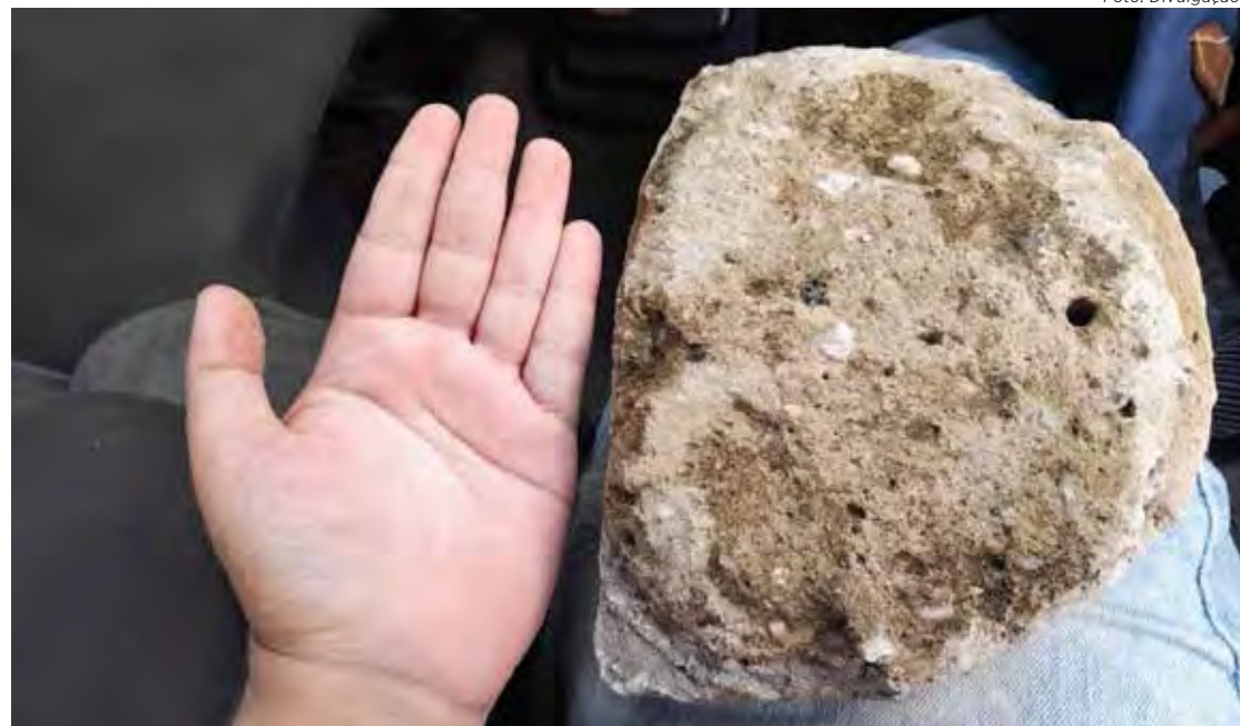
Pedra arremessada pela moradora contra o agente foi coletada como prova

De acordo com ele, equipe de combate à dengue fazia ação de bloqueio no bairro porque foi confirmado caso positivo da doença na