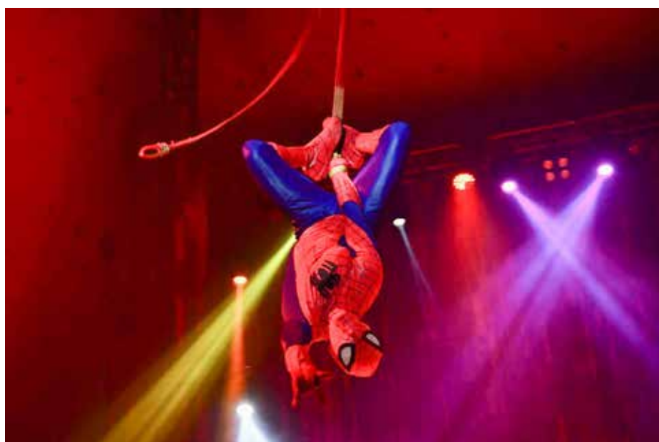
O circo tem espetáculo que inclui música, dança, Homem-Aranha e muitas outras atrações

O maior circo gratuito da América Latina se despede de Rio Claro neste final de semana. O Happy Day Circus tem três sessões nesses dois dias, às 16h, 18h e 20h. São os últimos dias para curtir com toda a família espetáculo que inclui música, dança, Homem-Aranha, malabaristas, contorcionistas, equilibristas, acrobatas, trapezistas e muito mais, em espetáculos de 90 minutos. Não há cobrança de ingresso.