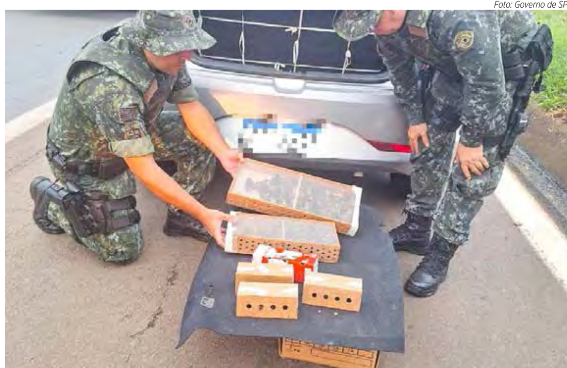
Pássaros foram apreendidos e entregues para serem reintegrados à natureza

Em vistoria, encontraram no porta-malas, sob o tampão do estepe, 81 aves silvestres de diversas espécies, como trinca-