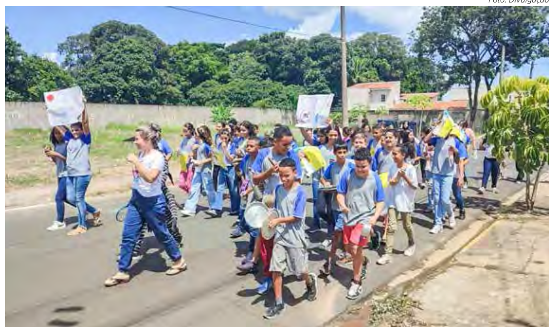
Passeata foi realizada na tarde desta sexta-feira

A população é orientada pela Fundação Municipal de Saúde a descartar possíveis criadouros do mosquito e evitar o acúmulo de água em recipientes, pois essa situação é favorável à procriação do mosquito. Rio Claro totaliza 87 casos de dengue neste ano.