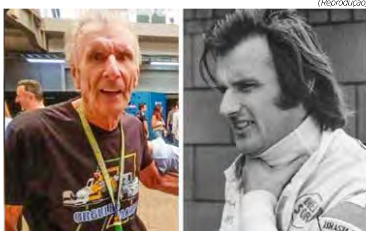
Ex-piloto estava internado desde o dia 25 de dezembro por conta de uma parada cardíaca