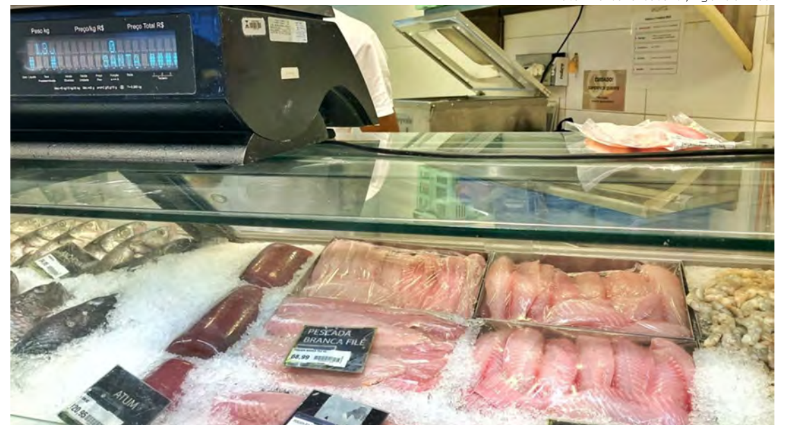
Ao adquirir pescados, o consumidor precisa ficar atento às condições dos produtos

O equipamento tem que estar em local nivelado, com superfície plana, sem calços, e que suporte o peso colocado.