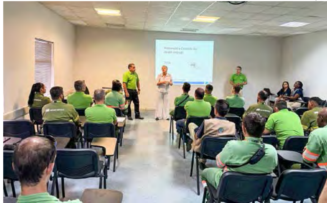
Leituristas e eletricistas da distribuidora de energia serão capacitados para a ação