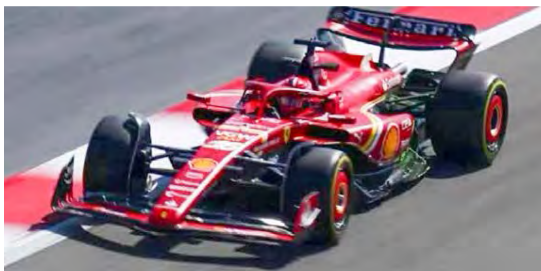
Charles Leclerc liderou o terceiro e último dia de pré-temporada da Fórmula 1

A Fórmula 1 abre a temporada 2024 no próximo fim de semana, entre os dias 29 de fevereiro e 2 de março, com o GP do Bahrein.