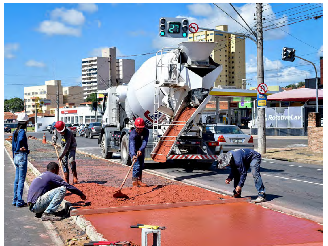
Nesta sexta-feira (23) a concretagem estava sendo feita na altura do cruzamento com a Avenida 16