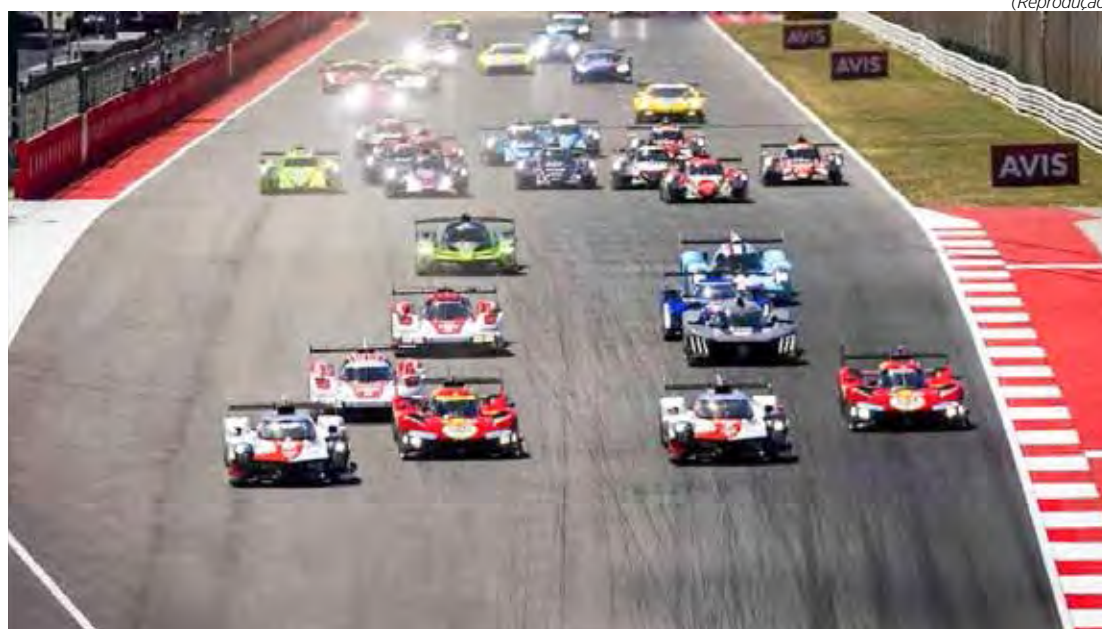
Grupo Bandeirantes vai transmitir as corridas do FIA WEC para todo o país

E os trabalhos já começam com os treinos para os 1812 km do Catar, que acontecerão no dia 1º de março. A largada da corrida está prevista para as 5 da manhã do dia 02 de março.