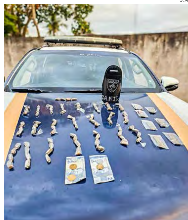
Drogas e dinheiro apreendidos durante a ação dos guardas municipais

A mãe do adolescente foi informada da situação, a qual compareceu ao Plantão Policial, onde foi registrado o BO/PC de Ato Infracional de Tráfico de Entorpecentes, sendo apreendidas as drogas e o menor liberado para a mãe. As informações são da GCM.