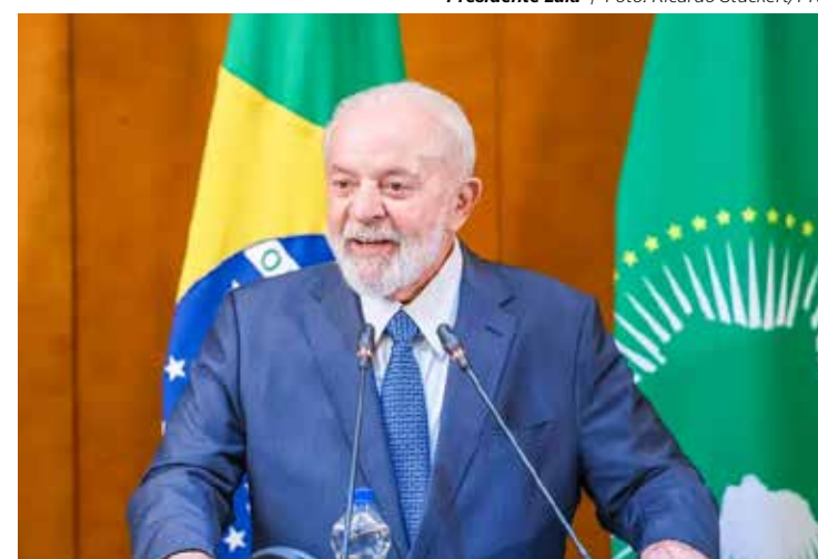
Presidente Lula

verter sua inelegibilidade de maneira a disputar as eleições presidenciais de 2026. Bolsonaro foi declarado inelegível pelo Tribunal Superior Eleitoral (TSE) em junho do ano passado por abuso de poder político e uso indevido dos meios de comunicação durante reunião realizada no Palácio da Alvorada com embaixadores estrangeiros no dia 18 de julho de 2022. Atualmente, o ex-presidente responde a diversos processos na Justiça e, caso seja condenado em todos eles, poderá pegar até 23 anos de prisão e ficar inelegível até 2047. Porém, ele afirma ter sido vítima de “injustiça” e acredita na reversão do quadro. Vamos ver o que ele dirá hoje à Polícia Federal quando deverá depor para esclarecer a suposta tentativa de golpe de Estado no país. A defesa tentou, por duas vezes, adiar o depoimento alegando não ter tido acesso aos autos do processo, mas sem sucesso. Ele não estará sozinho. Outros dez investigados também vão prestar depoimento à PF, que realizará as oitivas de forma simultânea. Não canso de bater na mesma tecla: gostaria de ver a mesma disposição e empenho nos casos de outros figurões da política. Tem muita gente que nunca foi