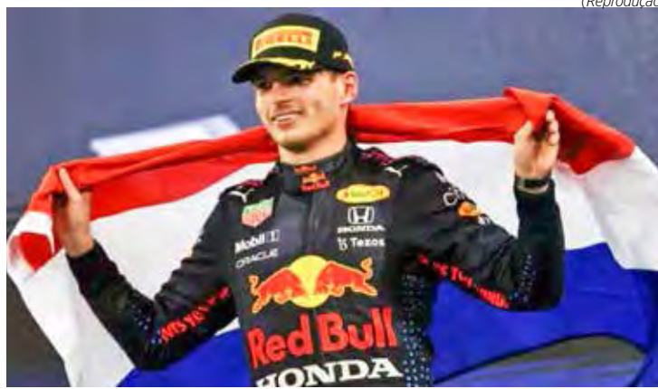
Max Verstappen foi o melhor no primeiro dia de testes da pré-temporada da F1

E depois de ser o mais rápido da manhã, o holandês fez 1m31s344 nos pneus médios, de tarde, para desbancar com facilidade Lando Norris e Carlos Sainz. Ricciardo e Gasly completaram os cinco primeiros da tabela de tempos.