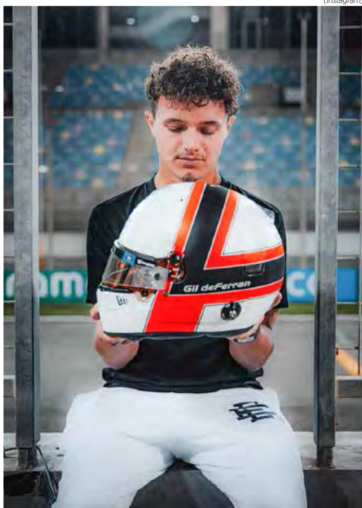
Piloto inglês exibiu layout de casco que usou nesta quarta-feira: “me ajudou dentro e fora da pista”

“Este é o design com o qual ele ganhou a Indy 500, e vou usá-lo como minha pequena maneira de agradecer por tudo e para que ele saiba que estamos pensando nele e que ele ainda faz parte da McLaren. Espero que você goste. Essa é para você, Gil.”