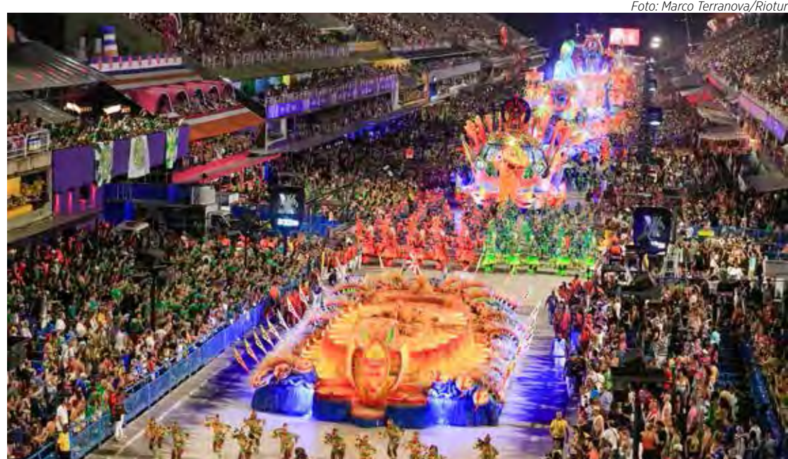
Cerca de 8 milhões de pessoas curtiram o Carnaval na cidade do Rio de Janeiro

A Marques de Sapucaí teve cerca de 120 mil pessoas por dia em seis dias de desfiles da Série Ouro, do Grupo Especial e das escolas mirins. Já o Terreirão do Samba contabilizou 41 atrações em 10 dias de evento. O Carnaval na Intendente Magalhães registrou 250 mil pessoas circulando em seis dias de desfiles. Os bailes populares realizados pela Riotur atraíram 720 mil pessoas em 60 palcos em quatro dias de evento.