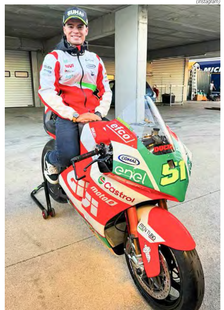
Eric Granado mostrou através das redes sociais a “máquina” que vai usar nesta temporada

Maior vencedor – Eric Granado é o piloto com maior número de vitórias na história do Mundial, com onze primeiros lugares. O brasileiro também detém o recorde de pole positions (8) e voltas mais rápidas em corrida (13). Deste total, o Granado registrou seis vitórias e 12 pódios competindo pela LCR em apenas dois anos.