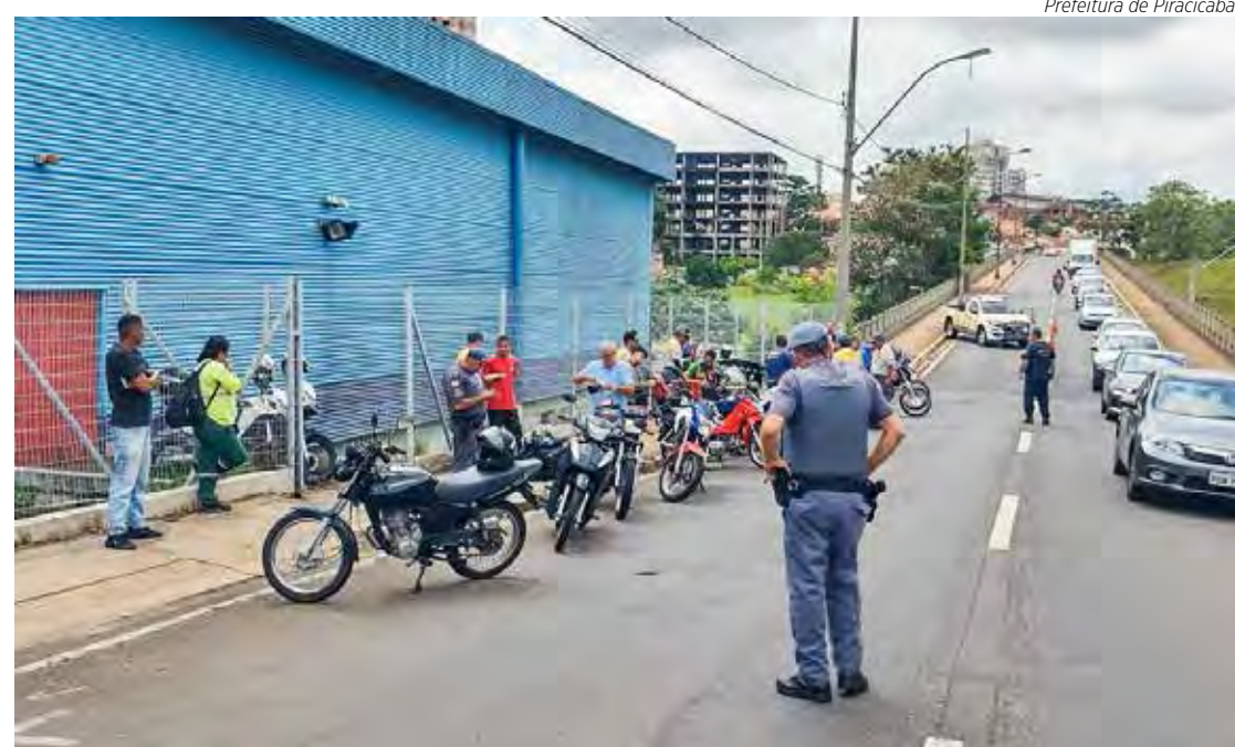
Ação aconteceu na avenida Dr. Paulo de Moraes

Ele explicou que no Artigo 230, Inciso XI, do Código de Trânsito Brasileiro consta que veículos que trafegam com descarga livre ou