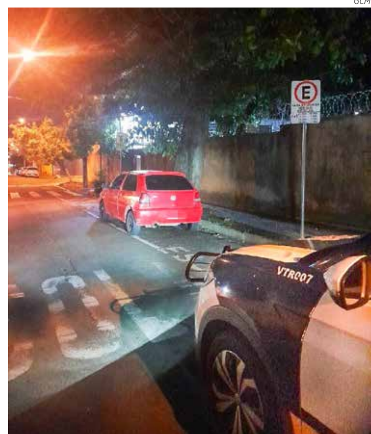
Gol vermelho furtado na Avenida 27 no Bairro Estádio

Posteriormente a vítima reconheceu seus pertences sendo seu boné e o relógio que estavam dentro do veículo. Diante dos fatos as partes foram encaminhadas para o Plantão Policial, onde foi registrado o flagrante de furto e o indivíduo recolhido a carceragem local, ficando à disposição da Justiça. Todas as informações são da GCM.