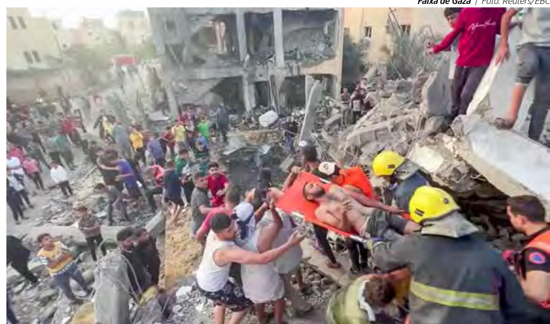
Faixa de Gaza

• Se o MPE vai acatar a solicitação, ninguém sabe, por isso, caravanas de apoiadores e aliados de Bolsonaro estão se mobilizando rumo a São Paulo para participarem do ato. Este será o primeiro ato de grandes proporções convocado por Bolsonaro após deixar a presidência. O ex-presidente quer medir sua força política e mostrar apoio popular frente às investigações feitas pela Polícia Federal com autorização do Supremo Tribunal Federal (STF). É uma faca de dois gumes: tanto pode reunir uma multidão e calar a boca dos adversários, quanto pode ter baixa adesão e ser uma prova contundente da falta de apoio e queda na popularidade. O que causa estranheza um partido que se diz democrático, que já organizou tantos atos, tentando impedir uma manifestação supondo que os manifestantes poderão cometer algum delito.