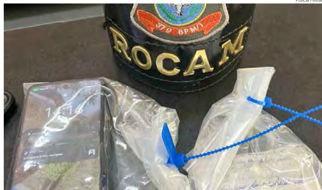
Itens apreendidos durante a ação policial

Segundo o registro policial, a equipe da ROCAM (Rondas Ostensivas com Apoio de Motocicletas) fazia patrulhamento rotineiro pelo bairro Recanto Paraíso, na tarde da última segunda-feira, quando notou um veículo em situação considerada suspeita. O carro estava na rua