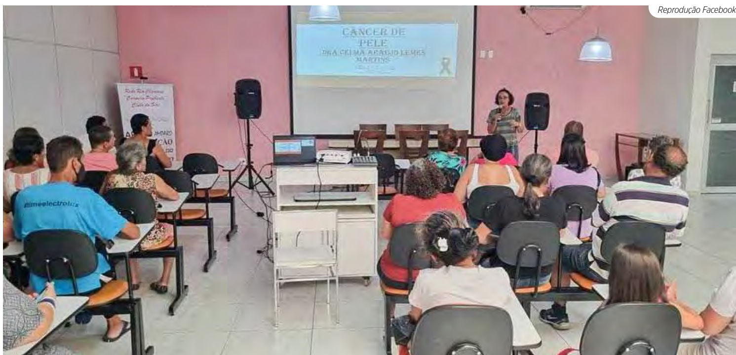
Evento reuniu também familiares dos atendidos pela entidade

A Rede Rio-clarense Carmem Prudente Clube do Siri fica na Rua 1, 464. O telefone é 19 9 9774-8793. Mais informações sobre o trabalho da entidade podem também ser obtidas pelo e-mail redecombatecancer.rc@gmail.com