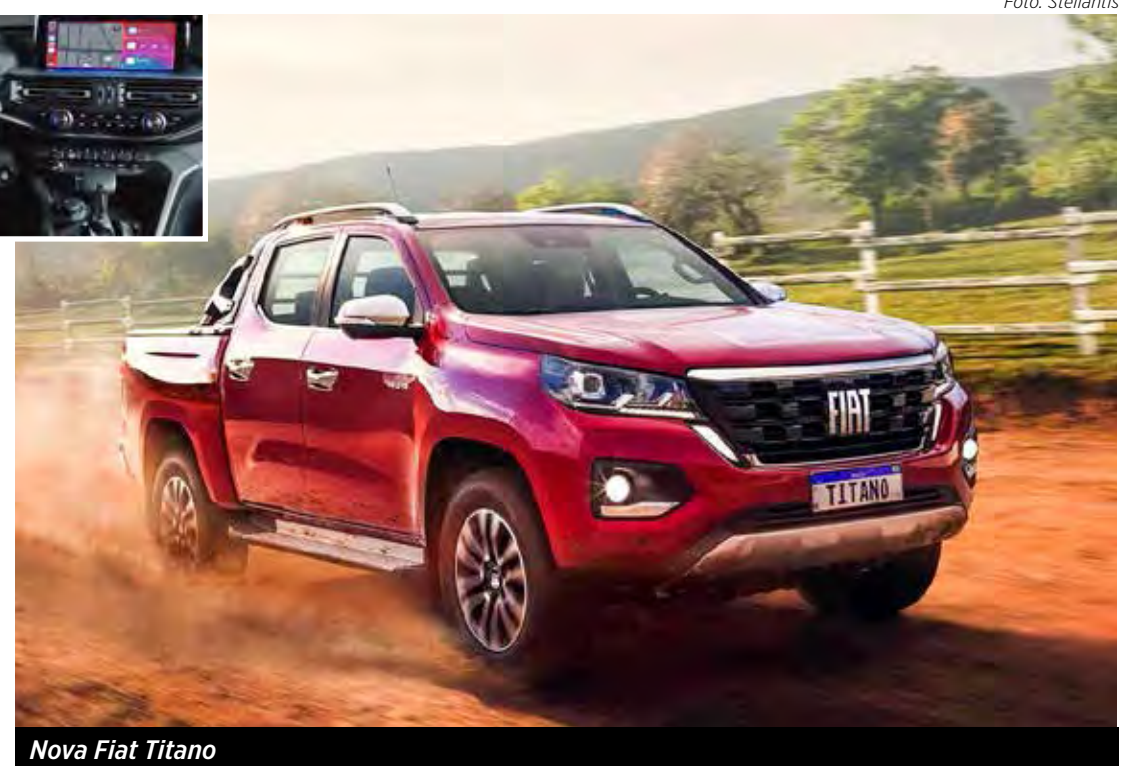
Nova Fiat Titano