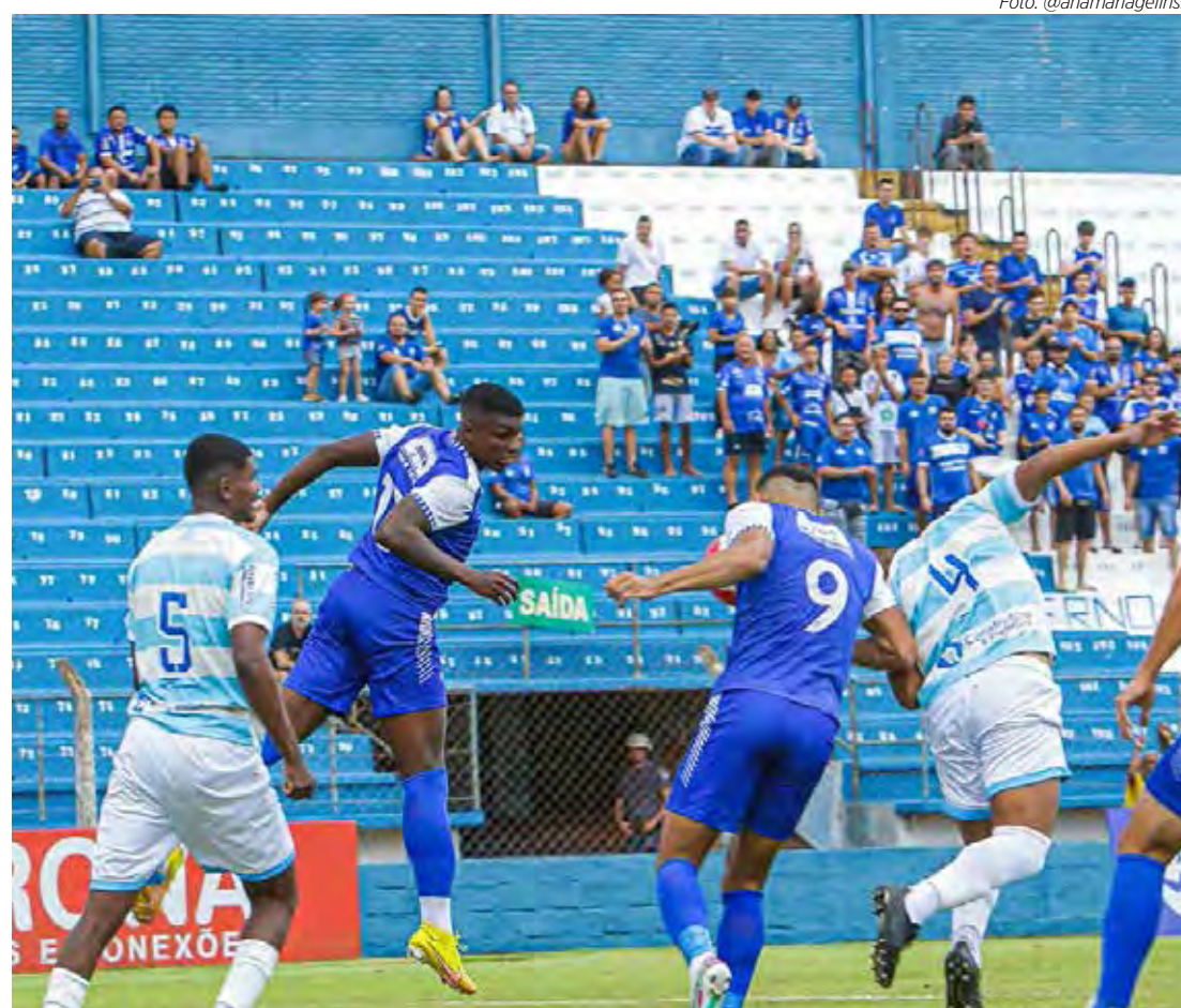
Rio Claro vem de vitória sobre o Taubaté

Adversário do Rio Claro no jogo desta noite, o Capivariano não faz