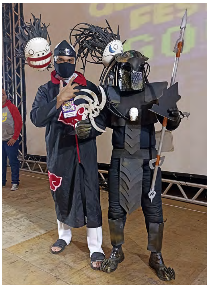
PREMIAÇÃO PRIMEIRO LUGAR COSPLAY GEEK POP FEST 2023

VAI ROLAR 25 FEVEREIRO – NATSU MATSURI – SÃO VICENTE - @SORAPRODUcoes