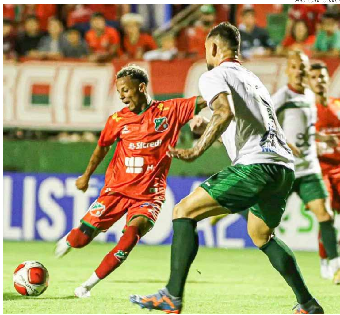
Velo vai ao ataque contra o XV