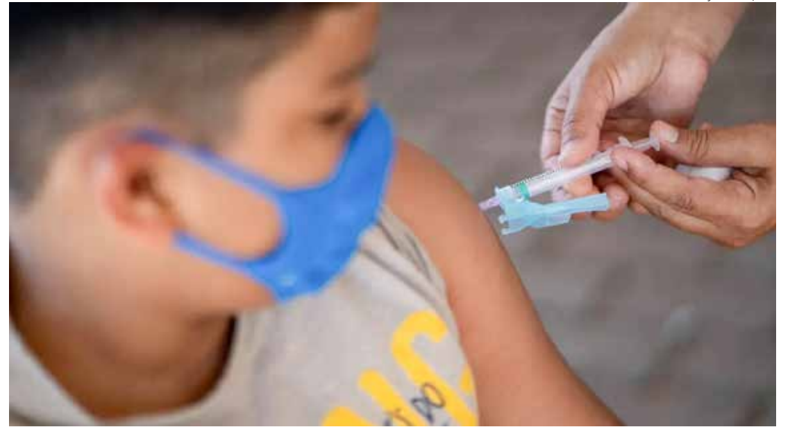
Vacina contra a Covid-19 foi incluída no calendário nacional de imunização para crianças menores de 5 anos

A proposta de Cortez substitui o Projeto de Lei nº 05/2024, do deputado Paulo Mansur (PL), que