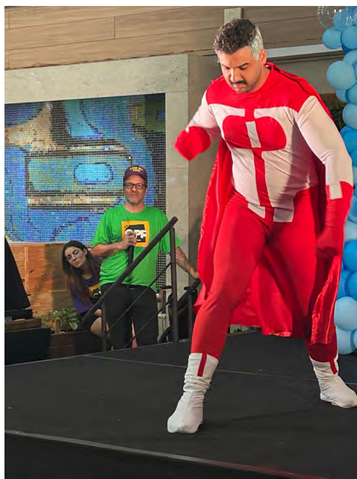
ESQUENTA GPF 2023

Com certeza. Na verdade já conheço e vejo algumas pessoas como celebridades