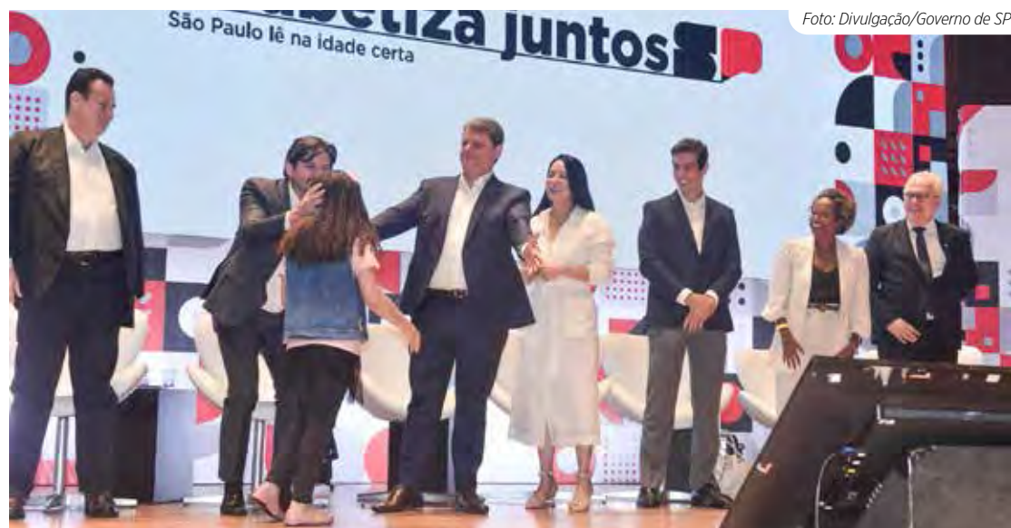
Governo de SP lança parceria com municípios para alfabetizar crianças de até 7 anos

– Criação de incentivos financeiros para escolas com os melhores resultados de alfabetização, monitoradas por meio do Sistema de Avaliação do Rendimento Escolar do Estado de São Paulo (Saresp) para 2º e 5º anos do ensino fundamental. A expectativa do Estado é investir R$ 200 milhões nesta ação.