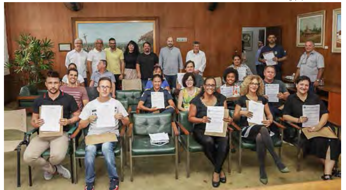
Conselho tem representantes do setor governamental e da sociedade civil

O conselho de segurança alimentar tem como objetivo elaborar diretrizes para a política local de segurança alimentar e nutricional, além de orientar a implantação de programas municipais ligados à alimentação, nutrição, educação alimentar, agricultura, saúde, meio ambiente e geração de renda, esta-