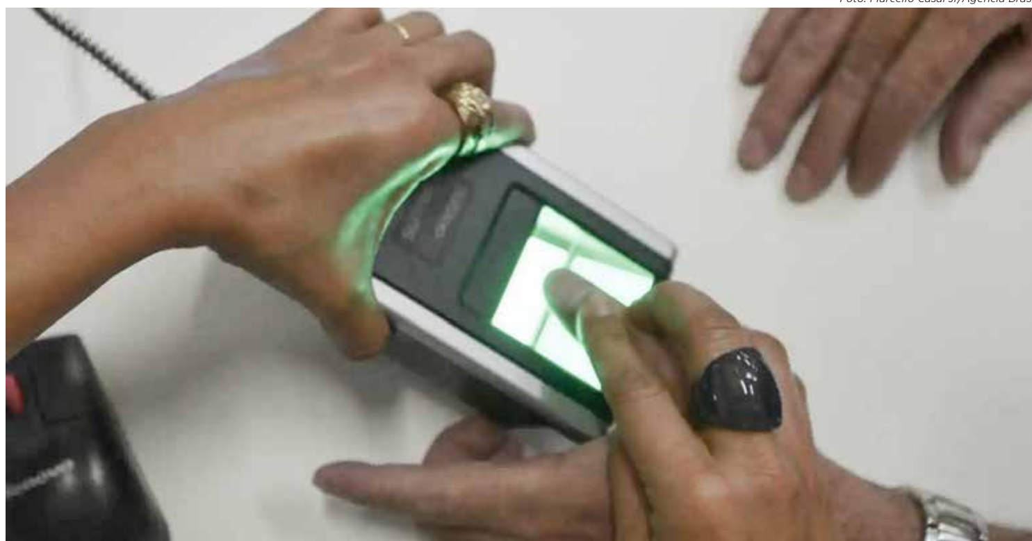
A biometria coleta as impressões digitais, fotografia e assinatura digitalizada do eleitor

Como 2024 é ano eleitoral, a biometria, assim como emissão de título e alteração de dados cadastrais, deve ser feita até 8 de maio. Após essa data, o serviço será suspenso e retomado somente após as