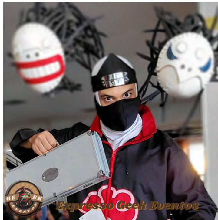
COSPLAY DE KAKUZU DE NARUTO

"descolados", me deixa feliz, pois o que antes era algo bobo e pouco falado hoje se tornou de certa forma um comércio e paixão compartilhada. Como falado acima, alguns até vivendo disso, então esse universo em expansão geek que engloba tudo, filmes, séries, músicas, artes e desenhos, chega a ser mágico.