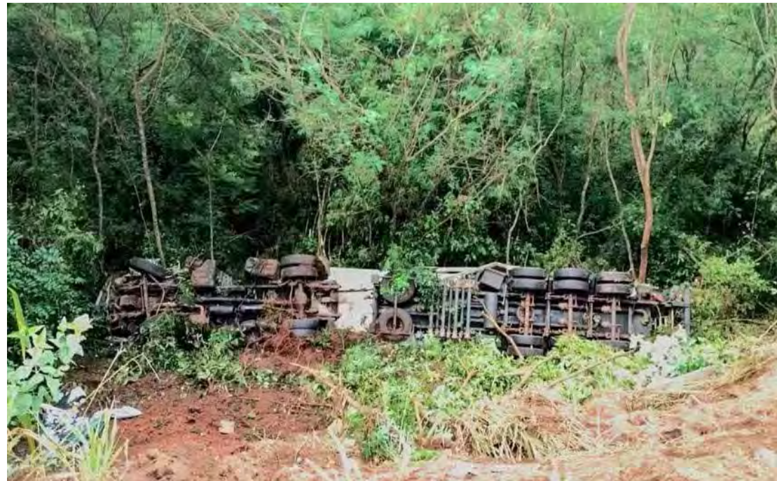
Motorista sofreu ferimentos leves

O acidente foi por volta de 8h10, no quilômetro 199 da pista. O veículo tombou em uma ribanceira ao longo da lateral da estrada. A Polícia Rodoviária, o Corpo de Bombeiros e a concessionária Eixo SP foram para o local para providenciar a acompanhar o destombamento da carreta.