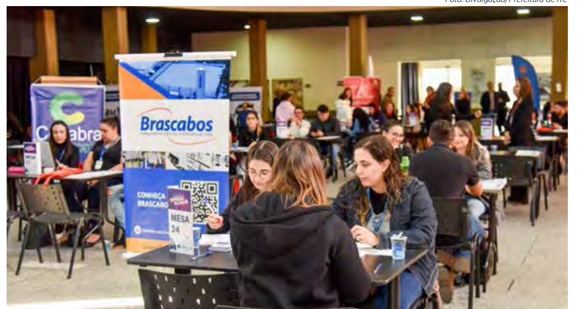
A feira começará às 9 horas com término previsto para as 17 horas no Ginástico

as oportunidades da Feira de Empregabilidade devem ter mais de 18 anos e apresentar RG, CPF e currículo atualizado. Para agilizar o atendimento, também devem estar com o cadastro atualizado no Portal da Empregabilidade.