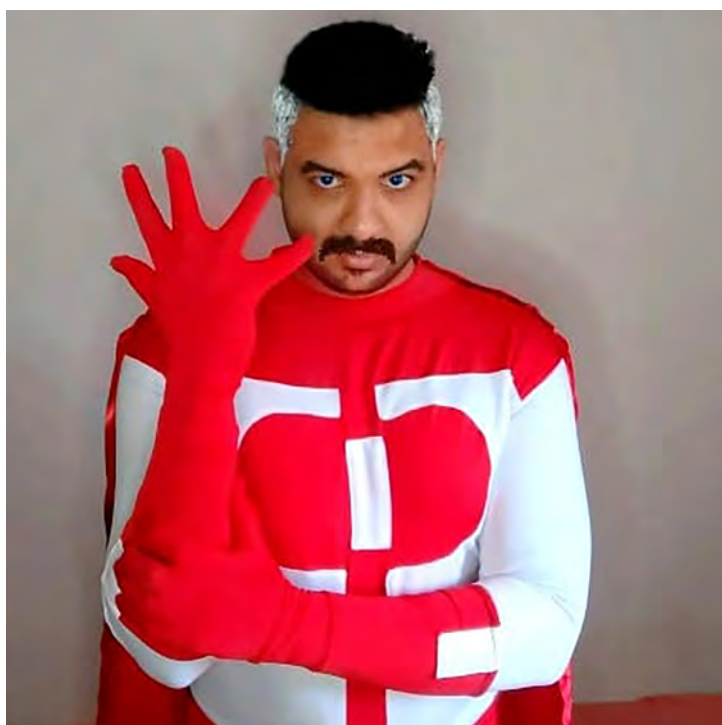
COSPLAY DE OMINI MAN

conversas rrsrs adoro também me divertir e enfrentar desafios que me impulsionam a ser sempre melhor que ontem.