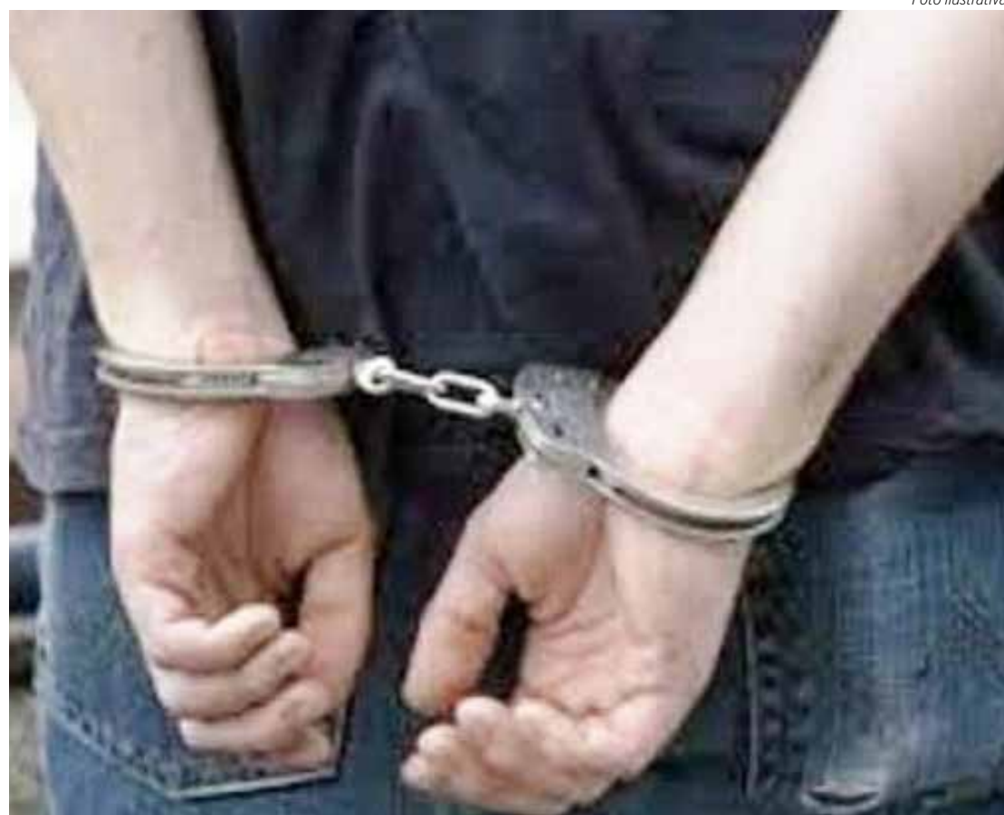
O homem foi preso no Jardim Conduta

Ele foi conduzido ao Plantão Policial de Rio Claro onde após os procedimentos de rotina foi preso e ficou à disposição da Justiça