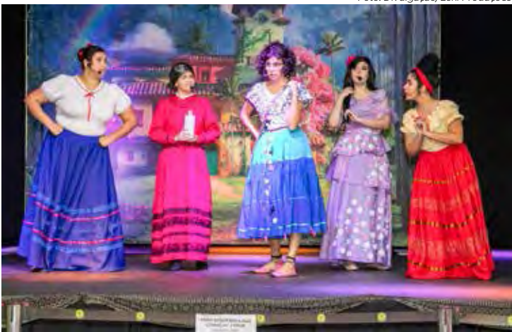
O musical “Encanto dos Madrigal” será encenado no sábado, 24 de fevereiro, na praça de alimentação