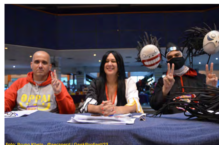
Foto: Bruno Kbeio - @aeranerdd | GeekPopFest/23 JURADO COSPLAY NO GEEK POP FEST 2023

novidades e a preocupação com seus participantes, também fomos chamados para auxiliar em outros lugares como igrejas, condomínios, para fazer festa com crianças e ser atração que