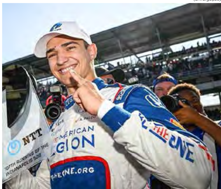
Atual campeão da Indy fecha o trio da Ganassi para a tradicional prova

Será a segunda oportunidade de Palou em uma prova tradicional do endurance este ano, após a disputa das 24 Horas de Daytona — também pela Ganassi —, que abriu a temporada de 2024 do IMSA SportsCar.