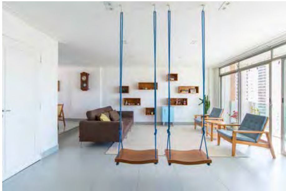
Neste projeto, a instalação do balanço foi realizada com ganchos diretamente na estrutura do teto

Análise do teto: verifique se é laje de concreto, pré-fabricada ou se trata de apenas um forro de gesso. Com exceção do concreto, onde o móvel é instalado diretamente no local, na laje pré-fabricada a peça é presa nas vigotas. Quando se trata de um