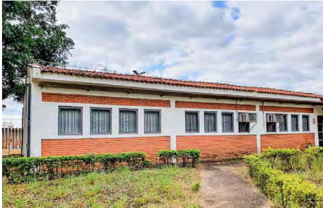
Prédio que abriga o Centro de Inovação Tecnológica de Rio Claro