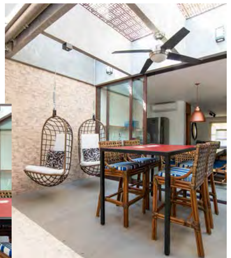
Neste projeto foram instaladas poltronas suspensas na área gourmet, o que trouxe mais conforto ao ambiente