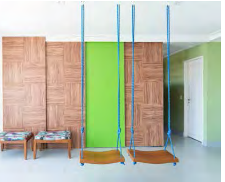
Projeto em apartamento alugado com aproveitamento dos espaços nos ambientes

para ambientes externos. “Há diversos materiais e modelos disponíveis. O formato oval é bem procurado e combina muito bem até mesmo para sacadas dos apartamentos, com opção de suporte de chão para quem não sentir segurança em pendurar a