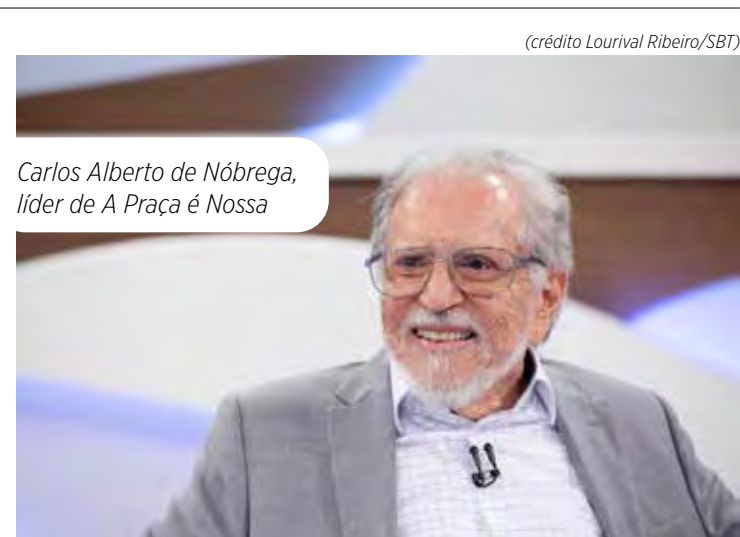
Carlos Alberto de Nóbrega, líder de A Praça é Nossa

Entende que vai ganhar muito mais com isso. Louvável!