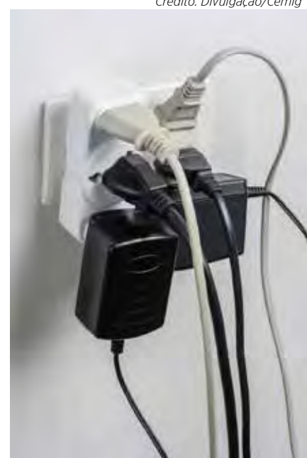
A conexão de mais de um aparelho na mesma tomada traz riscos de acidentes

É possível prevenir acidentes também utilizando os disjuntores diferenciais residuais (DRs). “Manter esse equipamento em perfeito estado de operação permitirá que, quando ocorra algum incidente, haja a interrupção do circuito elétrico da instalação, evitando danos ao circuito e aos aparelhos eletrônicos que estão conectados no momento”, reforça Mafra.