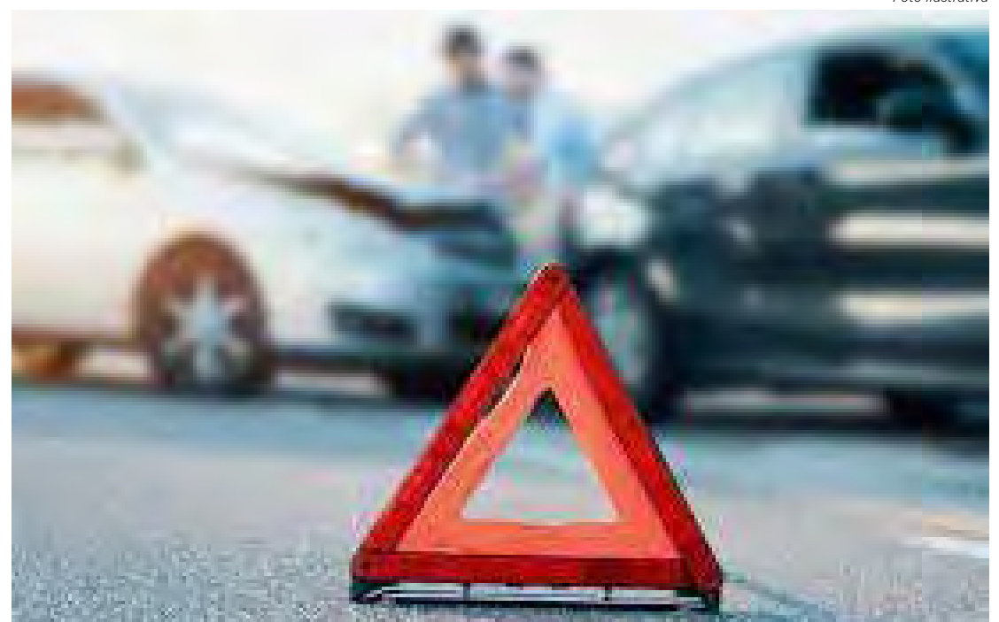
Havia latas de bebida alcoólica num dos carros envolvidos, mas motorista não apresentava sinais de embriaguez