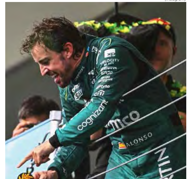
Alonso na vaga de Hamilton na Mercedes? E seguem as especulações

os movimentos do mercado de pilotos “com muito interesse” e já tenta se posicionar para a Mercedes, que terá uma vaga a partir de 2025, com a ida de Hamilton para a Ferrari. A publicação acrescenta que Alonso ainda não está na lista de Toto Wolff, chefe da equipe, mas provavelmente estará lá em breve.