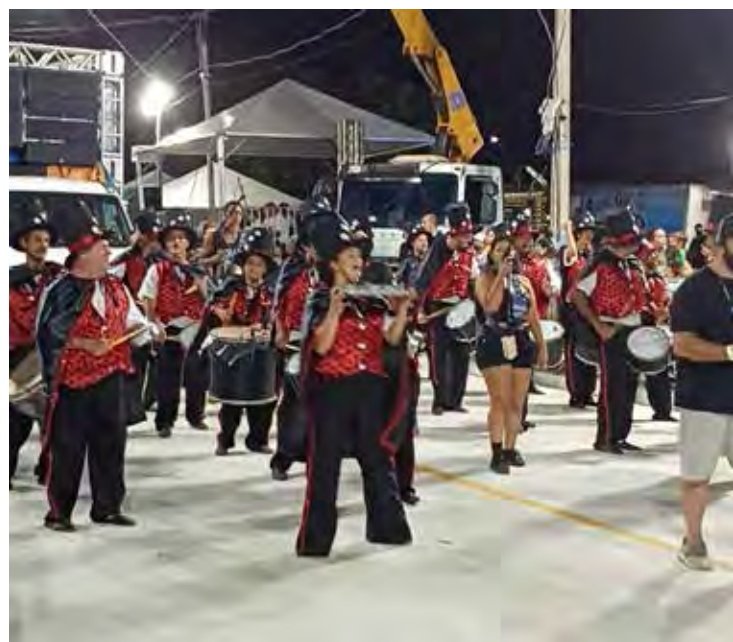
A Embaixadores do Samba levou para a avenida a história da arte circense no Brasil