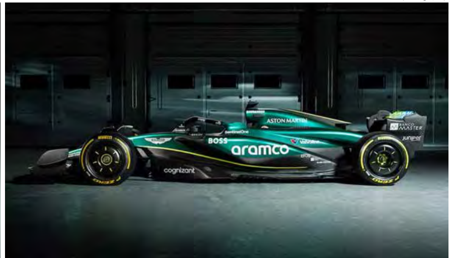
Aston Martin apresenta AMR24 em busca de entrar de vez entre equipes grandes da F1