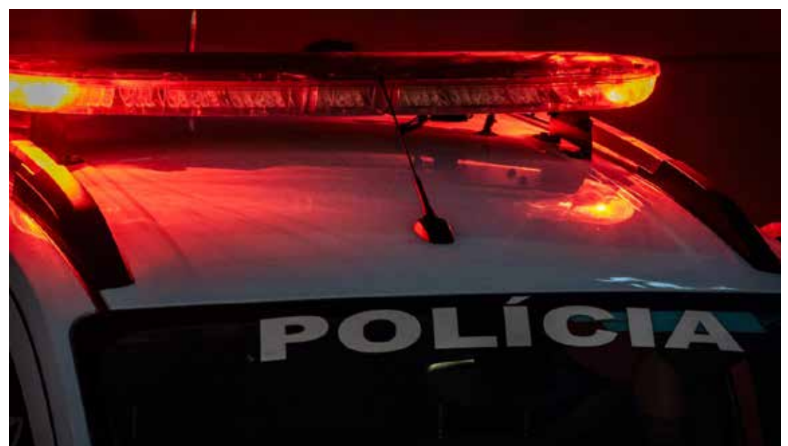
Ele tinha mais de 6 anos de cadeia a cumprir

Segundo o registro policial os agentes faziam patrulhamento de rotina quando viram um rapaz de bicicleta trafegando na contramão do fluxo da rua. Os agentes o reconheceram pois tinham informações prévias.