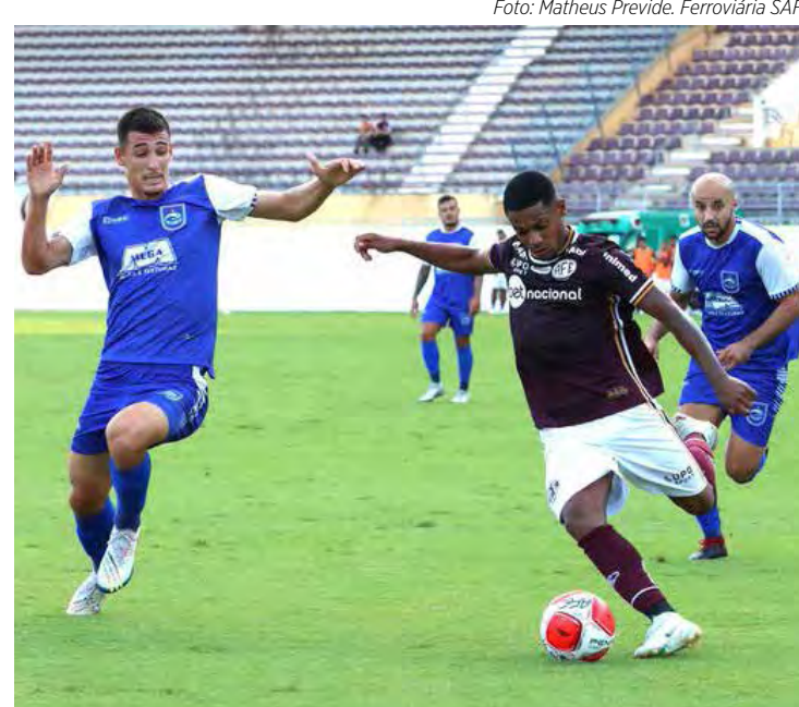
Ferroviária SAF

A equipe rioclarista foi valente e tentou buscar o empate, e quase conseguiu em duas oportunidades.