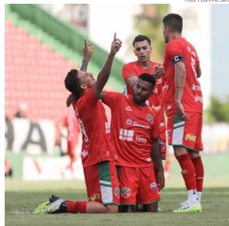
Jogadores comemoram mais um gol do Velo contra o Comercial