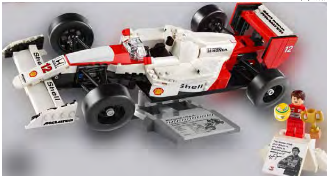
Modelo é conhecido por ser o carro que levou Senna ao seu primeiro título mundial

çado em 1º de março, ele tem valor sugerido de US$ 79 e é