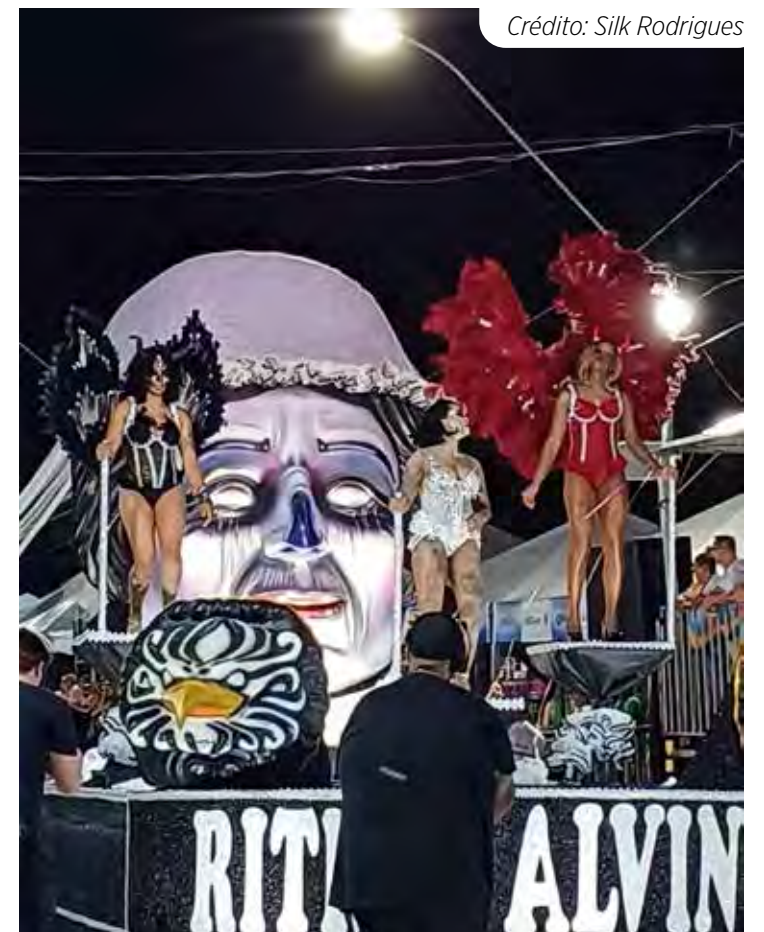
O medo foi o tema desenvolvido pela escola Gaviões da Fiel no Carnaval deste ano