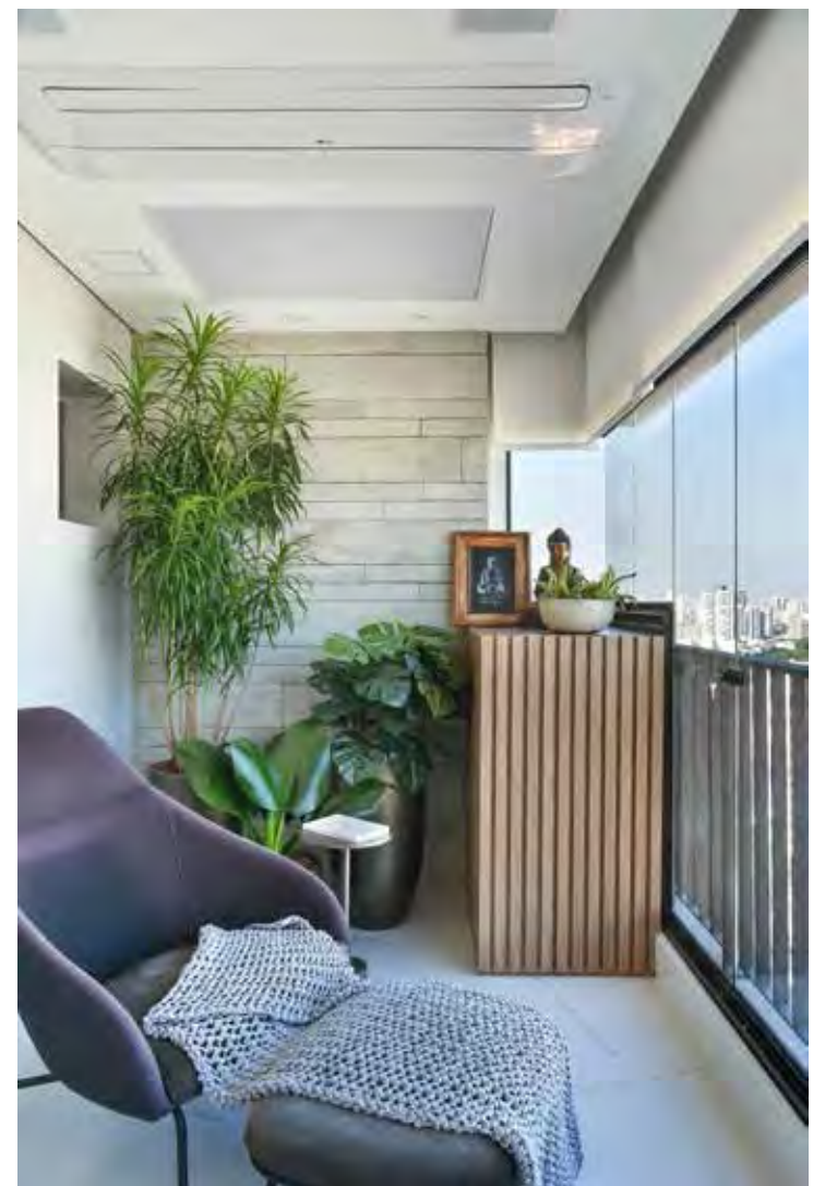
O revestimento cimentício suavizou a intensidade do concreto com os ares leves e agradáveis para relaxar

Para as áreas externas, a arquiteta recomenda a limpeza regular com água como forma eficaz de remoção das sujidades. Já nos espaços internos, basta a tradicional esponja ou pano com água e detergente neutro, mas caso alguma mancha persista, o mercado oferta produtos específicos para o revestimento cimentício. “Seguir as recomendações do fabricante é primordial para não se arrepender pela aplicação incorreta”, finaliza.