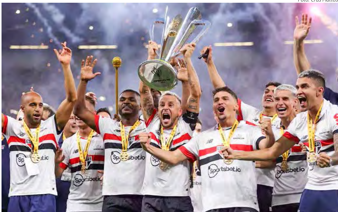
São Paulo fatura Super Copa 2024