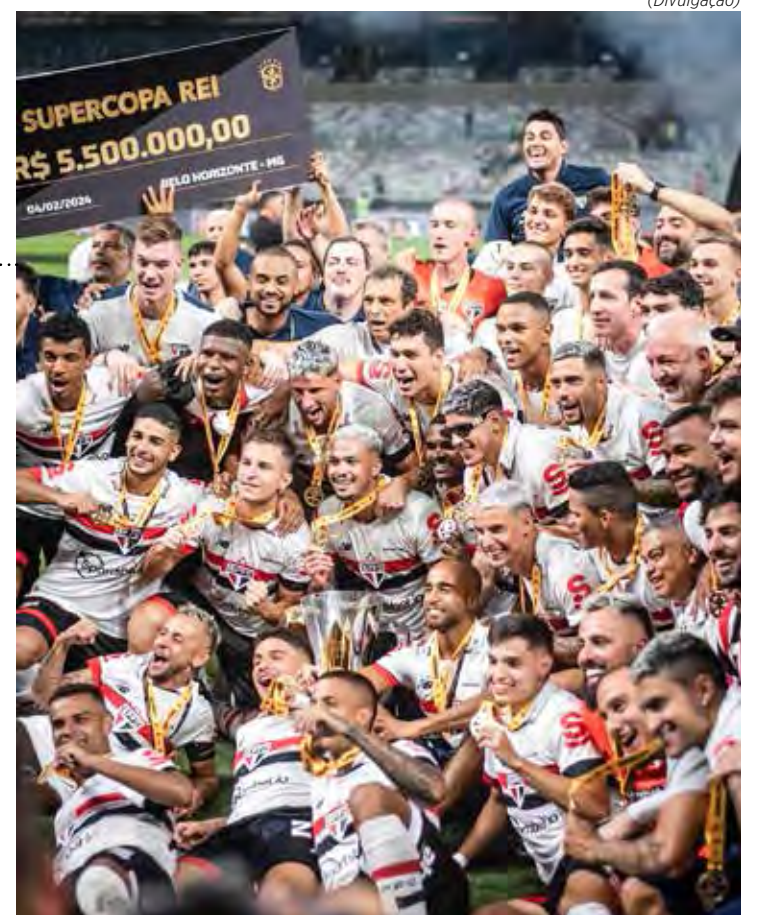
Jogadores do São Paulo comemoram conquista diante do Palmeiras