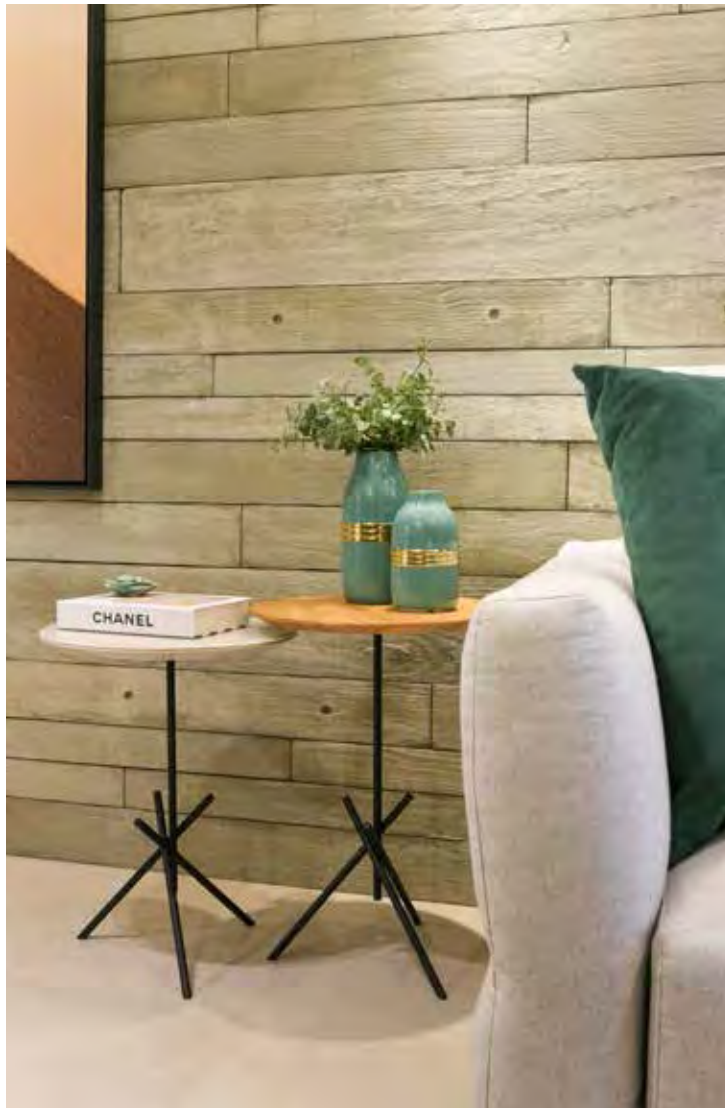
Na sala de estar deste apartamento, a arquiteta explorou a modernidade do revestimento com o acabamento ripado em concreto

Com o grande número de acabamentos e texturas disponíveis no mercado, incluindo desde as superfícies lisas e polidas até as texturas rústicas e rugosas, a profissional relata a liberdade que tem para escolher o visual desejado, sempre de acordo com as especificidades