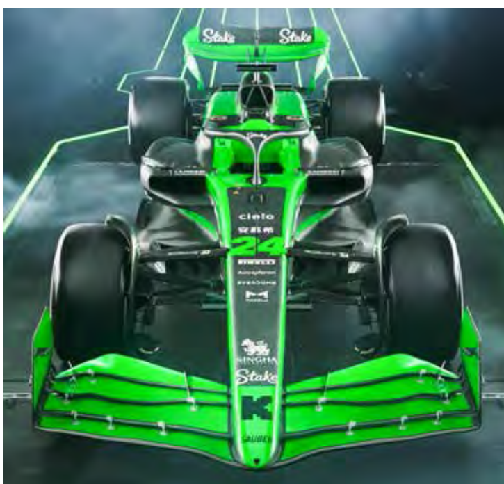
Sauber surpreende e apresenta nova C44 com pintura arrojada em preto e verde