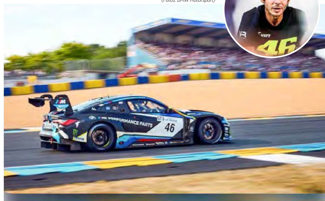
Valentino Rossi correu de GT nos últimos anos