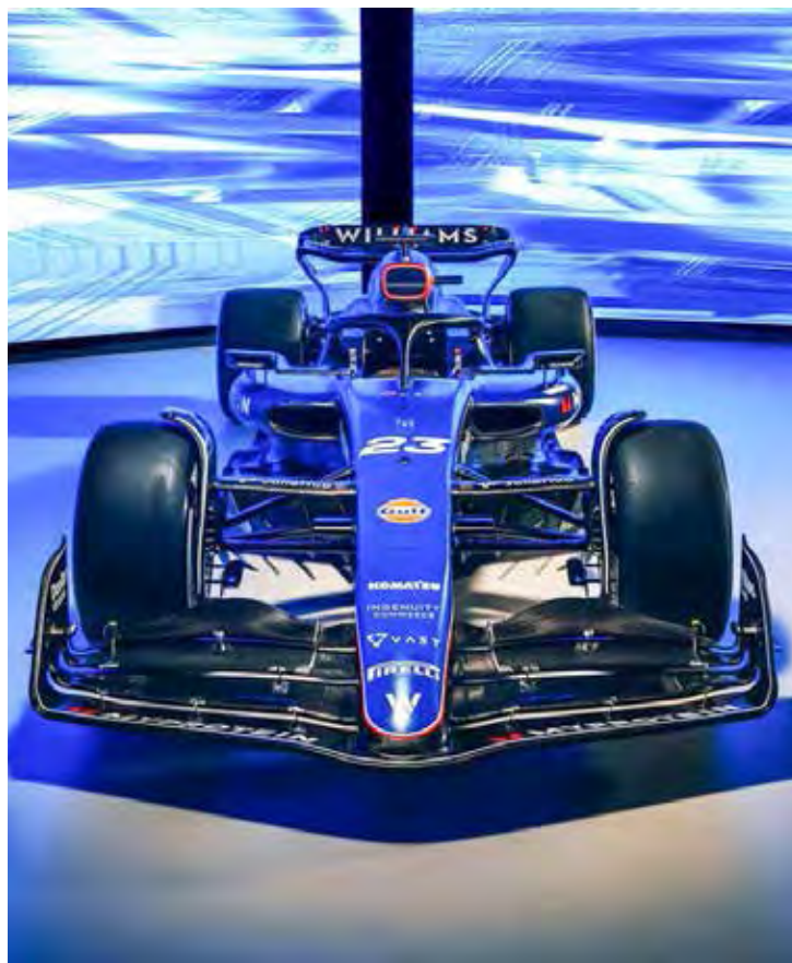
Novo carro mantém predominância do azul; modelo FW46 só será visto nos próximos dias

A apresentação, no entanto, foi feita sobre o carro de 2023. O modelo FW46 deve ser visto somente no shakedown, que deve acontecer no Bahrein em 20 de fevereiro. O local também receberá a pré-temporada a partir do dia 21.