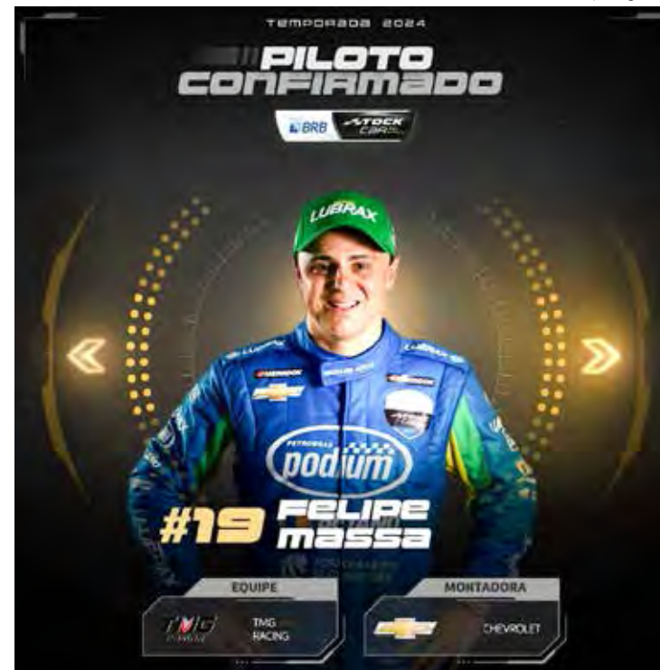
Felipe Massa anunciou sua segunda temporada defendendo a TMG Racing na Stock Car