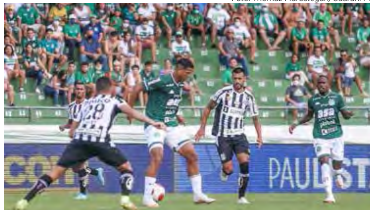
Santos x Guarani jogam no domingo