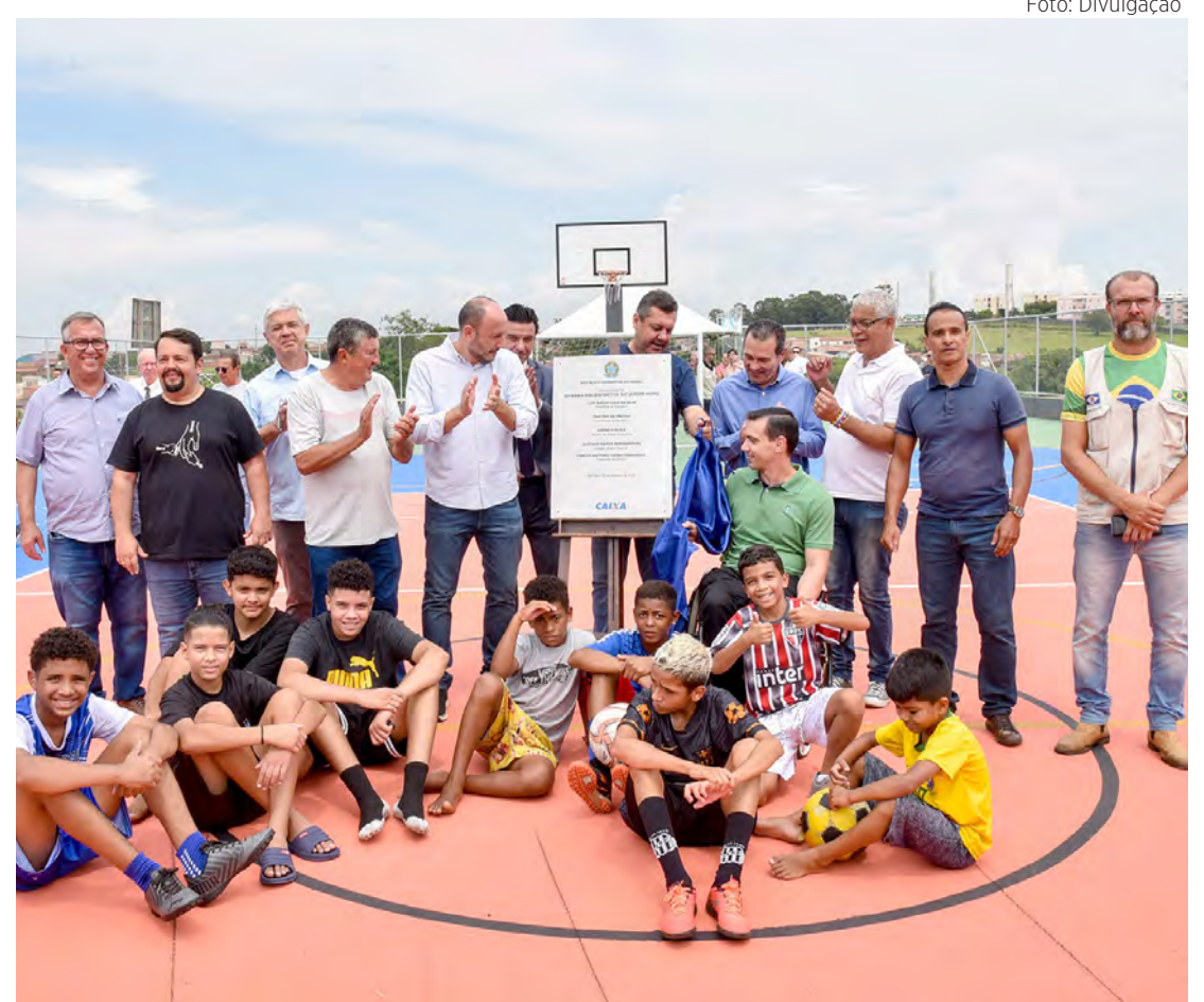
Quadra no Jardim Novo foi entregue nesta sexta-feira (2) à comunidade