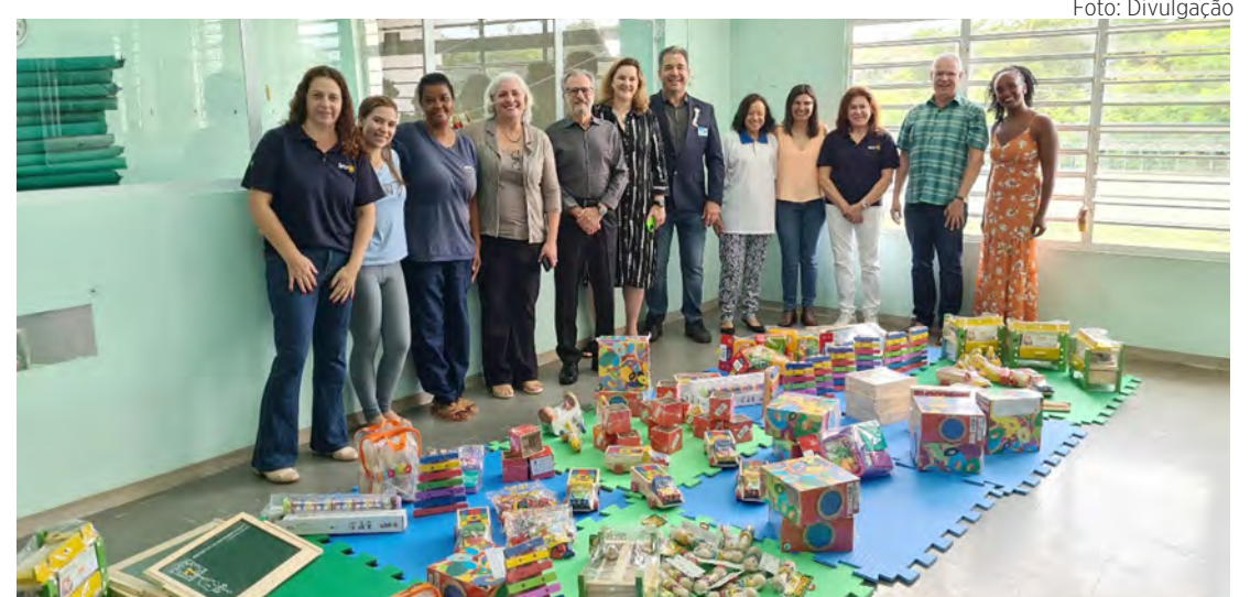
Rotarianos doaram brinquedos educativos à escola Rutinéia no Jardim Novo I