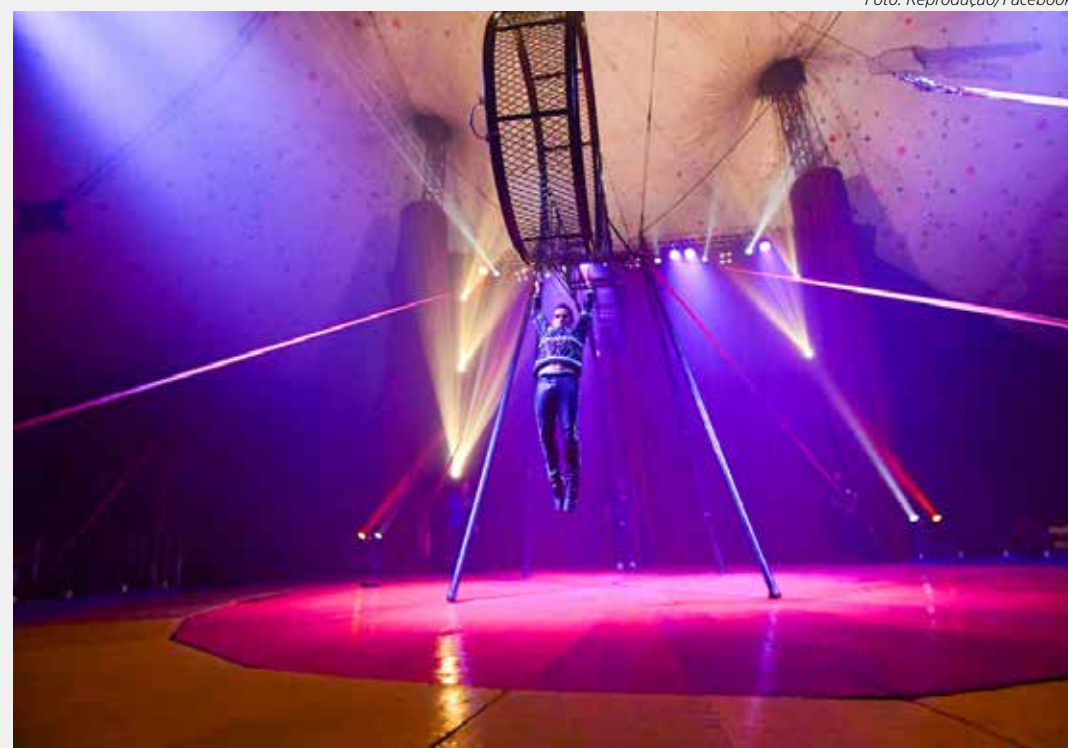
Cada espetáculo do circo gratuito tem 90 minutos de duração