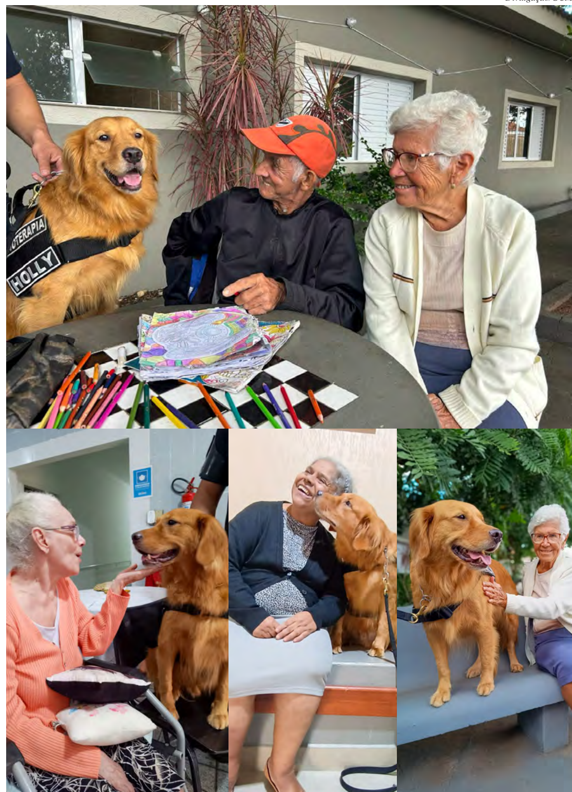
Idosos puderam interagir com o carismático cão Holly

Laço afetivo tem se mostrado uma ótima terapia na cidade