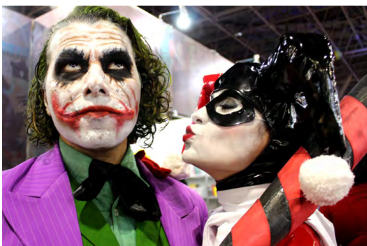
COBERTURA COSPLAY 2

Na minha concepção o termo GEEK é uma variação da própria palavra NERD, e faz referência na sua criação aos indivíduos que são aficionados e em TECNOLOGIA, games, celulares e ciência de uma forma geral. Tal qual a palavra NERD carregou durante décadas um teor pejorativo que denotava pessoas muito inteligentes, mas sem habilidades sociais. A palavra GEEK foi "ressignificada" juntamente com o termo NERD, e se tornou sinônimo de um movimento cultural que cresce de forma exponencial nos dias atuais. (e pelo menos pra mim é motivo de ORGULHO receber essa alcunha!)