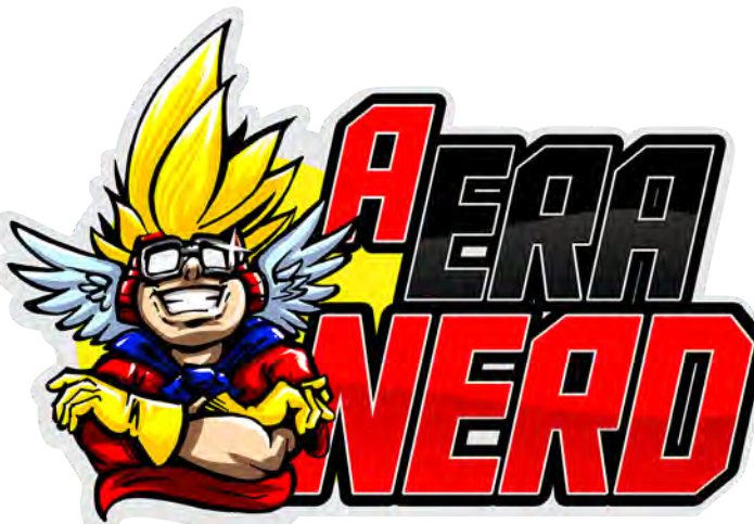
PORTAL A ERA NERD

- Qual foi seu maior desafio em relação ao engajamento do A Era Nerd no mundo geek?