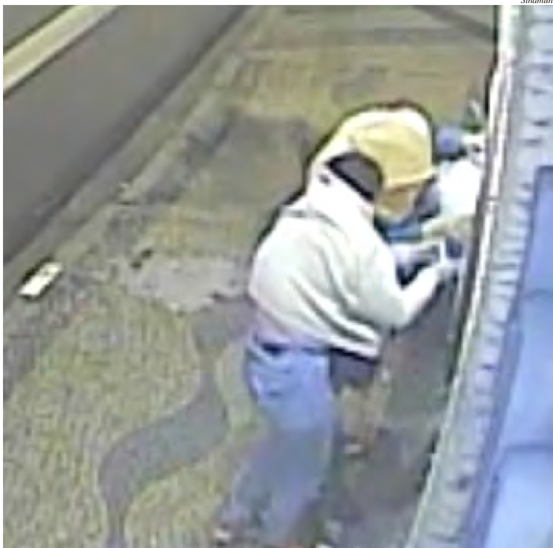
Imagens captadas por câmeras de segurança teriam registrado tentativa de invasão

O presidente da entidade cogita ser ‘possível’ que “o que aconteceu durante a noite tenha ligação com o que ocorreu na assembleia”, diz ele. “Mas este fato será esclarecido pelas autoridades policiais”, acrescenta.