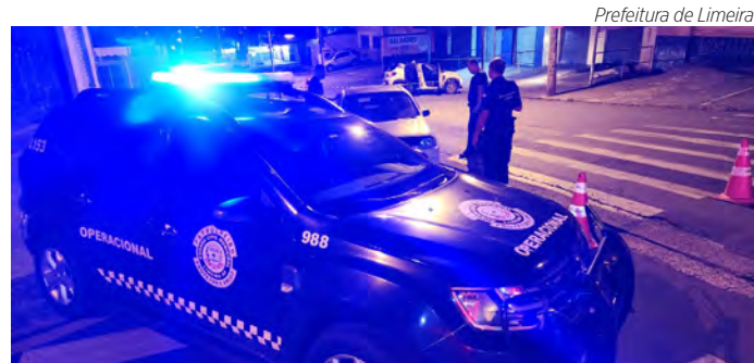
Prefeitura de Limeira

Os guardas reagiram e, durante a perseguição, os suspeitos colidiram com o veículo, tentando fuga a pé do local. Um dos suspeitos foi detido nas proximidades, portando uma réplica de pistola, enquanto o segundo foi capturado posteriormente. A arma de fogo utilizada não foi encontrada. O caso foi encaminhado à Central de Flagrantes.