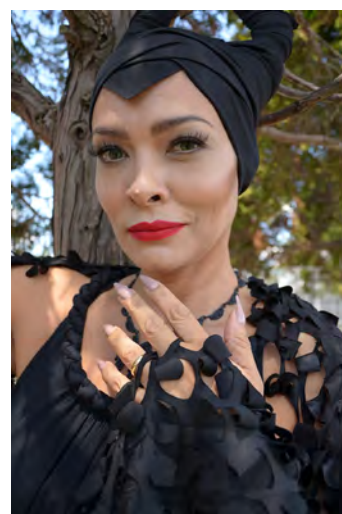
COBERTURA COSPLAY 1

HERCÚLEA, fazer com que seu conteúdo muitas vezes tenha o alcance esperado em tempos de MÍDIAS SOCIAIS. Sempre buscamos o impulsionamento orgânico e a ajuda de seguidores fieis pra ir mais longe sem