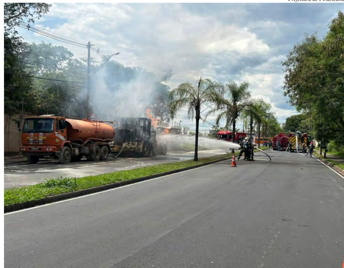
Cena chamava a atenção; bombeiros controlaram as chamas