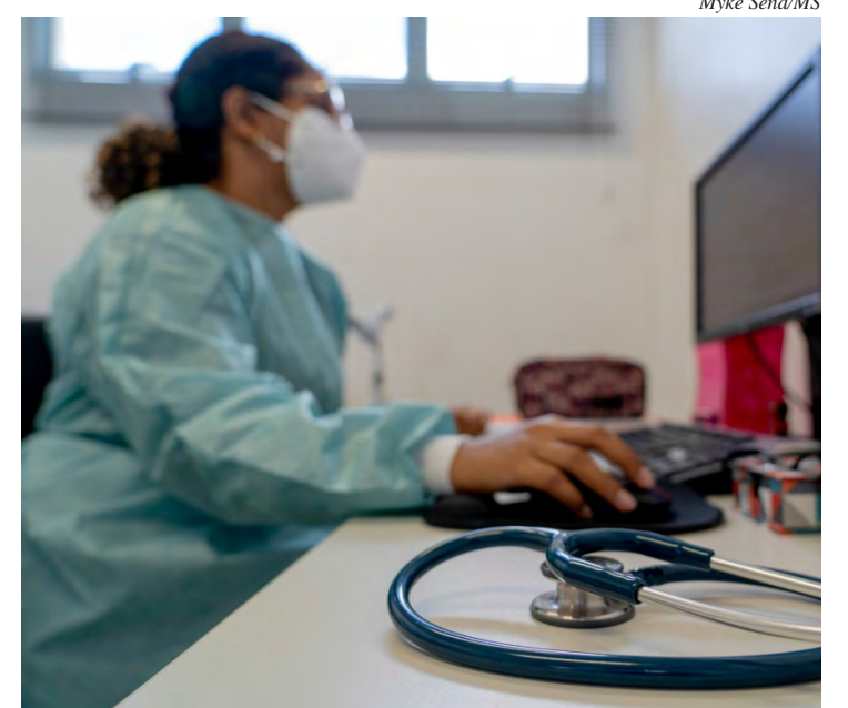
Médica utiliza computador em consultório de unidade de saúde

Juntos, esses programas vão contribuir, a partir de 2024, para a sustentabilidade finan-