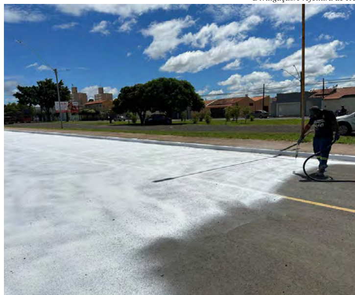
A prefeitura realiza a pintura do trecho onde serão realizados os desfiles

sendo vendidos, além de frias e varanda vip. No setor C haverá área para que o público acompanhe os desfiles gratuitamente.