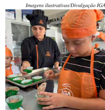
As oficinas visam despertar o interesse das crianças pela preparação de alimentos

As oficinas terão uma hora e serão realizadas às 14h30, 15h30, 16h30, 17h30 e 18h30. Cada dia será abordado um tema. No primeiro dia serão biscoitos amanteigados, e as crianças farão as decorações, no segundo dia elas farão a montagem e a decoração de sanduíches, e no terceiro dia serão decorados cupcakes.