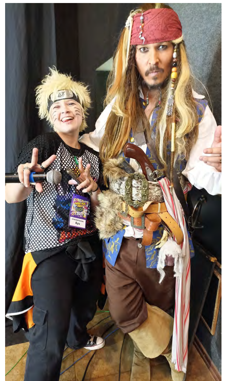
Ayu e @luiz.sparrow

Eu trabalhei para 3 agências de festas, uma de eventos de recepção de casamentos, festas de debutantes/15 anos, outra de hora do horror para escolas e pubs e a última de festas infantis. Hoje não faço mais parte de nenhuma por falta de tempo, pois os eventos acabam coincidindo com as datas dos eventos geeks que é mais prioridade hoje. Tenho saudades das festas, porque acabam sendo