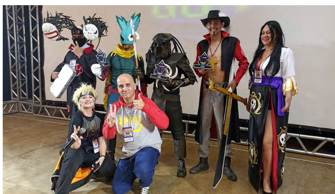
Ayu com ganhadores concurso Cosplay GPF 2023