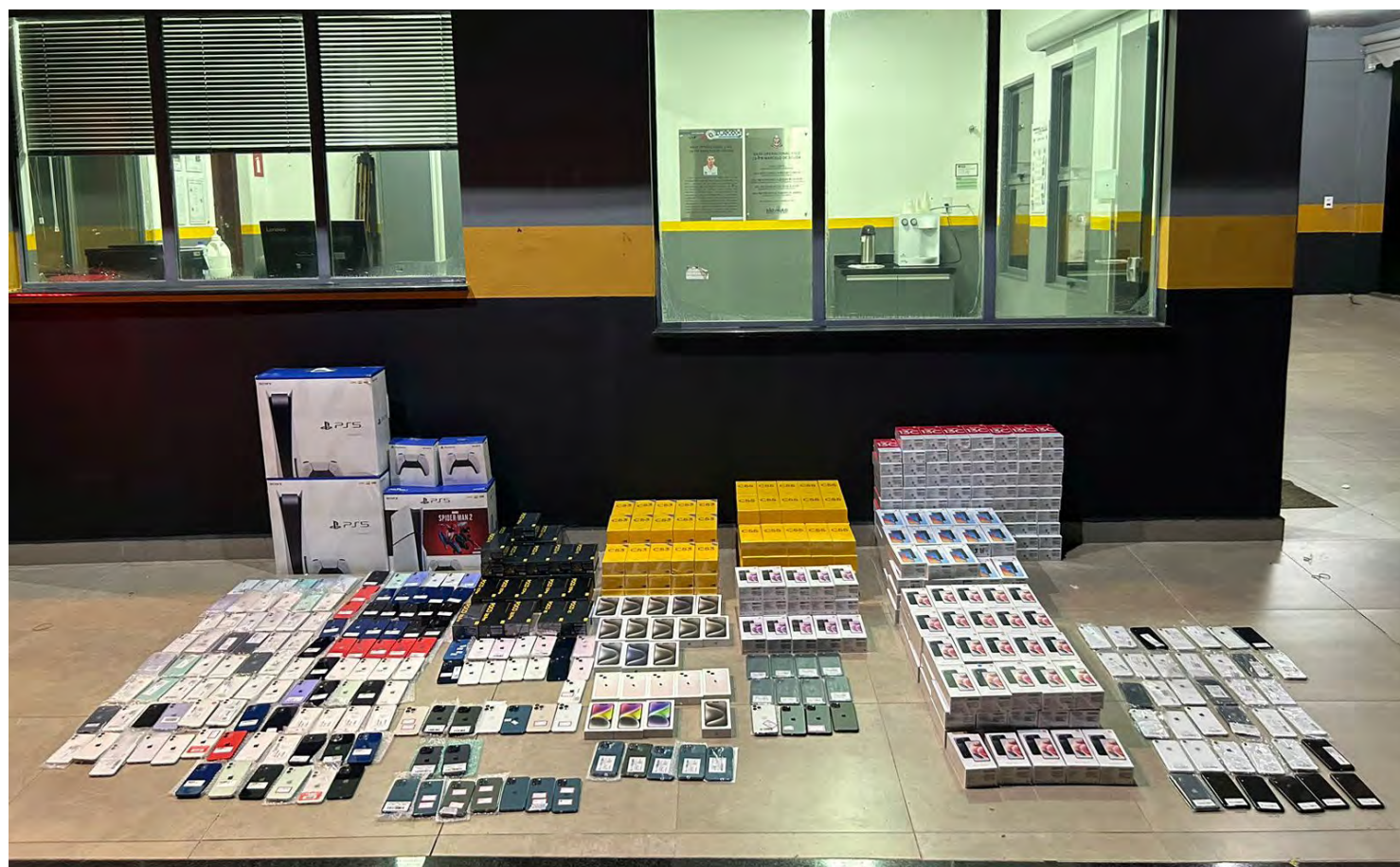
Os celulares apreendidos estavam em compartimento oculto no ônibus

Apreensão aconteceu durante abordagem a um ônibus, no decurso da Operação Impacto, na Rodovia Washington Luís