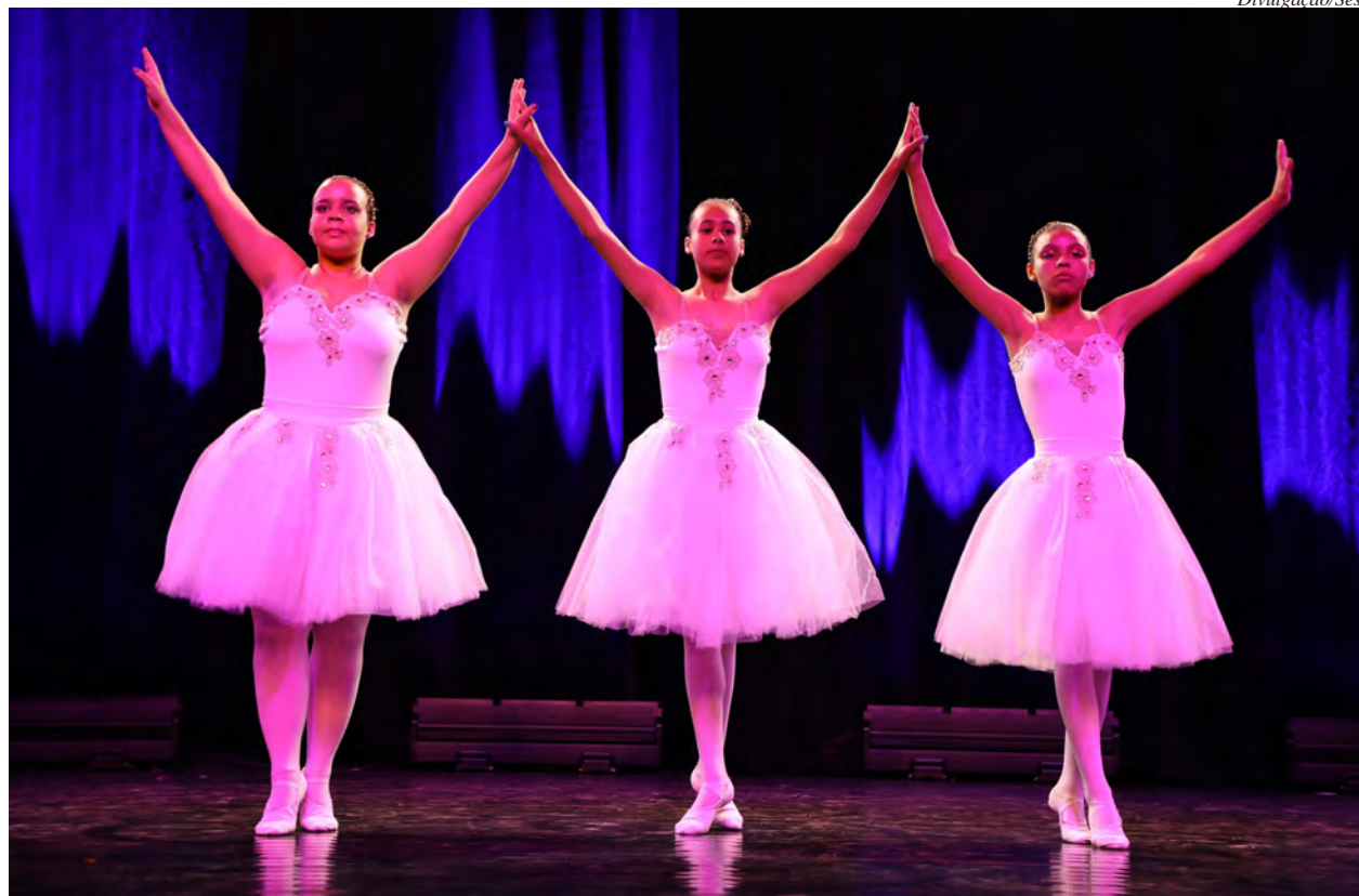
As aulas são desenvolvidas para estimular o aprendizado de habilidades

As aulas terão início dia 19 de fevereiro e são desenvolvidas para estimular o aprendiza-