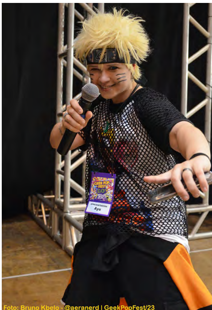
Foto: Bruno Kbeilo - @aeraner | GeekPopFest/23 Ayu - palco GPF 2023

Olá Geekers amados, ou simpatizantes da coluna.