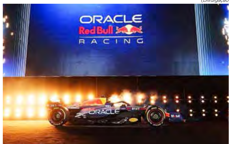
Red Bull escolheu o dia 8 de fevereiro para evento de lançamento