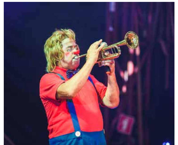
Circo oferece várias atrações gratuitas para toda a família

A duração de cada sessão é de 90 minutos. A entrada é realizada por ordem de chegada, para isso os espectadores devem chegar com no mínimo 40 minutos de antecedência. A capacidade máxima é de 1.500 pessoas por sessão. Ingressos limitados e sujeitos a lotação.