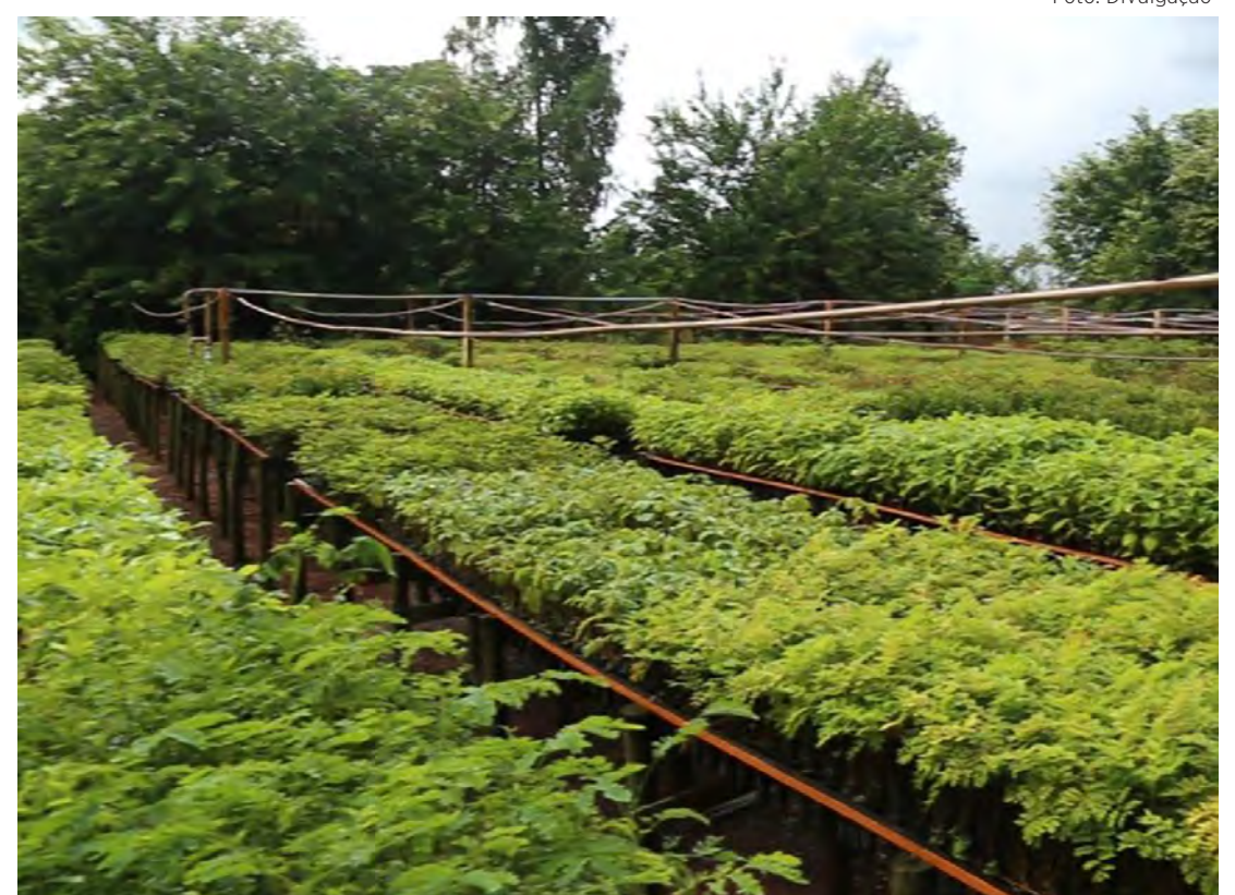
O cartão é um programa social lançado pelo prefeito Gustavo em junho de 2021

Além da nova resolução, a Semil criou um mapa de áreas prioritárias para a restauração da vegetação nativa com quatro classes de prioridade, que vão de baixa a muito alta. Para saber mais sobre o assunto, acesse semil.sp.gov.br .