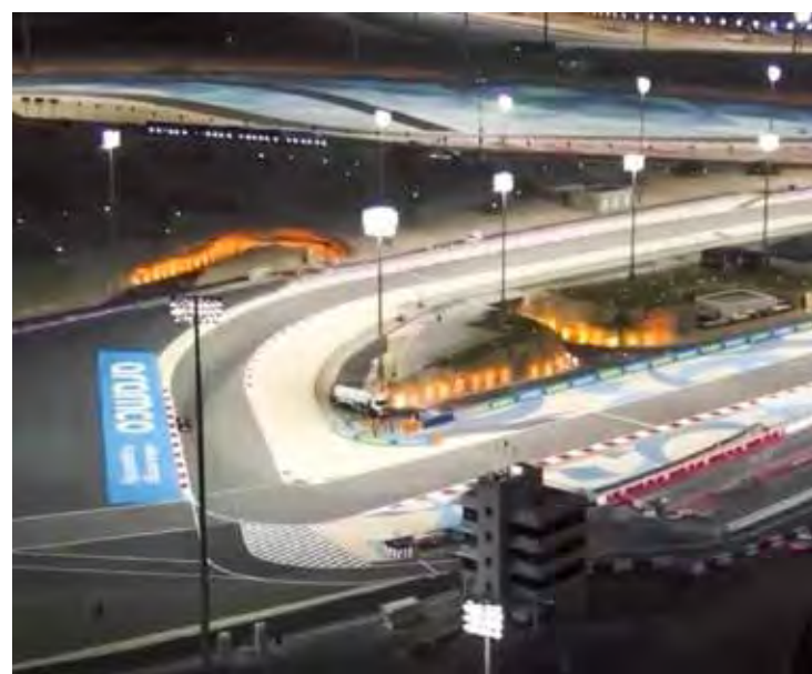
Testes coletivos de Fórmula 2 e Fórmula 3 acontecerão no circuito de Sakhir

O Bahrein é palco da rodada de abertura dos dois campeonatos, que dividem alguns fins de semana com a F1 ao longo do ano.