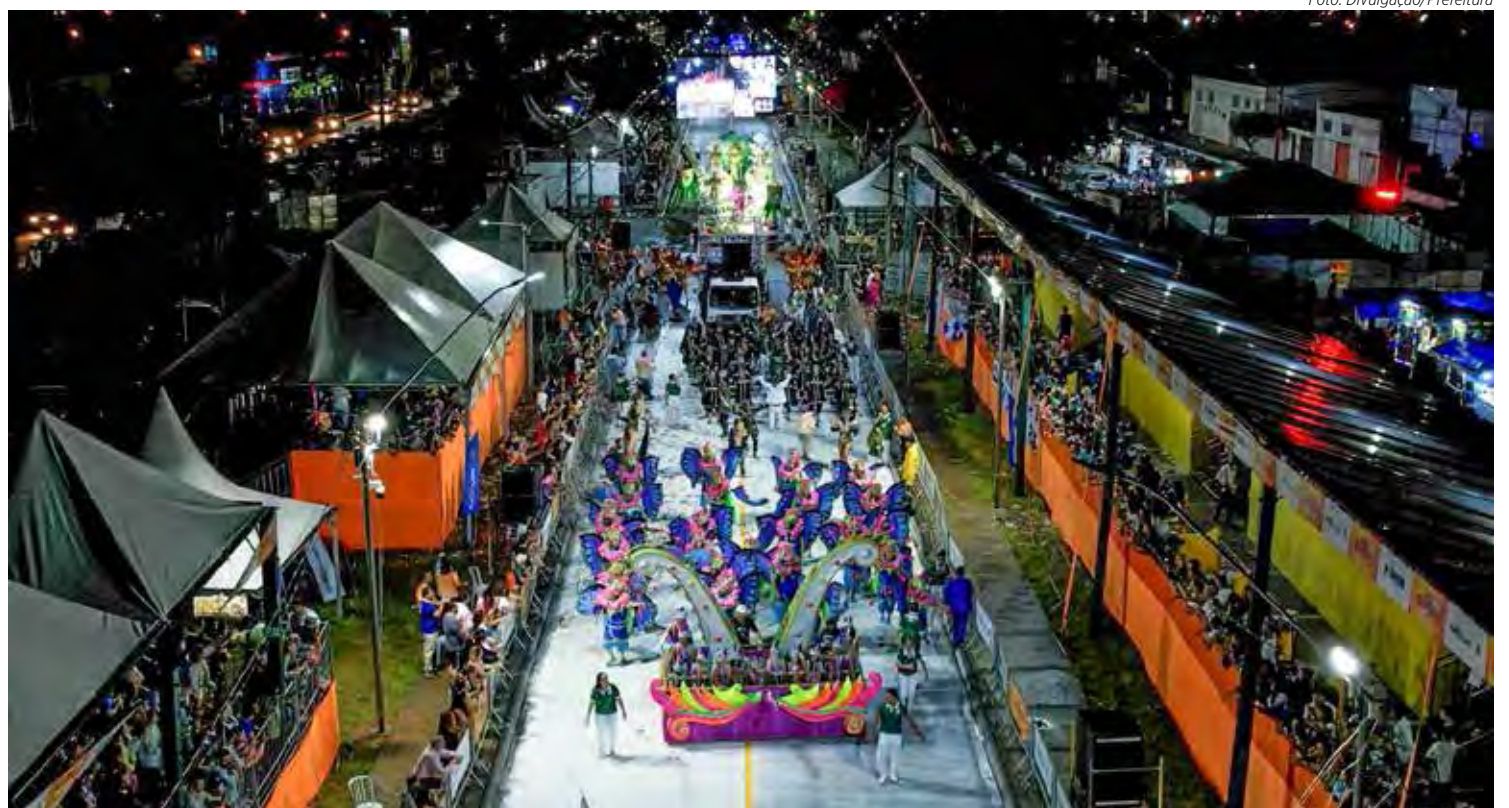
Vista da passarela do samba no desfile de carnaval de 2023

Outra opção para quem quer acompanhar os desfiles são as frisas, que são cobertas e acomodam 10 pessoas. O valor é de R$ 1.500,00 para os três dias. No setor C haverá área para que o público acompanhe os desfiles gratuitamente.