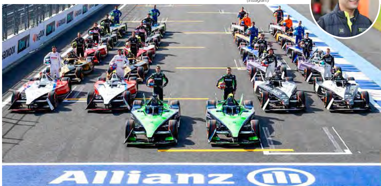
E-Prix do México é a primeira etapa da Fórmula E 2024, com Sette Câmara no grid