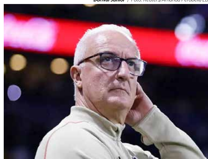
Dorival Júnior

• Por aqui, tristeza para as equipes locais. Tanto o Rio Claro quanto o Velo Clube foram eliminados da Copinha. O Azulão terminou na quarta colocação sem somar pontos na tabela. Já o Velo se despediu com goleada de 4 a 0 sobre o Santa Cruz-SE em jogo ocorrido na terça-feira (9). Com o resultado, o Velo Clube encerrou a participação na Copinha com três pontos em três jogos. Agora, as duas equipes voltam suas atenções para o Paulistão A2, que começa no próximo dia 17. Vale toda a sua torcida para empurrar nossos times na competição. Boa sorte aos atletas.