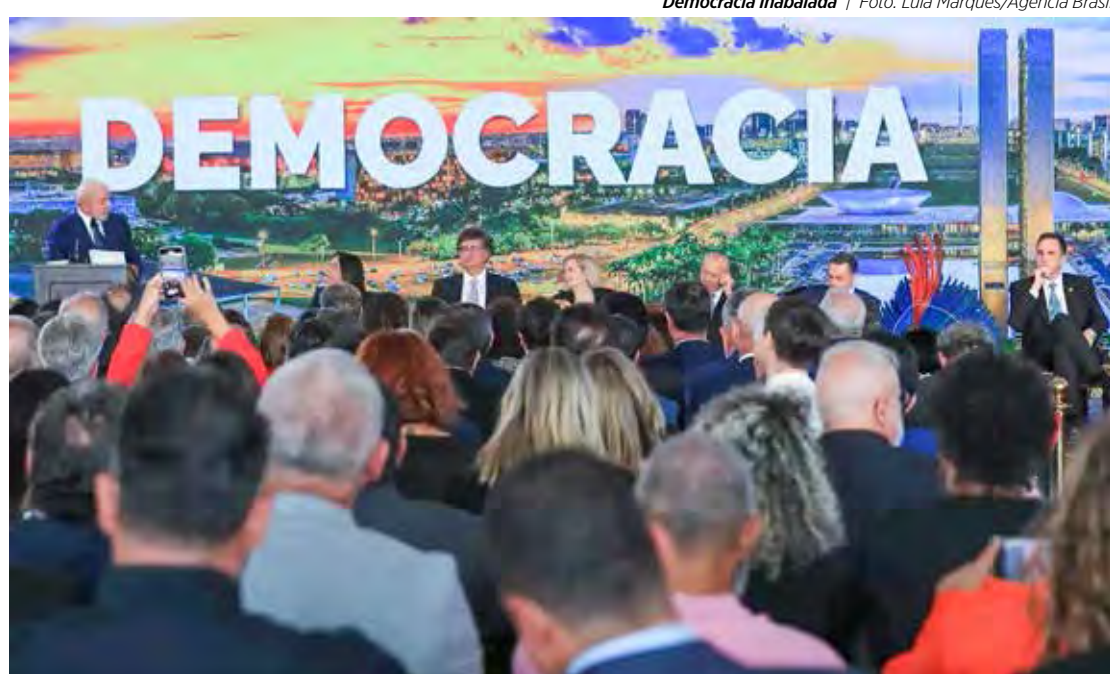
Democracia Inabalada

• Está grande a tensão entre os partidos União Brasil e MDB no cenário político paulista. A desavença começou com a desfiliação do vice-governador do Rio de Janeiro, Thiago Pampolha, que se filiou ao MDB. A decisão de Pampolha gerou atritos e acusações de traição por parte do União Brasil. A mudança desagradou a cúpula do União Brasil que pretende retaliar lançando a candidatura do deputado federal Kim Kataguiri à prefeitura de São Paulo. A estratégia bate de frente com os planos de reeleição do emedebista Ricardo Nunes. Mas tudo ainda pode mudar, já que a filiação de Pampolha ao MDB ainda não foi oficializada, o que deve ocorrer no final do mês. Portanto, o União Brasil ainda tem tempo de correr atrás do prejuízo e, quem sabe, aparar arestas e reverter a decisão de Pampolha. Em pleno ano elei-