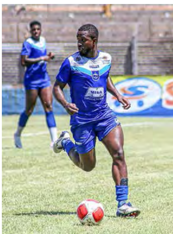
Azulão fez último jogo-treino antes da estreia

Na tarde desta quarta-feira (10), o Rio Claro FC fez no estádio Schmidtão, contra o União João EC de Araras, seu último jogo-treino antes da estreia do time no Campeonato Paulista da Série A2. No dia 17, o Rio Claro FC inicia sua caminhada rumo ao acesso, jogando em casa, diante do Oeste FC de Barueri, às 15 horas.