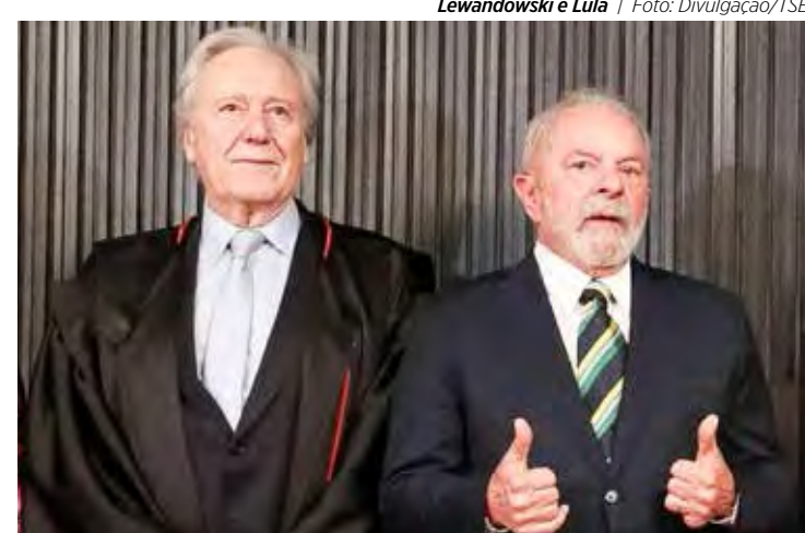
Lewandowski e Lula

• E os casos de desinteligência continua a se espalhar pelo mundo. Primeiro foi a Rússia em guerra contra a Ucrânia, depois Israel e Hamas, também há ameaça de conflito entre Guiana e Venezuela, e agora o Equador entra nessa lista. O país enfrenta uma escalada de violência que já deixou pelo menos 10 mortos. O conflito é interno entre forças do governo e facções criminosas. O presidente do Equador, Daniel Noboa, disse que seu país vive um "estado de guerra" contra grupos terroristas. O clima de medo toma conta da população. Em pleno século XXI, é triste ver a abolição do diálogo em diferentes países e continentes. Até quando?