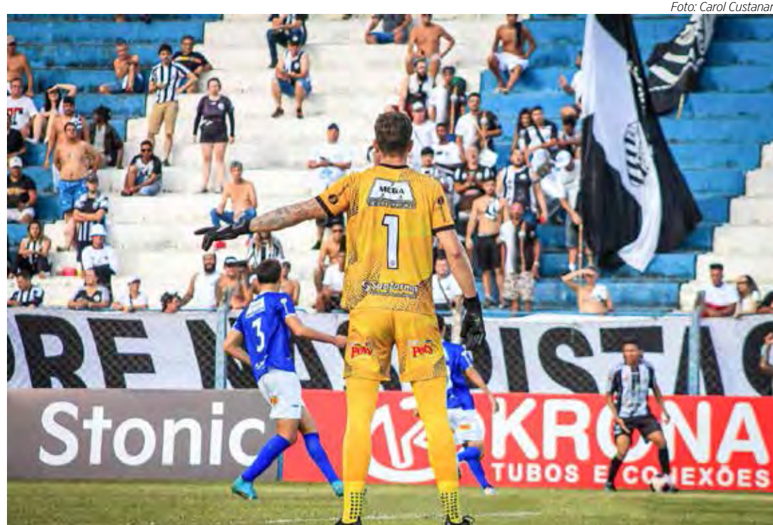
Rio Claro FC recebe União São João, no Schmidtão, às 15 horas

Aquele craques de bola, que amavam o futebol, eles faziam a diferença, encantavam, não apenas porque tinham nos pés a arte de jogar futebol e de viver futebol em nível de excelência. Era um sentimento que as vinculava ao maior e mais importante dos esportes, e que tem faltado às gerações mais recentes, falta à atual e tudo indica, faltará às futuras gerações. E não é só no futebol. Infelizmente.