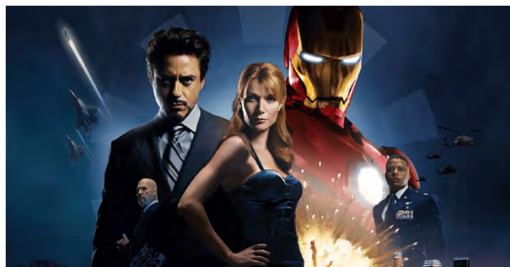
HOMEM DE FERRO - ROBERT DOWNEY JR