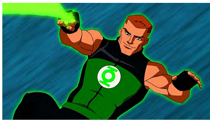
LANTERNA VERDE - GUY GARDNER