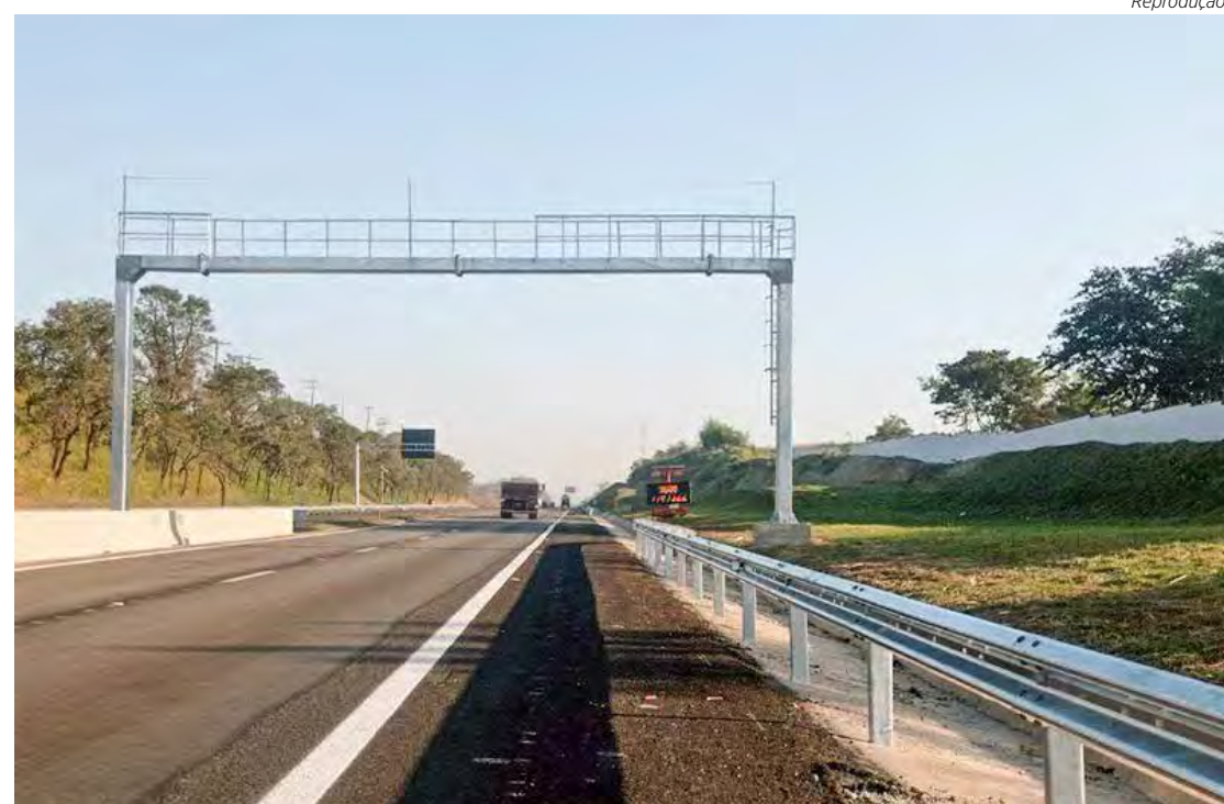
Rodovia do Açúcar em Piracicaba

As informações até o fechamento desta matéria eram reduzidas e somente perícia poderá apontar mais detalhes da dinâmica do acidente, mas, até então, o que se sabe é que o motociclista teria tombado na pista, por razões ainda a serem apuradas.