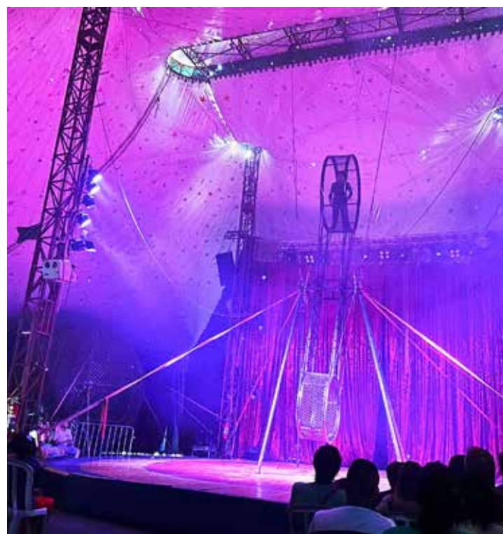
O circo tem atrações para toda a família e as sessões são gratuitas

O edital completo com informações está disponível em https://www.idbr.org.br/category/editais-em-aberto/