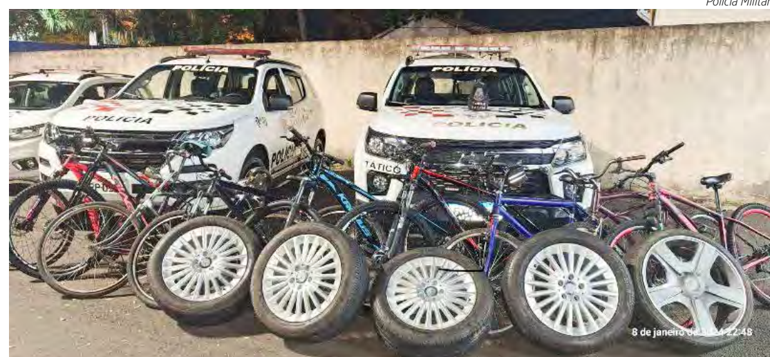
Bicicletas eram de várias marcas diferentes e havia algumas sem marca e modelo aparentes

Em seguida foi realizado patrulhamento próximo de um local conhecido como ponto de vendas de drogas e foi feita abordagem de um rapaz com as características do autor do furto, bem como a bicicleta que estava