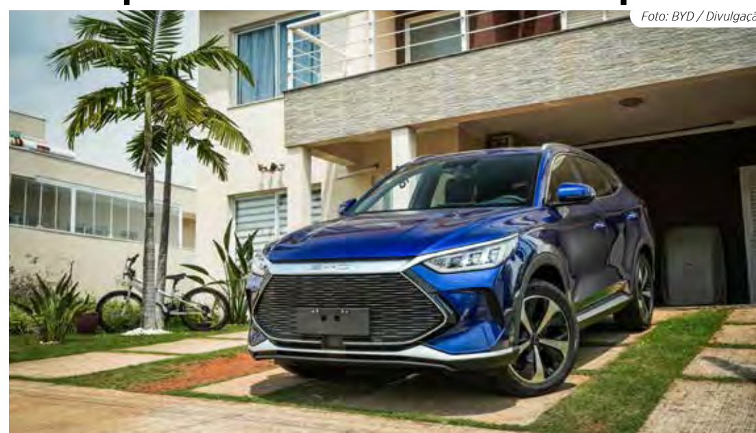
Song Plus - importado mais vendido

As dez marcas importadas que fazem parte da Abeifa registraram juntas aumento de 127,7% nas vendas (41.501 unidades em 2023 contra 18.224 em 2022).