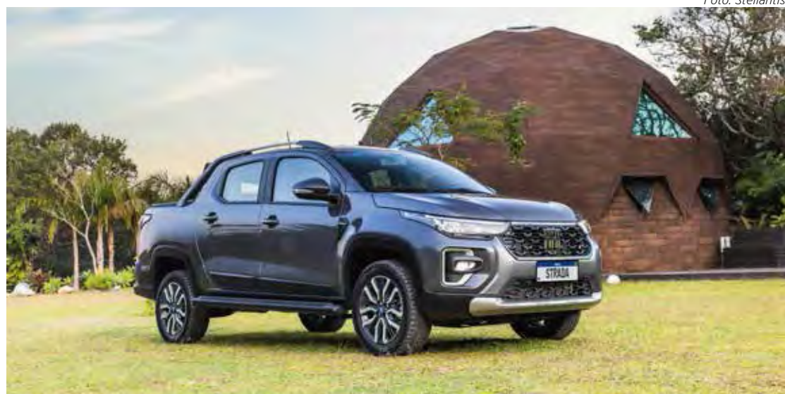
Fiat Strada 2024