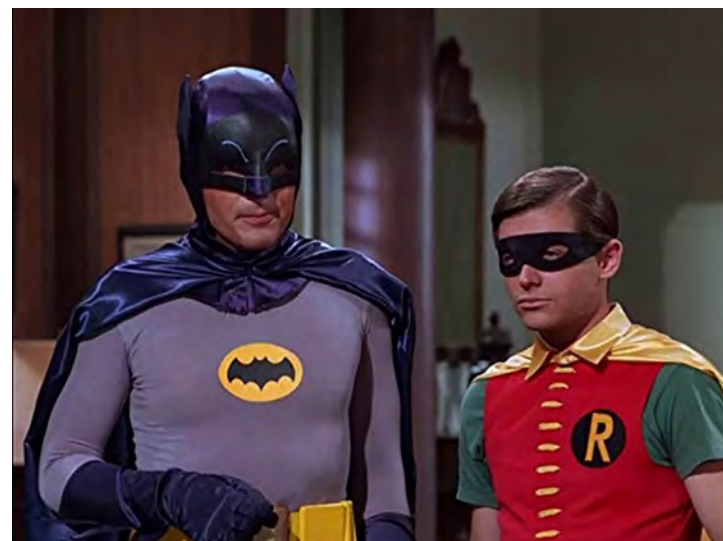
BATMAN E ROBIN - ADAM WEST

desconsiderando os perigos da falta de controle e reflexão.