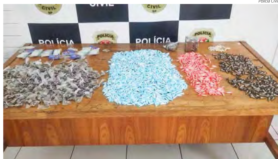
Apreensão ocorreu no decurso da Operação Reditus

Segundo o registro policial, as drogas foram apreendidas no Cervezão prontas para distribuição nas chamadas ‘biqueiras’ de tráfico da cidade.