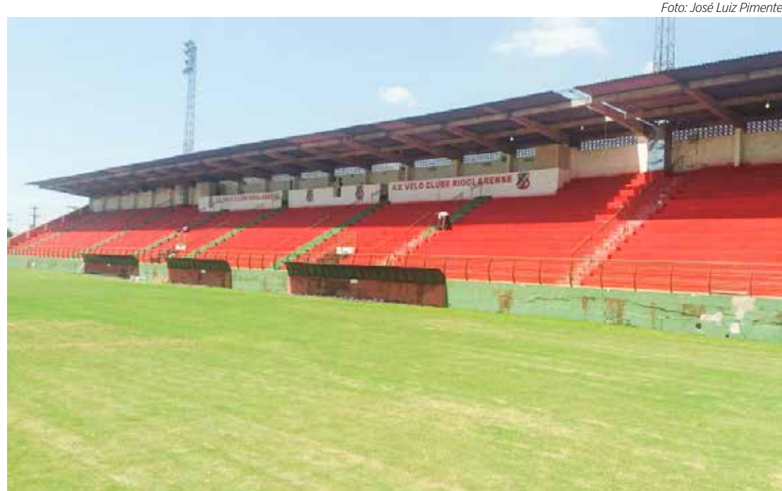
Arquibancadas do Benitão receberam nova pintura

No caso da cidade de Rio Claro, Velo Clube e Rio Claro FC não tem com o que se preocupar, tanto o estádio Benito Agnello Castellano como o Augusto Schmidt estão liberados para receberem os jogos do Campeonato Paulista da Série A2.