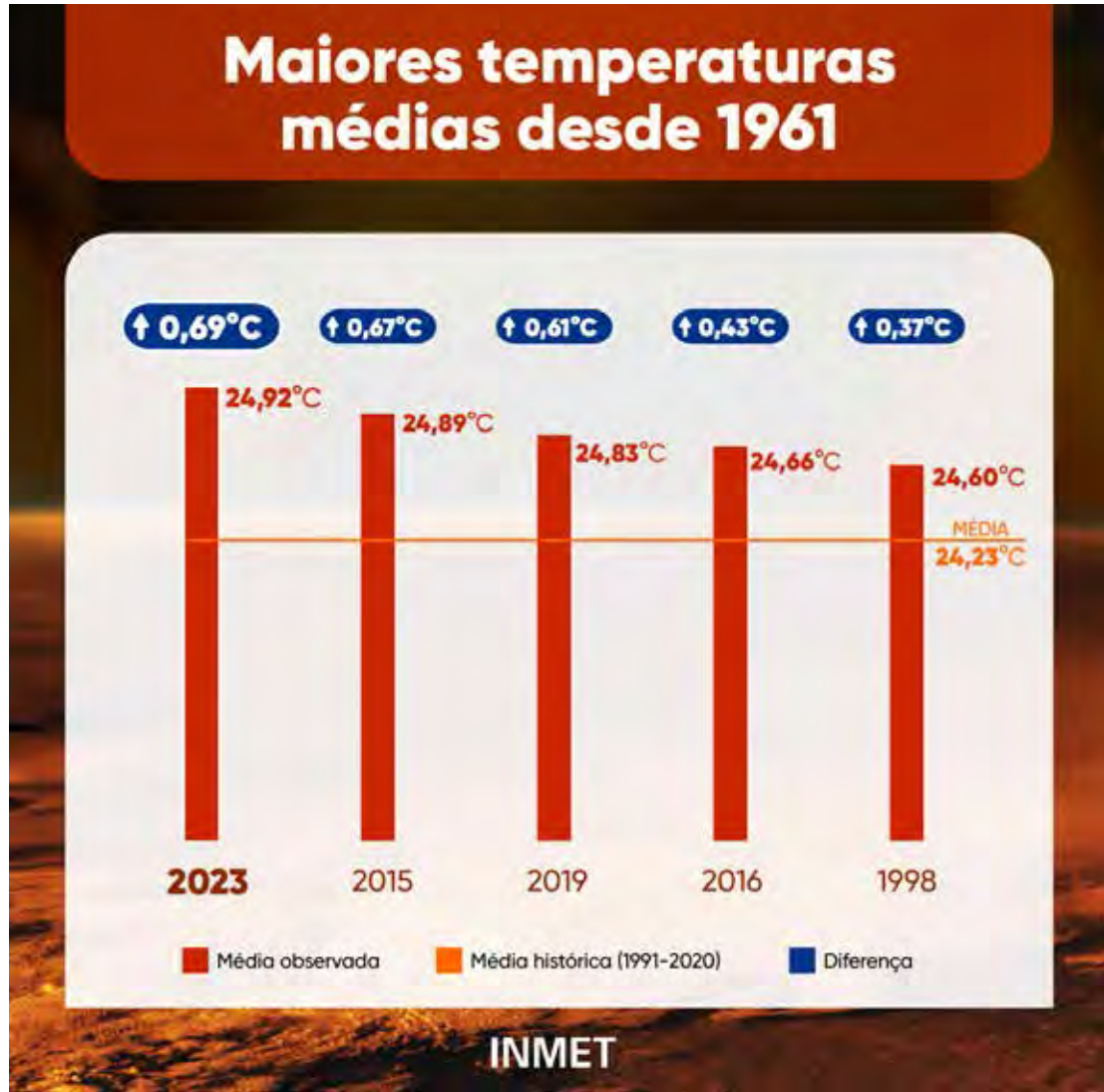
Gráfico 1: Ranking dos cinco anos mais quentes da história do Brasil entre 1961 e 2023