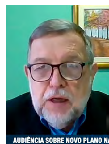
AUDIÊNCIA SOBRE NOVO PLANO NA

elaboração de um plano consistente capaz de enfrentar os desafios presentes e futuros. A valorização dos professores e os investimentos substanciais em educação pública são os pilares sólidos para construir um Brasil mais justo e igualitário. Esta é uma missão coletiva que exige o comprometimento de todos os setores da sociedade, visando proporcionar oportunidades iguais a cada cidadão, independentemente de sua origem ou condição socioeconômica. O futuro do Brasil está intrinsecamente ligado à qualidade de sua educação. Valorizar os professores e investir na formação das futuras gerações são os passos iniciais e