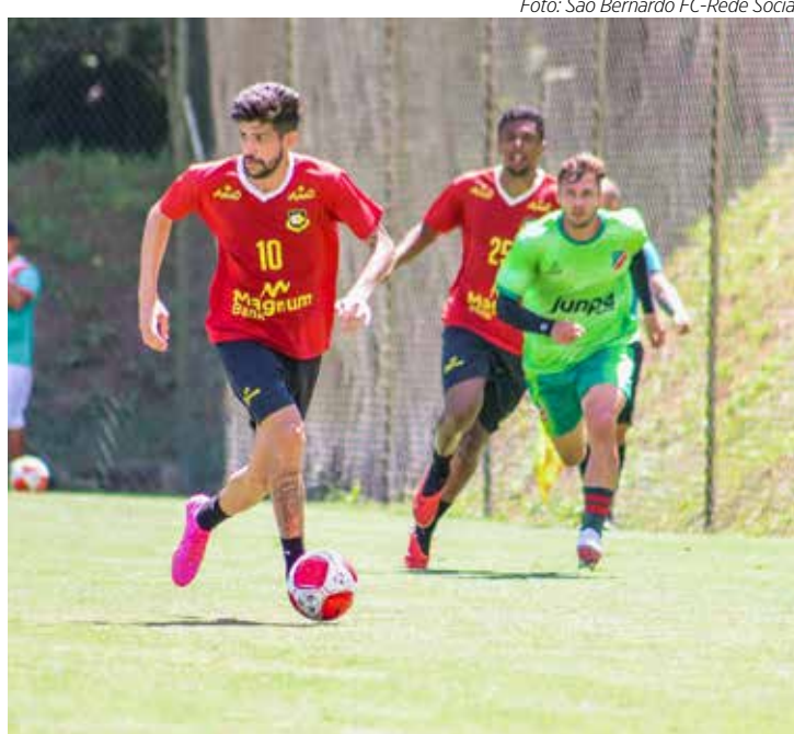
Jogo-treino aconteceu em Atibaia

A equipe do Velo Clube estreia no Paulistão Série A2, no próximo dia 17, quando enfrentará o Clube Atlético Linense, no estádio Gilberto Siqueira Lopes, na cidade de Lins. O detalhe é que o estádio Gilberto segue interditado pela FPF, o que pode ocasionar mudança no local da partida.