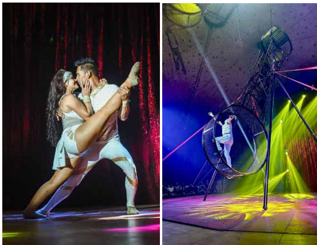
O Happy Day Circus oferece apresentações para público de todas as idades

A duração de cada sessão é de 90 minutos. A atração permanece na cidade até final de fevereiro e os espetáculos acontecem às segundas, quartas, quintas e sextas, às 20 horas, e aos sábados, domingos e feriados, às 16h, 18h e 20h. A entrada é realizada por ordem de chegada, para isso os espectadores devem chegar com no mínimo 40 minutos de antecedência. A capacidade máxima é de 1.500 pessoas por sessão, e os ingressos são limitados e sujeitos a lotação.