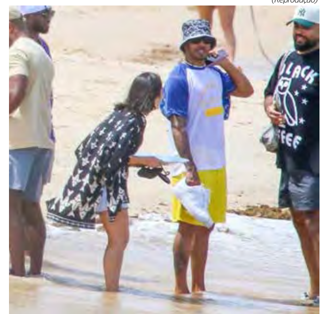
Hamilton veio ao Brasil de surpresa e se divertiu em Trancoso

A temporada 2024 da F1 será aberta daqui a dois meses, no dia 2 de março, com a disputa do Grande Prêmio do Bahrein. Antes disso, haverá a realização dos testes de pré-temporada.