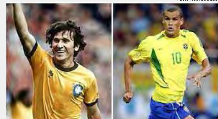
Zico e Rivaldo, dois craques da camisa 10