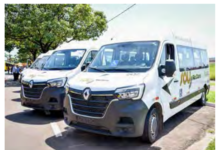
Vans do programa Incluir que atende pessoas com deficiência