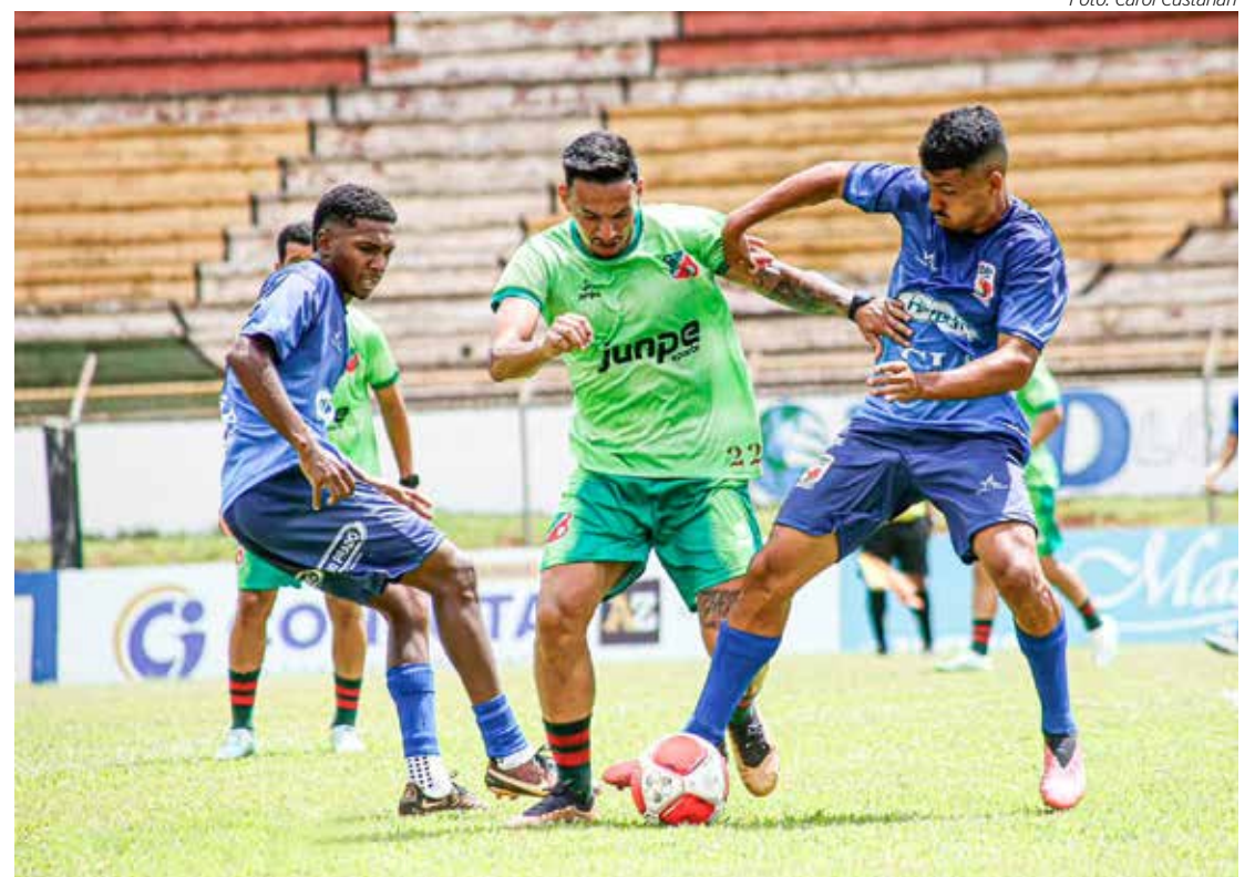
Velo vai a campo hoje para mais um jogo-treino

O Velo Clube estreia na Paulista Série A2, dia 17 de janeiro, contra o CALinense, fora de casa, em horário a ser definido ainda pela Federação Paulista de Futebol. A estreia do Velo diante do seu torcedor será contra o CA Monte Azul, dia 20 (sábado), às 19h15, no estádio Benitão.