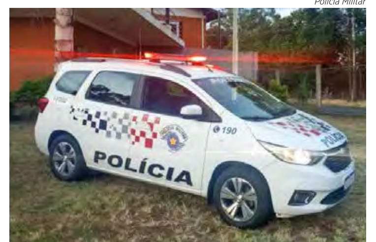
Ação foi coordenada pela Polícia Militar de Rio Claro

Os infratores da lei foram conduzidos ao Plantão Policial e ambos permaneceram à disposição da Justiça.