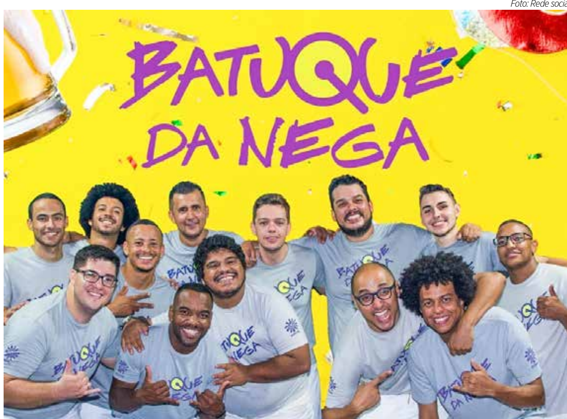
Batauque da Nega no Cia. Paulista Pub

pessoas por sessão. Ingressos limitados e sujeitos a lotação. Endereço: Av. Visconde de Rio Claro, nº 1.059 – entre as Av. 10 e 12 – Centro