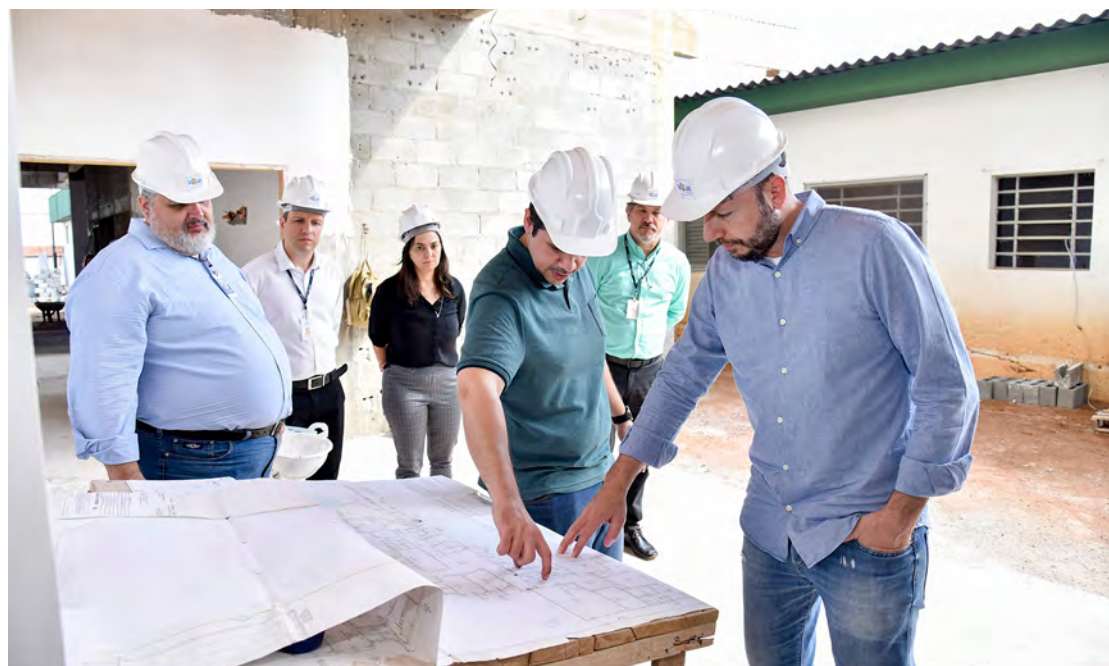
Prefeito Gustavo confere do Hospital Público Municipal no Cervezão

Os investimentos no setor de saúde incluem também reformas e melhorias nas unidades de saúde da família. No Jardim Brasília as obras na unidade de saúde estão quase finalizadas.