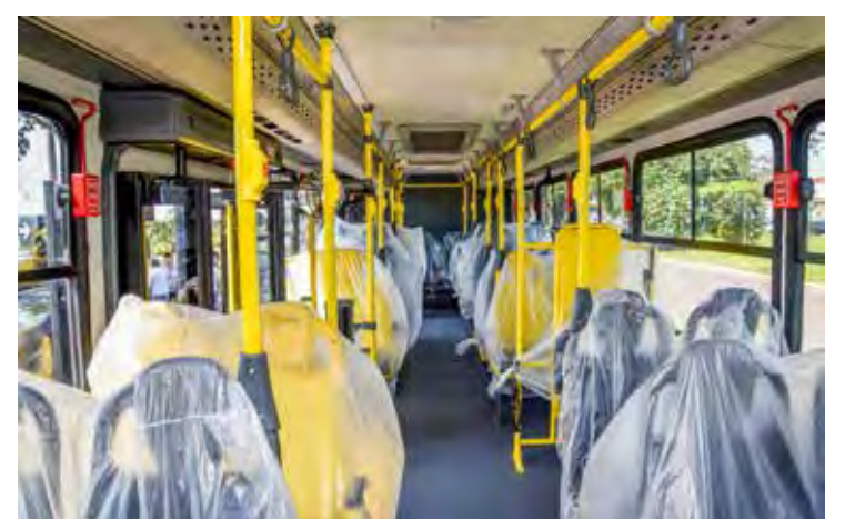
Interior dos veículos da nova frota do transporte coletivo