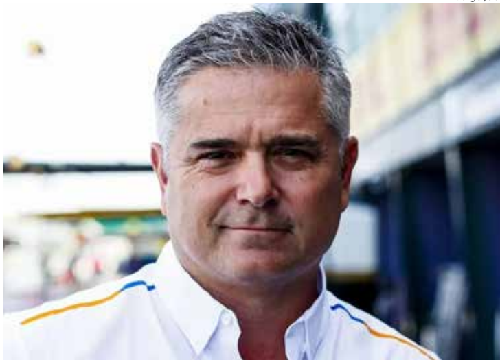
Piloto Gil de Ferran faleceu ontem aos 56 anos de idade