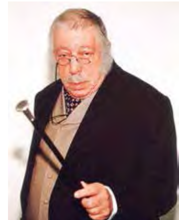
José Lewgoy como Coronel Felipe Cantuária em “Força de um Desejo”

agora, já no início de 2024, trazendo Cristiana Oliveira de volta aos palcos, ao lado de Suzy Rêgo e Eduardo Martini.