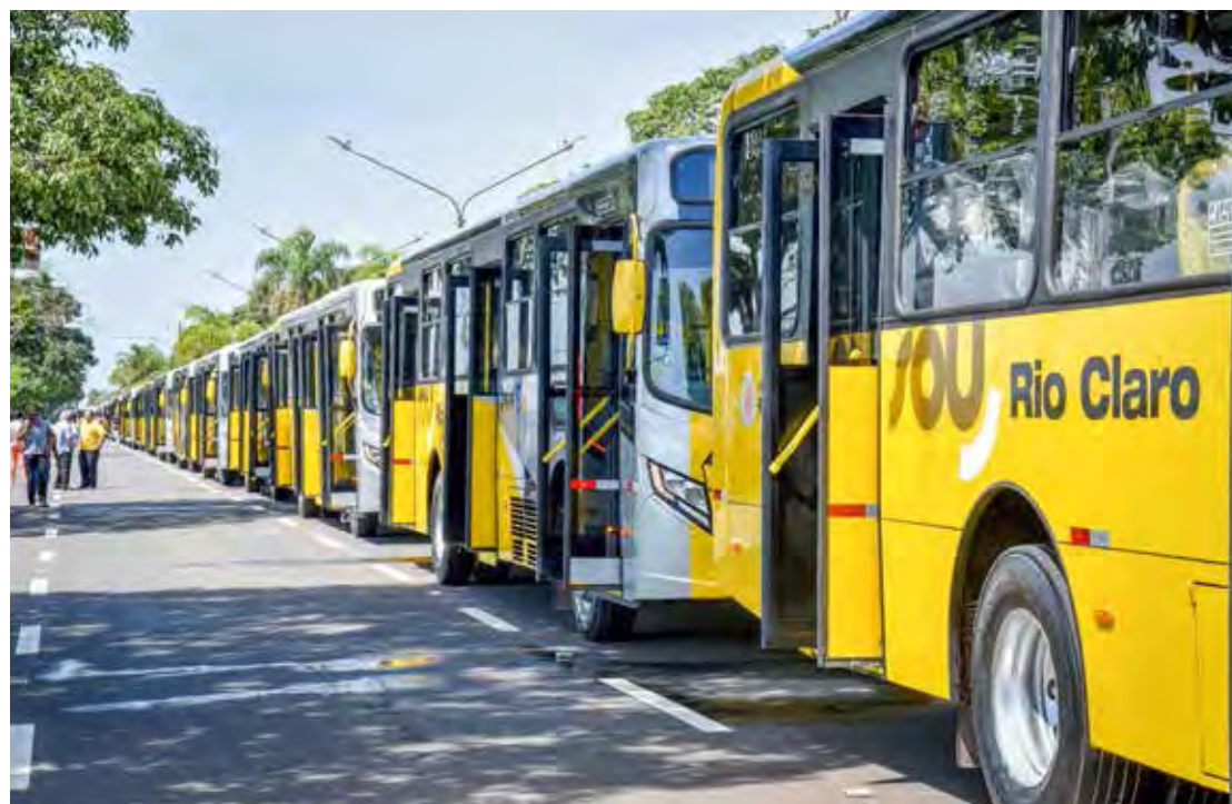
Novos ônibus têm ar-condicionado, acessibilidade e Wi-Fi