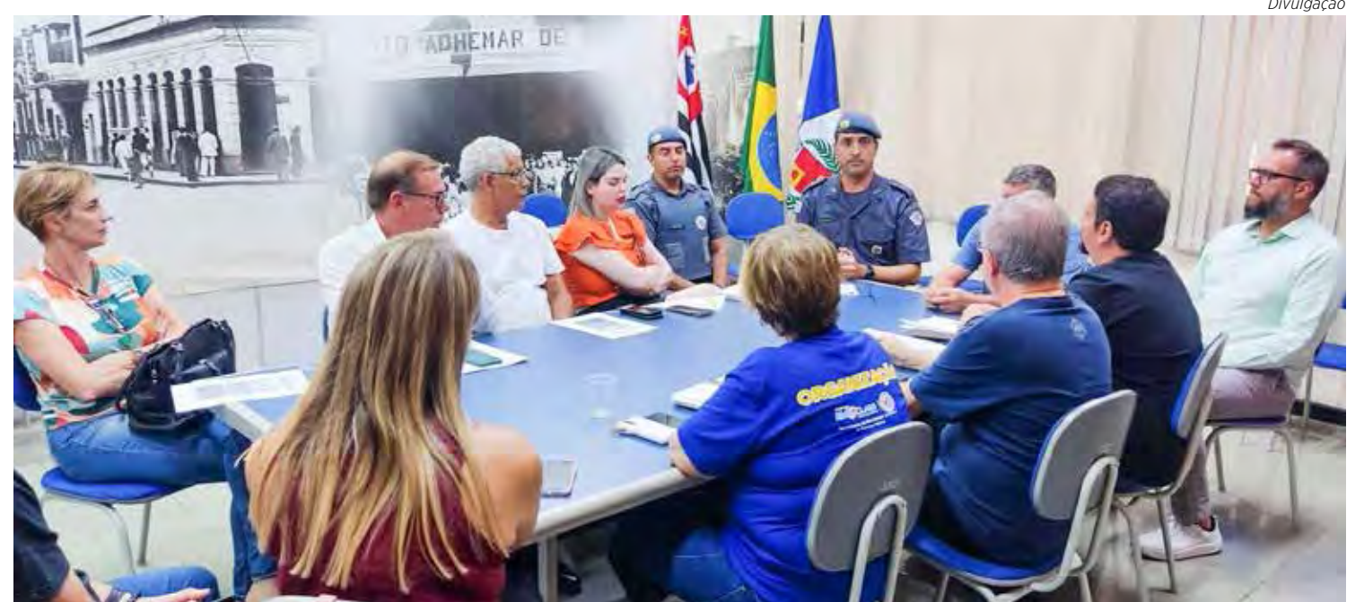
Objetivo é evitar barulho que possa causar incômodo na população da cidade