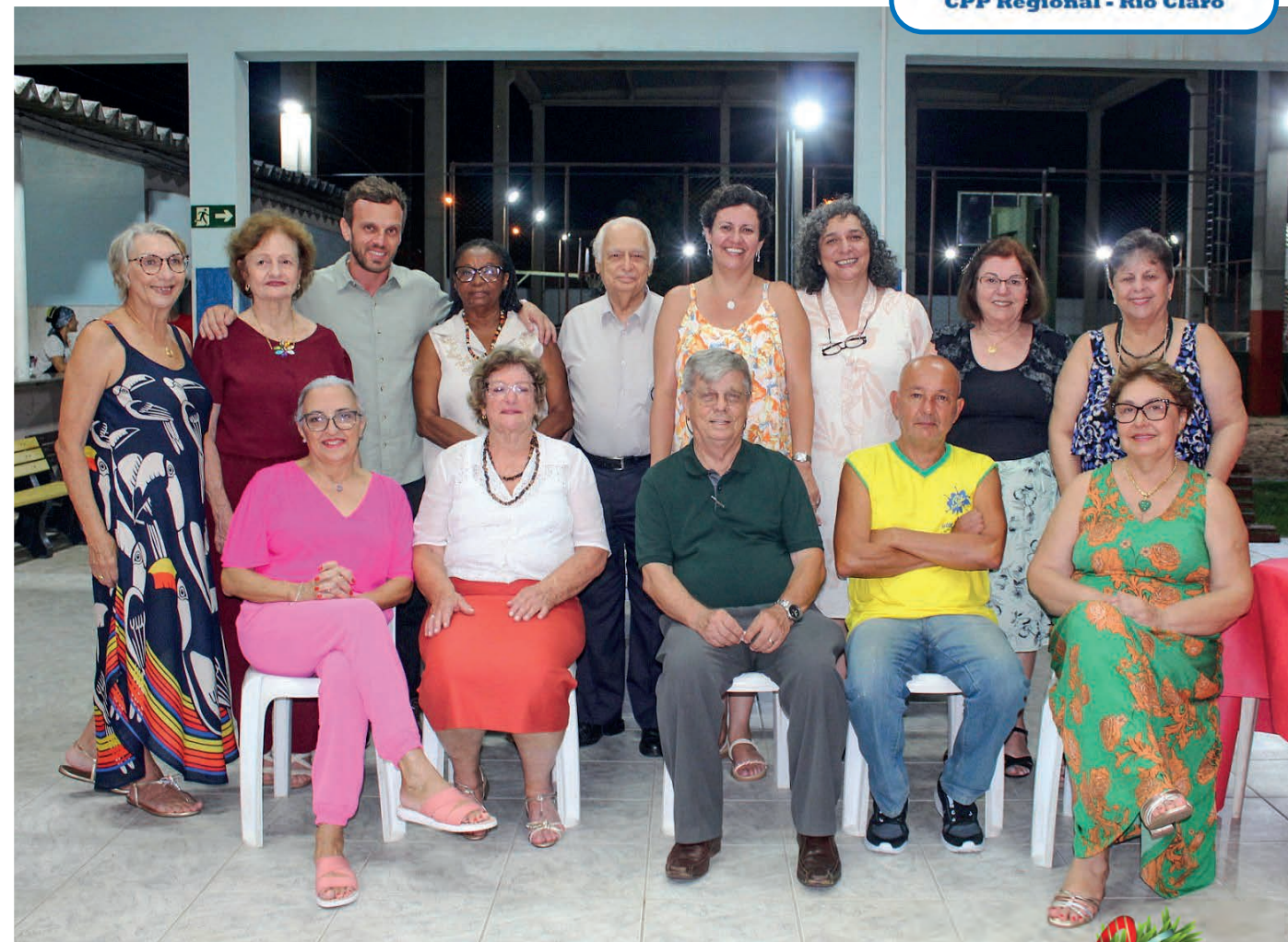
Diretoria do CPP Regional Rio Claro