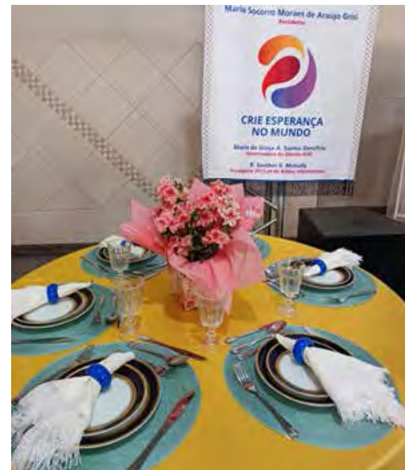
Uma decoração completa para mesa de sala de jantar também foi alvo das competidoras no bingo