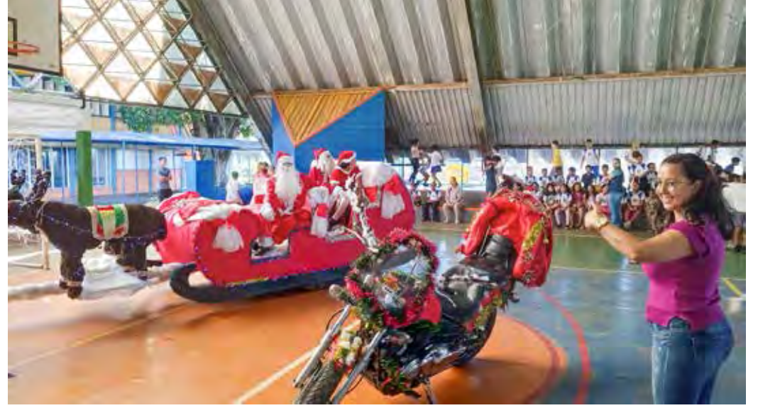
Festividade no Caic Jardim Brasília alegrou a criançada