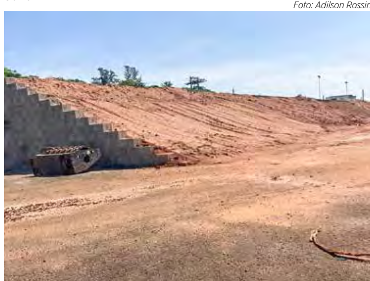
Arquibancada no Schmidtão ganha forma

sua maioria, vencem neste mês de Dezembro. É o caso do AVCB (Auto de Vistoria do Corpo de Bombeiros), que vence no dia 24, do Condições Sanitárias e de Higiene, dia 29, Prevenção de Combate e Incêndio, dia 24, e de Segurança,