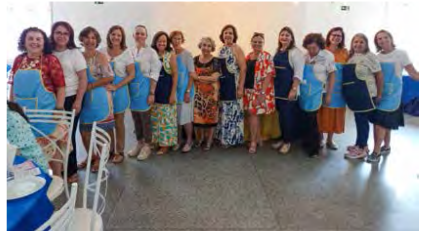
Equipe de associadas que doou seu tempo e serviço para que tudo saísse na mais perfeita ordem e que a tarde fosse um encanto