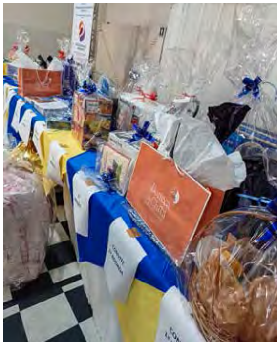
Mesa atrativa de prêmios para os jogadores da tarde