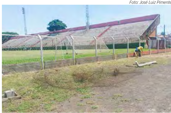
Novo alambrado sendo instalado no Benitão atrás do gol da av. 23

Com relação aos laudos exigidos pela Federação para que os jogos do Paulista Série A2 sejam realizados no Schmidtão, a situação é diferente daquela verificada no estádio Benitão. Os laudos, em