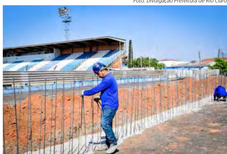
Funcionários trabalham na construção da nova arquibancada do Schmidtão