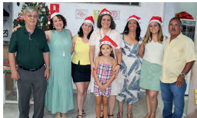
Diretores, funcionários e familiares