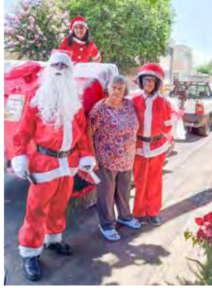
Papai Noel faz a alegria de crianças e adultos

Em bate papo descontraído com a reportagem do Diário, Sil-