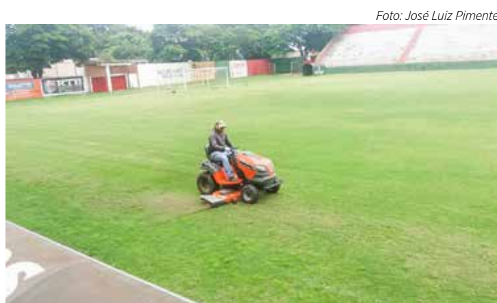
Velo cuida com carinho do gramado do Benitão para disputa da Série A2.