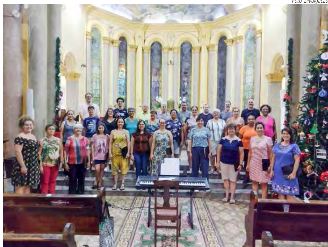
Crianças, jovens e adultos formam o coral da Cantata de Natal

Com o passar do tempo, a noite cultural de Natal foi se transformando em um momento musical até chegar à Cantata de Natal. No entanto, devido à pandemia de Covid-19, o evento foi temporariamente suspenso e agora está retornando com um belíssimo coral formado