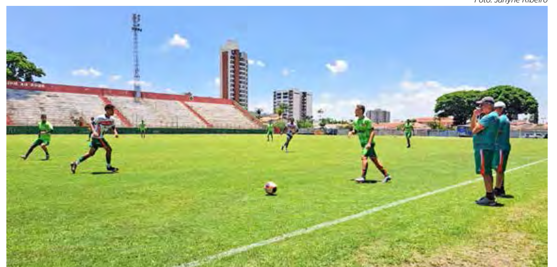
Rubro-Verde treina forte para estreia na Série A2