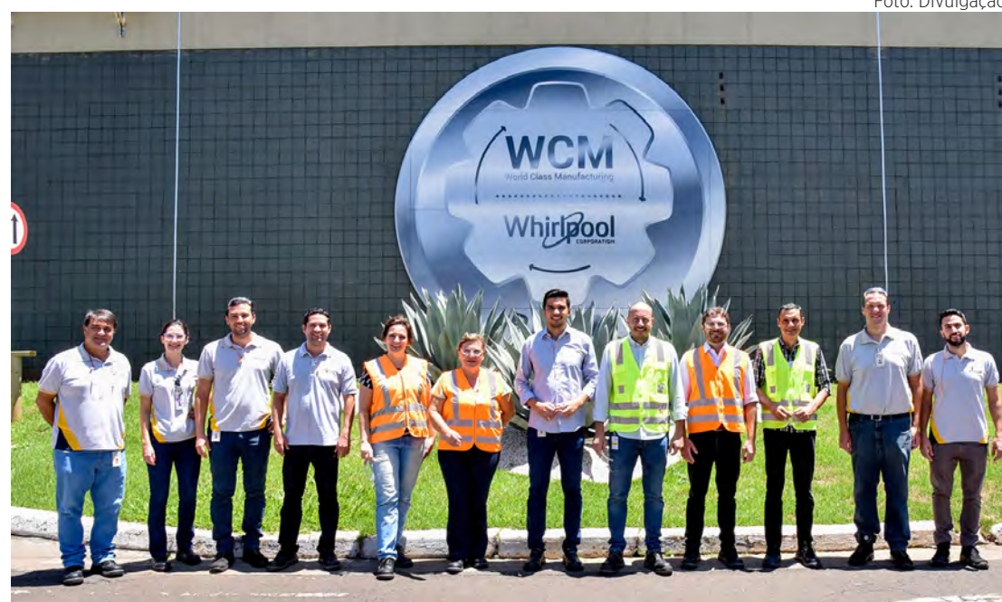
Reunião foi realizada na sede da Whirlpool em Rio Claro

pool concluiu projetos de expansão da ordem de R$ 265 milhões e, agora, firma este novo compromisso para ampliação de prédios e investimento em equipamentos. A previsão é de mais de 500 novos empregos diretos nos dois ciclos de investimento.