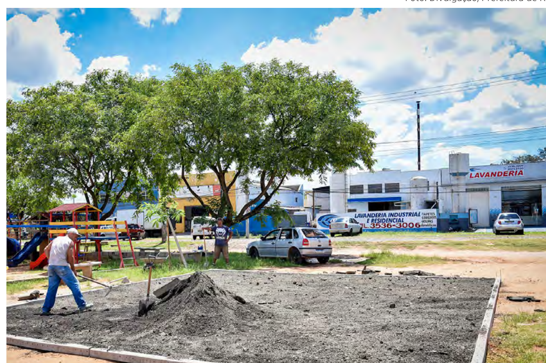
As obras para a construção da nova arena esportiva já começaram

Recentemente, a prefeitura de Rio Claro colocou em funcionamento duas arenas esportivas: uma no Bairro do Estádio e outra no Jardim Novo.