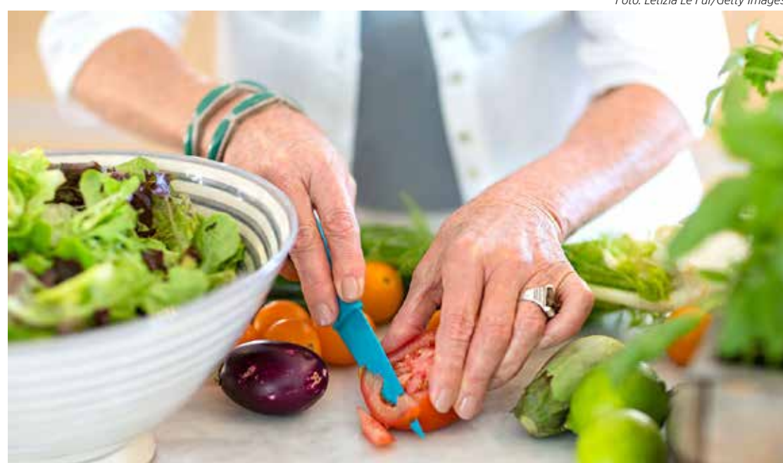
Calor exige refeições leves e de fácil digestão, com a inclusão de legumes, vegetais e frutas

tante líquido, evitar exposição ao sol nas horas mais quentes do dia, evitar o consumo de bebidas alcoólicas, usar hidratante para pele e umidificar o ambiente, e roupas frescas, de cores claras e tecidos respiráveis.