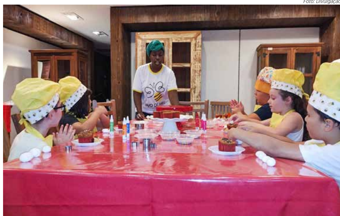
As crianças podem aprender brincando nas oficinas de culinária especiais de Natal

Além disso, o Papai Noel está recebendo as crianças de terça a domingo em seu trono, um espaço