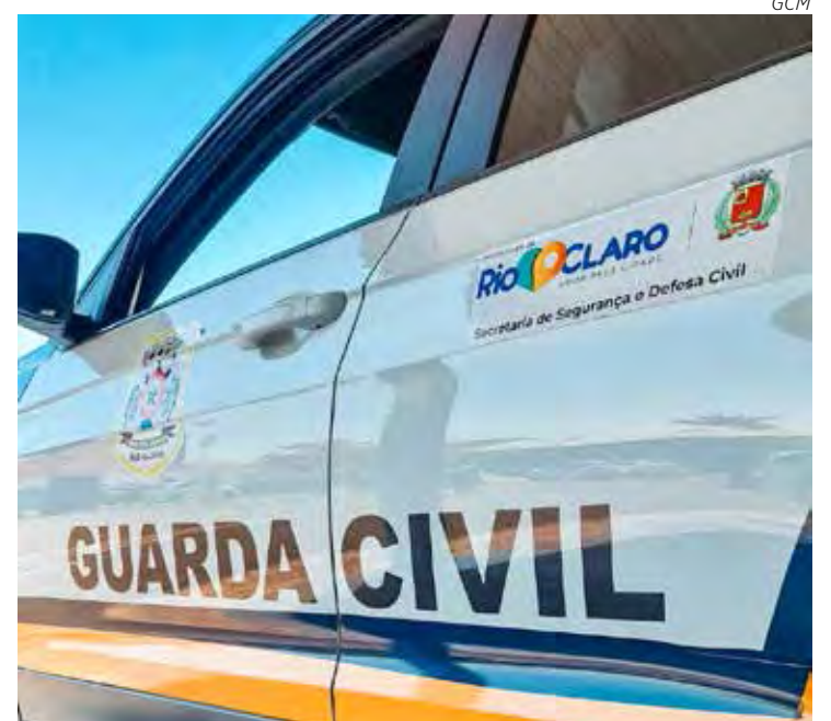
Viatura da Guarda Civil de Rio Claro

Temendo pela sua integridade física, a idosa buscou abrigo na casa de uma vizinha, retornando somente para informar à equipe da Guarda Civil o que tinha acontecido. Importante ressaltar que a vítima já havia formalizado um boletim de ocorrência no dia no começo do mês por motivos semelhantes. O filho foi detido em flagrante e conduzido ao Plantão Policial, sendo acusado do crime de ameaça.