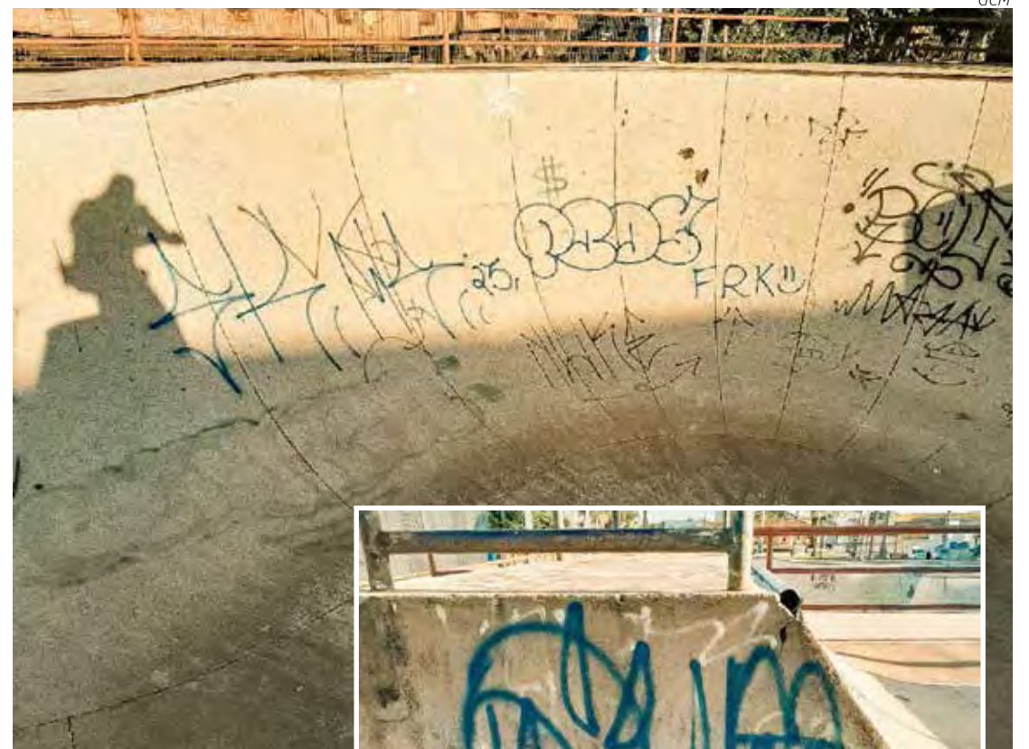
Pista de skate pichada pelos menores em Rio Claro

Consequentemente, os menores foram conduzidos à delegacia para o registro oficial do incidente, caracterizado como