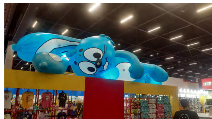
MAURÍCIO DE SOUZA PRODUÇÕES

atração à parte. Desde os grandes restaurantes, fast foods, até quiosques de guloseimas inusitadas.