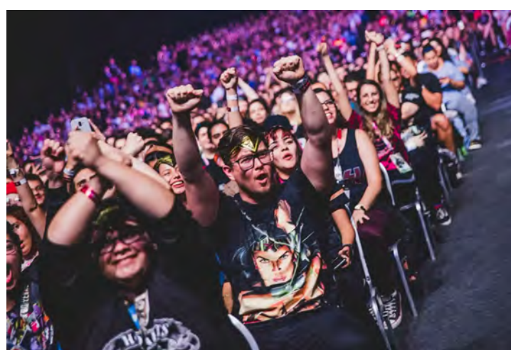
STAND WARNER BROS