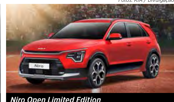
Niro Open Limited Edition

Ainda com dificuldades de importação, a Kia quer esquecer 2023. A marca sul-coreana vendeu apenas 5 mil veículos neste ano (repetindo a baixa performance de 2022). O reduzido volume, metade do que vendeu em 2019, é reflexo de dificuldades globais de abas-