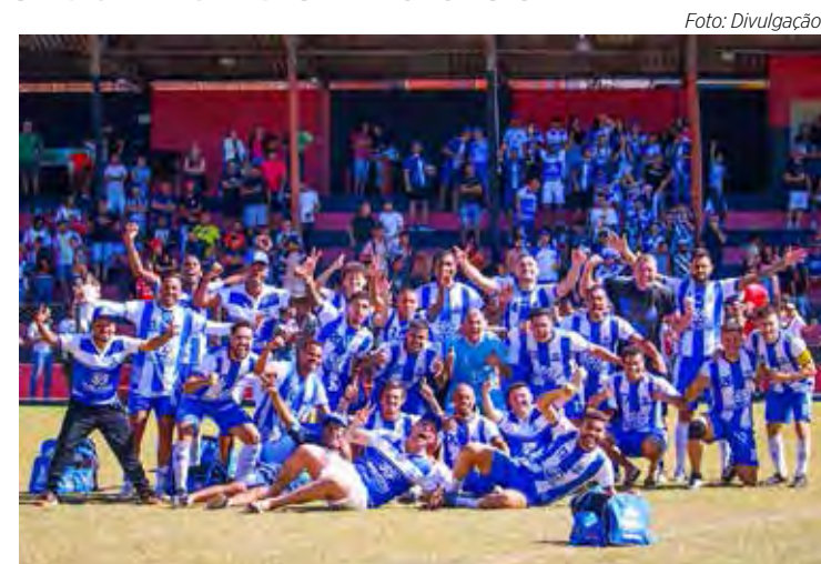
Porto FC de Santa Gertrudes - conquistou a 1ª Copa da Liga no primeiro semestre de 2023