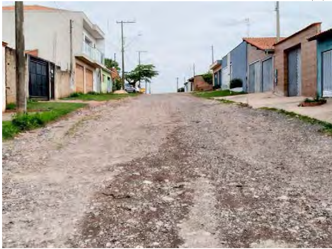
Rua sem asfalto no Jardim Nova Rio Claro

“O compromisso de asfaltar o Jardim Nova Rio Claro não foi cumprido. Estamos virando mais um Natal e nada foi feito. Ainda tem pontas de ruas em outros bairros que