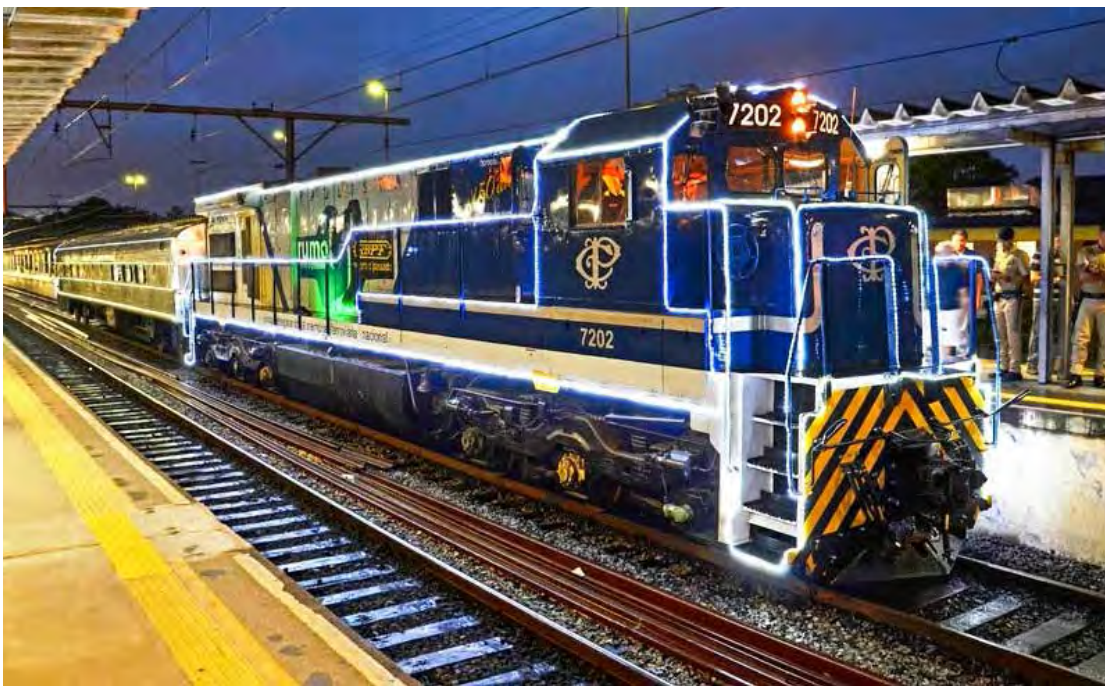
O trem iluminado "Rumo ao Natal" chegará a Rio Claro hoje