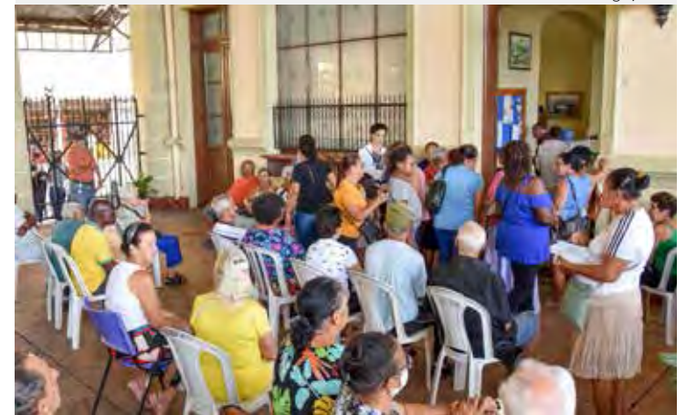
Cadastramento e troca de cartão estão sendo feitos na antiga estação ferroviária