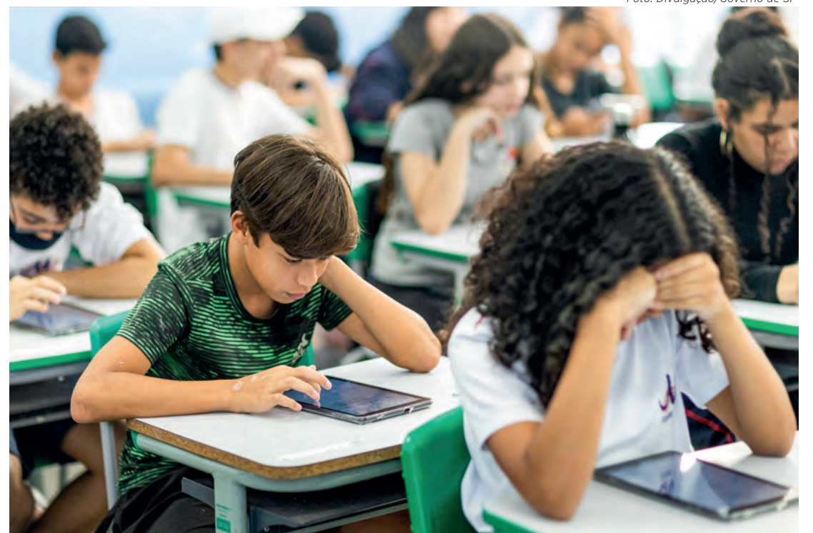
Estudantes que já estão na rede podem pedir transferência entre escolas da Seduc-SP a partir do dia 3 de janeiro de 2024

Todos os alunos têm vaga garantida na rede estadual de ensino. Para efetuar a matrícula, o responsável legal ou maior de 18 anos pode realizar a inscrição presencialmente em qualquer escola estadual ou no balcão de atendimento do Poupatempo, apresentando RG, histórico escolar e comprovante de residência. A matrícula também pode ser efetuada de forma virtual no portal da Secretaria Escolar Digital (SED), no endereço www.sed.educacao.sp.gov.br.