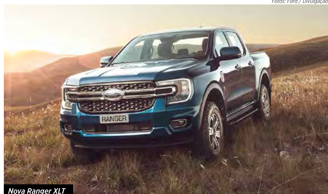
Nova Ranger XLT