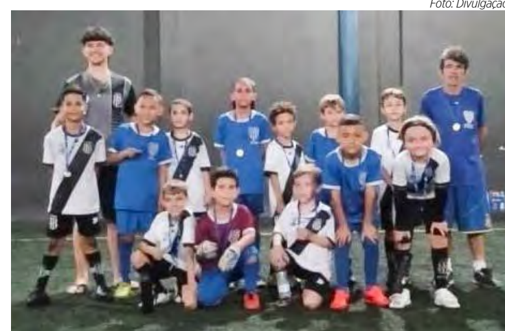
Técnicos e jogadores Sub-11 do Juventude FC e da Escolinha Fitness