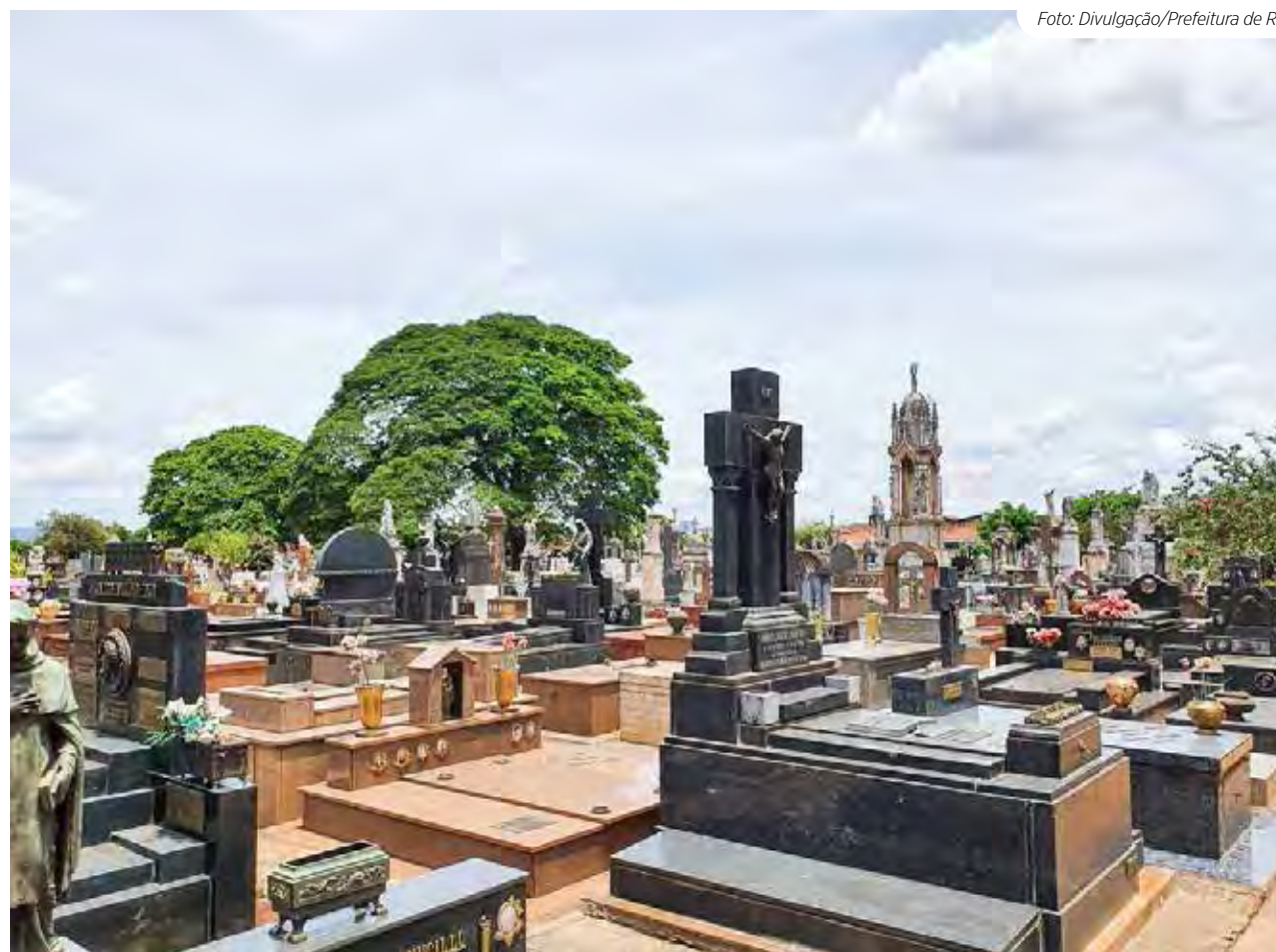
O Cemitério Municipal São João Batista não possui vagas para novos jazigos

A notificação vale para os cessionários de "sepulturas que se encontram sem ocorrências e conservação e em estado de total abandono por muitos anos, não tendo sido possível, até a presente data, o