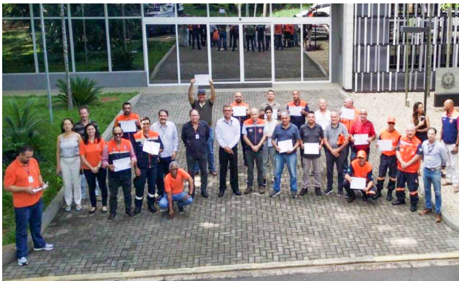
IFSP Rio Claro foi parceiro da Defesa Civil de Campinas para ministrar o treinamento

A capacitação de agentes permite que os municípios se habilitem para o processo de liberação de recursos para instalação de Centro de Operação de Emergência (COE) em suas