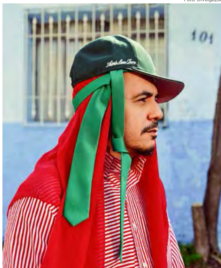
O artista Marcelo D2 fará show em Rio Claro no próximo dia 15

O evento acontece no campo de futebol da unidade (Avenida M-29, 441, no Jardim Floridiana). A abertura dos portões está marcada para as 18h, com uma série de atrações, área de alimentação completa e shows com artistas locais para entreter o público. A previsão é de que Marcelo D2 suba ao palco às 20h.