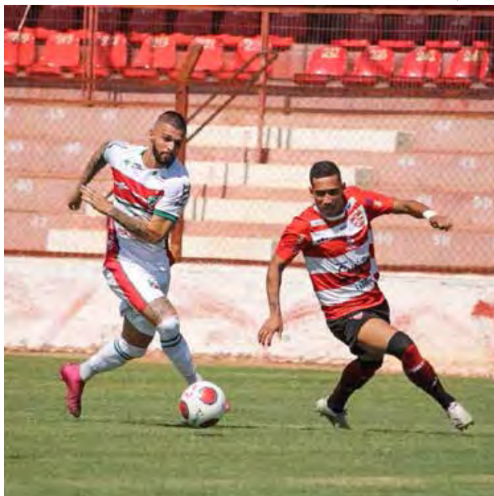
Em 2022, Velo enfrentou Linense, fora de casa, pela 12ª rodada da Série A2