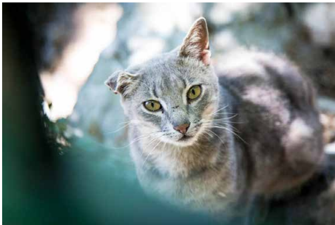
Os animais são seres sencientes que sentem dor, solidão, fome e frio