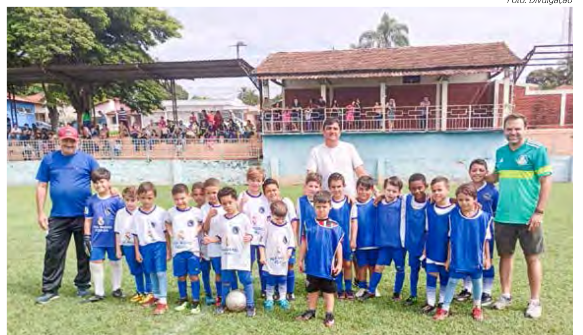
Crianças e professores do 2º Campeonato Municipal de Analândia