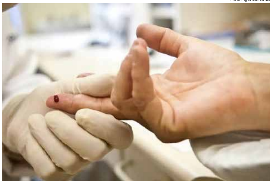
O teste rápido é um método diagnóstico realizado a partir da coleta de uma gota de sangue retirada da ponta do dedo

Estima-se que, atualmente, um milhão de pessoas vivam com HIV no Brasil, sendo que, destas, 900 mil conhecem seu diagnóstico. Nesse cenário, a meta é ter 95% das pessoas vivendo com HIV diagnosticadas; alcançar o tratamento de 95% dessas pessoas; e, dessas em tratamento, ter 95% com carga viral controlada.