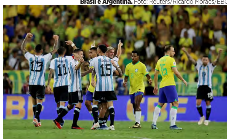
Brasil e Argentina.

de Carvalho é o nome defendido por alguns dos principais nomes do PT. O ex-ministro do STF, Ricardo Lewandowski, também é cotado por ter sido sempre próximo do presidente Lula. A lista ainda tem a ministra do Planejamento e Orçamento Simone Tebet; a presidente nacional do PT, Gleisi Hoffmann; o advogado-geral da União Jorge Messias e Wadih Damous, ex-deputado e secretário nacional do Consumidor. No entanto, os pitaqueiros de plantão podem fazer torcida para o seu candidato, mas a decisão final cabe