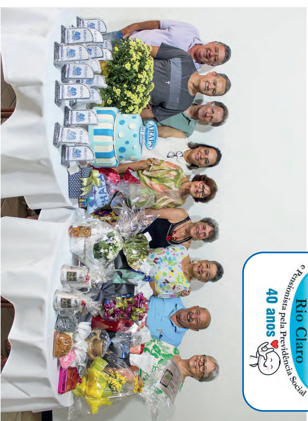
Diretoria da Araps