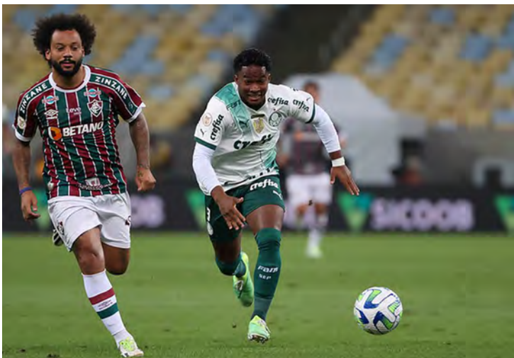
Palmeiras e Fluminense.

• E o ministro da Justiça, Flávio Dino, está correndo contra o tempo para ter seu nome aprovado para o STF (Supremo Tribunal Federal). Indicado pelo presidente Lula para a vaga no STF, Dino tem conversado com os senadores para facilitar sua aprovação na sabatina marcada para o dia 8. E parece que o bate-papo tem dado resultado. Segundo divulgado pela grande imprensa, ele já obteve mais da metade do apoio que precisa para ter sua indicação à Suprema Corte. A aprovação depende da maioria absoluta: ou seja, pelo menos 41 dos 81 votos. A oposição bem que está tentando boicotar a aprovação do ministro, mas tudo indica que será voto vencido.