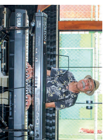
O Musical Pitico do Teclado e Piano