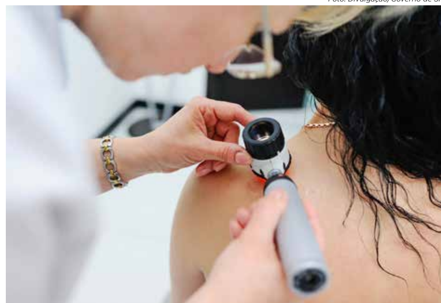
É importante fazer uma avaliação clínica da pele para prevenir o desenvolvimento de câncer

vocadas principalmente por exposição excessiva aos raios ultravioletas.