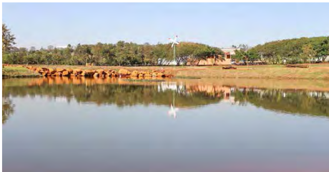
A atividade de Ritbox + Aulão Solidário será realizada no Parque Municipal "Ruy Raphael da Rocha"

dança. É uma aula coletiva, um treino ritmado, que proporciona emagrecimento, força, resistência e diversão.