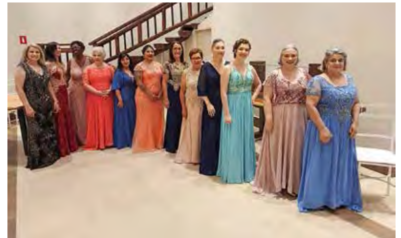
Um deslumbramento de elegância e fé na vida