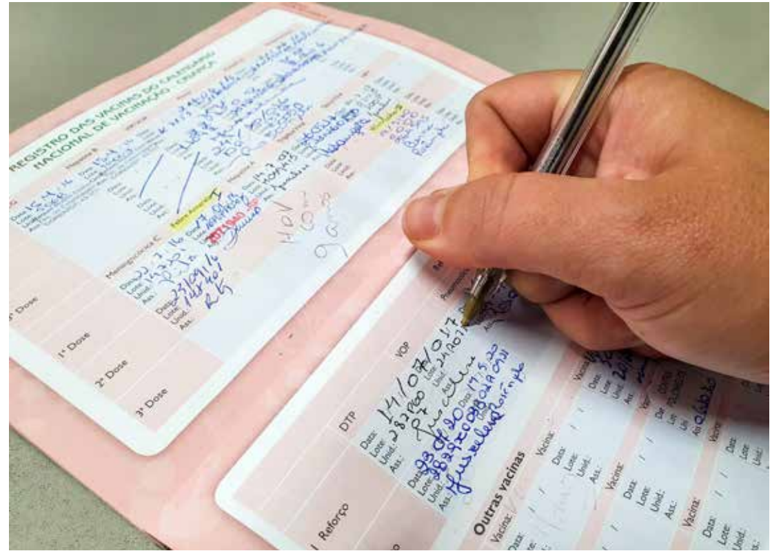
Campanha visa atualizar a caderneta de vacinação dos menores de 15 anos

Na faixa etária de menores de 1 ano, foram levados às unidades de saúde 2.843 bebês e 1.949 tinham alguma dose para receber. Entre as crianças de 1 a 4 anos, 4.942 compareceram ao posto de saúde e 2.011 precisaram ser vacinadas. De 5 a 8 anos 3.683 estiveram em uma unidade de saúde e 616 foram vacinados. Na faixa etária de 9 a 14 anos, 2.986 compareceram e 1.181 tinham alguma vacina em atraso.