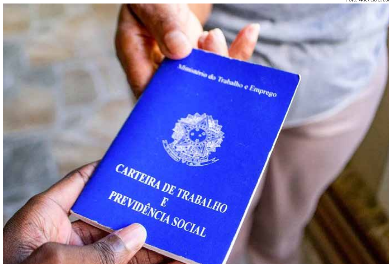
Rio Claro terminou outubro com fechamento de 126 empregos com carteira assinada

Vale lembrar que em outubro de 2022, o município também teve saldo negativo na criação de empregos, com fechamento de 25 postos. No entanto, neste ano, o número de vagas fechadas no mês foi bem maior: 126.