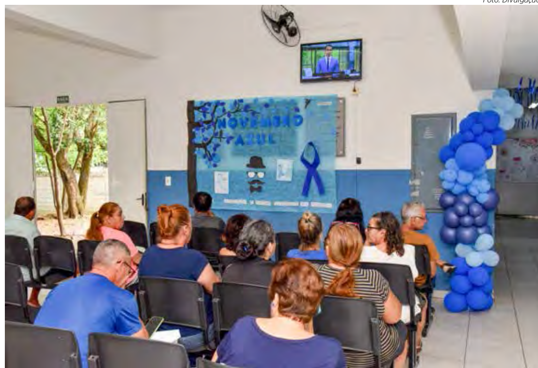
Unidades de saúde realizam ações na programação do Novembro Azul