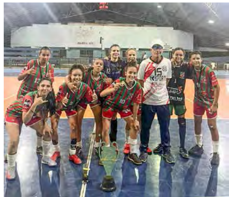
Time de futsal feminino do Velo comemora conquista da Copa Regional