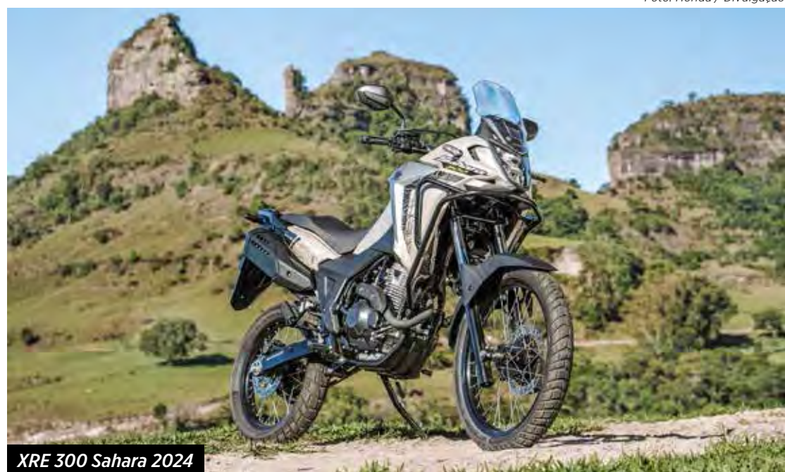
XRE 300 Sahara 2024

Começa a chegar às lojas Honda nas últimas semanas de dezembro, a nova XRE 300 Sahara 2024, por a partir de R$ 27.090 em três versões.