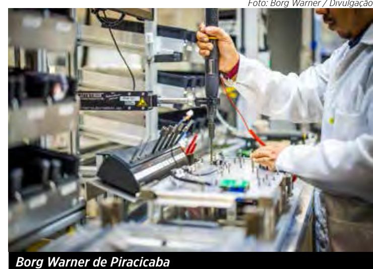
Borg Warner de Piracicaba

Para 2024, a BorgWarner projeta mais crescimento no mercado de reposição, com os avanços da linha Thermal (ventiladores e embreagens viscosas) que cresceu 48% e a linha de turbos, que teve alta de 12% este ano.