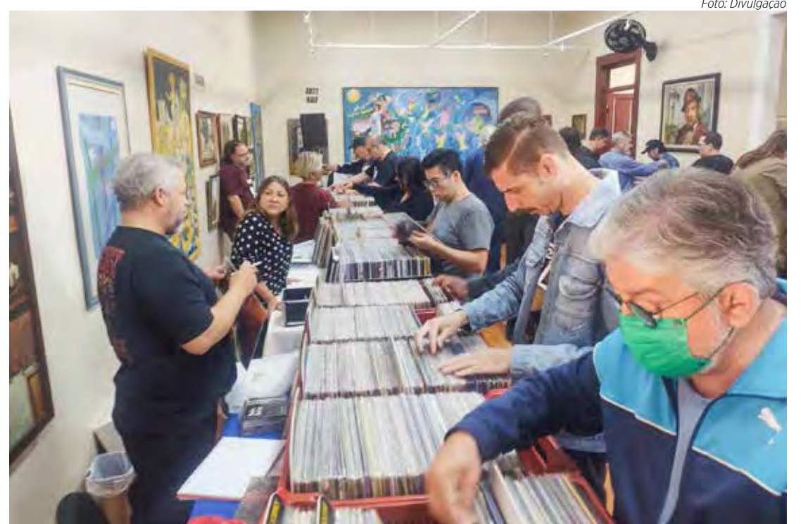
Evento será das 10h às 18h no Casarão da Cultura, sem cobrança ingresso

O evento, que conta com o apoio da Secretaria Municipal da Cultura, terá lanchonete no local, além de um beer truck vendendo chope gelado para os apreciadores. Abanda Rock A2 será a atração musical, fazendo o melhor do rock pop em versões acústicas.