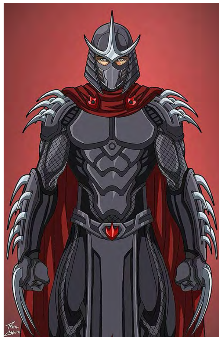
INIMIGO - Destruidor

Os nomes das tartarugas - Leonardo, Michelangelo, Donatello e Raphael - foram escolhidos em homenagem a quatro grandes artistas do Renascimento italiano, refletindo a inclinação artística dos criadores. Cada