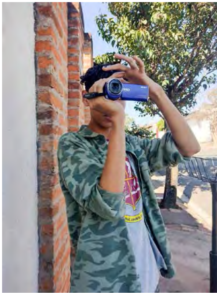
Mostra de Curtas vai mostrar o resultado do trabalho realizado pelos estudantes no Projeto Com.Você

O evento contará ainda com uma apresentação artística da Cia Circo da Mata, que atua na região desde 2005. Conhecida por suas performances envolventes, a Companhia promete adicionar um toque especial à noite, com entretenimento de alta qualidade. “Preparamos um pocket que in-