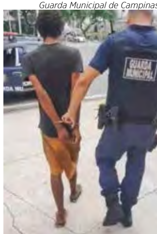
Guarda Municipal de Campinas

Uma ocorrência atendida pela Guarda Municipal de Campinas está intrigando as autoridades pelas características inusitadas. Um rapaz foi preso ao dar o nome do irmão que procurado pela Justiça, foi liberado após a perícia confirmar sua identidade, mas a suspeita é de que ele seria, autor de crimes investigados. A história se iniciou quando o homem tentou fugir de uma abordagem de rotina e foi capturado perto da rodoviária de Campinas. Morador em situação de rua, segundo a Guarda ele se apresentou com o nome de um homem procurado por dezenas de roubos e furtos em São Paulo. Segundo o Boletim de Ocorrência, ao receber voz de prisão o suspeito, então, disse que havia dado o nome do irmão, e que a identidade dele seria outra. As contradições levaram a polícia a colher as digitais dele para tirar as dúvidas. O Instituto de Criminalística confirmou a iden-