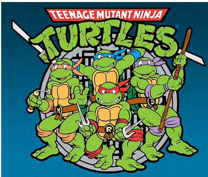
DESENHO ANIMADO - Tartarugas Ninjas Mutantes