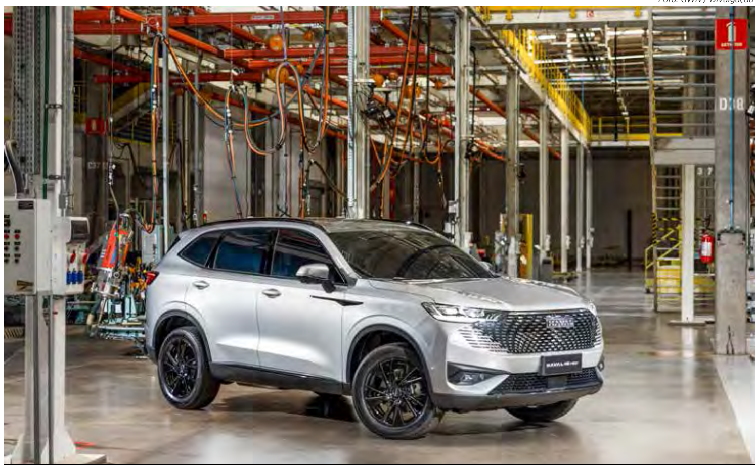
Haval H6 é sucesso de vendas