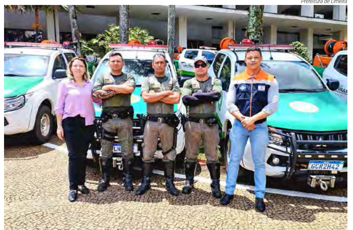
Prefeitura de Limeira