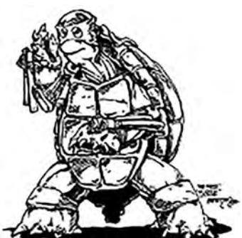
Kevin's original Turtle sketch