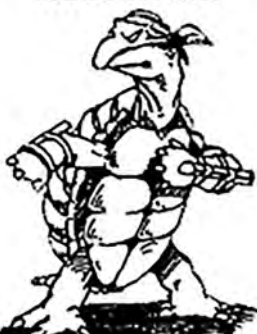
Peter's first Turtle sketch