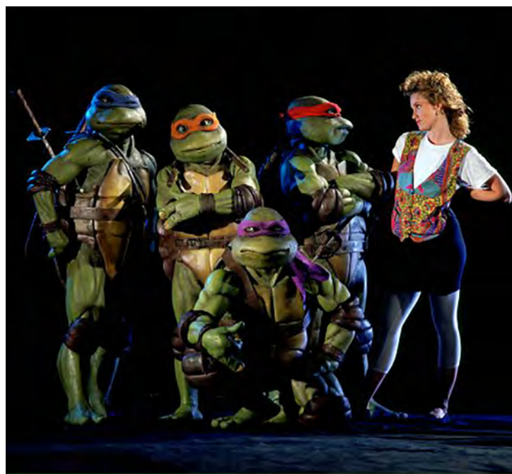
FILME CINEMA - Tartarugas Ninjas

acaso e inspiração. Naquela época, as artes marciais estavam em voga, e a ideia de combinar habilidades ninjas com criaturas aparentemente frágeis e totalmente sem habilidades naturais como tartarugas, resultou em um conceito revolucionário.