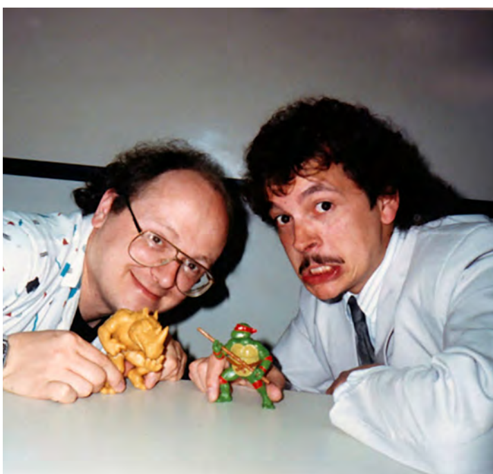
CRIADORES - Kevin Eastman e Peter Laird