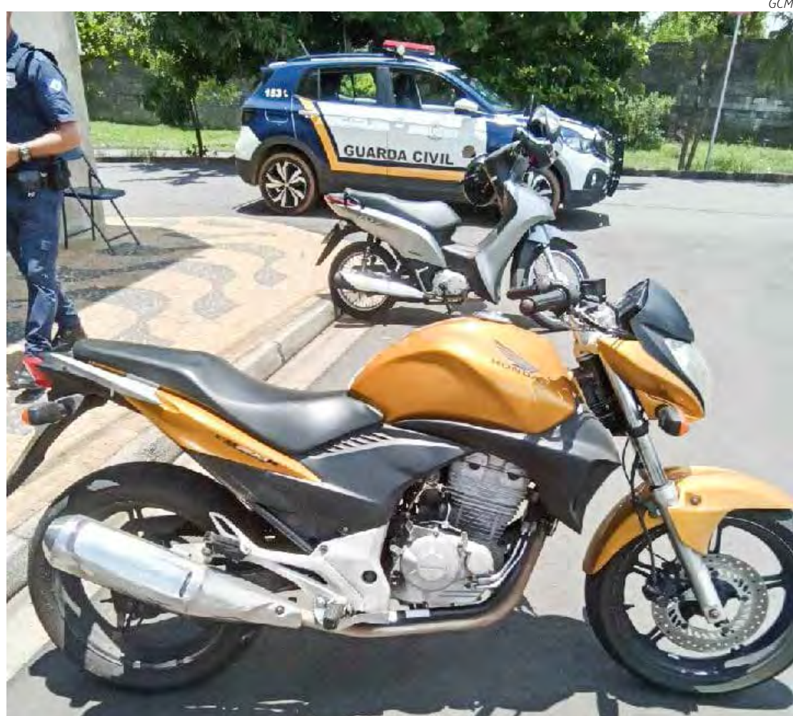
Caso aconteceu nesta semana na cidade de Rio Claro