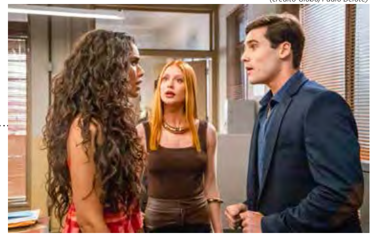
Cena da novela "Fuzué"