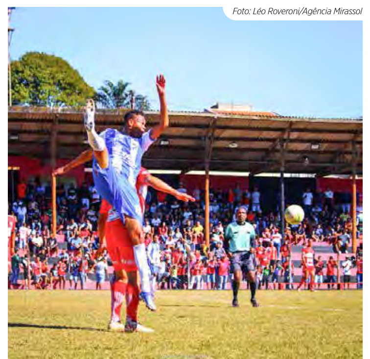
Arena Cidade Nova recebe semifinal do Amadorzão 2023

Por esse motivo, providências estão sendo tomadas pelos mentores de ambas as equipes profissionais de nossa cidade para deixarem os estádios prontos para as referidas vitórias.