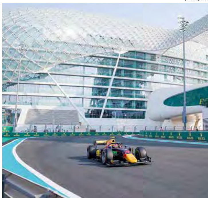
Primeira das duas corridas é neste sábado, com brasileiro largando da pole