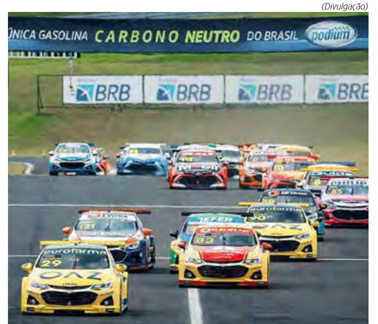
Stock Car tem etapa importante em Cascavel