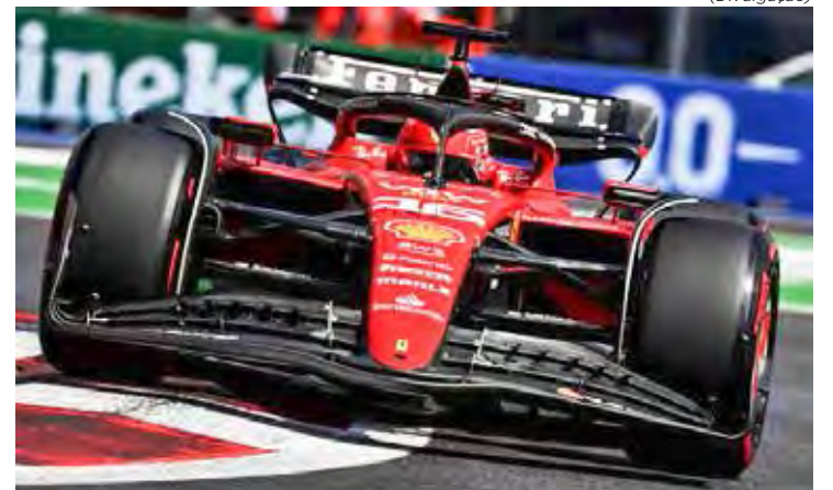
Charles Leclerc foi o melhor no TL2