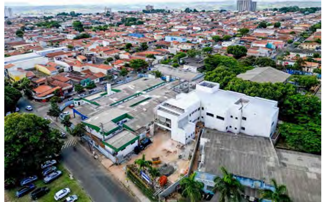
Equipamento público irá integrar complexo de saúde da região norte

“Serão dois complexos de saúde no município: um na região norte e outro na região sul, com ampliação dos serviços de saúde ofertados à população, o que representa um