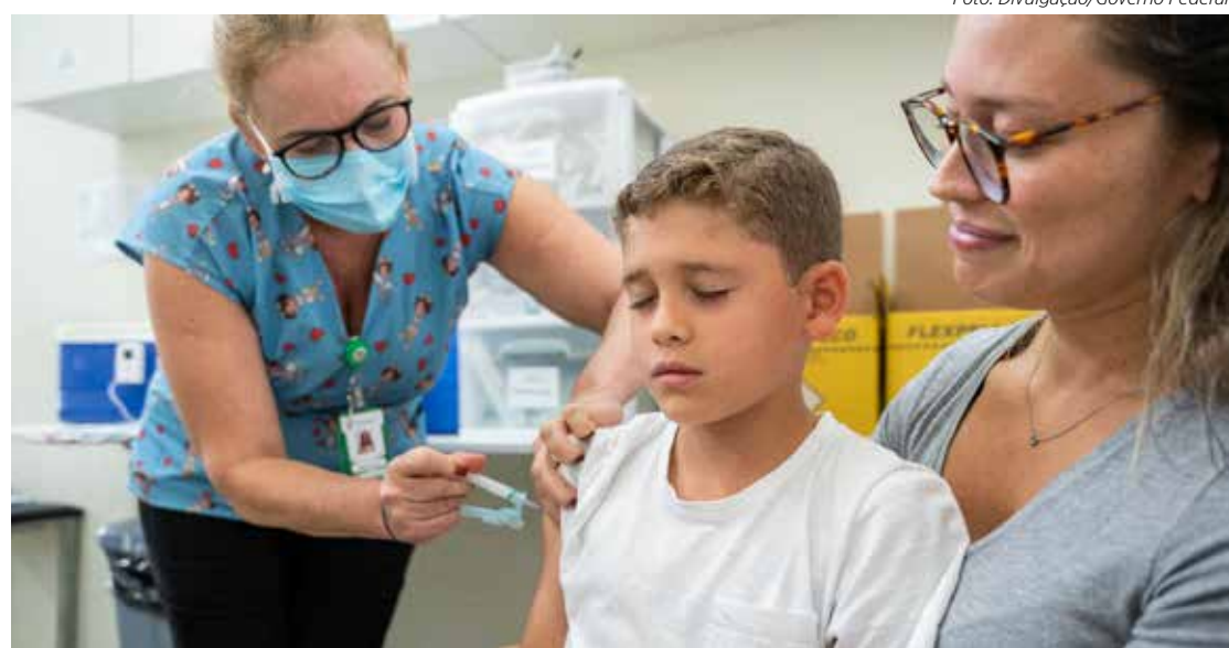
Vacinação é destinada a crianças e adolescentes com menos de 15 anos

O objetivo da campanha de multivacinação é ampliar as coberturas vacinais e, para isso, estarão disponíveis todas as vacinas do calendário nacional, que protegem contra cerca de 20 doenças. Também estão disponíveis doses contra a gripe e Covid-19.