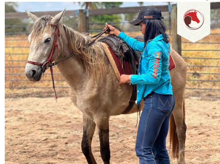
Cerimônia de posse foi realizada na quarta-feira na Acirc

Loja Maçônica George Washington nº 62, Sindicato Rural de Campos Belos e Confinamento Farroupilha.