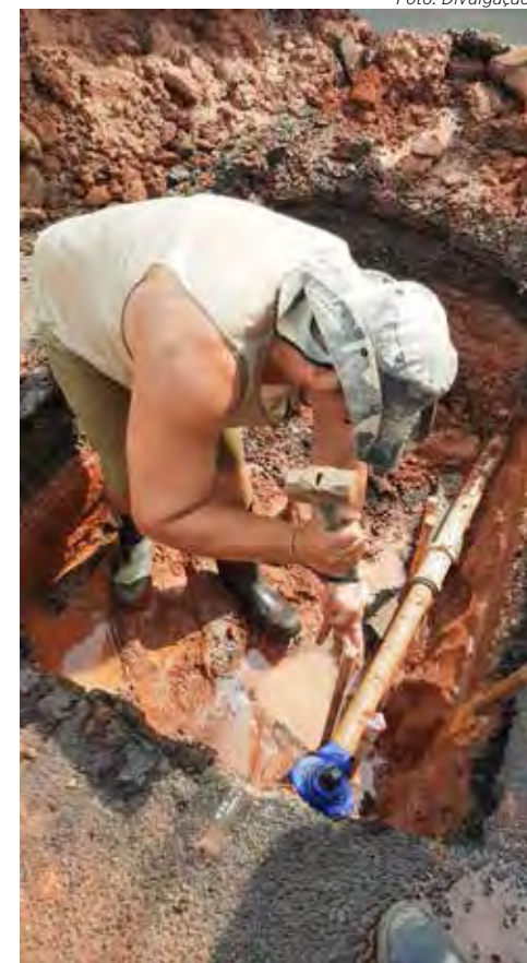
Ações visam melhorar a pressão no fornecimento de água em pontos críticos

Além deste trabalho de melhorias e manobras em trechos da rede do município, o Daae está fazendo trabalho de “caça-vazamentos” em diversos bairros, com mapeamentos no Jd. Brasília e em outros pontos críticos de fornecimento de água na cidade.