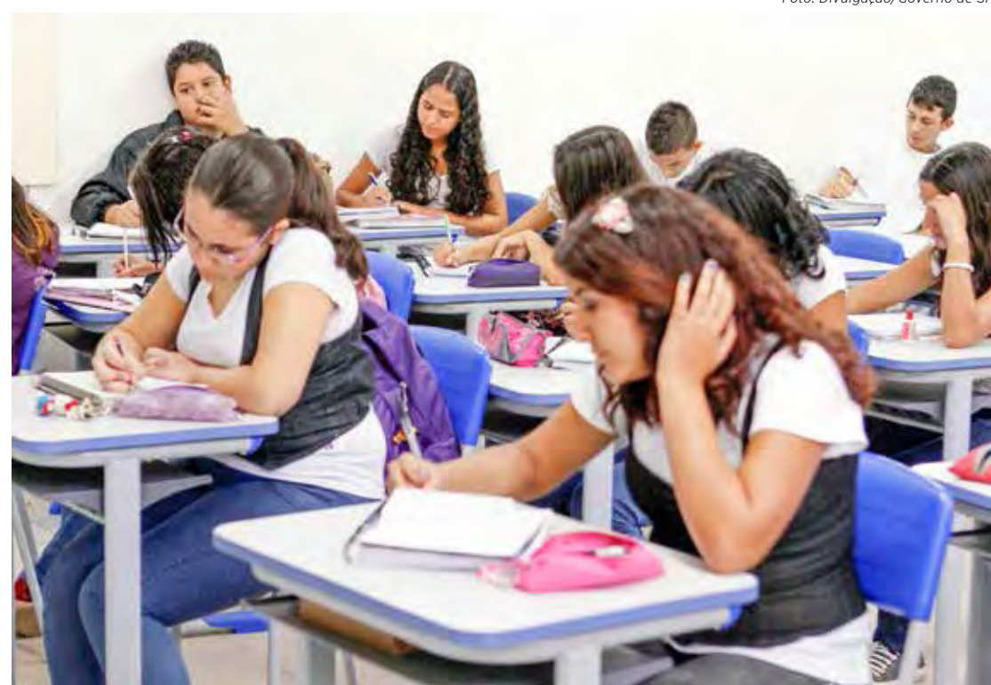
Estudantes da rede estadual de ensino terão novas aulas a partir do ano que vem

Para o aprendizado de língua portuguesa, a carga horária será alterada da seguinte forma: na 3ª série, será ampliada de duas para três aulas de língua portuguesa e outras duas de redação e leitura; na 2ª série, além das três aulas semanais, os estudantes terão outras duas