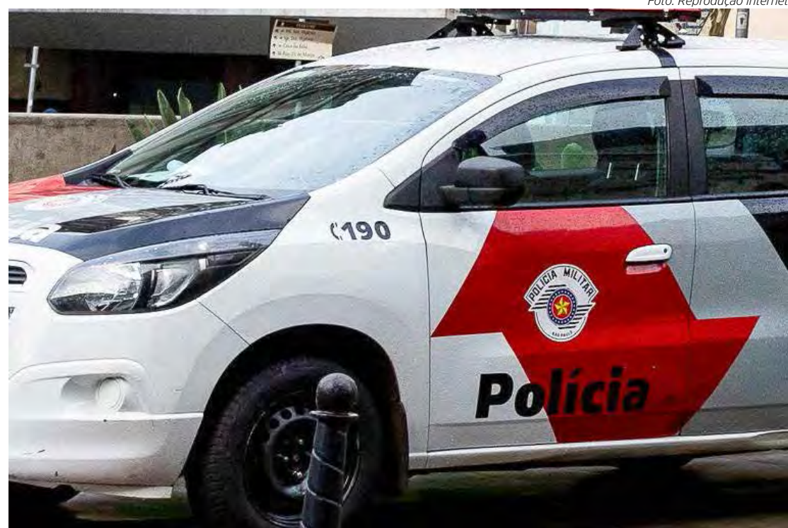
Viatura da PM em Rio Claro

Além dessas ações, no bairro São José, a equipe de Força Tática abordou e capturou um