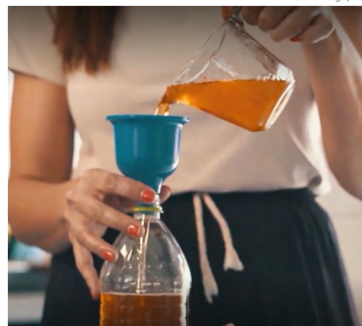
Os moradores devem armazenar o óleo usado em garrafas plásticas e levem a um ponto de coleta