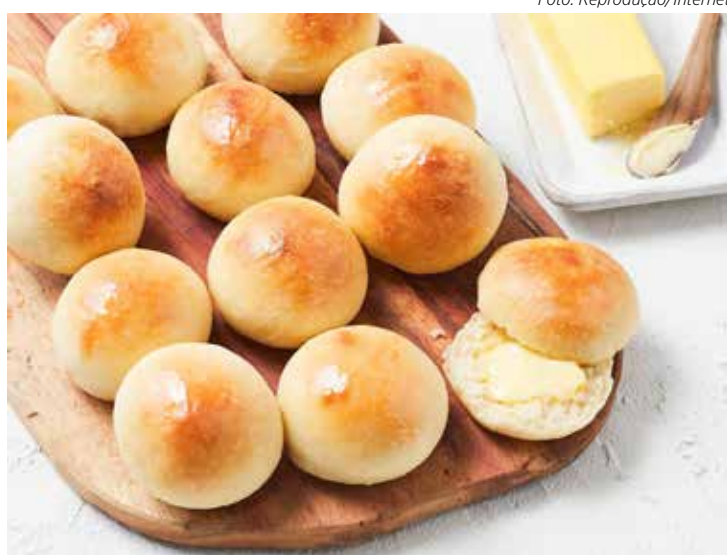
Pãozinho de batata

“A escola é um espaço de aprendizado, vivências e reflexões, sendo um local estratégico para a promoção da saúde. É no ambiente escolar que crianças e jovens passam grande parte do