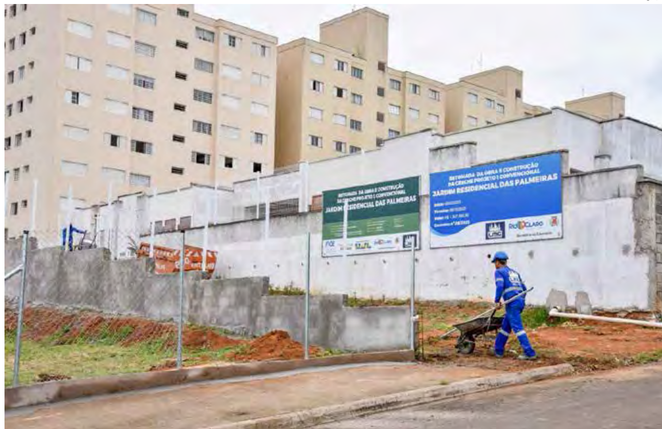
Obras de construção da creche no Residencial das Palmeiras (foto do início de outubro)

O prefeito comentou que assumiu a prefeitura com déficit de 1.300 vagas em creche, ou seja, 1.300 crianças fora da escola nessa modalidade de