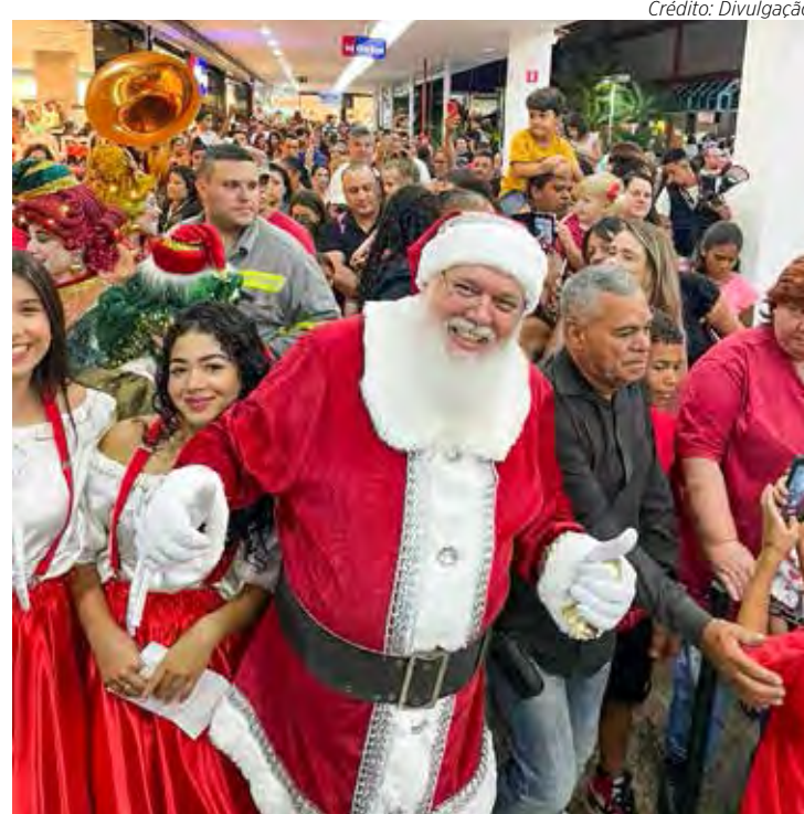
Na chegada, o Papai Noel desfilou pelos corredores do shopping

O Papai Noel está disponível de terça a sábado das 14h às 22h, domingos e feriados das 13h às 19h, e no dia 24 de dezembro, das 13h às 18h. Todos os dias, das 17h às 18h, o Noel alimenta as renas e às segundas-feiras ele vai levar as cartinhas das crianças no Polo Norte.