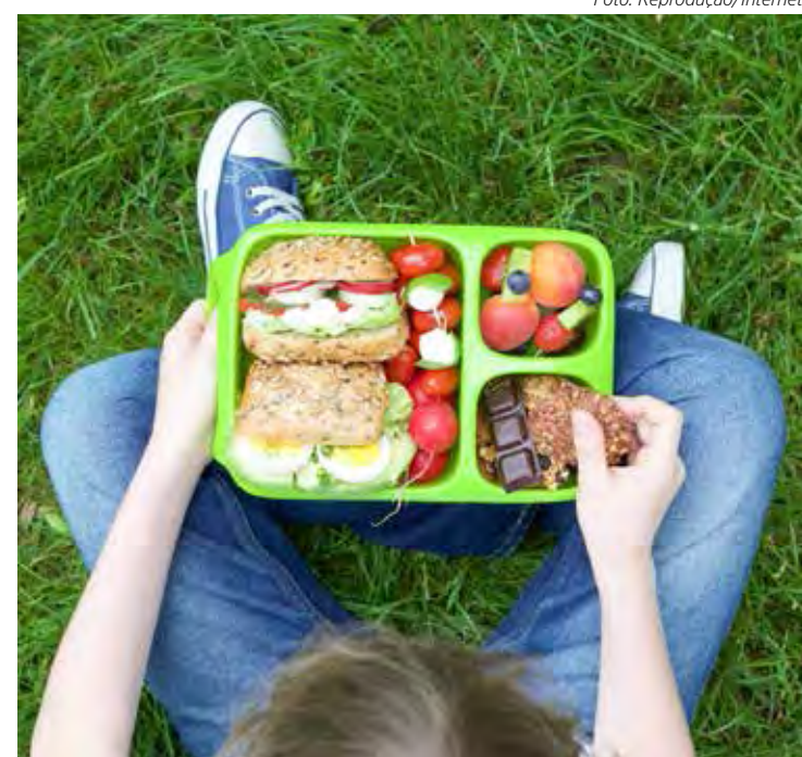
Alimentos saudáveis não podem faltar na lancheira das crianças

O importante é sempre ter em mente a recomendação do Guia Alimentar, que possui a seguinte regra de ouro: alimentos in natura ou minimamente processados são a base ideal para