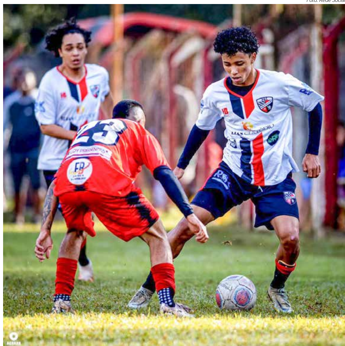
Finais do Amador Série B prometem ser bem disputadas