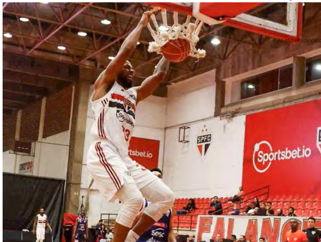
São Paulo vence pela primeira vez na temporada 2023-2024 do NBB

Dois partidas estão marcadas para esta sexta-feira (10), pelo NBB 2023/2024. Às 20 horas, o Mogi das Cruzes recebe o Minas Tênis e no mesmo horário, o Botafogo-RJ encara o SESI Franca.