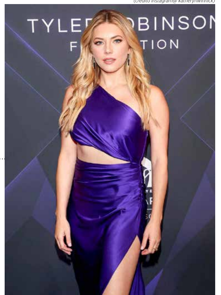
A atriz canadense Katheryn Winnick é uma das estrelas da série "Vikings"