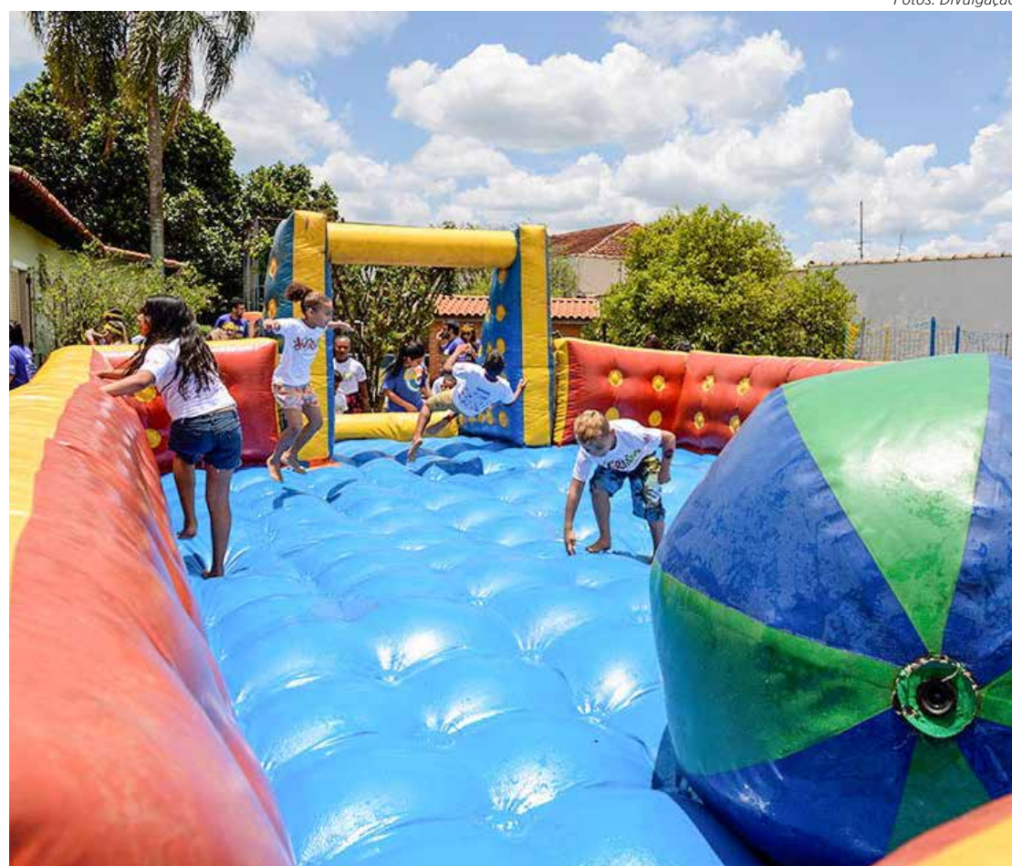
DivertDia garante muita diversão para as crianças

apoiadores desta edição: Bardahl, Cerâmica Carmelo Fior, Agrocerec Multmix, Pecini Imobiliária, EPTV, Engafort, Riclan, RP Capital, LJ Mídia, Equador, Via Campos, Riverside Capital, Aspacer, RTB, Rápido SP, Ferrari, D'Itália, One Alimentos, BR11, Destaque Outdoor, Diário do Rio Claro, Essência do Corpo, Fernando Brindes, Divisa Gráfica, Enfok Outdoor.