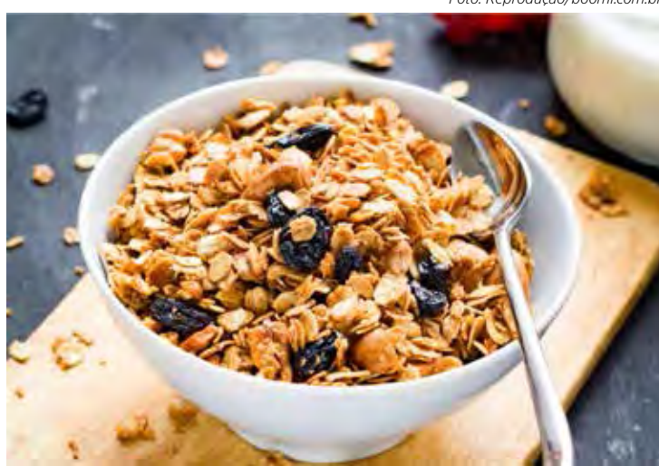
Granola caseira é opção de lanche saudável para as crianças

Em uma tigela, mistura bem todos os ingredientes. A massa fica macia e fácil de modelar. Faça bolinhas com as mãos e coloque em uma assadeira untada com um pouquinho de óleo. Leve ao forno e asse até dourar.