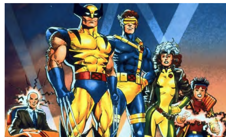
VOLWERINE E CYCLOPE