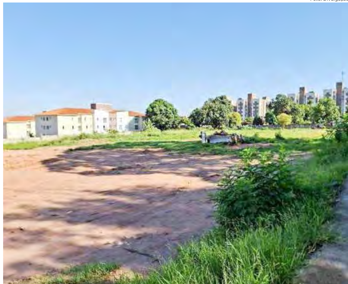
Oito terrenos serão leiloados pela prefeitura de Rio Claro

Os terrenos que estão sendo vendidos têm tamanhos que variam de quase 8.000 m² a 24.400 m². A