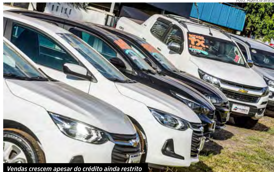
Vendas crescem apesar do crédito ainda restrito

Segundo o executivo, o setor da distribuição precisa de escala no varejo para operar de forma sustentada e a Lei de Retomada do Bem seria um forte aliado, reduzindo a restrição de aprovação das fichas cadastrais nos financiamentos dos veículos. "Quem mais sofre com esse veto são os consumidores", completou Andreta Jr.