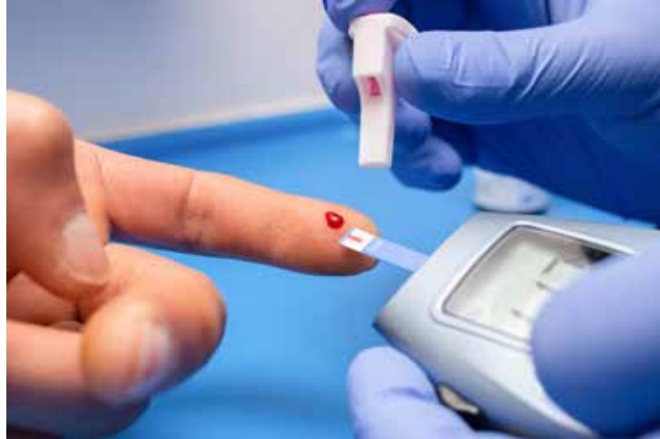
O diagnóstico de diabetes é feito pelo exame de sangue conhecido como glicemia de jejum

A proposta da deputada Dani Alonso (PL) foi aprovada pela Assembleia Legislativa e sancionada pelo governador Tarcísio de Freitas. De acordo com a parlamentar, a iniciativa se justifica pelo fato de a doença não ter cura. “Logo, uma vez obtido o diagnóstico, não persiste mais razão em submeter essas pessoas e quem as auxilia a reiteradas dificuldades suscitadas com a