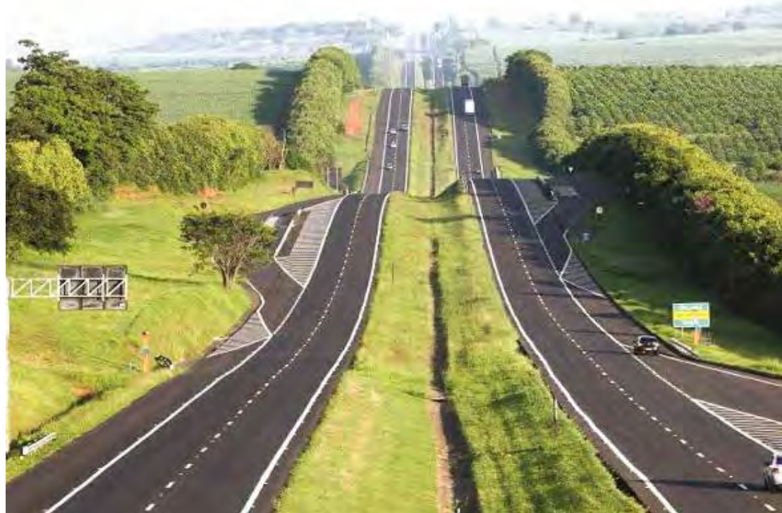
O acidente foi na pista sentido interior-capital

Ele teria morrido na hora. Até o fechamento desta edição não havia informações oficiais da identidade e origem da vítima.