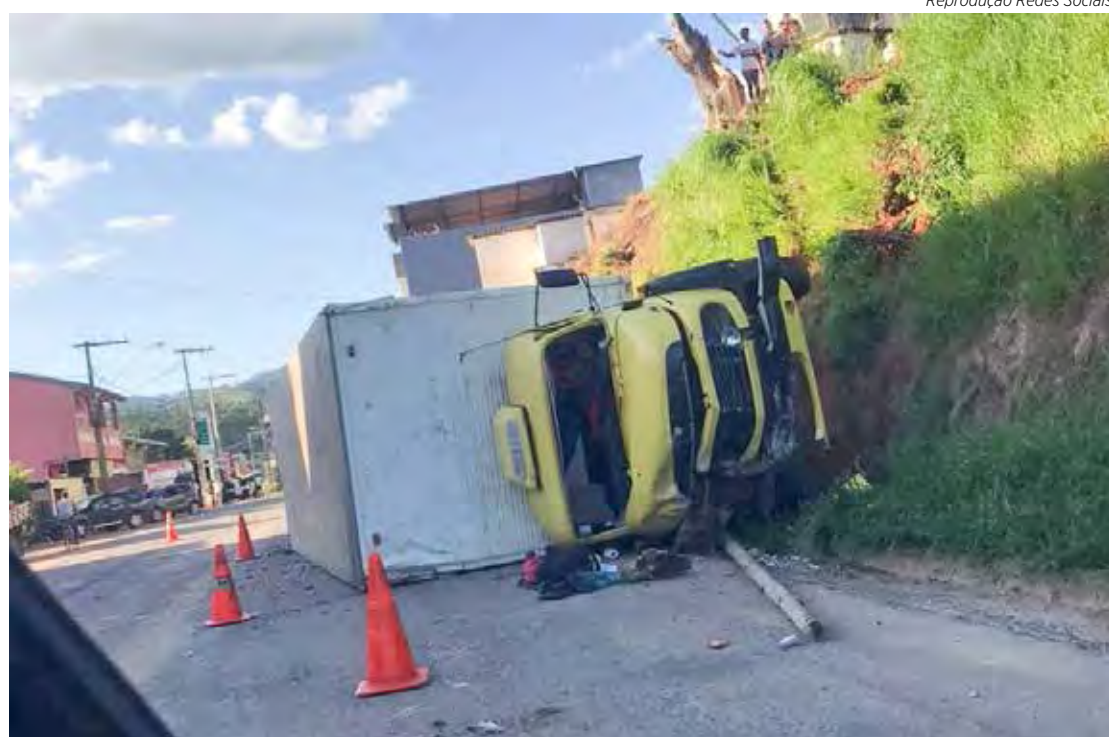
O caminhão estava carregado com tubos de água e esgoto

O caminhão tinha placas de Rio Claro, e estava carregado com tubos de água e esgoto. O motorista era terceirizado de uma empresa prestadora de serviços da concessionária Copasa