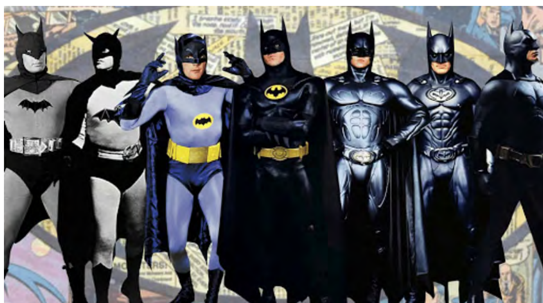
BATMAN - EVOLUÇÃO

em cachos, às vezes carecas, de uniformes super justos para exibir a "super" musculatura, em circos de atrações bizarras, e logicamente com suas "cuecas" por fora do uniforme. Os chamados "Muscle man" ou "Strong man".