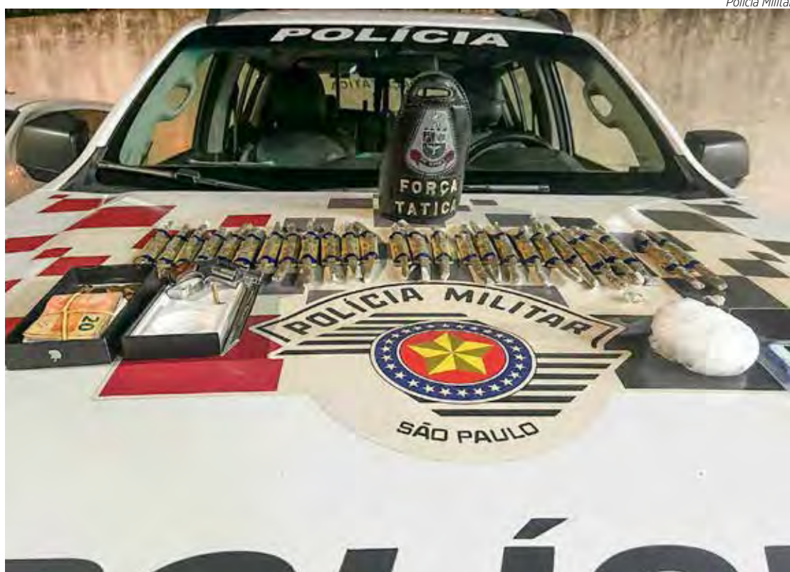
As drogas, arma, munição e o dinheiro apreendidos pelos policiais

De posse da informação os policiais intensificaram o patrulhamento naquela área e acabaram localizando e abordando o suspeito. Durante a busca pessoal