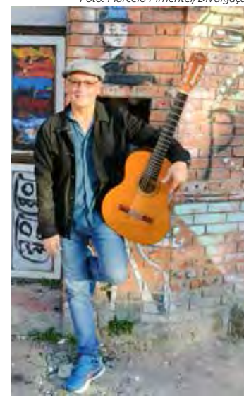
O cantor e compositor Zé Caradípia estará em Rio Claro na sexta-feira