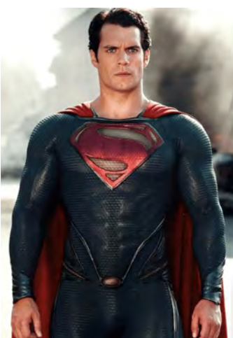
SUPERMAN - NOVO UNIFORME

Ou do "aloprado" "Batman", e seu comparsa "Robin", ambos também famosos "cuecudos".