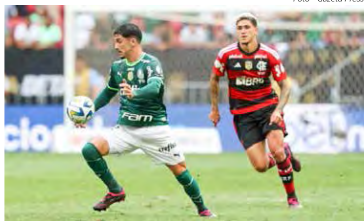
Palmeiras e Flamengo na briga direta pelo título do Brasileirão