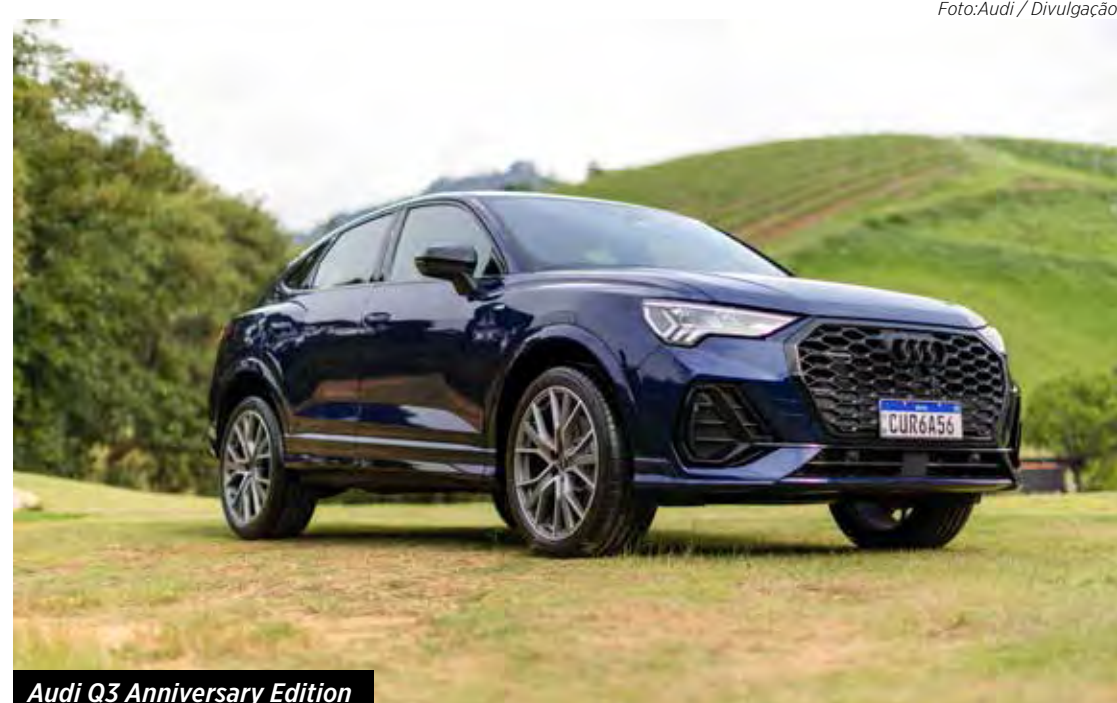
Audi Q3 Anniversary Edition

O Q3 traz sob o capô o mesmo motor 2.0 turbo de quatro cilindros, que rende 231 cavalos de potência e 34,6 kgfm de torque. A tração é integral sob demanda e a transmissão Tiptronic é de oito marchas.