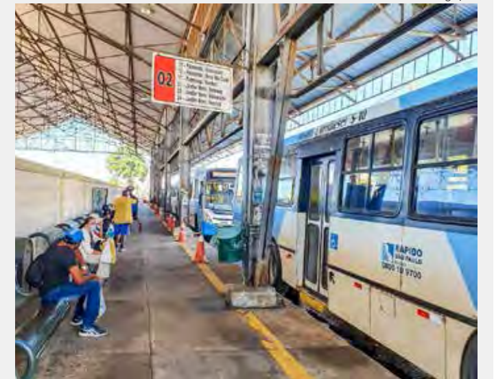
Ônibus e passageiros no terminal urbano na antiga estação