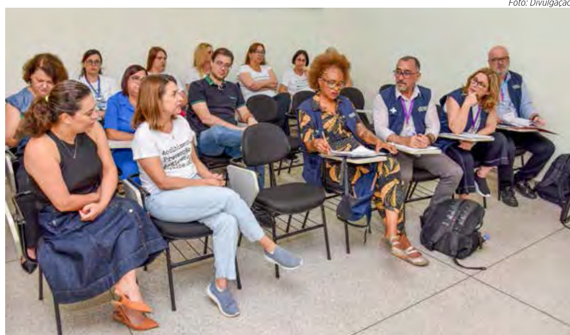
Equipe federal realiza visitas técnicas em serviços de saúde do município

Gestantes com HIV fazem acompanhamento pré-natal no Sepa, onde após o nascimento os bebês passam por acompanhamento com infeto-pediatra. Dessa forma,