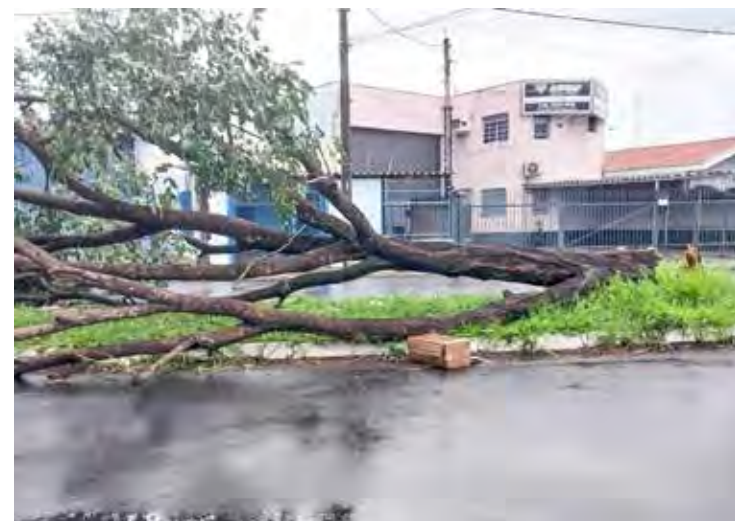
Também houve queda de árvore na Rua Samambaia com Rua 12