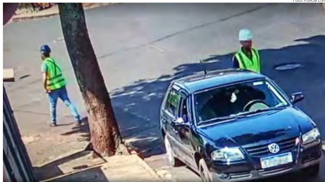
As investigações estão a cargo da Divisão Especializada em Investigações Criminais de Piracicaba