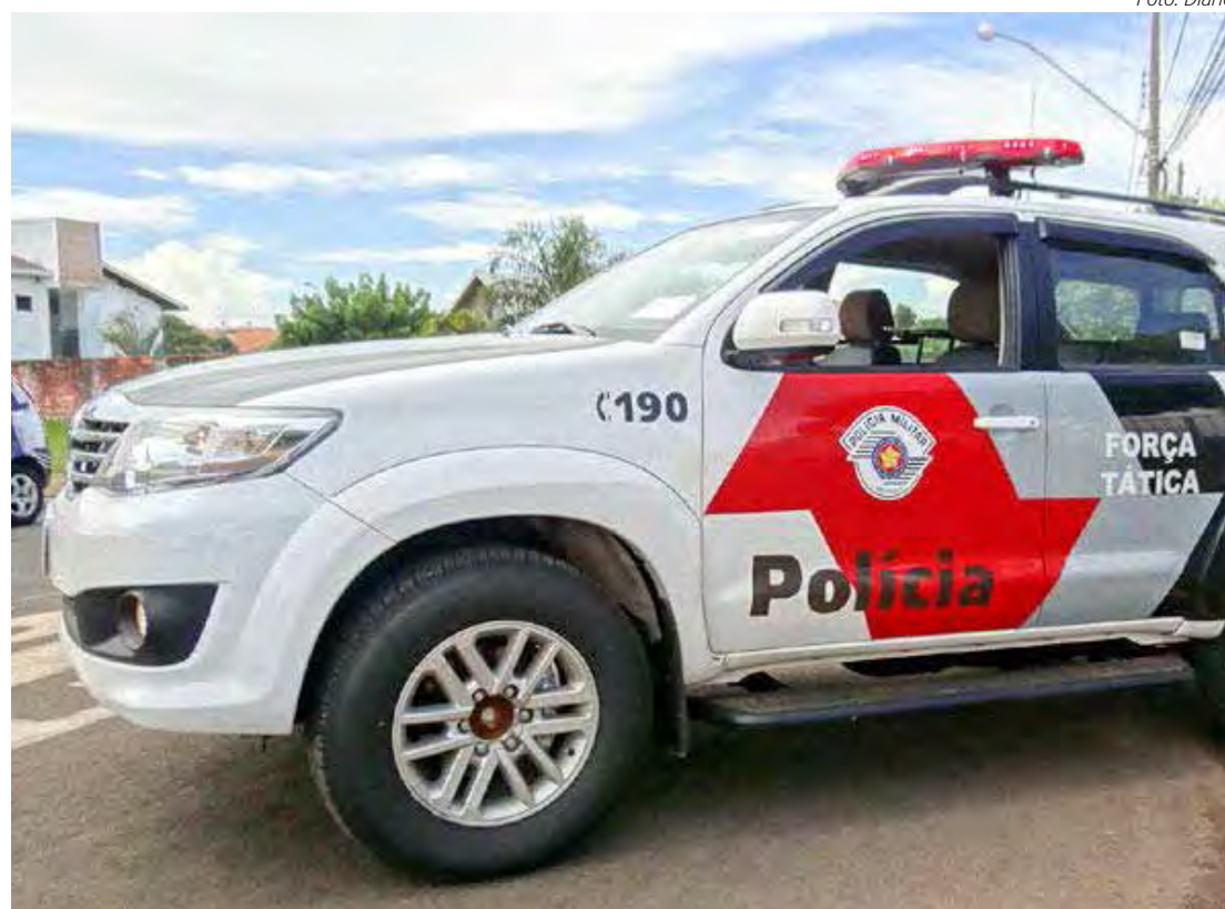
Ocorrência foi registrada pela Polícia Militar

Durante a vistoria, os agentes de segurança identificaram