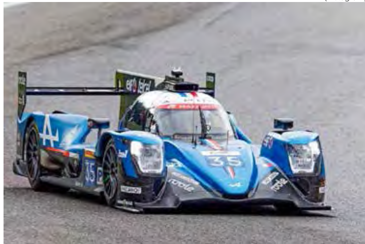
André Negrão espera fazer um bom encerramento de temporada