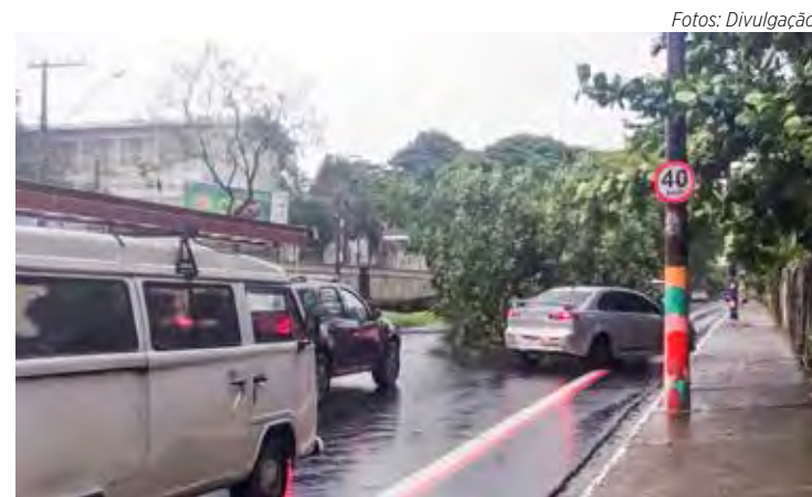
Vento derrubou árvore na Avenida 32 perto do Lago Azul

De acordo com o Ceapla/Unesp, a temperatura em Rio Claro hoje deve variar entre 14° e 27°, com alta probabilidade de chuva. Para garantir a segurança durante a chuva, o Inmet orienta que a população não deve se abrigar embaixo de árvores ou placas metálicas. A dica é ficar embaixo de estruturas seguras como prédios, casas, lojas e esperar a chuva passar.