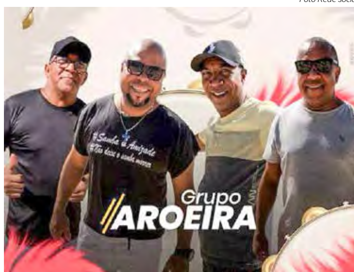
Grupo Aroeira no Point da Lagoa

SHOPPING RIO CLARO – Neste sábado (4), tem Chegada do Papai Noel, do bom velhinho. Para recepção-lo, acontece uma grande festa no estacionamento Sul a partir das 15h. As crianças e suas famílias irão se divertir com a Parada de Natal de personagens temáticos e nos brincos infláveis, enquanto saboreiam pipoca e algodão-doce, que serão distribuídos gratuitamente. A aguardada chegada do Papai Noel será às 19h30, e de uma forma que surpreenderá as crianças. Depois de chegar ao estacionamento, o Noel desfilará pelos corredores do shopping e irá para o seu trono na praça de eventos fazer fotos com as crianças. Os clientes também poderão conhecer a decoração do Natal 2023 do Shopping Rio Claro. A fachada do centro de compras será toda iluminada com luzes de led, na praça de eventos terá o trono do Papai Noel com soldadinho de chumbo e urso gigantes e também escorregadores nas laterais, e na praça de alimentação um trem instagramável cria o ambiente perfeito para as famílias registrarem o período mais