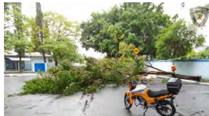
Árvore arrastou fiação elétrica em frente ao Cemitério Municipal