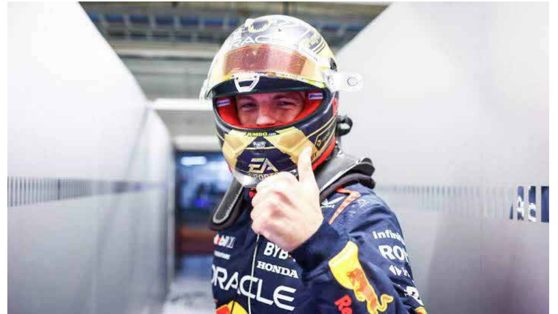
Quali definiu o grid para domingo

Neste sábado, as atividades continuam em Interlagos, com a classificação da sprint às 11 horas e a corrida curta começando às 15:30 horas.