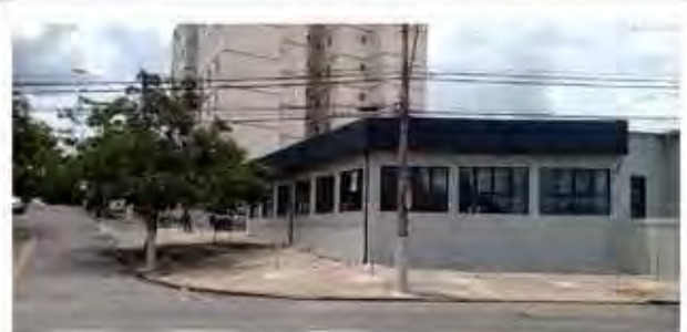
CÓDIGO 7456 - Galpão com 1.318,20m² Taquaral - Campinas/ SP - Valor Venda: R$5.000.000,00