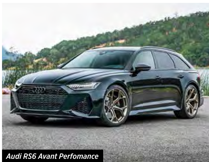
Audi RS6 Avant Performance

Além das cores cinza, azul, branca, prata, vermelha e preta, o cliente pode escolher duas opcionais, que chegam a R$ 85 mil adicionais ao preço do veículo.