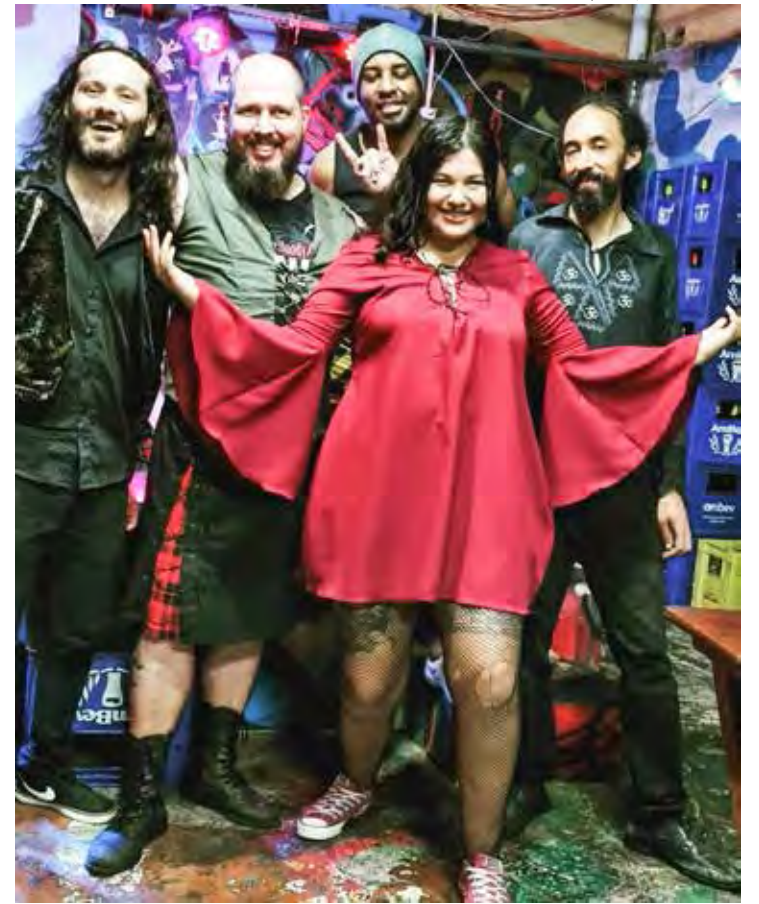
A banda Bloody Mary será uma das atrações musicais do October Fest do Ginástico