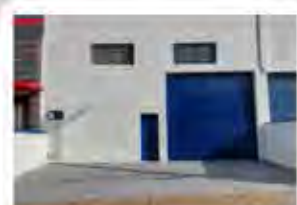
CÓDIGO 9121 Galpão 300,00 M2, contendo recuo para carros, escritório, mezanino, 2 Wc's, cozinha, área de luz. Avenida 14 Nº 2227, Jardim São Paulo - Rio Claro - Valor: R$835.000,00