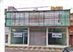
CÓDIGO 7291 Galpão com 370,00m², com 2 escritórios, 2 wc's. Centro - Limeira/SP - Valor Locação: R$16.666,67