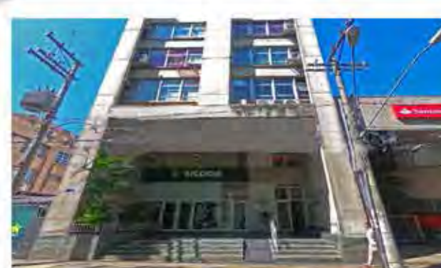
Código 8442 SALA COM APROXIMADAMENTE 82,00M², WC E COZINHA - Centro - Rio Claro - Valor Locação: R$666,67