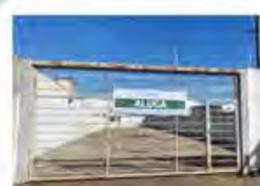
CÓDIGO 7042 Terreno com 749,00m² Consolação - Rio Claro/SP Valor Locação: R$3.111,11