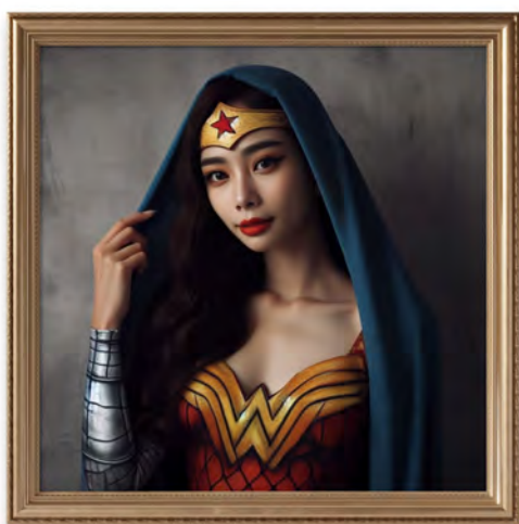
MONALISA WONDER WOMAN