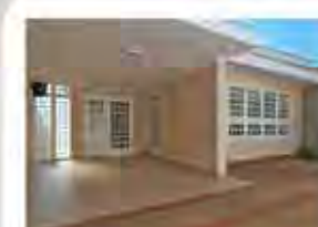
CÓDIGO 9084 Recepção, 5 salas, 3 wc's, cozinha com arm. emb., área externa com churrasq., lavanderia e garagem para 4 carros. Santa Cruz - Rio Claro/SP Valor: R$4.444,44