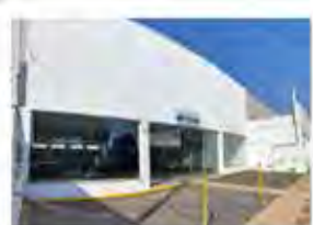
CÓDIGO 6165 RUA 14- Salão com 600,00m², 2 wc's, cozinha, escritório e recuo para carros. Consolação - Rio Claro/SP - Valor Locação: R$22.222,22