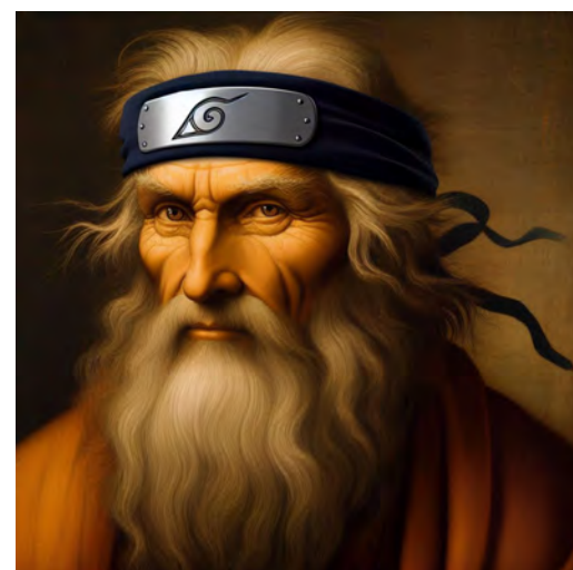
LEONARDO DA VINCI NARUTO SHIPPUDEN

Em um mundo em constante evolução, é fascinante observar como os grandes artistas, pensadores e inventores do passado se encaixariam no cenário atual, permeado por cultura pop e tecnologia geek.