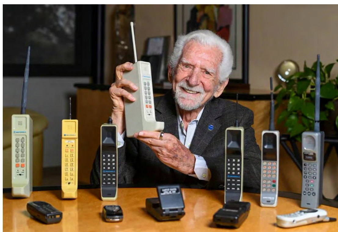
MARTIN COOPER - INVENTOR CELULAR