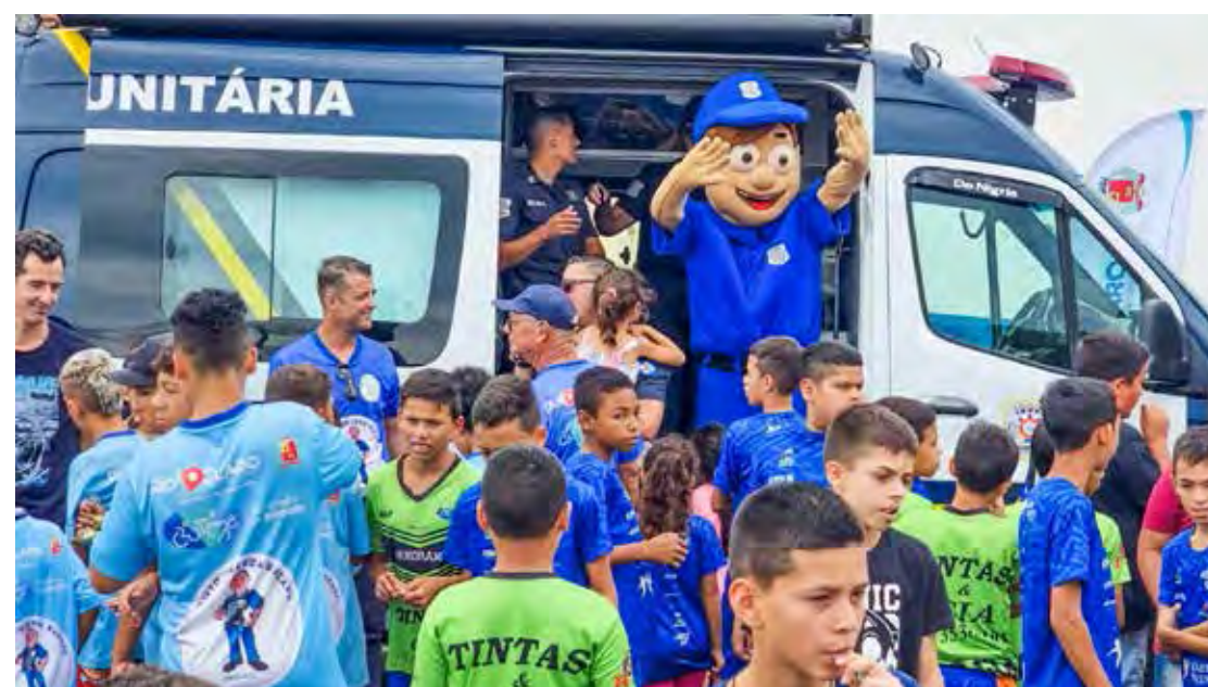
Público se divertiu e conheceu um pouco mais sobre o trabalho da corporação

O homem foi levado ao Plantão Policial onde foi detido e permaneceu à disposição da Justiça.