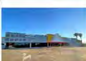
Código 8262 ÁREA TERRENO: 4.269,12 M2 - ÁREA CONSTRUÍDA: 2.513,00 M2 - Centro - Rio Claro - Valor Locação: R$83.333,33