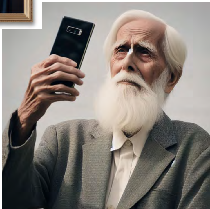
GRAHAM BELL - SELFIE

Santos Dumont, o visionário da aviação, não apenas voaria nos modernos aviões a jato, mas também se tornaria um entusiasta dos drones e das viagens espaciais. Sua paixão por desafios tecnológicos se traduziria em missões espaciais que ecoariam seu pioneirismo no voo.