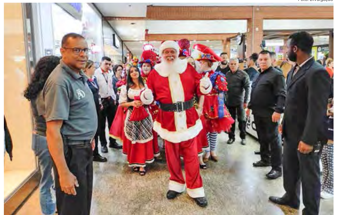
O público poderá receber o Papai Noel no próximo sábado (4) no Shopping Rio Claro