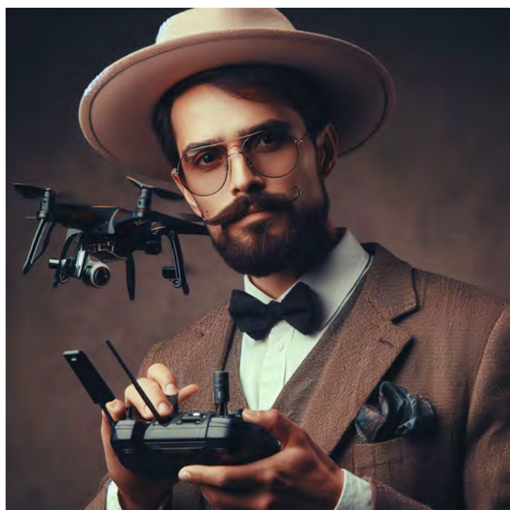
JOVEM SANTOS DUMONT COM DRONE

Em tempo: A Wide World Web que tanto conhecemos, foi criada em 1989, para ser uma "rede" mundial e com utilização comercial. Mas a comunicação entre computadores a longa distância, já é realidade desde 1969. Universidades, bancos, órgãos governamen-