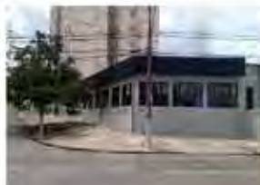
CÓDIGO 7456 Galpão com 1.318,20m² Taquaral - Campinas/ SP - Valor Locação: R$33.333,33