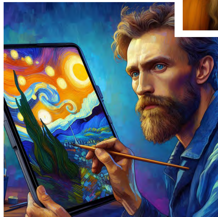
VAN GOGH NO TABLET

cido por suas representações da vida boêmia, estaria imerso na cultura pop, criando ilustrações para quadrinhos e games, expandindo seu legado para o mundo dos cosplayers e fãs ávidos de cultura geek.