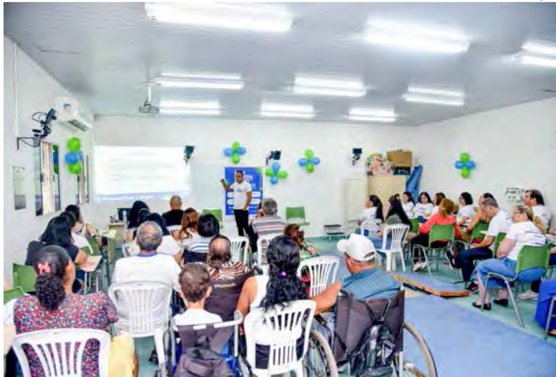
Profissionais de saúde participaram de atividade sobre o tema AVC

20h e Legião Urbana Cover a partir das 22h.