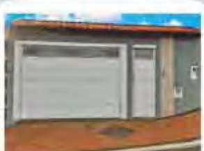
CÓDIGO 8868 Casa, 3 dormitórios, sendo 1 suíte, sala, wc social, cozinha, lavanderia, área de luz e garagem para 2 carros. Ville I - Rio Claro - Valor Venda: R$530.000,00