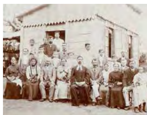
Famílias alemãs em frente à casa de madeira, onde eram realizados os primeiros cultos em alemão