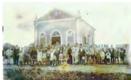
Inauguração do templo em 1928 no Vilarejo de Ferraz