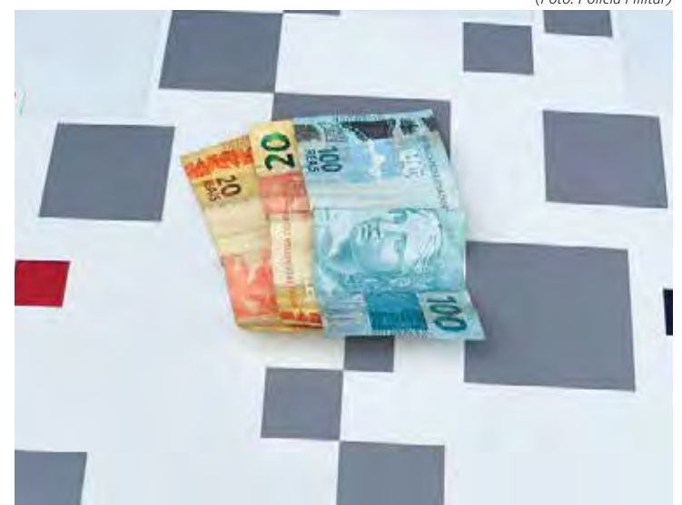
Dinheiro encontrado com a dupla

Os criminosos, que já possuíam diversos antecedentes criminais, foram encaminhados ao Plantão Policial para registro da ocorrência.