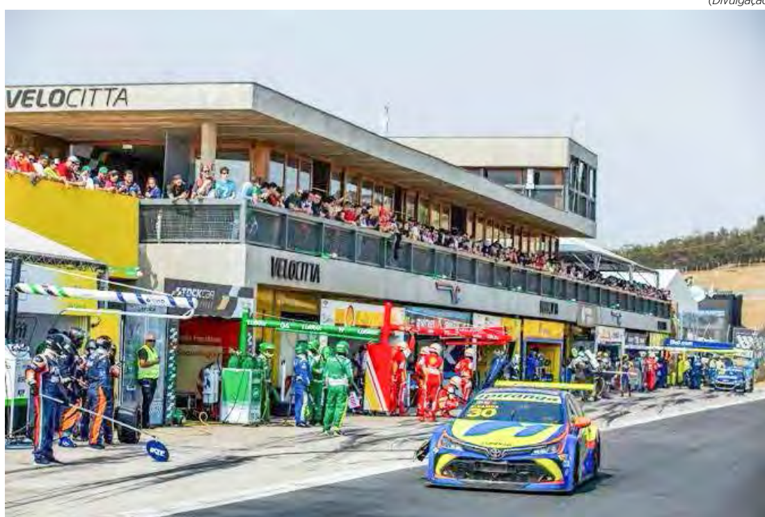
Velocitta recebe cinco corridas neste final de semana