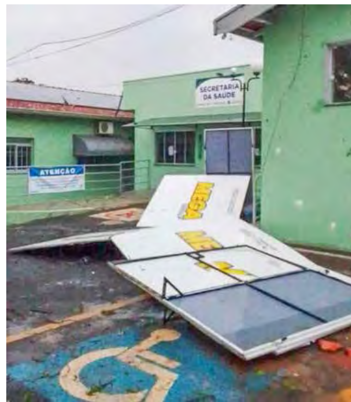
Chuva deixou moradores tensos na pacata cidade turística

Como noticiou o Diário, no dia 4 de outubro, pelo menos seis postes de energia elétrica caíram durante a chuva forte no município. Geradores tiveram que abastecer as casas.