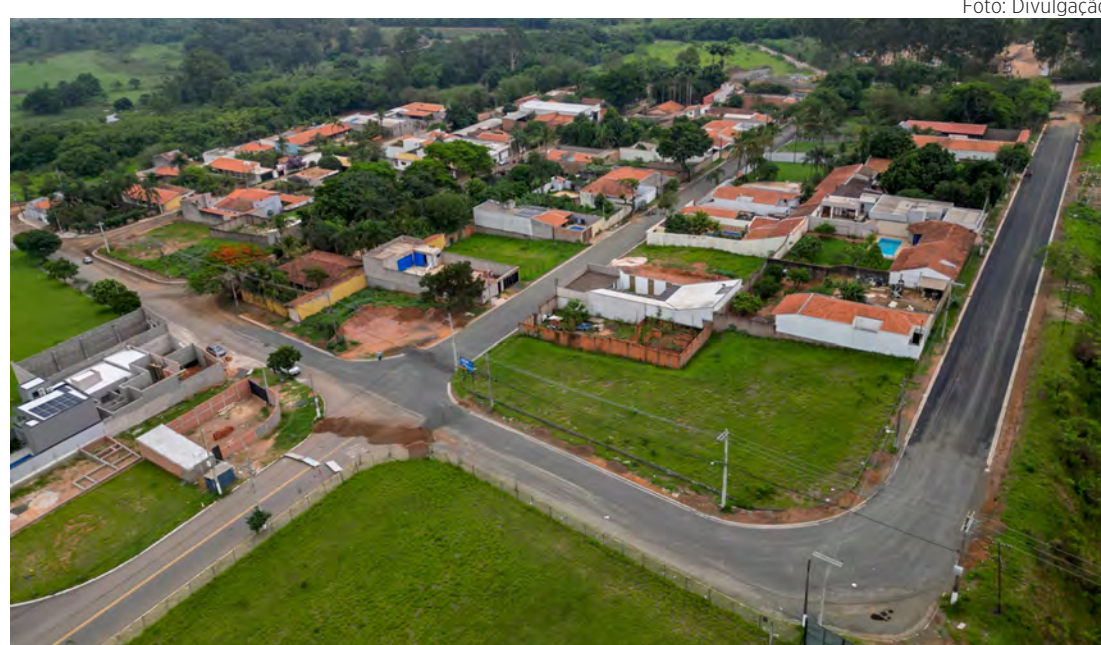
Os bairros Nova Veneza e Maria Cristina vão ganhar pavimentação asfáltica.