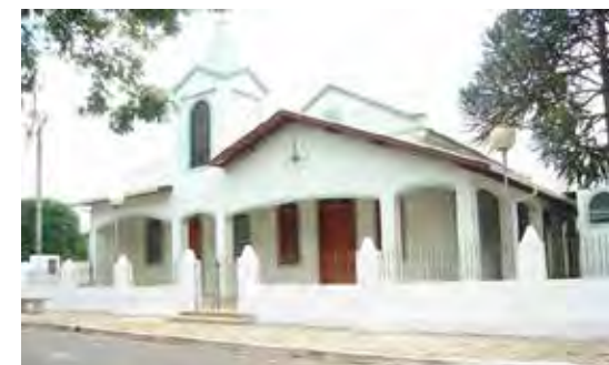
Igreja Luterana de Ferraz nos dias atuais