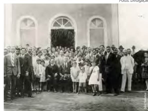
Fundação Igreja Luterana 1928