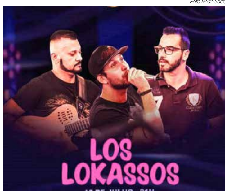
Los Lokassos na Vila do Chopp

PARQUE LAGO AZUL – No domingo (29), a partir das 16h tem "Projeto Quatro e Meia" com a apresentação de duas atrações: Bandas Titansic e Atrito 1.3.7 com as melhores do Pop Rock, no