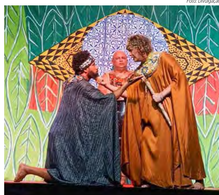
Festival de teatro será realizado neste final de semana na Lagoa Seca