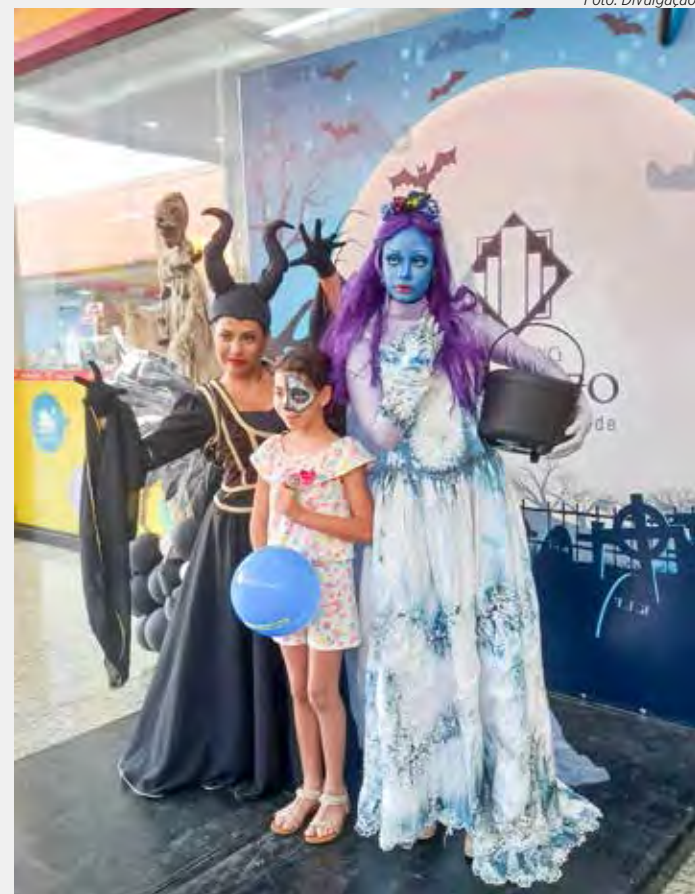
O Halloween no Shopping vai ter oficinas e outras atividades