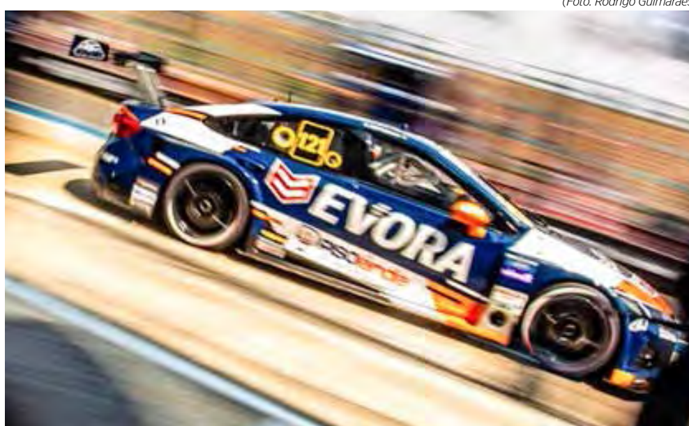
Jovem piloto busca melhorar classificação

Por isso, o jovem acredita que, com a evolução do carro, será possível ter esse resultado e quem sabe lutar por uma vitória neste final de semana. “O nosso carro é bom, tem tudo para encaixar e ter um resultado incrível”, afirma.