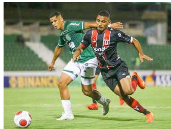
Guarani x Botafogo, às 21h30, em Campinas pelo Brasileirão Série B