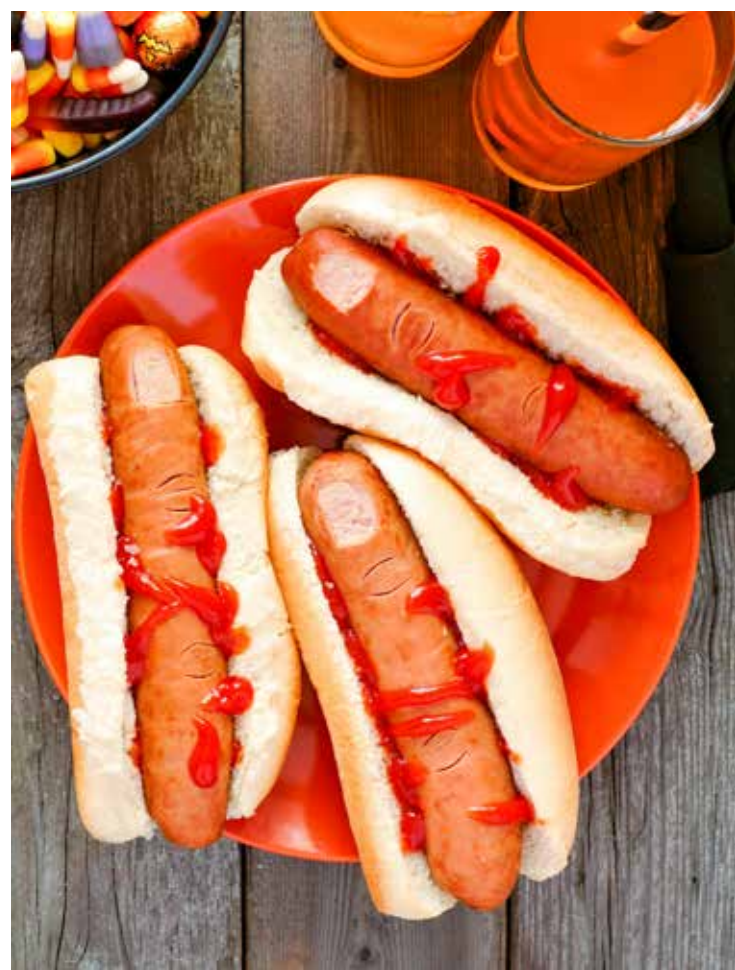
Bloody Hot Dog