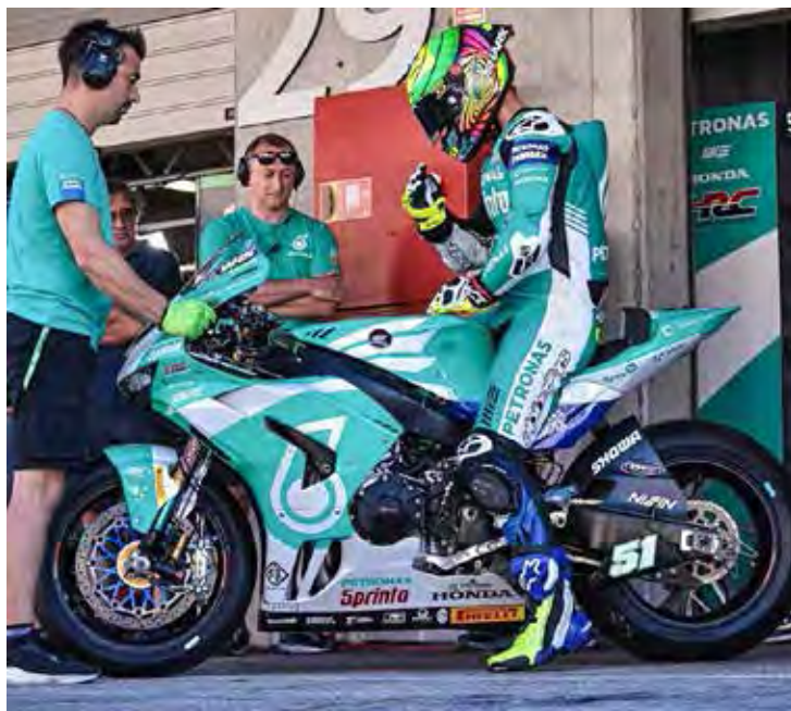
Brasileiro compete com a moto Honda CBR 1000RR-R Fireblade SP

Das 4h às 4h15 – Warm up 6h – Superpole Race 9h – Corrida 2