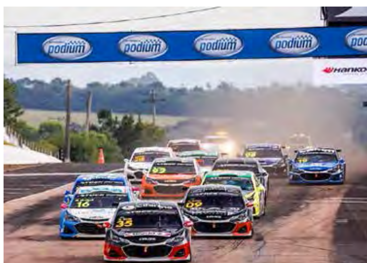
Principal categoria de acesso à Stock Car Pro Series realiza penúltima etapa

No domingo, 29, as provas têm início às 8h30 (corrida 2) e às 9h10 (corrida 3).