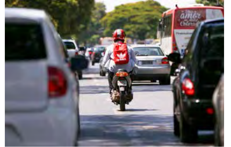
Motoristas podem utilizar o Pix para o pagar o IPVA de seus veículos

Governo de São Paulo passou a aceitar essa modalidade de pagamento na quarta-feira (25), inclusive para o imposto em atraso