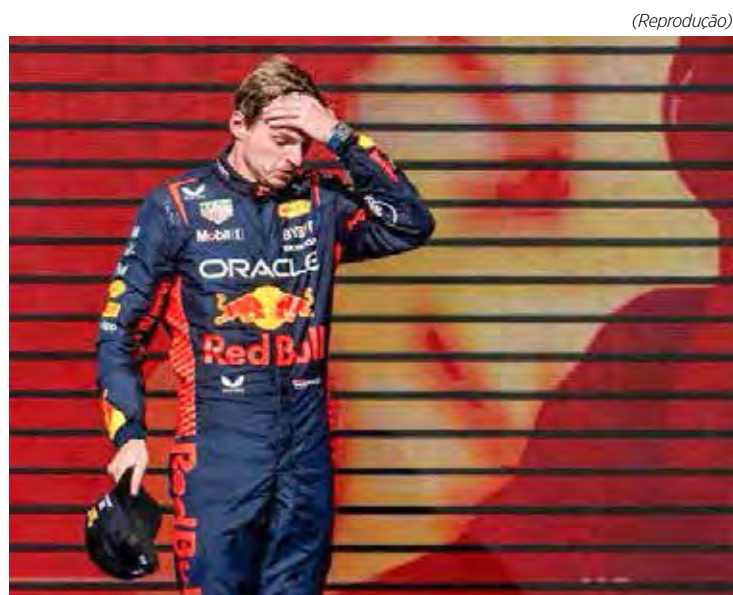
Red Bull quer proteger Max Verstappen, que foi vaiado em Austin

Domingo, 29 de outubro 17h – GP da Cidade do México (Band)