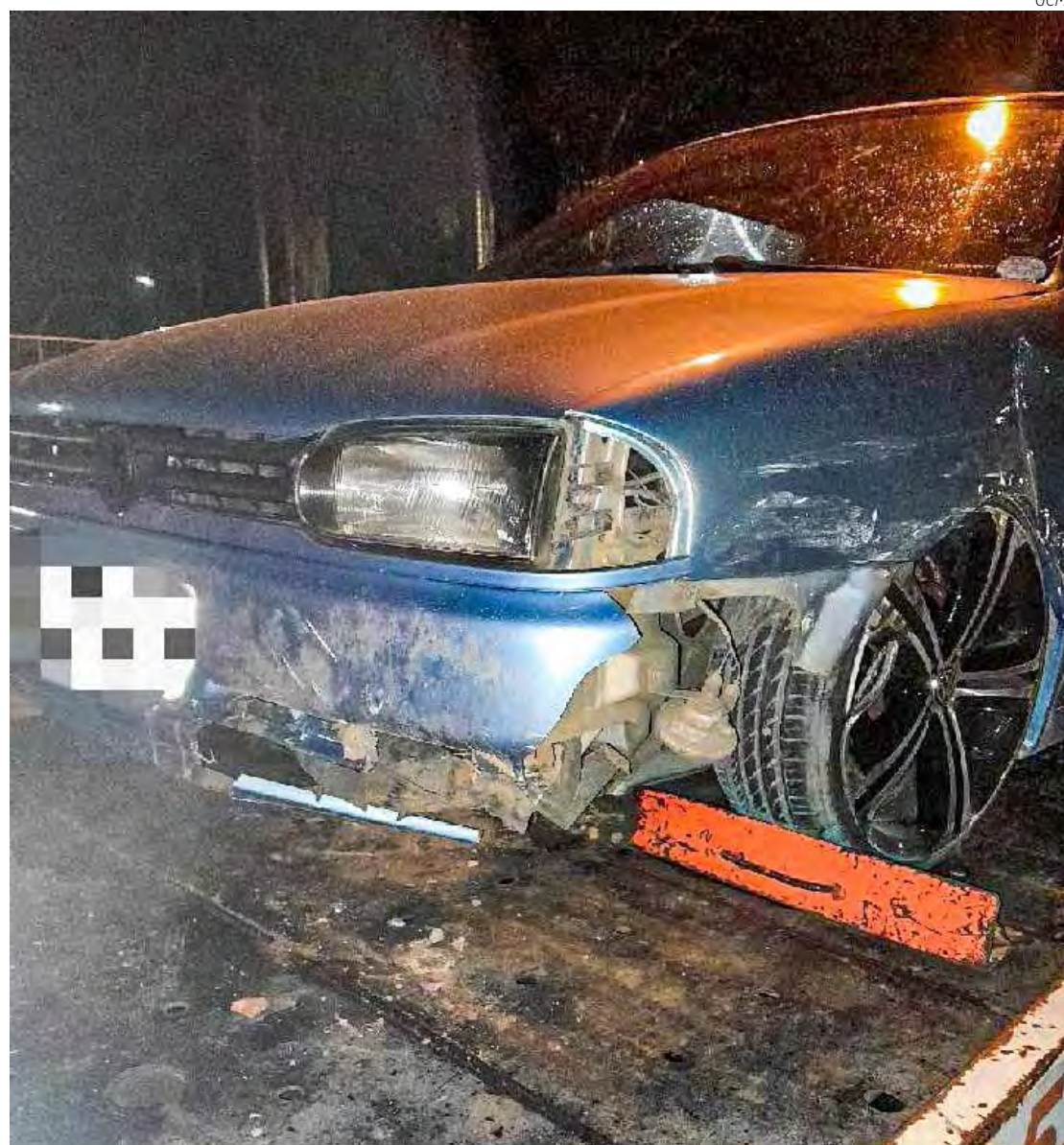
Veículo foi devolvido à proprietária

Diante da situação, iniciou-se um acompanhamento ao veículo, com os sinais sonoros e luminosos ligados, com o intuito de alcançar e abordar o veículo, que continuou em alta velocidade pela rua 6, quando nas proximidades das Avs. M-31 e M-33, veio a colidir com alguns veículos estacionados, o que não impediu que o condutor do veículo continuasse a fuga, tomando rumo a Estrada Velha de Brotas (continuação da rua 6).