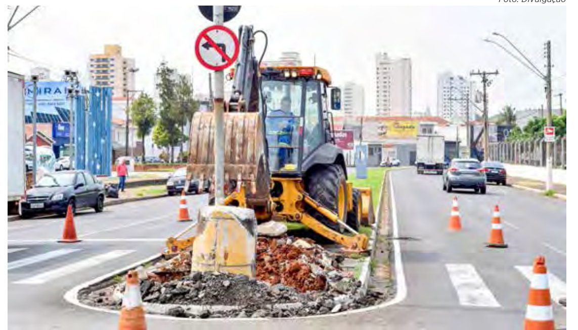
Canteiros centrais estão sendo removidos para implantação de via exclusiva para ciclistas