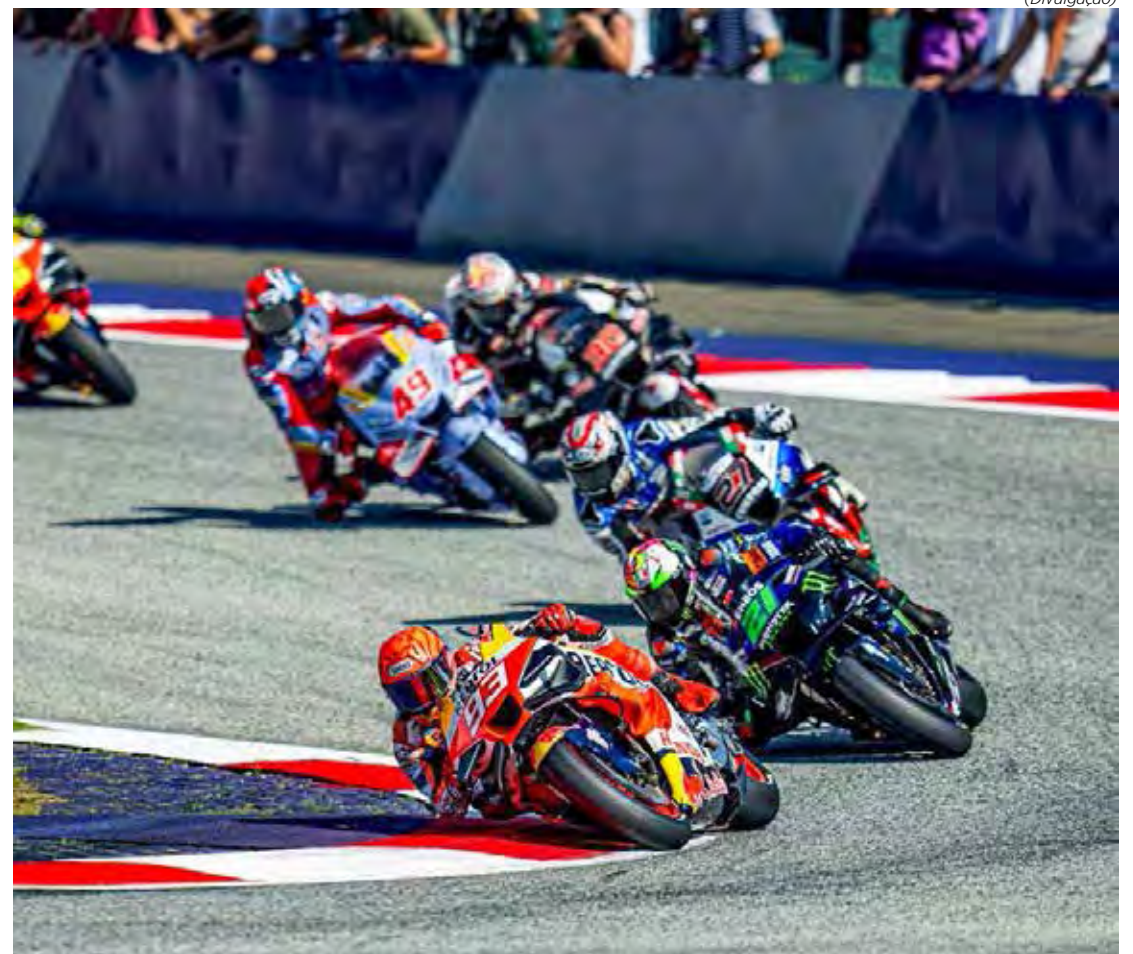
17ª etapa da temporada 2023 acontece neste fim de semana em Buriram