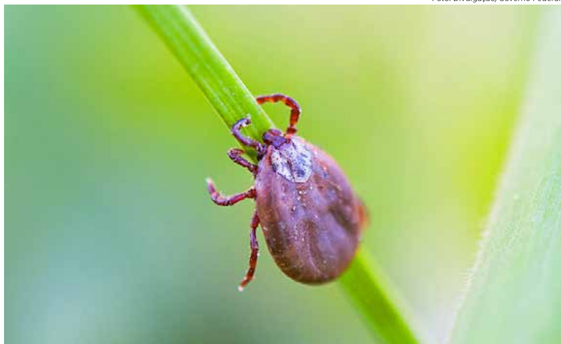
A febre maculosa é transmitida pelo carrapato tipo estrela

Dois dos casos, incluindo o óbito, foram confirmados em agosto. A criança de 7 anos, que contraiu a doença no final de julho, recebeu alta hospitalar na semana passada após mais de dois meses de internação