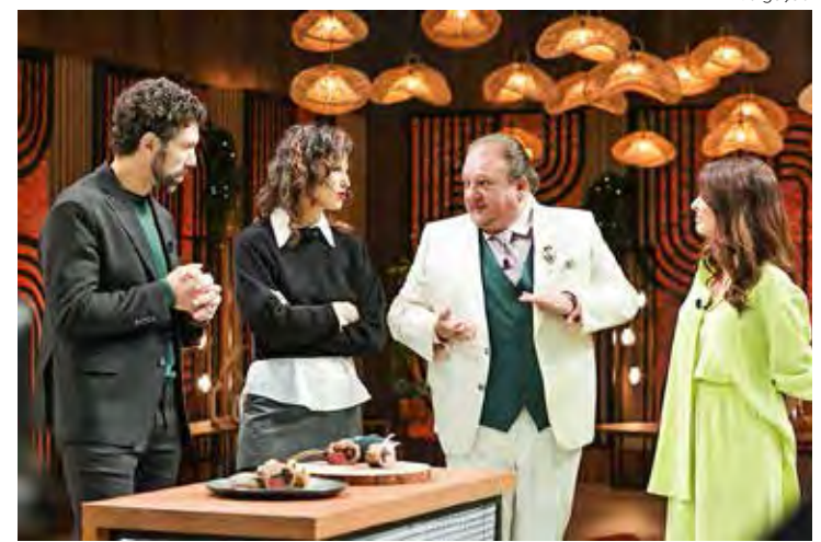
Bastidor do MasterChef Brasil

tes, nada é tão sério assim, que não se resolva no decorrer dos próximos dias.