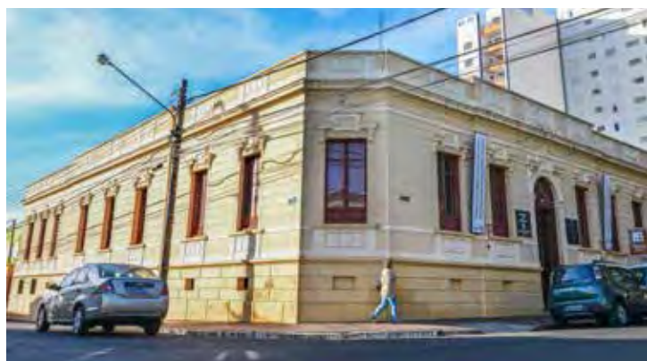
Casarão da Cultura recebe mostra de curtas de cinema do gênero terror

A mostra tem o objetivo de destacar o cinema do gênero terror, em categorias nacional e interiorano, levando e apresentando curtas-metragens, promovendo o entretenimento para rio-clarenses e amantes desse segmento de filmes.