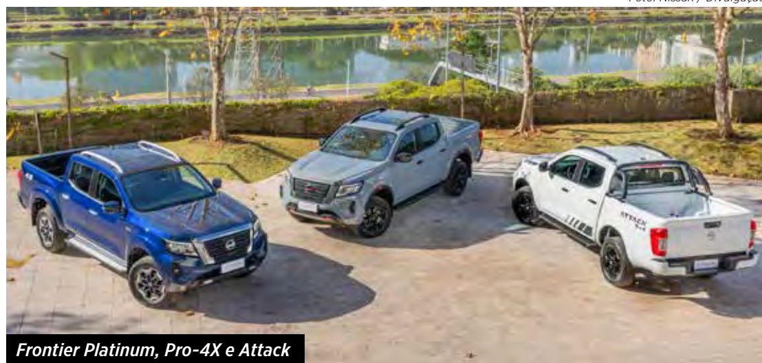
Frontier Platinum, Pro-4X e Attack