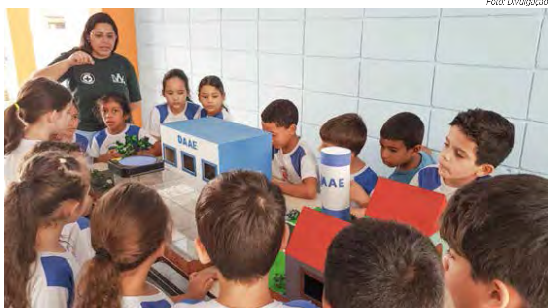
Alunos da escola municipal Hamilton Prado acompanharam atividade educativa da autarquia

Além do anfiteatro, o governo municipal entregou cinco novas escolas e providenciou a reforma de 14 prédios no setor educacional. Em conjunto com a Secretaria Municipal da Educação, o “Daae na Escola” recebe apoio do Consórcio PCJ e tem como objetivo, conscientizar alunos das escolas