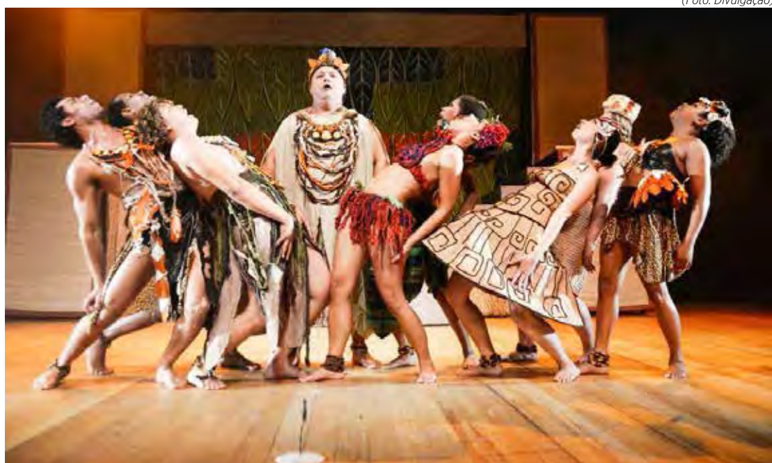
Festival de teatro será realizado nos próximos sábado e domingo na Lagoa Seca