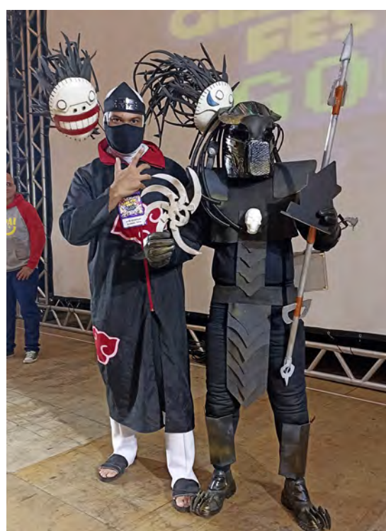
PRIMEIRO LUGAR COSPLAY

Depois de todo o evento ter acontecido, existe o nada menos