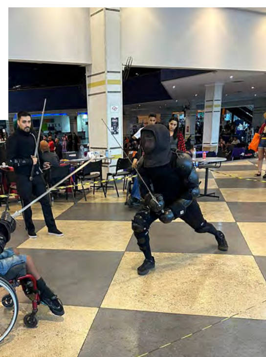
INCLUSÃO ALCATEIA DE PRATA