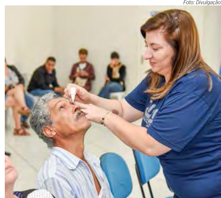
Atendimentos fazem parte do terceiro mutirão de catarata, que totaliza 700 cirurgias