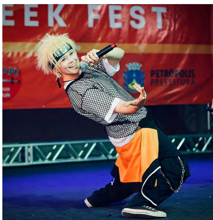
AYU – APRESENTADORA GPF 2023

seja, o “ORGANIZADOR” que irá fazer todos os 3 processos descritos acima, sendo remunerado de alguma forma para isso.