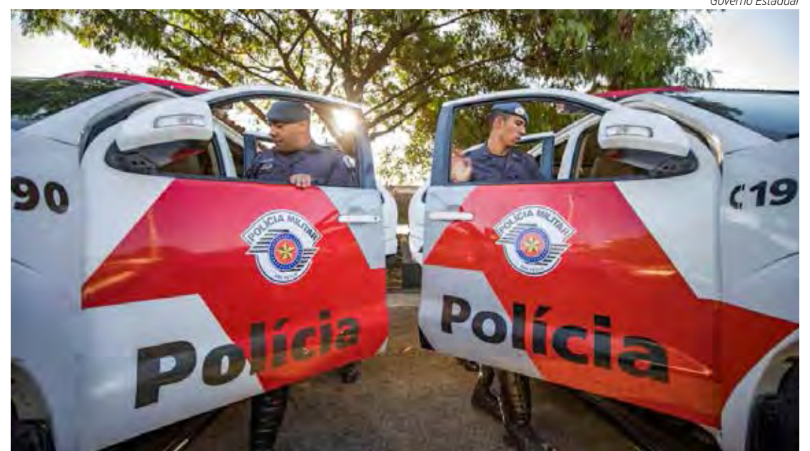
Os presos têm entre 22 e 25 anos e agiram numa agência bancária do Cambuí