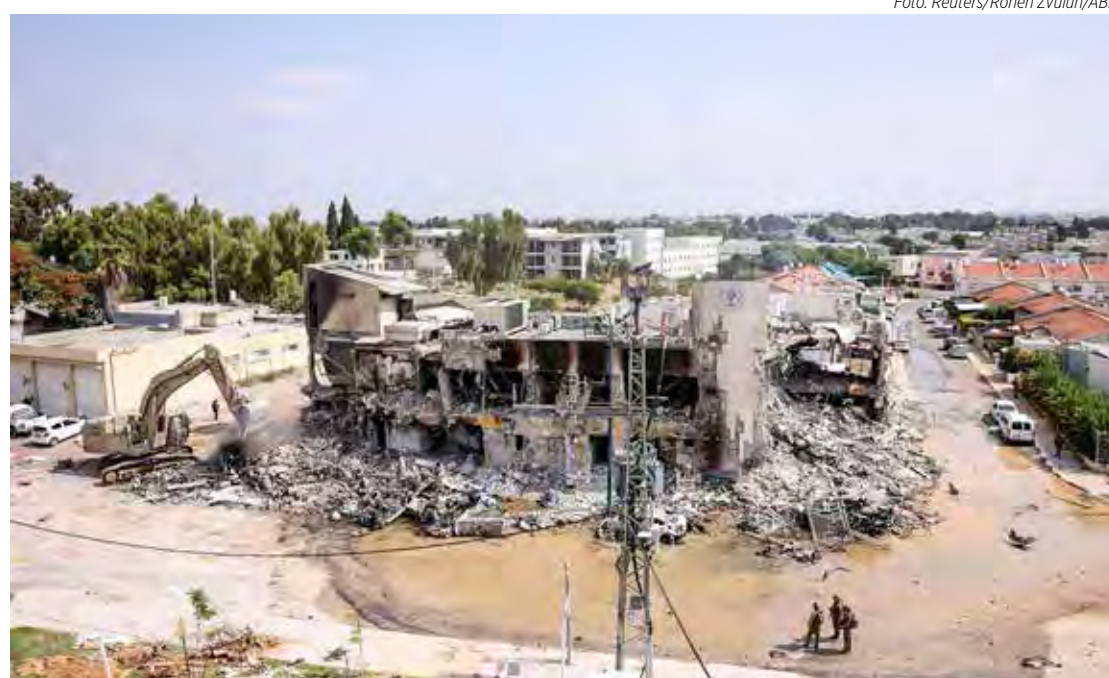
Bombardeios destroem prédios e tiram vidas na zona de conflito

Durante as negociações, o litoral setentrional ficou sob controle dos israelenses e, o meridional, dos palestinos. A região interiorana ao sul da Palestina foi para os israelenses. Por seu caráter histórico e por ser sagrada para árabes, judeus e cristãos, Jerusalém iria se tornar uma cidade