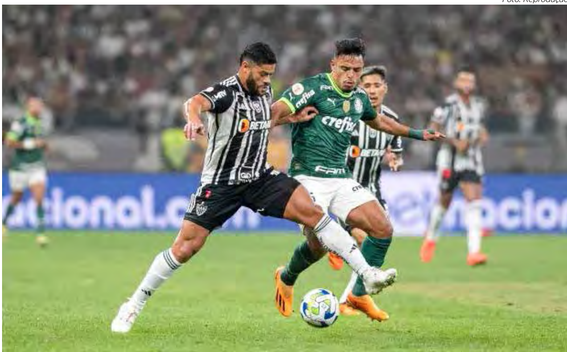
Palmeiras x Atlético MG jogam às 19h