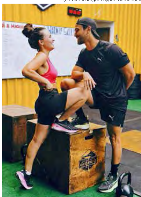
Larissa Manoela e André Luiz Frambach