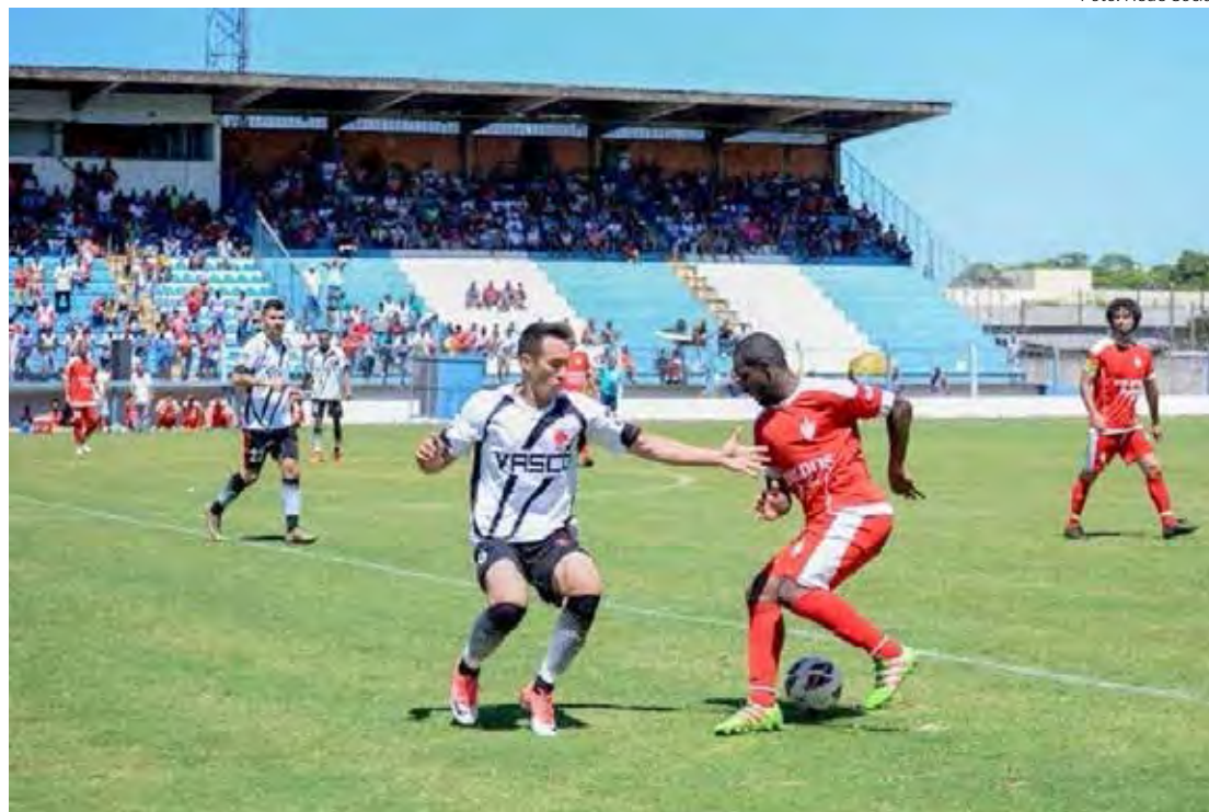
Vasco da Gama e Boa Vista e mais 6 equipes estão na luta pelo título do Amadorzão 23