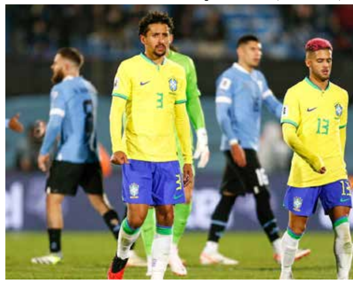
Brasil e Uruguai

• E para piorar, essa foi a primeira vez em 40 anos que o time uruguaio venceu a seleção brasileira por dois ou mais gols de diferença. A atuação da seleção na partida foi desastrosa, não há explicação que justifique. O técnico Fernando Diniz terá muito o que fazer para mudar essa história contra a Colômbia no mês que vem. Mas até lá muito água pode rolar sob a ponte. Já tem gente pedindo a vinda imediata do técnico titular, Carlo Ancelotti, previsto para assumir a 'Amarelinha' em 2024. Será que aguentamos até lá? Será que vendo tudo isso, situação e condição do Neymar e outros jogadores, ele virá?