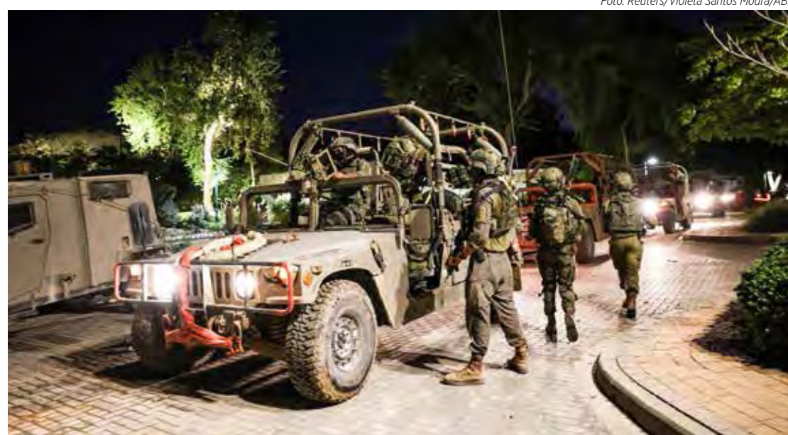
Israel está concentrando tropas e equipamentos militares perto da Faixa de Gaza

Por isso, a Autoridade Palestina não alcança Gaza. Outro território palestino, a Cisjordânia, está sob o controle do partido Fatah, com regiões ocupadas por colonos israelenses e controle militar do governo de Israel.