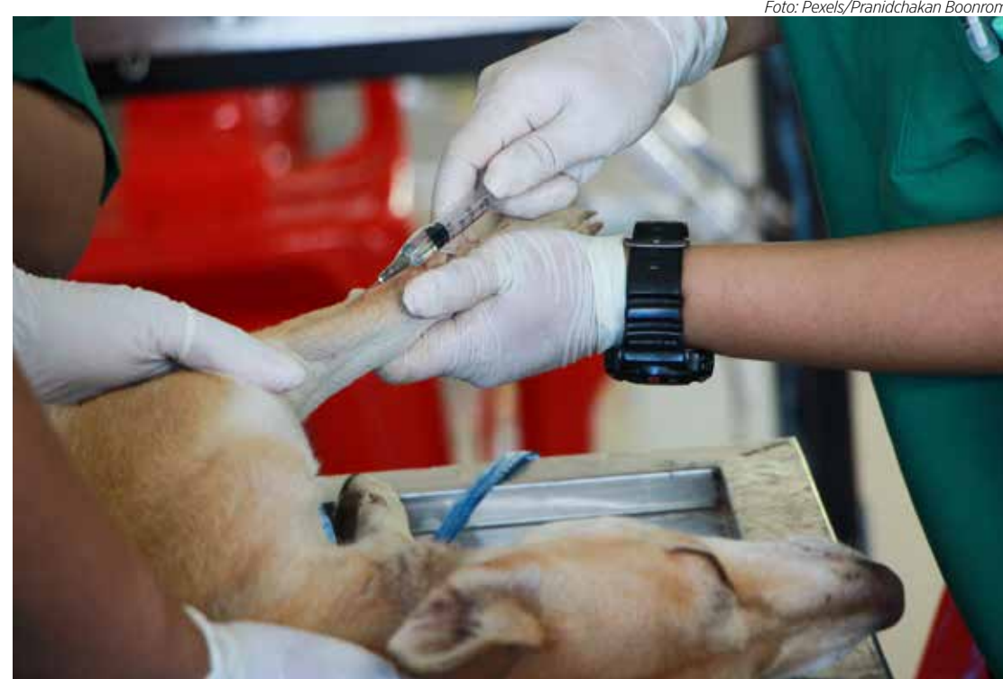
A doação de sangue é mais comum em cães e menos em gatos, sendo mais rara em outros tipos de animais