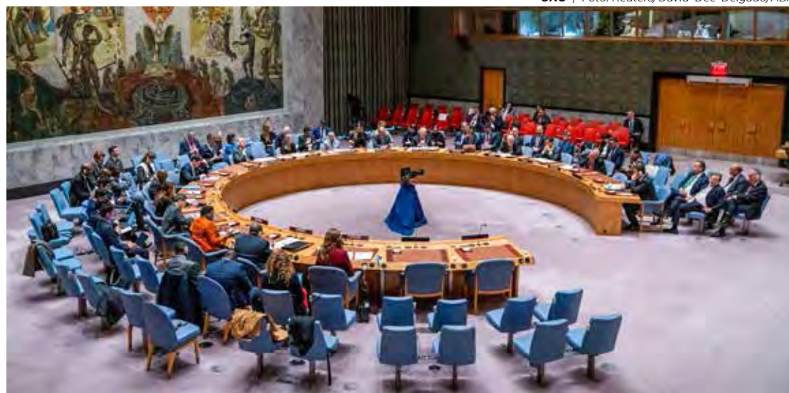
ONU | Foto: Reuters/David 'Dee' Delgado/ABR

• Não foi dessa vez. O Brasil teve sua proposta sobre a guerra no Oriente Médio rejeitada pelo Conselho de Segurança da ONU. O conflito envolve Israel e o grupo extremista palestino Hamas, que controla a Faixa de Gaza. O governo brasileiro solicitou pausas humanitárias aos ataques para permitir o acesso de ajuda à Faixa de Gaza. O voto contrário dos Estados Unidos teve papel preponderante na rejeição da proposta, visto que o país é membro permanente do conselho.