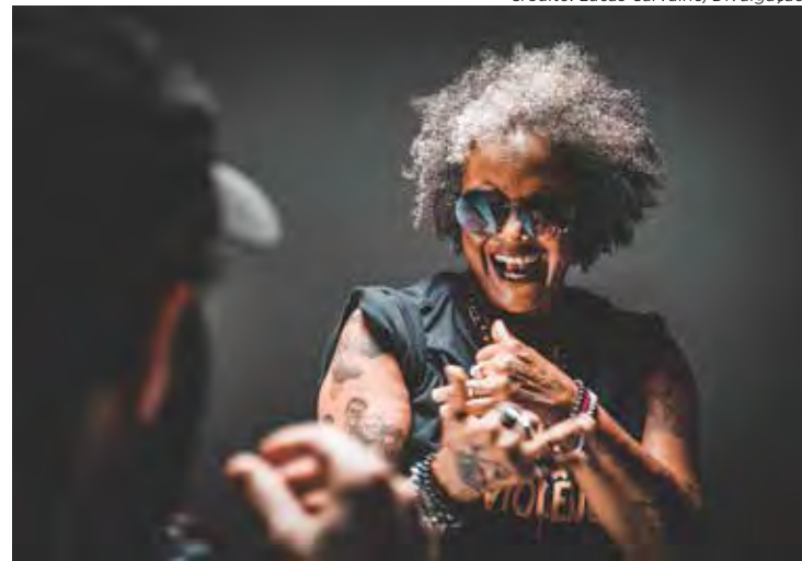
Em Rio Claro, Sandra de Sá promete apresentar diversos ritmos, além de clássicos do seu repertório