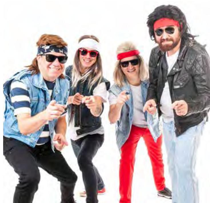
A banda Playmohits 80 fará show no Shopping Rio Claro nesta quinta-feira, dia 19