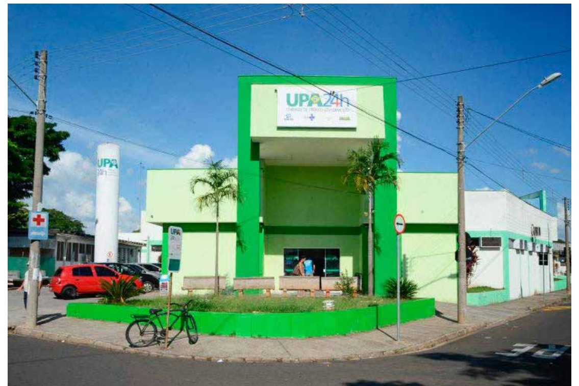
Ele buscou socorro na UPA da 29 com ferimento à bala

Segundo o registro policial, enquanto os agentes faziam o registro da ocorrência, sendo que o suspeito não mais estava no