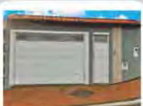
CÓDIGO 8868 - Casa, 3 DORMITÓRIOS, SENDO 1 SUÍTE, SALA, WC SOCIAL, COZINHA, LAVANDERIA, ÁREA DE LUZ E GARAGEM PARA 2 CARROS. Ville I - Rio Claro - Valor Venda: R$530.000,00