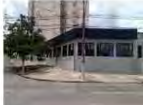
CÓDIGO: 7456 - Galpão com 1.318,20m² Taquaral- Campinas/ SP - Valor Locação: R$33.333,33