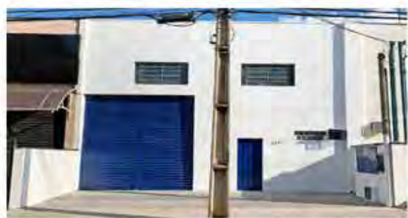
CÓDIGO 9122 - Galpão 300,00 M2, contendo recuo para carros, 2 Wc's, cozinha, área de luz. Avenida 14 Nº 2237, Jardim São Paulo - Rio Claro - Valor: R$5835.000,00