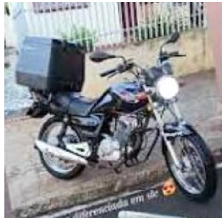
A moto que teria sido atingida durante o acidente