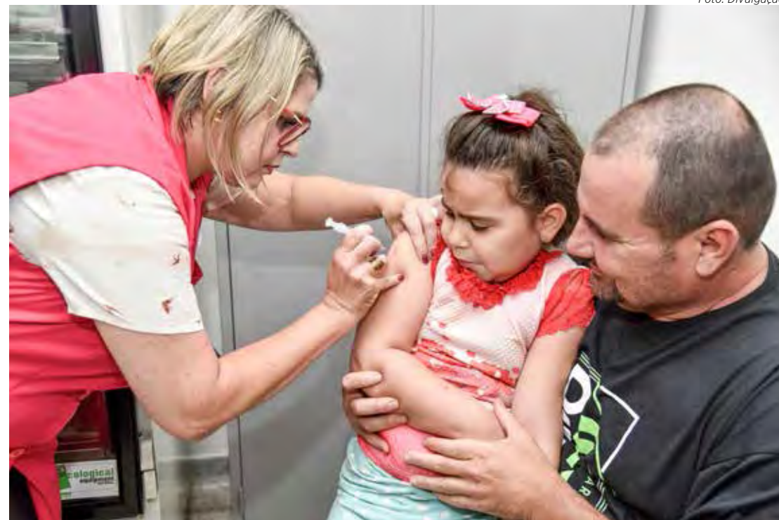
Desde o início da campanha, 2.228 crianças e adolescentes se vacinaram em Rio Claro.