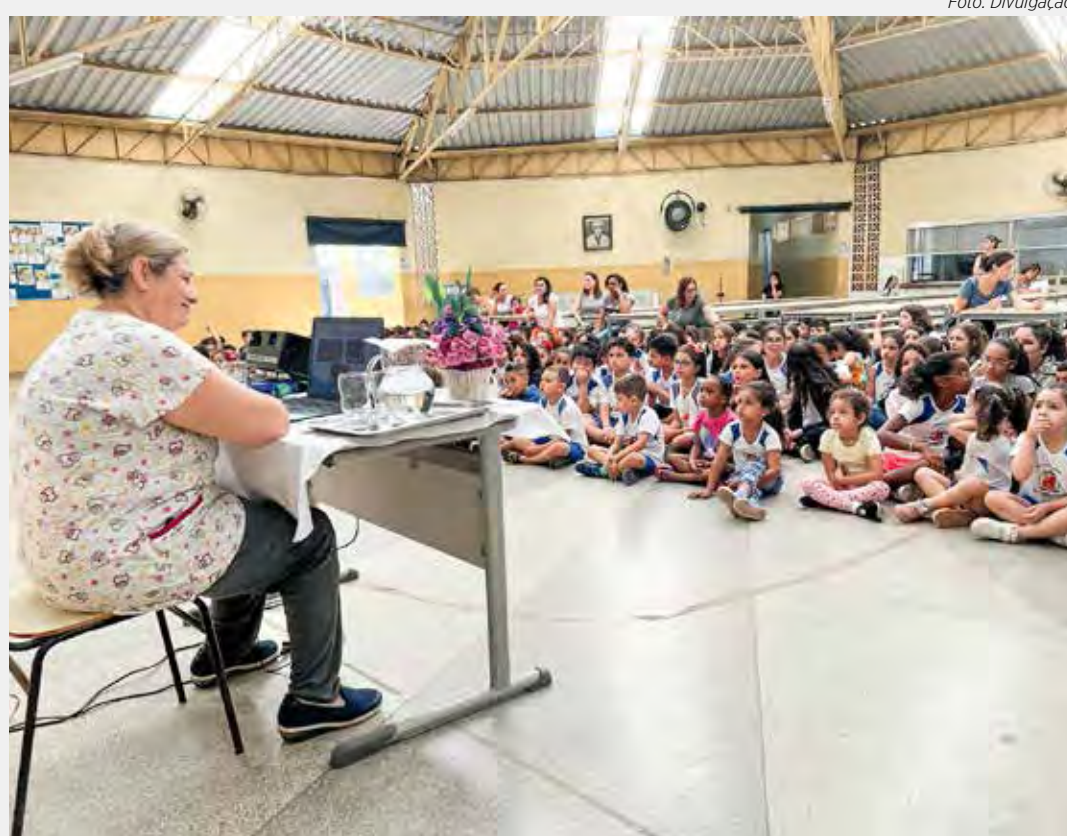
Dentista da UBS Cervezão esteve na escola nesta segunda-feira (16) orientando as crianças

Em iniciativa da Fundação Municipal de Saúde, dentista que atua na UBS passou orientações às crianças a respeito de hábitos importantes para a higiene bucal. O trabalho foi realizado com alunos do período da manhã e também da tarde. A expectativa é que essa ação seja periódica. Os pais estão sendo orientados por bilhete e, caso haja necessidade, devem agendar consulta odontológica na unidade de saúde.