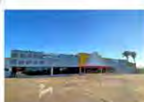
Código 8262 - ÁREA TERRENO: 4.269,12 M2 - ÁREA CONSTRUIDA: 2.513,00 M2 - Centro- Rio Claro - Valor Locação: R$83.333,33