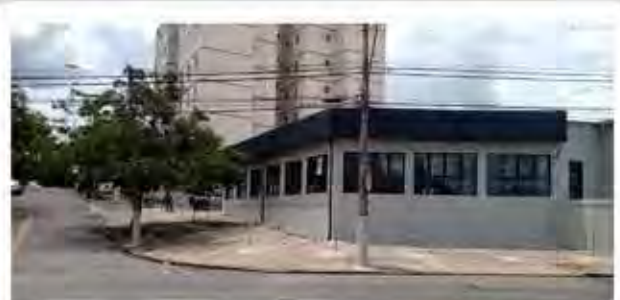
CÓDIGO: 7456 - Galpão com 1.318,20m² Taquaral- Campinas/ SP - Valor Venda: R$5.000.000,00