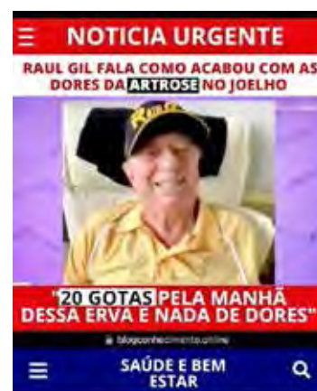
Imagem de Raul Gil em anúncio da internet