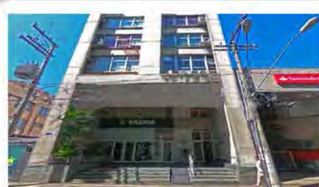
Código 8442 - SALA COM APROXIMADAMENTE 82,00M², WC E COZINHA - Centro- Rio Claro - Valor Locação: R$666,67