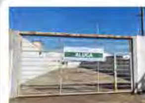
CÓDIGO 7042 - Terreno com 749,00m² Consolação- Rio Claro/SP Valor Locação: R$3.111,11