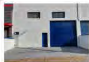
CÓDIGO 9121 - Galpão 300,00 M2, contendo recuo para carros, escritório, mezanino, 2 Wc's, cozinha, área de luz. Avenida 14 Nº 2227, Jardim São Paulo - Rio Claro - Valor: R$5835.000,00