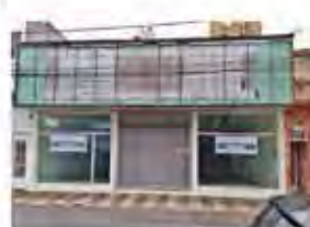
CÓDIGO: 7291 - Galpão com 370,00m², com 2 escritórios, 2 wc's. Centro- Limeira/SP - Valor Locação: R$16.666,67