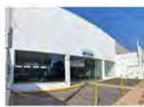
CÓDIGO: 6165 - RUA 14- Salão com 600,00m², 2 wc's, cozinha, escritório e recuo para carros. Consolação- Rio Claro/SP - Valor Locação: R$22.222,22