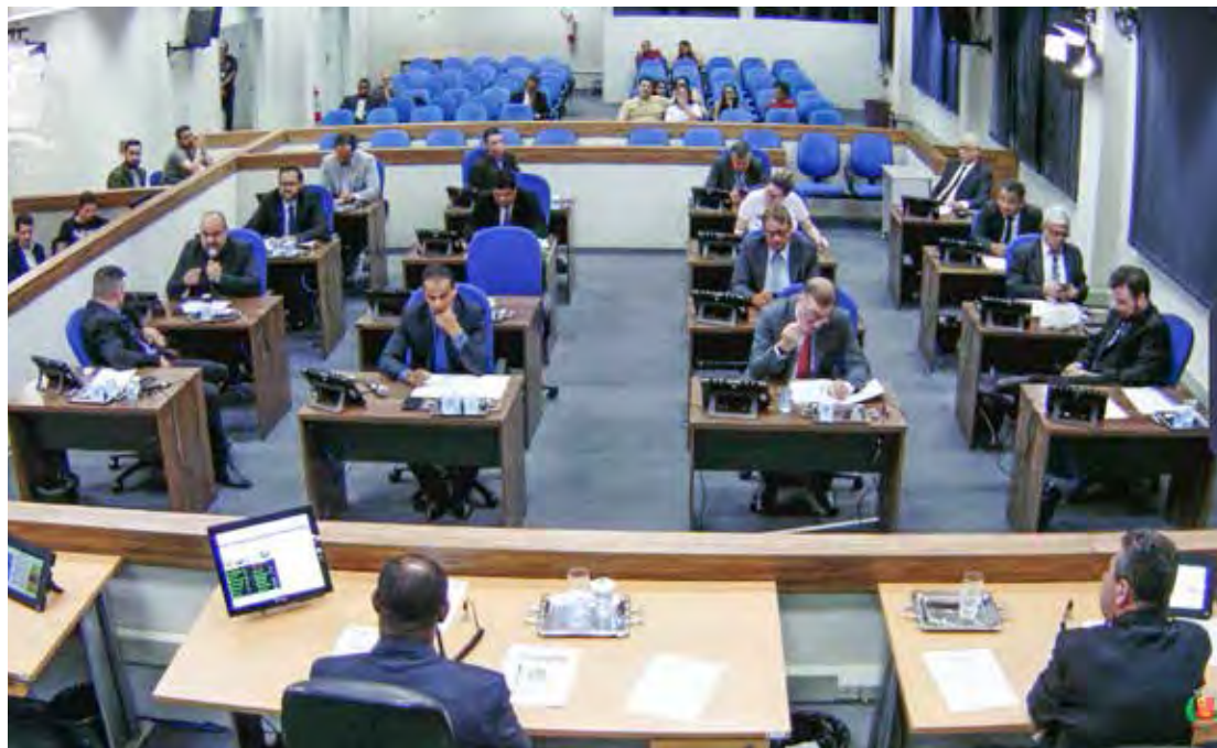
Vereadores aprovaram 10 projetos na sessão ordinária desta segunda-feira, dia 16 de outubro

A aprovação da proposta era muito aguardada pelos profissionais. Neste ano, os trabalhadores receberão nove parcelas de forma retroativa a maio de 2023, incluindo o 13º salário. O reajuste desses profissionais da saúde está previsto na Lei 14.434/2022, que estabelece piso nacional de R$ 4.750 para enfermeiros, de R$ 3.325 para técnicos de