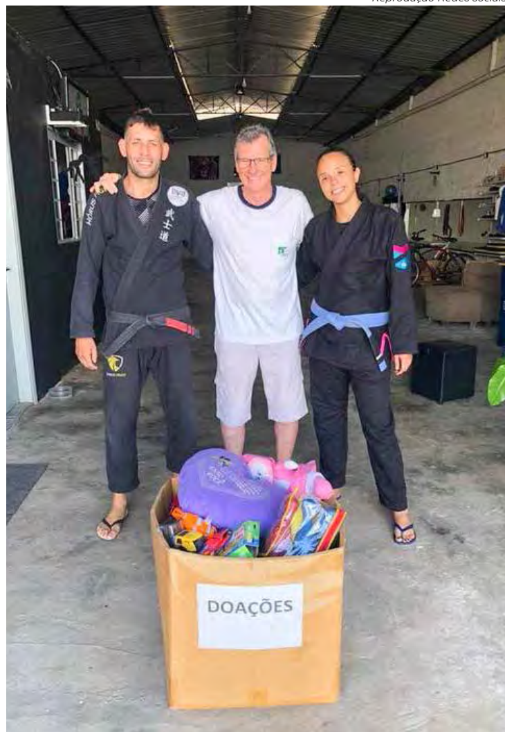
Os brinquedos foram entregues aos responsáveis pela entidade beneficente