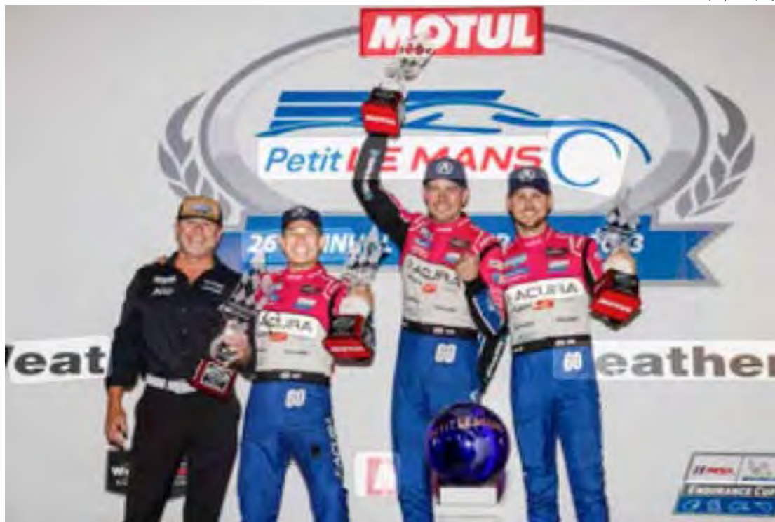
Colin Braun, Tom Blomqvist e Helio Castroneves foram os vitoriosos, a bordo do Acura ARX-06 LMDh da Meyer Shank Racing