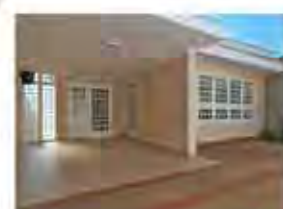
CÓDIGO 9084 - Recepção, 5 salas, 3 wc's, cozinha com arm. emb., área externa com churrasq., lavanderia e garagem para 4 carros. Santa Cruz- Rio Claro/SP Valor: R$4.444,44