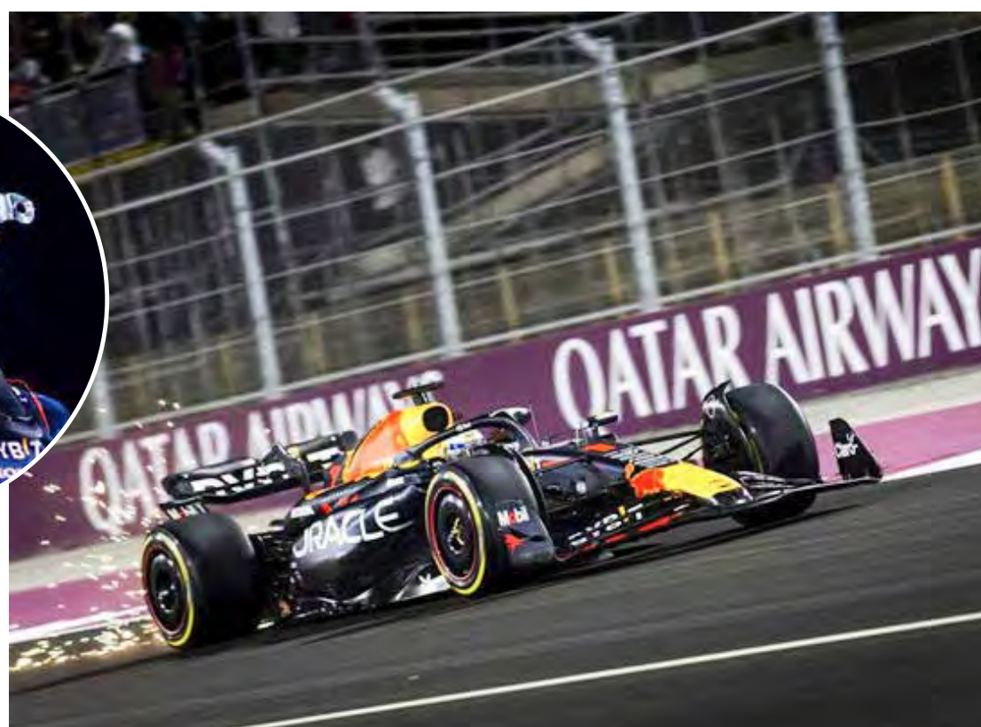
Holandês faturou neste sábado seu terceiro título mundial