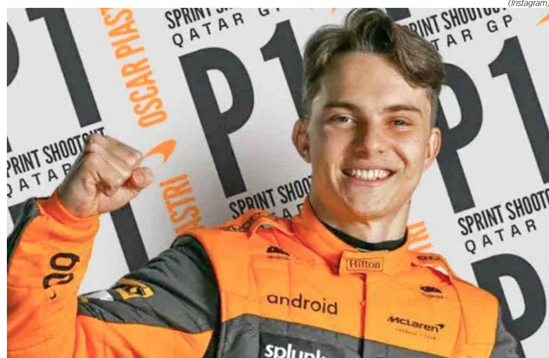
Oscar Piastri, largou da pole position, passou por George Russell e venceu uma sprint pela primeira vez