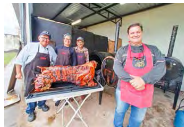
JTA Festas de Piracicaba se encarregou dos cuidados com os porcos.