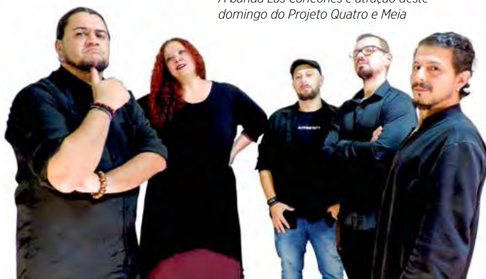
A banda Los Corleones é atração deste domingo do Projeto Quatro e Meia

O Projeto Quatro e Meia é organizado pela prefeitura de Rio Claro, por intermédio da Secretaria Municipal de Cultura, e realizado próximo ao mirante do Lago Azul. Não há cobrança de ingressos.