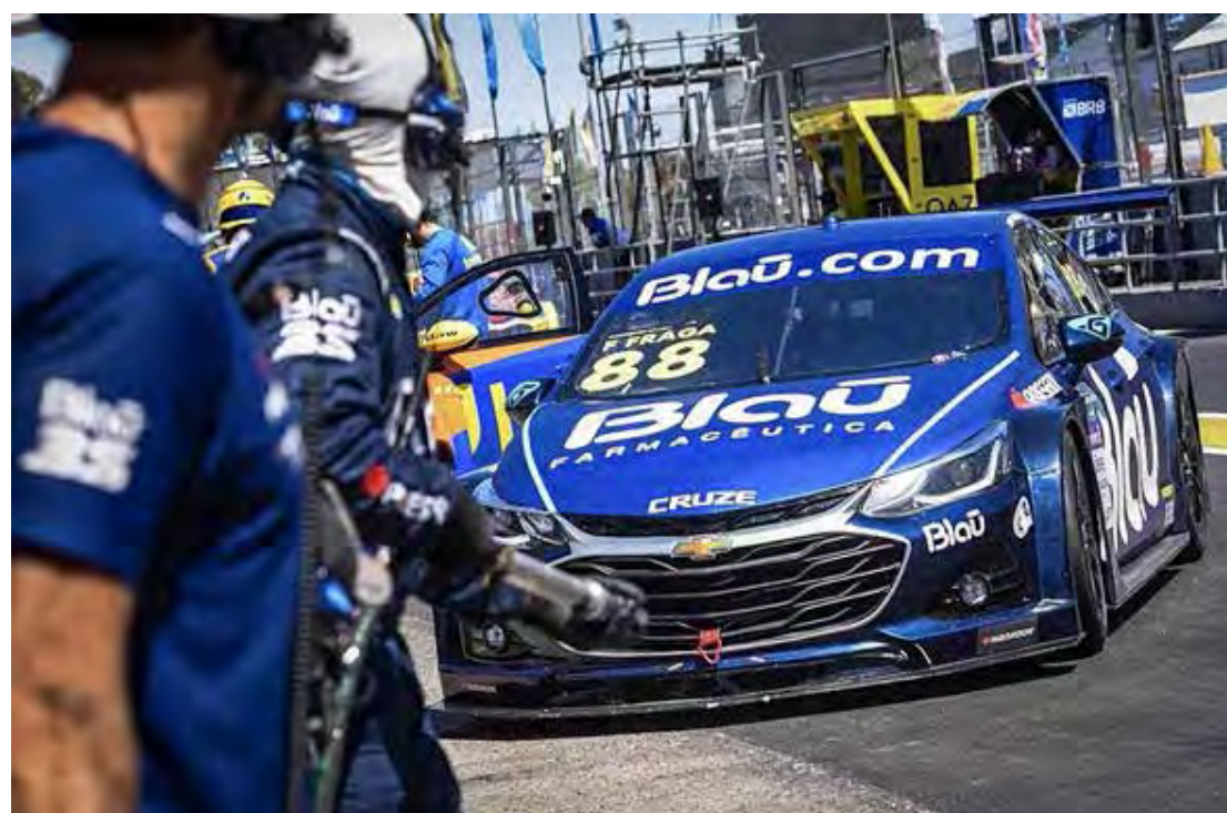
A Stock Car Pro Series volta à pista em Buenos Aires neste domingo para as corridas da nona etapa, com Fraga na pole

A rodada dupla acontece neste domingo (8), com a corrida 1 às 10h45 e a segunda prova na sequência, às 11h25 (ambas no horário de Brasília) e transmissão da Band.