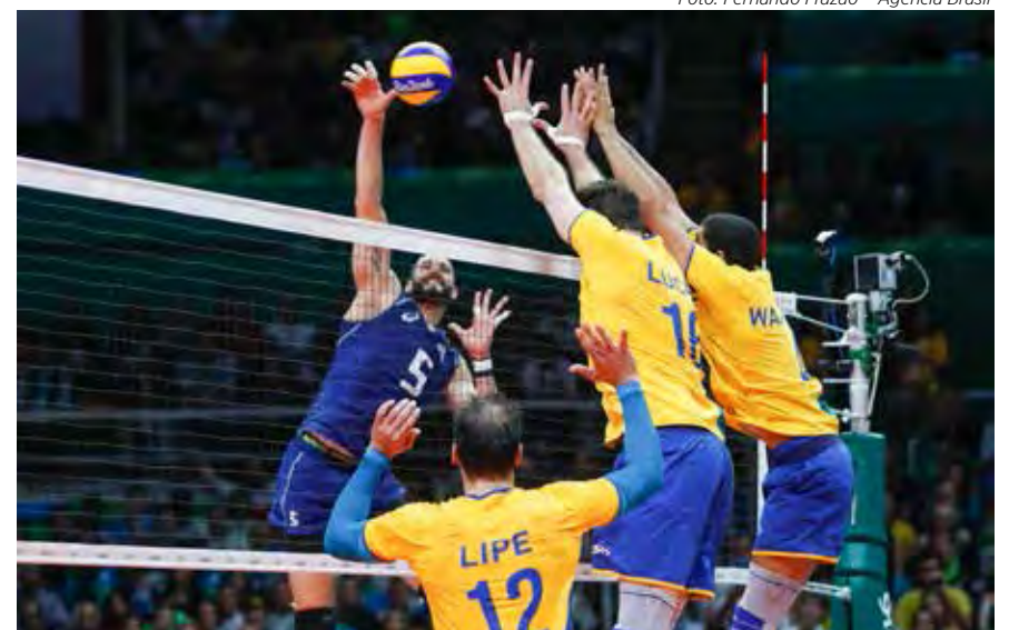
Brasil e Itália já fizeram final olímpica, com vitória do Brasil na Rio 2016

TORRE ÚNICA APARTAMENTOS DE 1 OU 2 SUÍTES COM LAVABO E VARANDA