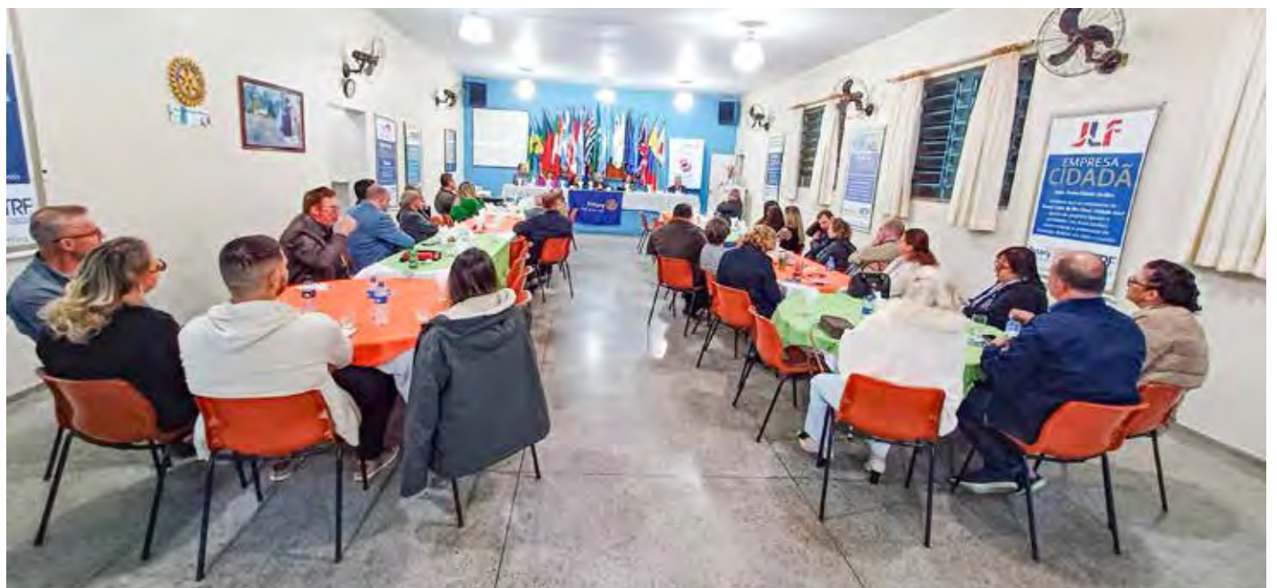
Visão geral da reunião do Rotary Club Rio Claro, o pioneiro em nossa cidade