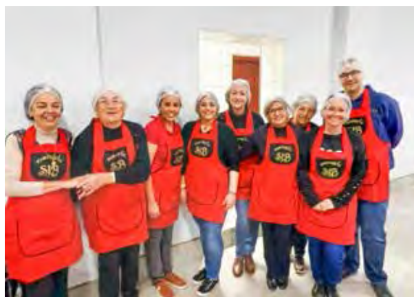
Grande equipe em dedicação total nessa tarde