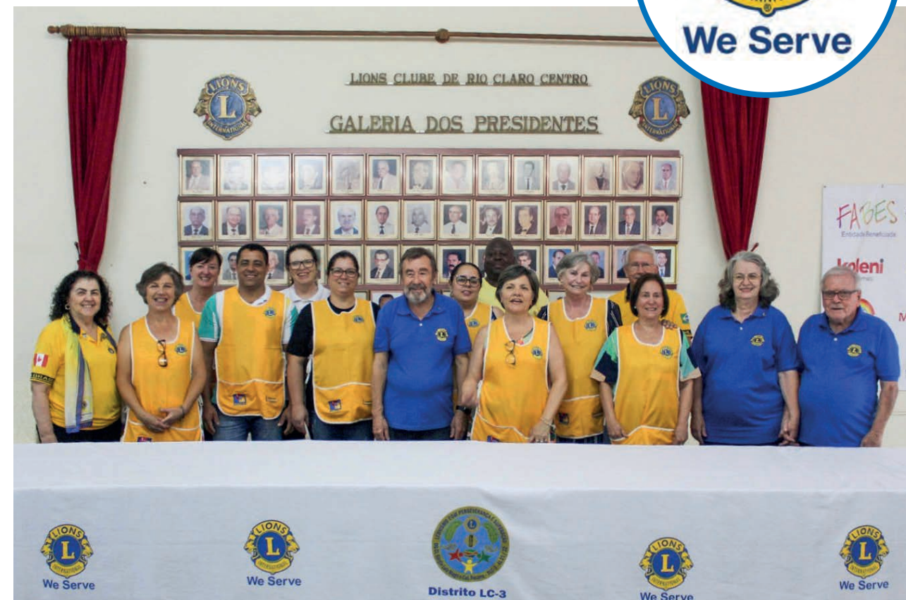
As Domadoras e equipe do Lions Clube Rio Claro Centro